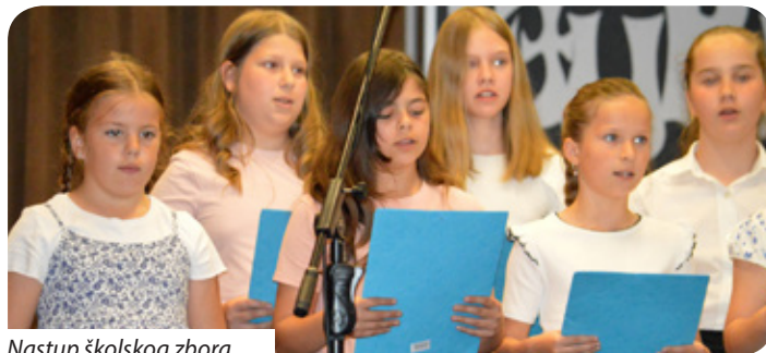
Nastup školskog zbora

Poseban dio programa bio je posvećen pokojnoj dugogodišnjoj voditeljici zbora, prije pet godina preminuloj Jolán Kocsis. Dugogodišnja voditeljica zbora i učiteljica ostavila je velik trag u radu zbora i glazbenom životu mjesta. Istaknuto je kako je upravo zahvaljujući njezinu radu mnogo