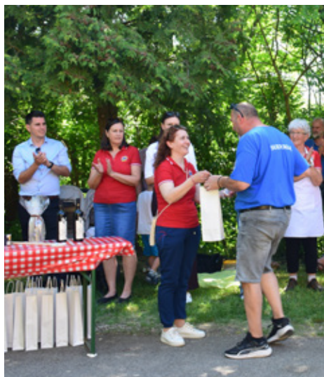
Druženje u Katolju