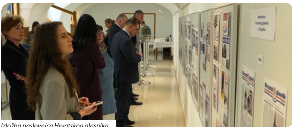
Izložba naslovnica Hrvatskog glasnika