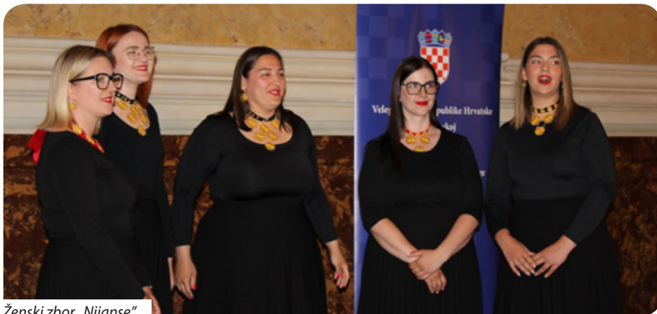
Ženski zbor „Nijanse“

Velikom broju okupljenih, među kojima su bili i generalni konzul RH u Pečuhu Drago Horvat te počasni konzul Republike Hrvatske u Velikoj Kaniži dr. Atila Kos, najprije se obratio veleposlanik RH u Mađarskoj Mladen Andrić. On je u svojem govoru naglasio: „To je vrlo poseban dan za Hrvatsku i njezin narod, koji nas podsjeća na 30. svibnja 1990. i prve demokratske izbore. Dozvolite mi da s ponosom istaknem kako je današnja Hrvatska članica NATO-a, EU, Schengena i eurozone, a trenutačno predsjedava Skupinom EU-MED 9 te Inicijativom Triju mora. Naš je sljedeći vanjskopolitički