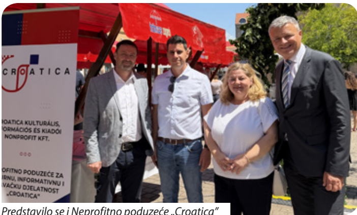
Predstavilo se i Nefitno poduzeće „Croatica“

Predstavljaju se običaji, umjetnosti i vrijednosti koje Hrvati izvan Republike Hrvatske stoljećima njeguju i prenose. Posebna pozornost posvećena je sadržajima kojima se na dostojanstven i prepoznatljiv način prikazuje kulturna raznolikost, pripadnost i povezanost hrvatskoga naroda.