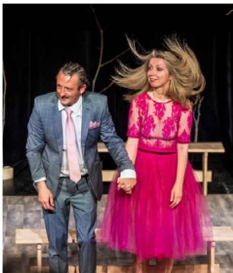
„Čušpajz od kanarinaca“