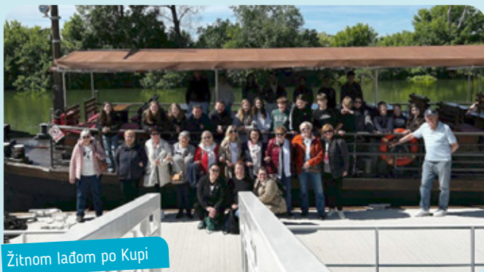
Žitnom lađom po Kupu

Szentpéterfa ili Petrovo Selo najjužnije je gradišćansko-hrvatsko selo u zapadnoj Mađarskoj. Naziv sela posvećen je apostolu svetom Petru, kojem je posvećena i mjesna crkva. U selu žive gradišćanski Hrvati koji su, bježeći pred Turcima u 15. i 16. stoljeću, potražili sigurno utočište izvan granica naše domovine. Ondje su utemeljili zajednicu koja svih ovih godina uporno čuva hrvatski jezik i tradiciju od zaborava. Vodeću ulogu u očuvanju hrvatske kulture ima Hrvatsko-mađarska narodnosna osnovna škola čije smo učenike i profesore ugostili u povodu četrdesete obljetnice prijateljstva! Naime, prijateljstvo između naših osnovnih škola obilježava četrdesetu obljetnicu, što znači da je prva razmjena učenika počela davne 1986. godine.