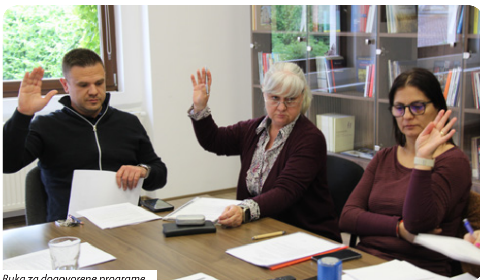
Ruka za dogovorene programe

Nakon kraće rasprave skupština je jednoglasno usvojila odluku o rebalansu proračuna za 2026. godinu. Budući da je