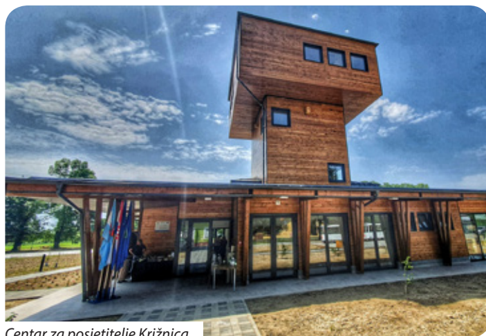
Centar za posjetitelje Križnica

Projekt obuhvaća i izradu ključnih strateških dokumenata među kojima su zajednička turistička strategija, prometni elaborat te stručna studija za trasiranje međunarodne biciklističke rute