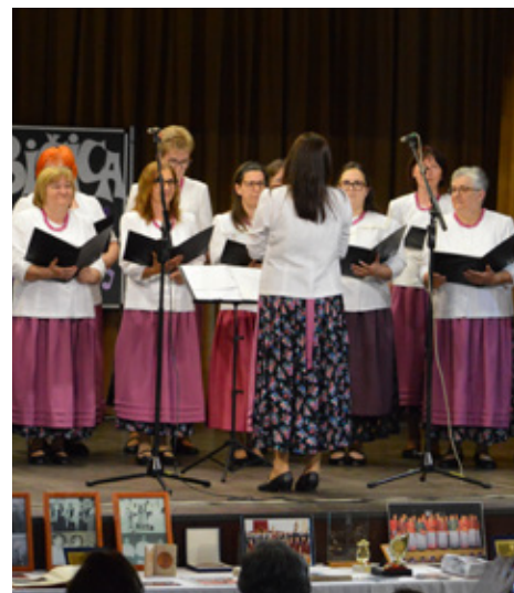
40. obljetnica Ženskog zbora „Ljubičica“