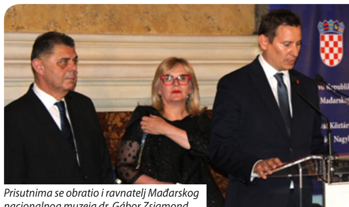
Prisutnima se obratio i ravnatelj Mađarskog nacionalnog muzeja dr. Gábor Zsigmond

cilj postati, nadamo se uskoro, članicom OECD-a. U ime hrvatske vlade izražavam nadu u nastavak i poboljšanje suradnje između Hrvatske i Mađarske temeljene na uzajamno korisnom partnerstvu te na poštovanju i zajedničkim interesima. Naša suradnja, od energetike do kulture i turizma, ali i zajedničke borbe protiv ilegalnih migracija i organiziranog kriminala te obrane, posebno putem Multinacionalnog zapovjednog središta NATO-a sa sjedi-