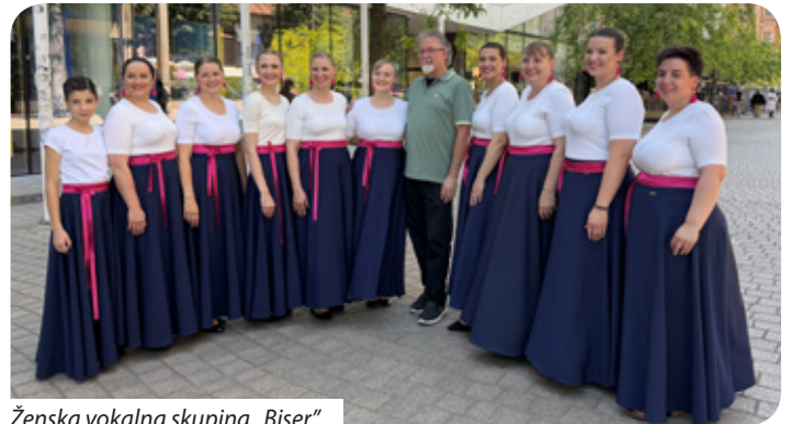
Ženska vokalna skupina „Biser“