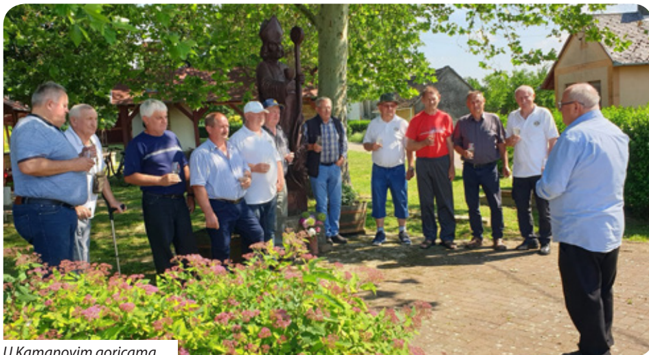
U Kamanovim goricama