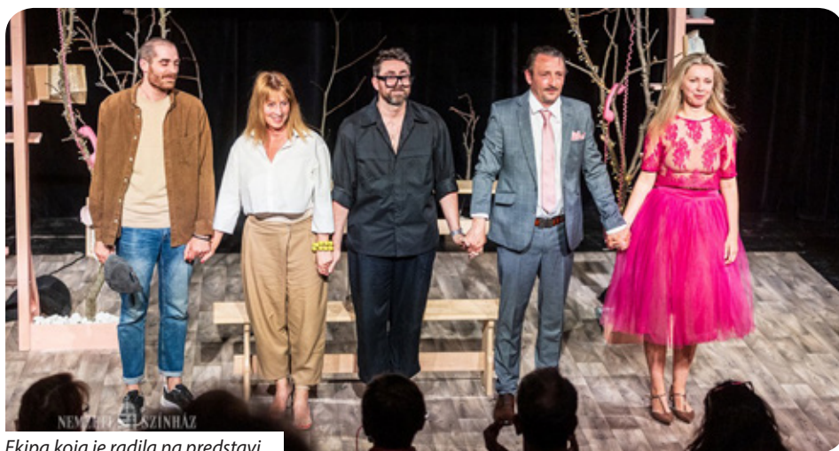
Ekipa koja je radila na predstavi

ničku dramsku predstavu. O glumici vrijedi napomenuti da izvrsno govori mađarski i već gotovo dva desetljeća živi u Budimpešti, a formacija koju je osnovala uglavnom je dosad stvarala predstave na engleskom jeziku, no u osnovi je multikulturne prirode. Predstava na zabavan način govori o svakodnevicu i o svima važnom putu partnerskih odnosa, o mogućim putevima i izborima."