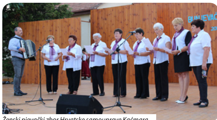
Ženski pjevački zbor Hrvatske samouprave Kačmara

Pod okriljem Hrvatske samouprave djeluje i Ženski pjevački zbor, a kako nam je