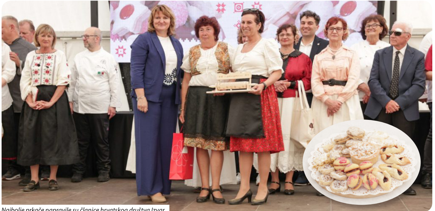
Najbolje prkače napravile su članice hrvatskog društva Izvar

U Virju su se od 8. do 10. svibnja odvijali programi poznate Prkačijade, natjecanja u pečenju kolača, ali i likovna kolonija, slatka potraga za skrivenim prkačima te popodnevni nastup tamburaša iz Ledina banda i večernji nastup tamburaša Danguba benda. A sve to uz sadržajnu ugostiteljsku ponudu.