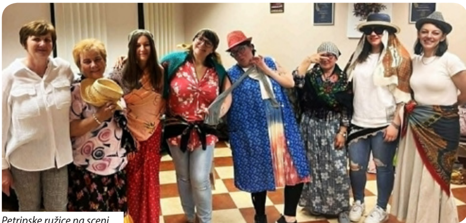
Petripske ružice na sceni

Bez hrvatskih kulturnih udruga u Pomurju bi bilo mnogo teže očuvati pomursku popevku i kajkavsko narječje. U svakom pomurskom hrvatskom naselju djeluje pjevački zbor, a u nekima i plesna skupina ili glazbeni sastav čiji članovi ne daju da bogata pomurska glazbena kultura izbljedi. Prije nekoliko godina pokrenuta je Smotra pomurskih kulturnih udruga „Veselo, veselo...”, koja nosi naslov upravo jedne pomurske popevke u želji da se hrvatske pomurske udruge druže i da u opuštajućem ugođaju izvode hrvatske točke na veselje svih sudionika. Za organizaciju ovogodišnje smotre bio je zadužen Pjevački zbor „Petripske ružice” i 24. travnja u Petribi su se okupile kulturne udruge iz Letinje, Kerestura, Mlinaraca, Pustare, Sepetnika, Serdahela, Sumartona i Petribe kako bi dan posvetile svojoj kajkavskoj pomurskoj kulturi.