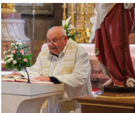
„K tebi se utječemo, dobra Majko“