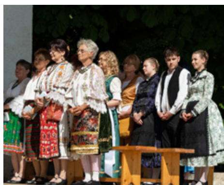
Pješačko hodočašće u Đud