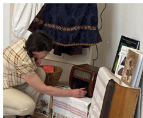
U kozarskom vrtiću