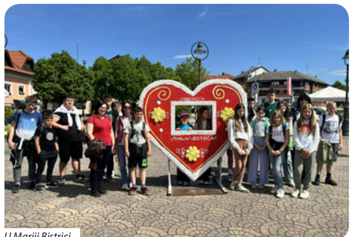
U Mariji Bistrici