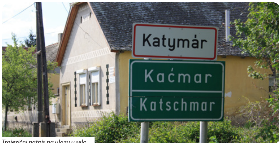
Trojezični natpis na ulazu u selo

Svake godine predaju i prijave na više natječaja Fonda „Gábor Bethlen“, dvije ili tri, ali redovito osvajaju potporu samo na jednom. Tako su i ove godine dobili potporu samo za Bunjevački dan. Jako je ogorčena jer su zbog nedostatka sredstava odbili natječaj za program obilježavanja 20. godišnjice obnove kapelice na kačmarskoj Vodici planiran u listopadu. Nažalost, neće moći održati veću priredbu i smatra da ne vrijedi ulagati toliko truda kad se on ne nagrađuje.