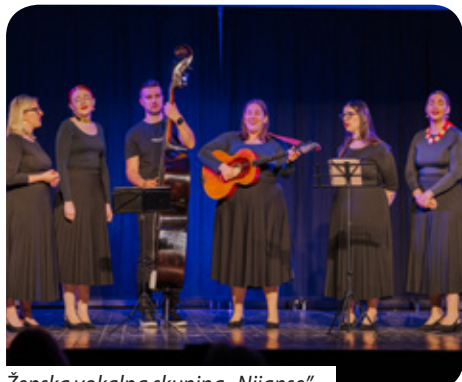
Ženska vokalna skupina „Nijanse”

Ženska vokalna skupina „Nijanse” iz Koljnofa 8. svibnja održala je koncert u domu kulture u srcu Poljica – u Gatima. Ženska vokalna skupina „Nijanse” osnovana je u kolovozu 2024. godine kao sekcija Folklorne grupe „Koljnof” radi očuvanja hrvatske pjesme, riječi i običaja. U svojem glazbenom repertoaru imaju niz raznih gradišćanskih, ali i hrvatskih crkvenih, svjetovnih, klapskih, modernih te folklornih skladbi. Koncert je održan u sklopu programa Dani Hrvata iz Mađarske u Splitsko-dalmatinskoj županiji. „Nijanse” su održale koncert klapske moderne i folklorne skladbe. Unatoč kratkom djelovanju skupina je već prepoznata po visokoj kvaliteti izvedbe i posvećenosti očuvanju hrvatske riječi, pjesme i običaja izvan granica domovine. Njihov glazbeni repertoar odražava bogatstvo hrvatske baštine spajajući tradiciju i suvremenost. Posjetitelji su mogli uživati u specifičnim gradišćanskim narodnim napjevima, hrvatskim crkvenim i svjetovnim skladbama, suvremenim vokalnim obradama i klapskoj pjesmi.