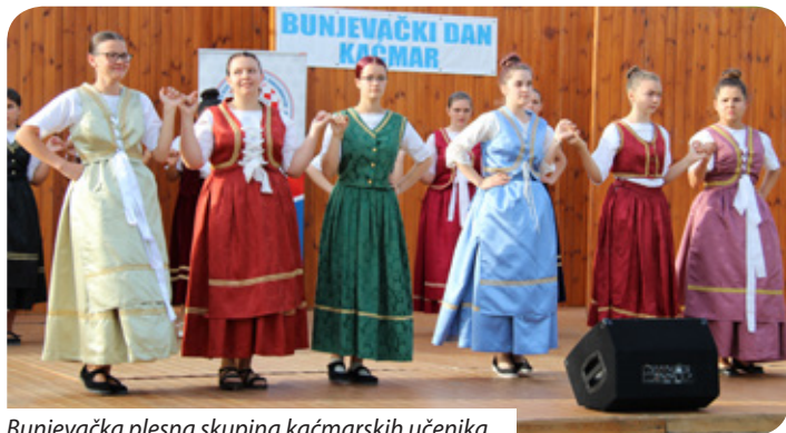
Bunjevačka plesna skupina kačmarskih učenika

kazala predsjednica Teza Balažić, već imaju više poziva – na skupštinu umirovljenika u Velikoj, ali se taj termin podudara s planiranim putovanjem uz petodnevni izlet u Selce u Hrvatsku (iako to nije hrvatski program jer se može prijaviti svatko iz Kačmara i okolnih naselja), zatim poziv na Antunovo u Baji, na Spomendan biskupa Ivana Antunovića u Kalači i susret hrvatskih pjevačkih zborova. Već više godina redovito sudjeluju i na priredbi Ikavica u prekograničnom naselju Stanišić u Srbiji na poziv Hrvatskog kulturnog društva i proslavi kolonizacije u studenom. U prosincu će pak sudjelovati na Susretu crkvenih zborova u Dušniku i