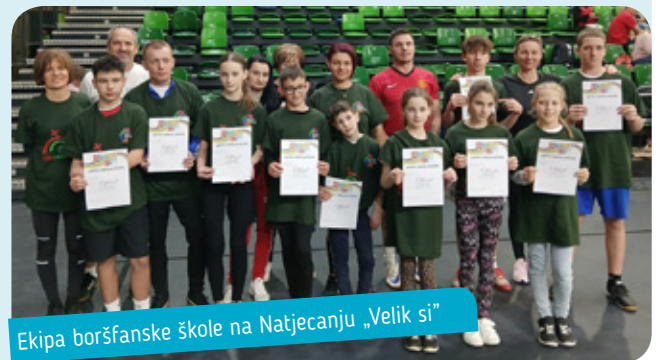
Ekipa boršfanske škole na Natjecanju „Velik si”

Učenici, roditelji te djelatnici Osnovne škole „István Fekete” u Boršfi sudjelovali su na poznatom Državnom natjecanju u vještinama „Velik si” koje organizira i prenosi Mađarska televizija TV2. Sportsko natjecanje održano u Budimpešti u Sportskoj dvorani „Levente Riz” bilo je ogroman doživljaj za boršfanske učenike. Budući da osnovna škola u Boršfi ima novu, modernu sportsku dvoranu, učenici su imali prave uvjete za uvježbavanje vještina penjanja, trčanja i drugih zadataka. Boršfanska ekipa na natjecanju se hrabro borila za dobre rezultate.