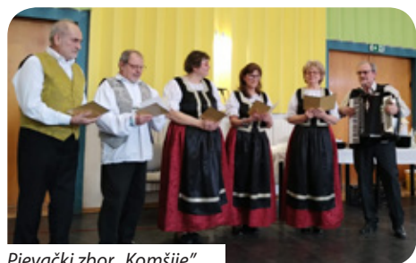
Pjevački zbor „Komšije”

Kako su istaknuli članovi Pjevačkog zbora „Komšije”, proteklih 15 godina nije samo broj – to je niz zajedničkih doživljaja, pjesama, nastupa, putovanja i prijateljstava. Tijekom godina sudjelovali su na brojnim susretima u naseljima uz Dunav, gdje su, uz predstavljanje svojega programa, učvrstili veze s lokalnim zajednicama koje njeguju