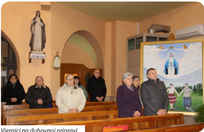
Vjernici na duhovnoj pripravi