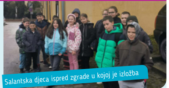
Salantska djeca ispred zgrade u kojoj je izložba

Salantska osnovna škola nudi razne aktivnosti za svoje polaznike. Za učenike 4. razreda organizirala je posjet na Lovačku izložbu u Šiklošu, gdje su učenici stekli mnoga znanja upoznavajući okoliš. Uz izložbu su naučili prepoznati divlje životinje i biljke koje se mogu naći u okolnim šumama. Naučili su kako treba paziti na prirodu odnosno što mogu učiniti za očuvanje prirodnog okoliša.