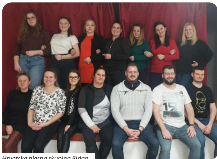
Hrvatska plesna skupina Birjan

Plesna skupina trenutačno broji 16 članova, od čega su tri muškarca i 13 žena. Probe se održavaju svake srijede u mjesnom domu kulture i traju dva sata. Članovi se marljivo pripremaju za nadolazeće nastupe, osobito za Poklade u Birjanu koje će se održati 14. veljače.