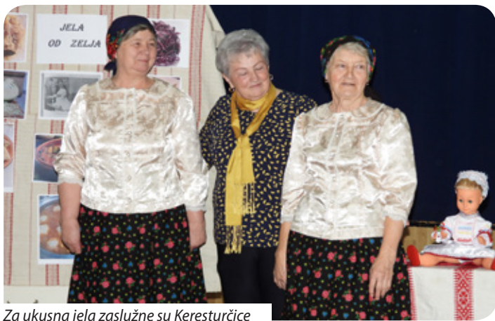
Za ukusna jela zaslužne su Keresturčice

jedno rezale zelje, a zatim bi po slojevima stavljale i solile, dodavale začine te gazile ili batom udarale da se sve dobro stisne, pričala je učiteljica. U Pomurju se kiselo zelje jelo i kao salata s bučnim uljem uz neka jela, a obvezno se kuhalo za svinjokolju sa svježim mesom. Od njega se pravila sarma, složenac, kuhalo se i s graham, što je bilo vrlo hranjivo. Od slatkog zelja uvijek se pravila gibanica za blagdanski stol, npr. na proštenje ili nedjeljom, pa i razna variva, zelje s tijestom i salata. Predavačica je ispričala i anegdotu o mladoj snahi koja nije znala kako se pere kiselo zelje. Od sudionika iz publike Stjepan Horvat ispričao je kajkavsku legendu kako je sjeme zelja dospjelo u naše krajeve, a Jožo Đuric anegdotu o smiješnim situacijama zbog nepoznavanja mađarskog jezika.