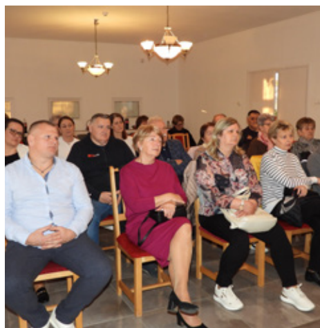
Tribina o narodnosnim parlamentarnim izborima 3. stranica