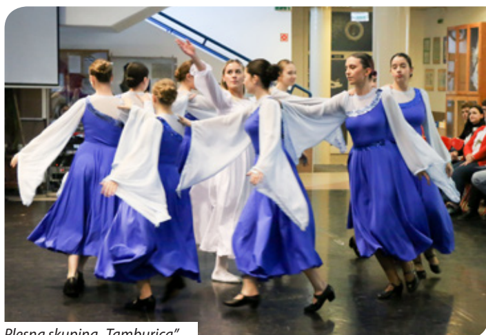
Plesna skupina „Tamburica“