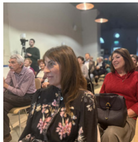
„Putevima naših predaka”