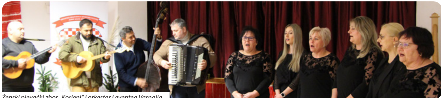
Ženski pjevački zbor „Korjeni“ i orkestar Leventea Varnaija

U organizaciji Neprofitnog poduzeća za kulturnu, informativnu i izdavačku djelatnost „Croatica“ i Hrvatskog kulturnog i sportskog centra „Josip Gujaš Džuretin“ 20. veljače u tom je centru u Martincima promoviran najnoviji godišnjak Hrvata u Mađarskoj – Hrvatski kalendar 2026.