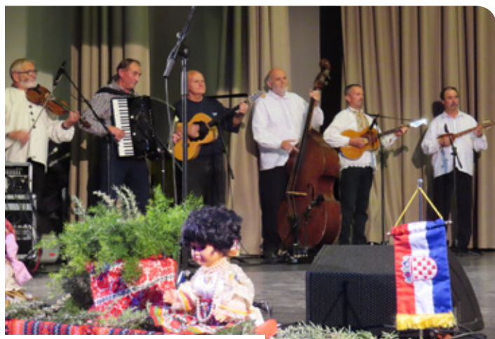
Orkestar KUD-a „Ladislav Matušek“