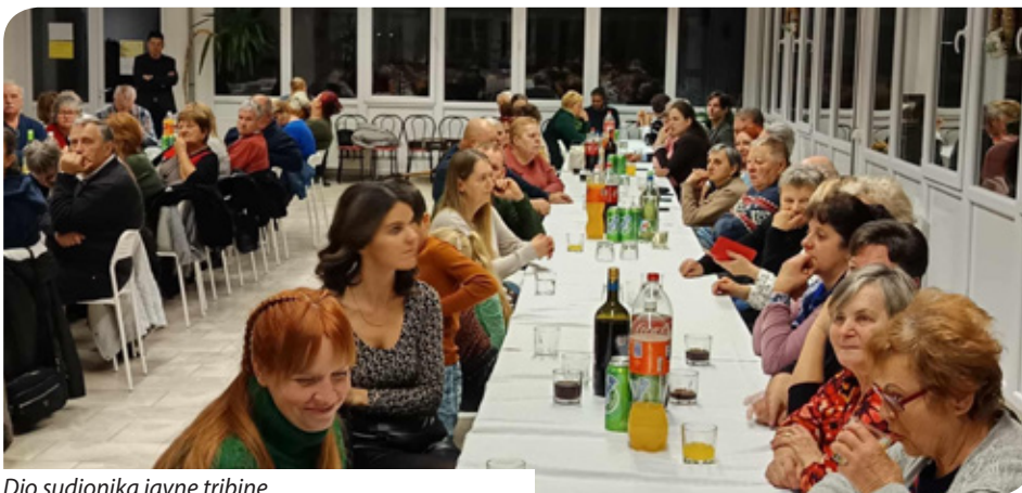
Dio sudionika javne tribine