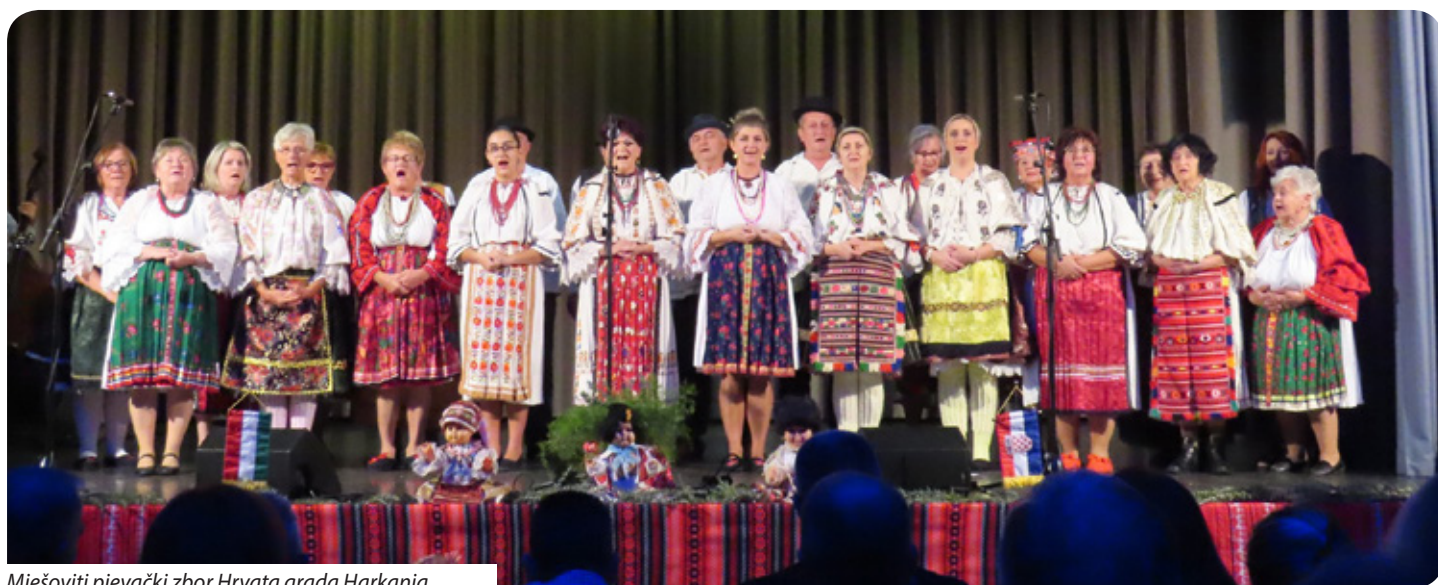
Mješoviti pjevački zbor Hrvata grada Harkanja