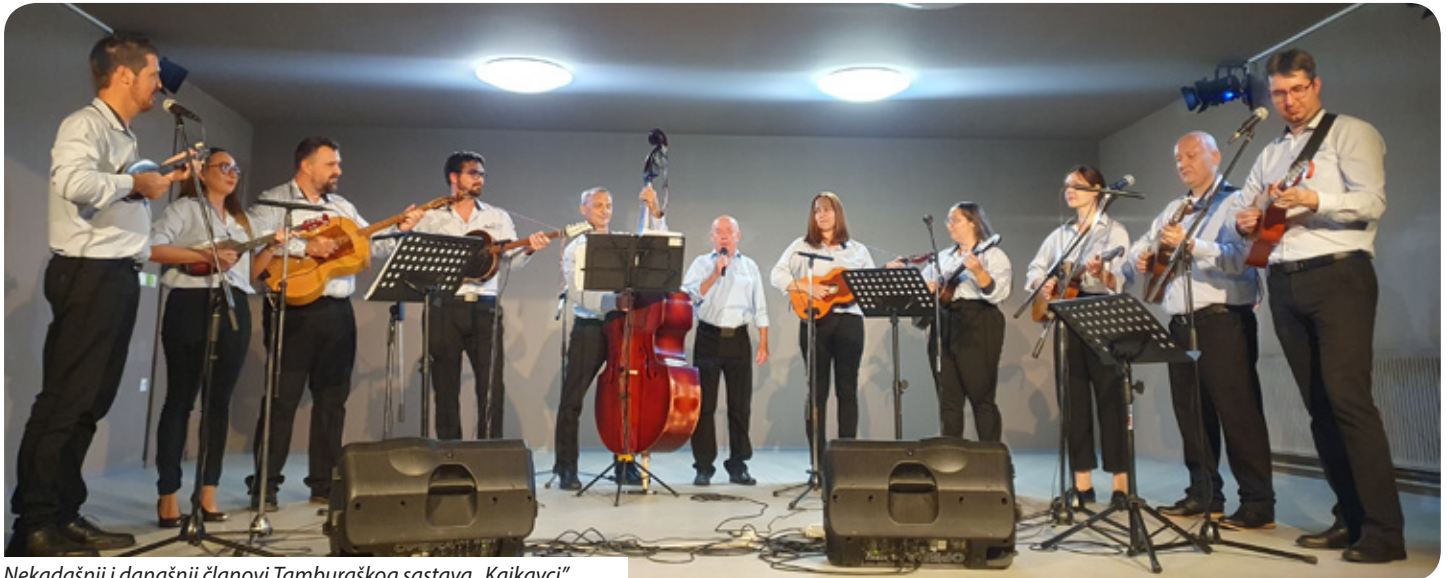
Nekadašnji i današnji članovi Tamburaškog sastava „Kajkavci“