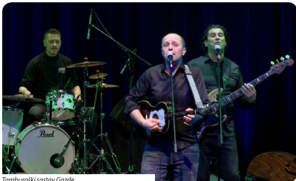
Tamburaški sastav Gazde

Branka Pavić Blažetin • Foto: A. Hatházi-Müller