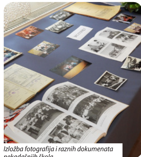
Izložba fotografija i raznih dokumenata nekadašnjih škola

ti društvenu igru o kulturi pomurskih Hrvata, razglednicu o hrvatskim naseljima, pano o pjesnicima i piscima Hrvata u Mađarskoj ili ilustrirati pjesme nekog književnika, izraditi fotografije o zgradama koje imaju dugu povijest i usporediti ih s današnjim stanjem. Ove godine tema je bila „Tko je bio Stipan Blažetin?“. Natjecatelji su trebali naslikati pjesnika i učitelja u bilo kojoj tehnici. Ovaj