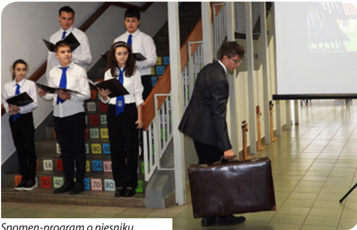
Spomen-program o pjesniku