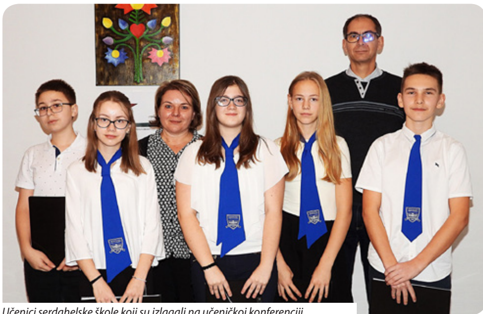
Učenici serdahelske škole koji su izlagali na učeničkoj konferenciji

U organizaciji Hrvatskog kulturno-prosvjetnog zavoda „Stipan Blažetin“ sedmi je put priređena učenička konferencija u cilju istraživanja prošlosti zavičaja. Tijekom godina učenici su se već pozabavili s poviješću hrvatskih naselja, vjerskim životom, osnovnim školama, dječjim vrtićima, kulturnim životom, pjesnicima, legendama i starim igrama, a ove godine prisjetili su se povijesti hrvatskih pomurskih škola koje više ne djeluju. Zadatak je bio istražiti kad su utemeljene škole na tom području, kako se učilo, tko su bili učitelji i slično. Nije bilo lako. Naime, mnogi dokumenti više ne postoje. Učenici su potražili umirovljene učitelje i razgovarali s njima te su neke podatke pronašli u knjigama.