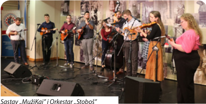
Sastav „MužiKaj“ i Orkestar „Stoboš“