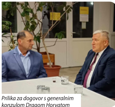
Prilika za dogovor s generalnim konzulom Dragom Horvatom

Samouprava je 2024. godinu započela s ostatkom od 531 006 Ft iz 2023. godine. Iz državnog proračuna dobila je potporu za djelovanje od 1 040 000 Ft te potporu za dodatne zadatke u iznosu od 1 676 310 Ft. Grad Barča iz svojega proračuna podupirao je samoupravu s 250 000 Ft. Uz rečeno samouprava je ostvarila i prihod od regionalnog hrvatskog bala. Samouprava je uspješno podnijela prijavu natječaja nadležnom državnom tajništvu za potporu narodnosnim investicijama. Dobila je potporu u iznosu od 4 000 000 Ft za provedbu zamjene vanjske stolarije na barčanskoj rimokatoličkoj crkvi. Samouprava je podupirala rad Zajedničkog