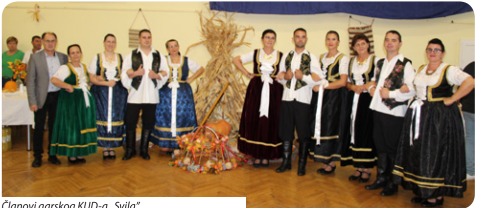
Članovi garskog KUD-a „Svila”

Zbog kišnog nevremena izostala je berbena povorka sudionika te je svečanost započela u mjesnom domu kulture. Sudionike, goste i uzvanike, među njima posebno veleposlanika RH u Mađarskoj Mladena Andrića, srdačno je pozdravio voditelj tradicionalne berbene svečanosti. „Kad god u stara vremena u selu je najpopularniji jesenski bal bio berbeni bal. Prija su to držali Bunjevci i Švabi. Svako je to držo u svojoj mijani i svako po svojim adetima. Momci i divojke već su prija bala udesili ko će biti mali birov, bo-