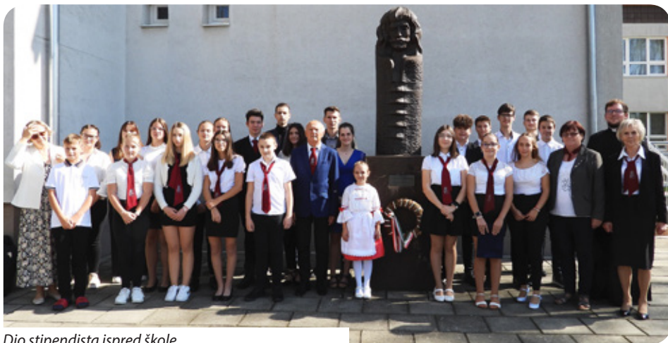
Dio stipendista ispred škole

„Mislim da sam dobro srce naslijedio od svojeg oca. Volim obradovati ljude, zadovoljstvo mi je kad vidim da se raduju, pogotovo kad vidim djecu i mlade. Svoje selo jako volim, tu sam išao u školu, počeo sam 1950. godine. To su bila poslijeratna vremena, pet godina nakon rata, bilo je veliko siromaštvo. Nismo imali što obući, bosih nogu hodali smo u školu, torbi nije bilo, knjige nismo imali. Poslije škole trebali smo raditi. Tad nisu pitali kako je bilo u školi, nego gdje si tako dugo bio, treba ići raditi. Uvijek se rado sjećam svoje škole u Keresturu, odakle smo krenuli. To nikad ne smijemo zaboraviti. A drugo što je važno, to je obrazovanje. Ono što naučimo, ono znanje koje steknemo, to neće služiti samo nama nego cijeloj našoj zajednici. Zbog toga sam želio dati nešto što je važno s više gledišta i tako