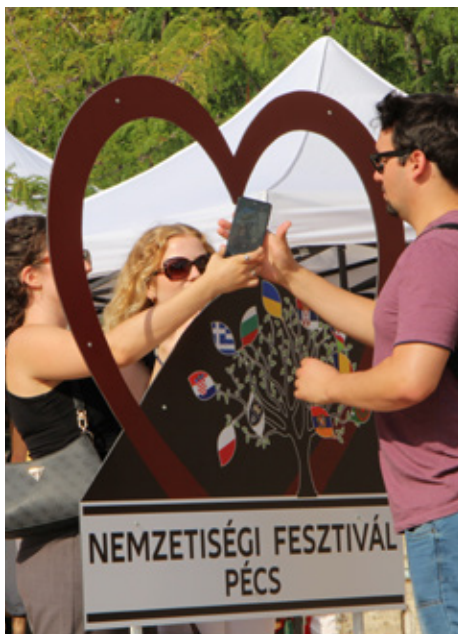
Narodnosni festival u Pécsu