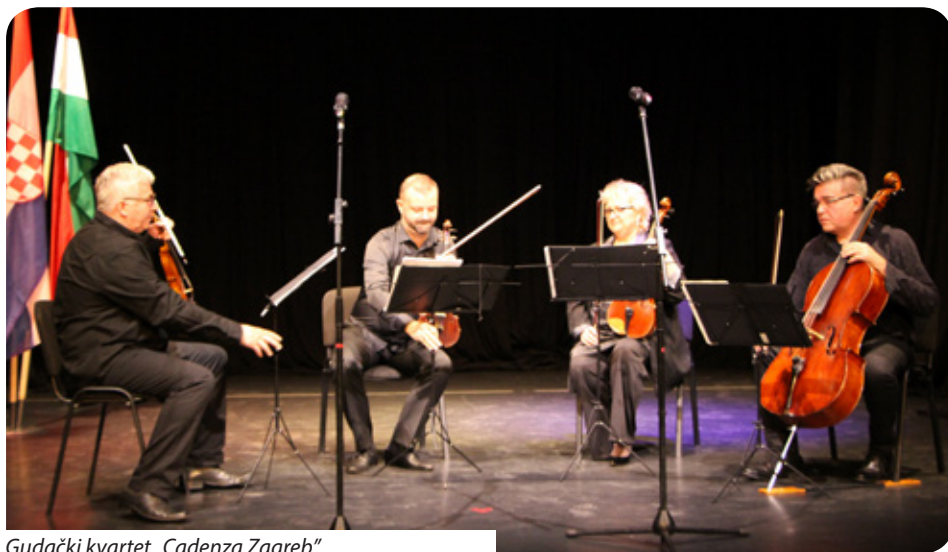
Gudački kvartet „Cadenza Zagreb“

U Republici Hrvatskoj 8. listopada obilježava se Dan Hrvatskoga sabora u sjećanje na dan kad je Sabor Republike Hrvatske 1991. godine jednoglasno donio Odluku o raskidu svih državnopravnih veza Republike Hrvatske s bivšom državom SFRJ. Taj dan prigodnim programom obilježavaju i diplomatsko-konzularna predstavništva Republike Hrvatske u svijetu.