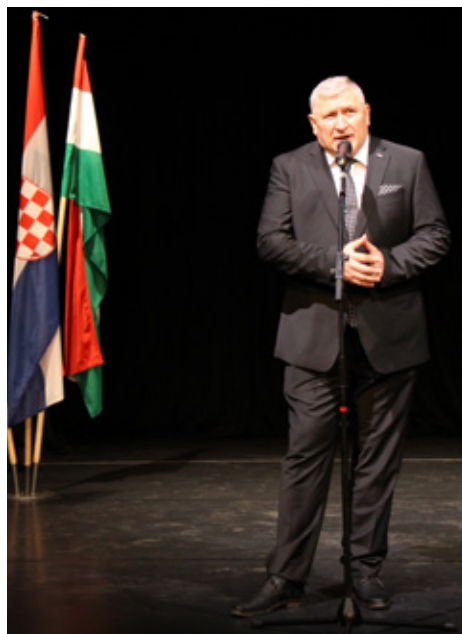
Dan Hrvatskog sabora