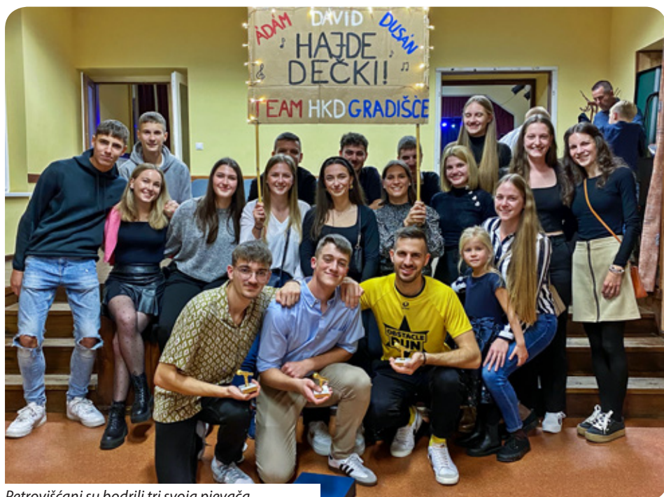
Petrovišćani su bodrili tri svoja pjevača