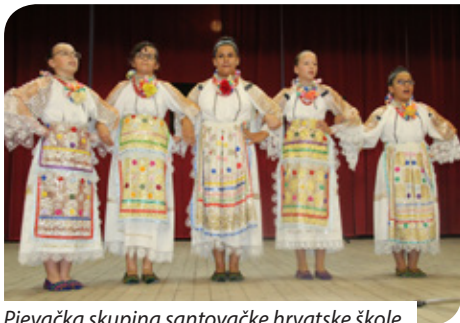
Pjevačka skupina santovačke hrvatske škole

rov i subaše. Birov je izabro ko će da bude borovinca, a i drugi momci su izabrali svoje parove.” Tim uvodnim riječima prisjetio se nekadašnjeg običaja garskih Bunjevaca u ulozu malog birova.