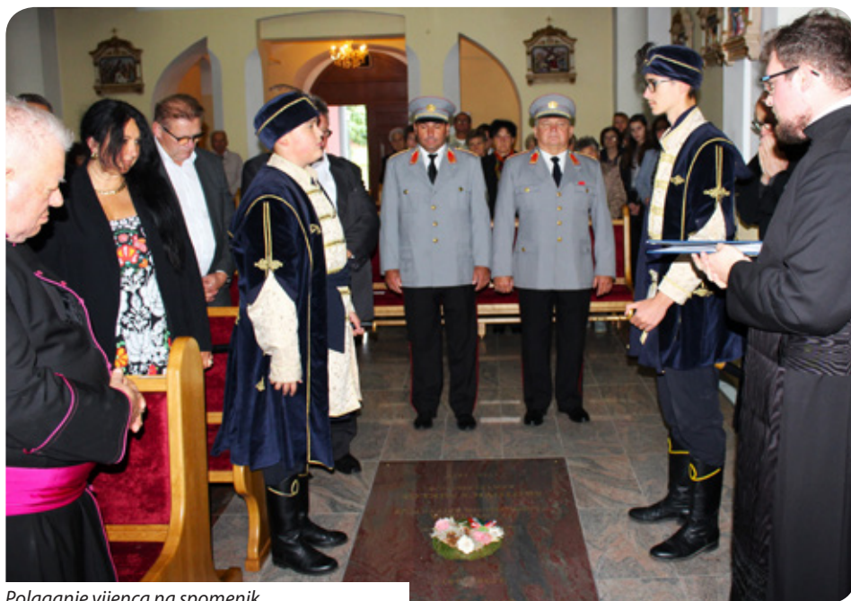
Polaganje vijenca na spomenik