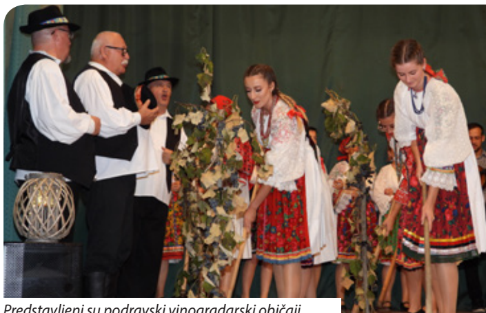
Predstavljeni su podravski vinogradarski običaji