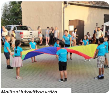
Mališani lukoviškog vrtića