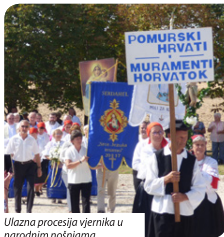
Ulazna procesija vjernika u narodnim nošnjama

pjevanje koje je predvodio crkveni zbor santovačkih Hrvata pod vodstvom i u pratnji župnoga kantora Zsolta Siroka. Pjevale su se crkvene pjesme prema pjesmarici i molitveniku „Pjevajte Gospodinu” s redom svete mise i crkvenim pjesmama Hrvata u Mađarskoj kroz crkvenu godinu. Izdanje je to koje je sastavio mohački