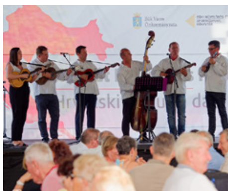
Hrvatski kulturni dan u Büku