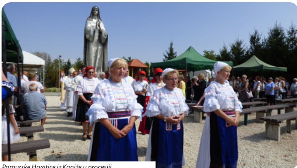
Pomurske Hrvatice iz Kaniže u procesiji

majčinska ljubav, zato nam ju je dao kao zagovornicu, tješiteljicu u svim našim zemaljskim nevoljama.