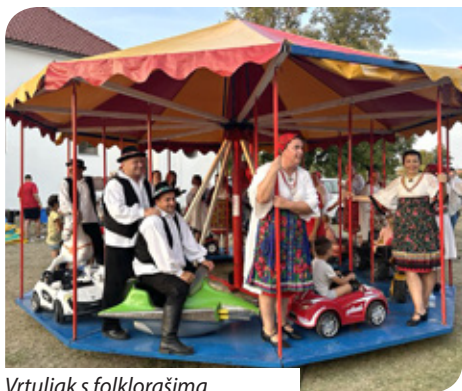
Vrtuljak s folklorasima