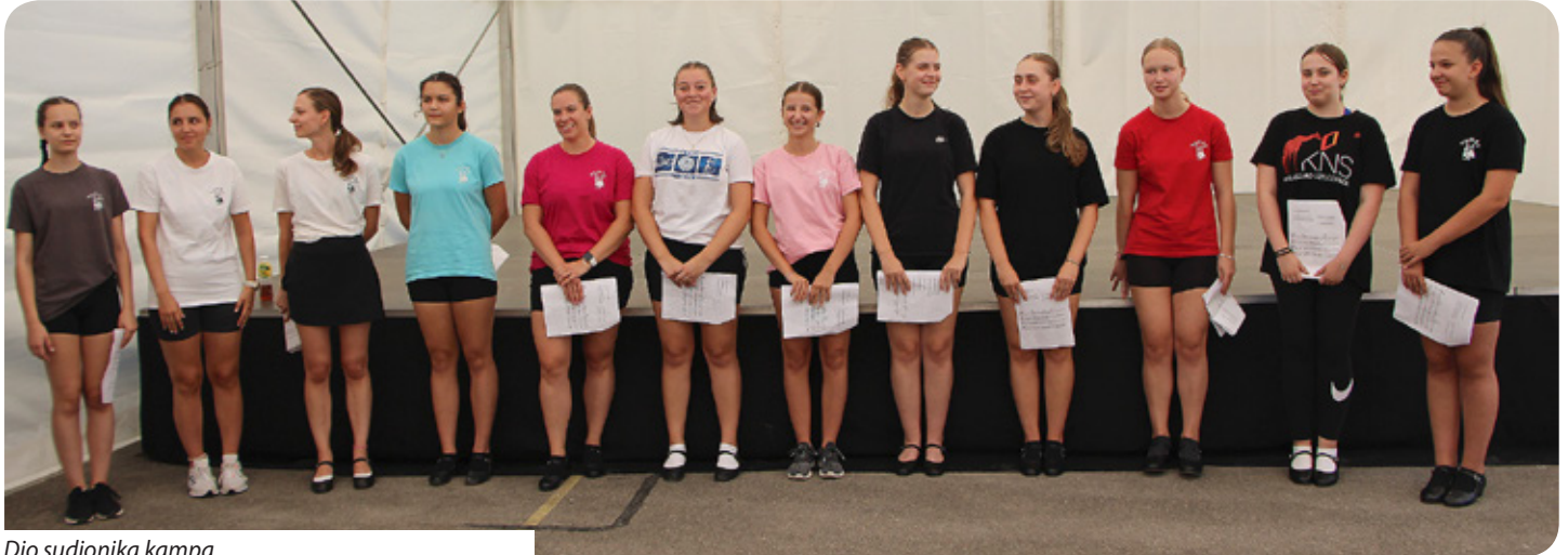
Dio sudionika kampa

U Kukinju je ove godine održan trodnevni kamp KUD-a „Tanac“ koji je prethodio XXX. Bošnjačkom sijelu, na kojem su polaznici kampa i članovi KUD-a izveli jednu od svojih najuspješnijih koreografija: Bošnjački kermez.