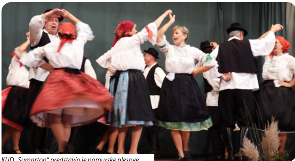
KUD „Sumarton“ predstavio je pomurske plesove

„Šesnaesti put organizira se kulturna turneja. Vrlo su nam dobra iskustva, svagdje je vrlo dobro primljena priredba, a domaćini se posebno pobrinu da se gostujuća grupa dobro osjeća kod njih. Naravno, cilj je da po-