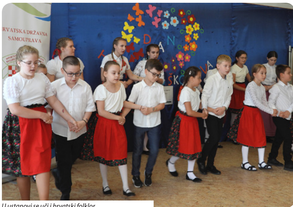
U ustanovi se uči i hrvatski folklor

Naši predci čuvali su svoj materinski jezik i kulturu stoljećima, pa to ne smijemo ni mi zapustiti", rekla je ravnateljica te dodala da u ustanovi vlada obiteljska atmosfera.