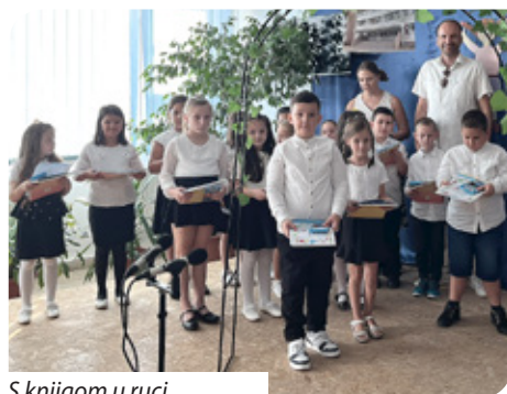
S knjigom u ruci

prostorijama započeo djelovati hrvatski dječji vrtić. Od početaka, tj. od 2016. godine, djelovao je kao podružnica Hrvatskog vrtića, osnovne škole, gimnazije i učeničkoga doma Miroslava Krležu u Pečuhu. Ravnatelj te ustanove bio je Gábor Győrvári, koji je vrlo mnogo pomagao u ostvarenju ustanove. Početne napore potvrdili su i upisi djece u novu ustanovu – iz godine u godine više se djece upisivalo u dječji vrtić te je zatim pokrenut prvi razred osnovne škole i tako zaredom stasali razredi. Grad je nadalje bio