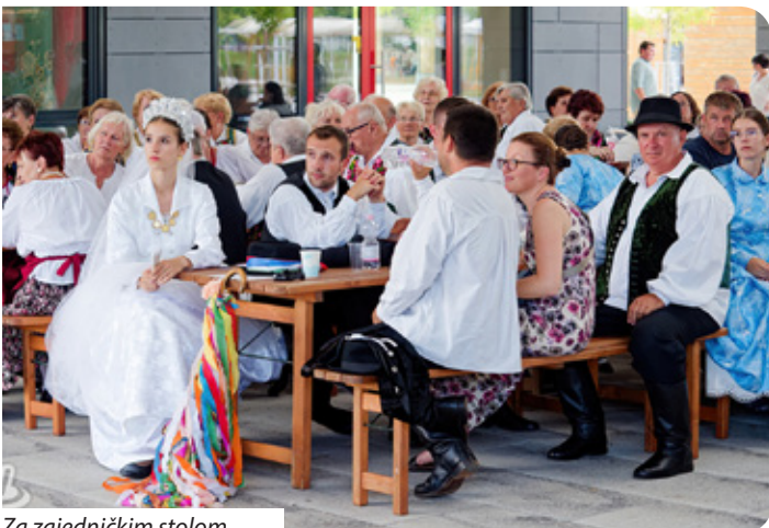
Za zajedničkim stolom

Nakon svete mise sudionici dana uputili su se u glazbenom mimohodu od kapelice do Trga Termál.