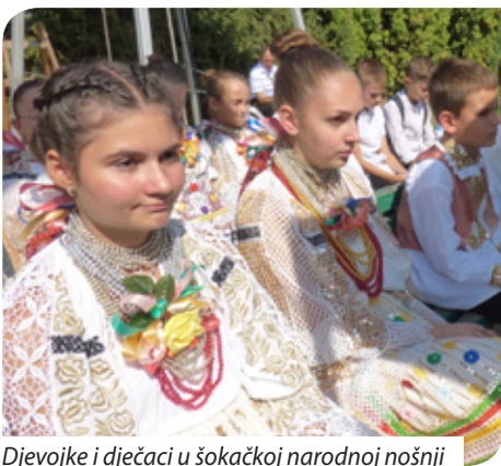
Djevojke i dječaci u šokačkoj narodnoj nošnji