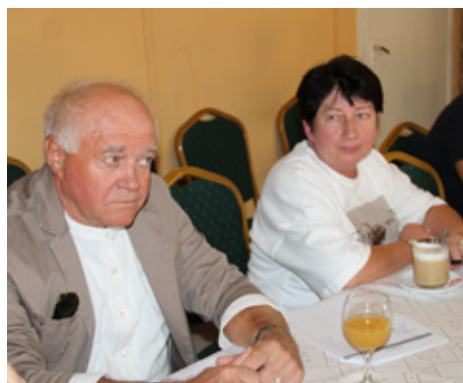
Sjednica Hrvatske samouprave Bačko-kiškunske županije