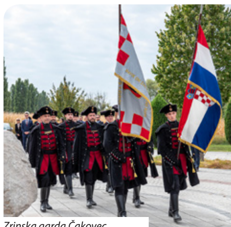
Zrinska garda Čakovec