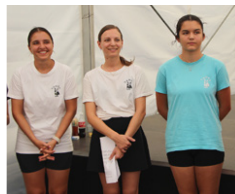
Ljetni kamp KUD-a „Tanac“