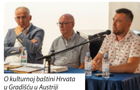
O kulturnoj baštini Hrvata u Gradišću u Austriji

Prisutnima je prikazan kratki film u kojem se govori o Antunu Gustavu Matošu i Josipu Jurju Strossmayeru. Retrospektivu