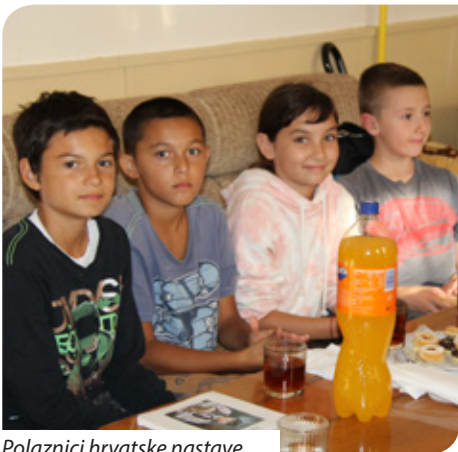
Polaznici hrvatske nastave