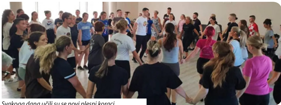
Svakoga dana učili su se novi plesni koraci

Folklor nije samo glazba, ples i pjevanje. To je i druženje. Mi smo se povezale, sprijateljile se s drugim Hrvatima koji žive izvan RH... Tako folklor funkcionira.