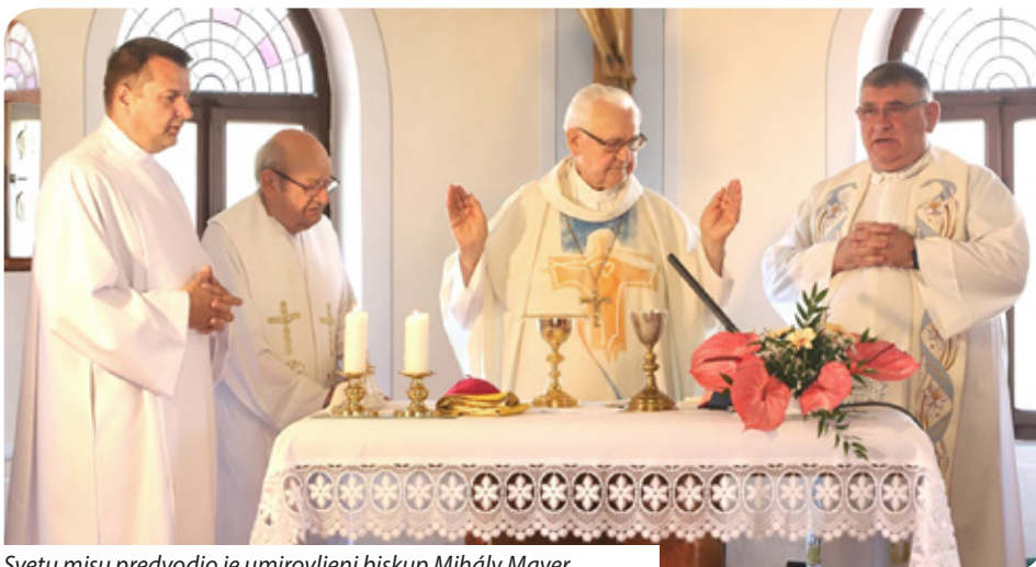
Svetu misu predvodio je umirovljeni biskup Mihály Mayer

Kukinjčani su od pamtivijeka za velike blagdane, nedjeljne mise, krštenja i vjenčanja išli u crkvu u obližnjem Keszüu. Imali su oltar u nekadašnjoj školskoj zgradi koji se otvarao dok se služila sveta misa kad bi došao župnik iz Keszüa, a za lijepog vremena u kapelici Svetog Križa, koju su također održavali i obnavljali vjernici Kukinja. Društvenim promjenama počela je euforija gradnje crkvenih zdanja u naseljima u kojima ih do-