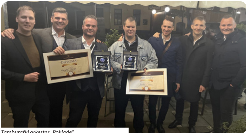
Tamburaški orkestar „Poklade“

Na natjecanju tamburaških sastava sudjelovao je i Tamburaški orkestar „Poklade“, koji je osnovan 2010. godine u Mohaču. Za taj orkestar organizatori su rekli kako „donosi spoj šokačko-hrvatske muzike i balkanskih motiva, oblikovanih s jedinstvenim stilom i energijom. Njihov repertoar obuhvaća sve, od kavanske muzike do velikih festivalskih koncerata. Tokom svojih 15 godina postojanja gostovali su širom Mađarske, Balkana i Europe, neprestano obogaćujući svoj zvuk i stil“.