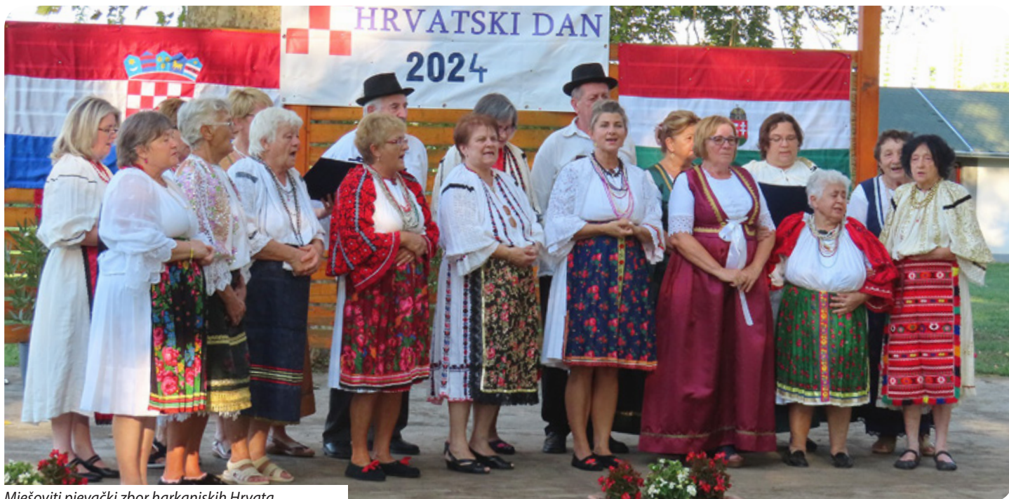
Mješoviti pjevački zbor harkanjskih Hrvata