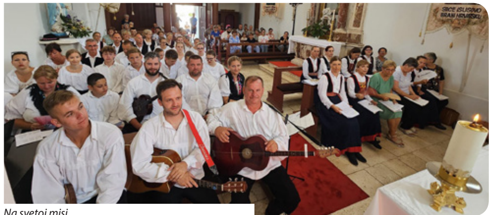
Na svetoj misi

Na 21. Međunarodnoj smotri folkloru u or-ganizaciji KUD-a „Bokolje“, Općine Pašman i Turističke zajednice Pašman ove godine pjesmom i plesom brojnu publiku oduševi-lo je 13 kulturno-umjetničkih društava: To-vareča mužika „Pulići“ iz Sala, KUU „Kunjka“ iz Tkona, KUD „Nevijana“ iz Neviđana, KUD „Martijanec“ iz Općine Martijanec, udruga Điran iz Ugljana, KUD „Sidraga“ iz Tinja, Hr-vatsko kulturno društvo „Čakavci“ i „Židan-ske zvjezdice“ iz Hrvatskog Židana, KUD „Kukljica“ iz Kukljice, KUD „Sv. Ivan Krstitelj“ iz Gorice, KUD „Skuti materini“ iz Vrgade, KUD „Krenica“ iz Gale, KUD „Kolo“ iz Starog Grabovca.