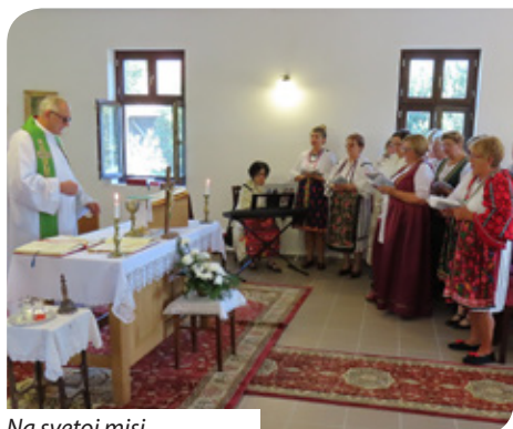
Na svetoj misi

Dombol (Kastélyosdombó) nije povijesno hrvatsko naselje, ali su u njemu uvijek živjeli i Hrvati barem u malom broju. To je naselje (danas s nešto manje od 300 ljudi) u južnom Šomođu na rijeci Dravi smješteno u područje iznimno bogato prirodnim vrednotama. Ondje djeluje Mađarska ekumenska organizacija, koja je ovdje pokrenula sveobuhvatni program regionalnog razvoja u sklopu kojeg je otvoren obnovljen dvorac i park, a započeta je i potpuna obnova samog središta naselja.