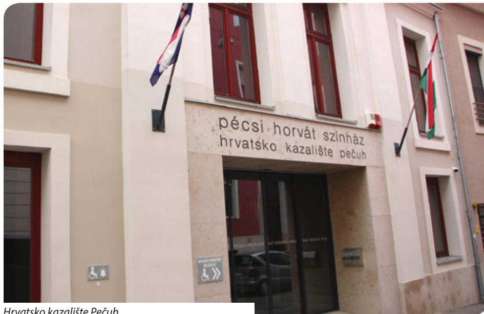
Hrvatsko kazalište Pečuh

Sljedeća premijera bit će u režiji Slavena Vidaković. Radit će se pučka komedija „Čaruga“ na tekst Ivana Kušana. Kako kazuje Vidaković, Hrvatsko kazalište prije 30 godina u koprodukciji s Varaždinskim kazalištem uprizorilo je Kušanov tekst. Nažalost, tad je ta predstava izvedena samo na Tekijama. Vidaković želi glumom, plesom i pjesmom ostvariti još jednu pučku uspješnicu na tragu dosadašnjih postavljenih na scenu Hrvatskog kazališta, koje doživljavaju velik broj izvedbi. Premijera se predviđa za prosinac.