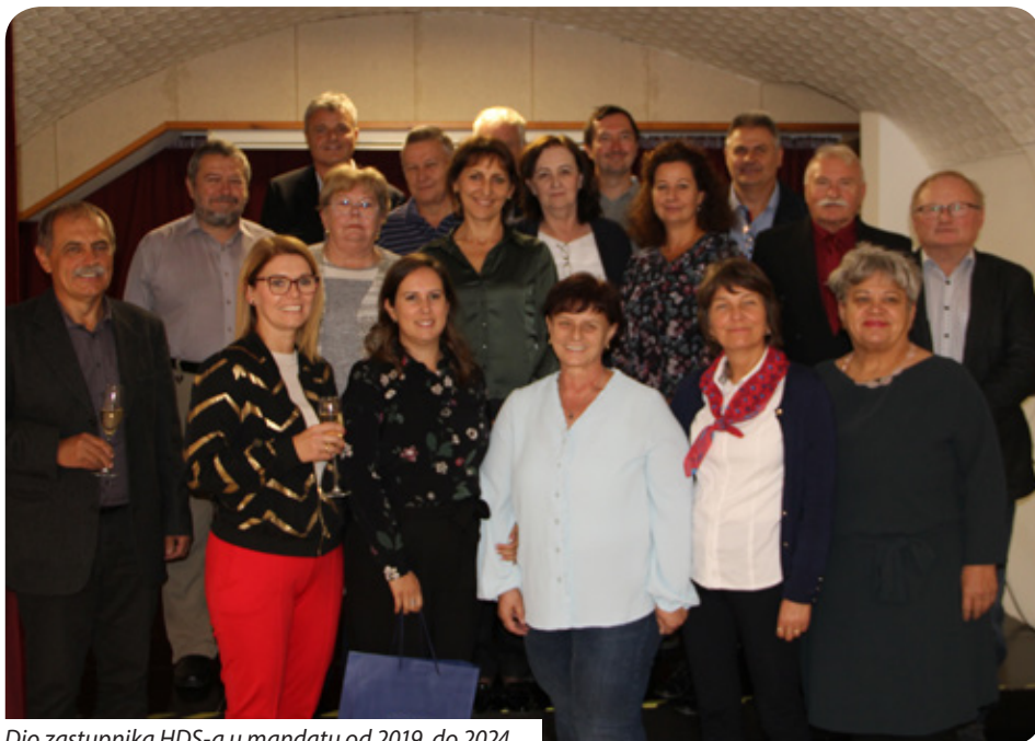
Dio zastupnika HDS-a u mandatu od 2019. do 2024.