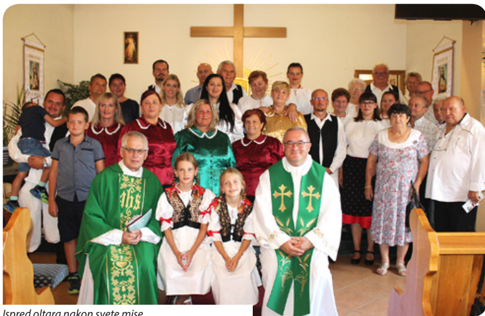
Ispred oltara nakon svete mise

Petriba je jedno od najmanjih hrvatskih pomurskih naselja. U naselju već gotovo pedeset godina nema hrvatskog obrazovanja. Stariji ljudi još govore kajkavski dijalekt koji su naučili od svojih roditelja, pa se najčešće okupljaju u zajednicu i pokušavaju organizirati hrvatski kulturni život u mjestu. Uglavnom su to članovi Pjevačkog zbora „Petripske ružice“ te članovi mjesne hrvatske samouprave na čelu s Jožom Kranicom. U posljednje vrijeme i skupina mlađih naraštaja zainteresirala se za hrvatsku kulturu, čak i za učenje hrvatskoga jezika. Uključili su se u zbor te pohađaju tečaj hrvatskog jezika. Iako im je hrvatski zapravo strani jezik, osjećaju ga svojim i žele ga usavršiti. Jedan je od tih mladih na posljednjim narodnosnim izborima postao i zastupnik. Gábor György pohađao