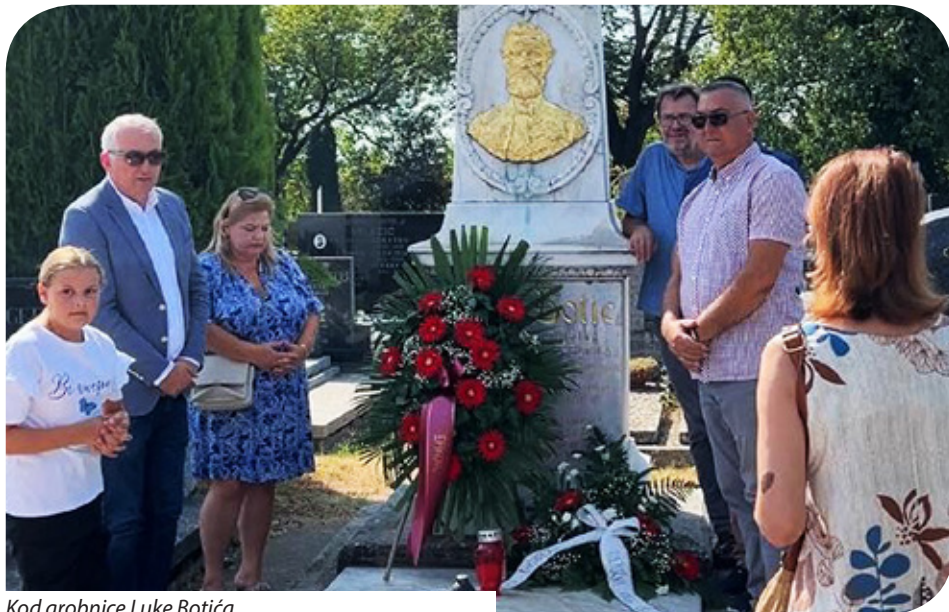
Kod grobnice Luke Botića

U sklopu 15. Dana Luke Botića, manifestacije koja već petnaest godina povezuje dalmatinske i slavonske književne krugove, održano je petnaestak različitih događanja koja su okupila književnike, povjesničare i ljubitelje kulture iz cijele Hrvatske, Vojvodine i Mađarske. Posljednji dan, 22. kolovoza, predstavljena su i nova izdanja Croatiace iz Budimpešte. Sudionici programa posjetili su i Agroturistički praktikum i vinograd Srednje strukovne škole Antuna Horvata u Trnavi.