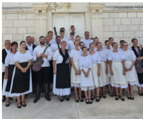
Židanci na Pašmanu