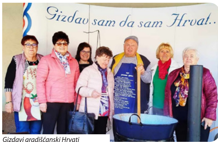
Gizdavi gradišćanski Hrvati

sebi putokaze, usmjeri svoje srce na utvrđeni put!”, kaže prorok Jeremija. Upravo je takav putokaz naš Dan narodnosti i vrijednosti. Prikazano je 1100 godina povijesnog sjećanja, graditeljske i duhovne baštine te prirodnih ljepota kako bi se obilježio naš put. Svatko je ponosan na svoju narodnost i ne čudi što svi to vide kao svoju najveću vrijednost. Jer, ako postoji nešto što nam daje snagu, na čemu možemo graditi, onda su to naši korijeni koji dolaze iz nas samih, iz drevnih tradicija i kultura u kojima smo rođeni. Ako smo Hrvati, budimo Hrvati. Ako smo Mađari, onda smo Mađari.”