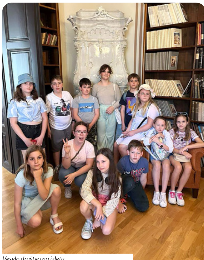
Veselo društvo na izletu

Branka Pavić Blažetin • Foto: Friderika Gregeš