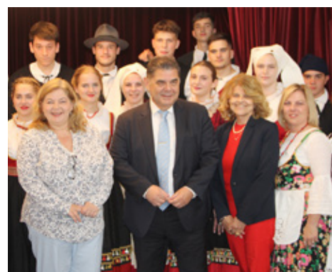
„Frankopan” u Croatici