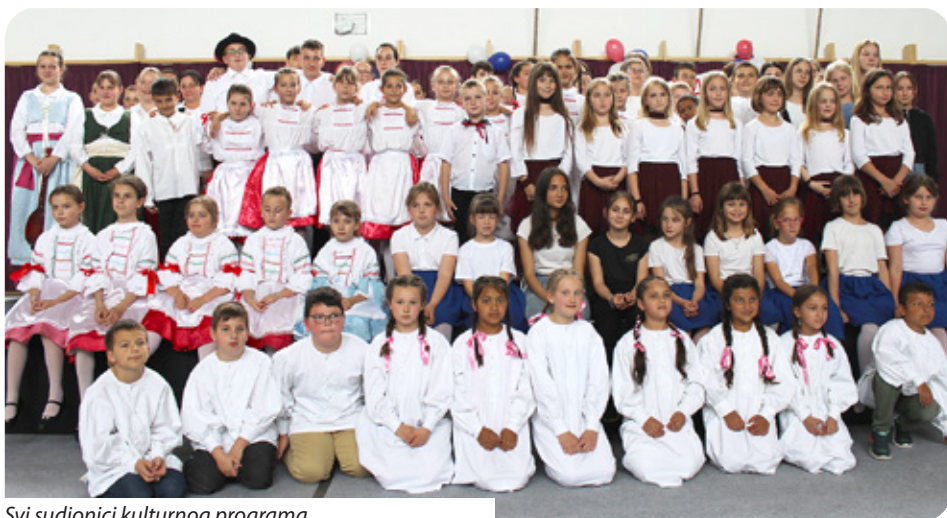
Svi sudionici kulturnog programa

Prije 16 godina boršfanska je ustanova uvela hrvatsku nastavu u svoj školski program. Iako u naselju ne stanuje velik broj pripadnika hrvatske narodnosti, vodstvo ustanove smatralo je da je učenje hrvatskoga jezika zbog blizine hrvatske granice važno. Danas 130 djece uči hrvatski jezik u okrilju škole koju pohađaju učenici iz raznih naselja: iz Bečehela, Baze (Bázakerettye), Banoka (Bánokszentgyörgy), Varfede (Varföde), Valkonje (Valkonya), Velike Kaniže i Boršfe. U Boršfi se na posljednjem popisu stanovništva hrvatskim pripadnicima izjasnio dovoljan broj Hrvata za raspisivanje narodnosnih izbora u mjestu, stoga će na ovogodišnjim izborima i u Boršfi biti birani zastupnici za hrvatsku samoupravu. Ravnateljica škole nada se da će hrvatska samouprava ubuduće potpomagati hrvatske programe osnovne škole.