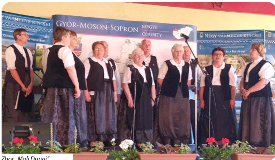
Zbor „Mali Dunaj”

Svake je godine domaćin susreta drugo naselje u županiji. Ove je godine ulogu domaćina preuzeo Fertőszentmiklós. Zainteresirani su se mogli susresti s raznolikim kulturnim vrtlogom, gdje su se između ostalog mogli upoznati s predstavnicima hrvatske, njemačke, romske i poljske kulture. Počasni gost događanja bio je veleposlanik Republike Hrvatske u Mađarskoj Mladen Andrić, a u sklopu kulturnog programa nastupio je i hrvatski zbor „Mali Dunaj” iz Kemlje. Hrvatska ekipa iz Kemlje s Udrugom „Leader” predstavila je tradicionalna blaga svojeg kraja te na svojem štandu nudila slasne kemljanske kekse svim prisutnima. Pokrovitelj dana bio je ministar poljoprivrede István Nagy, koji je otvorio priredbu i istaknuo: „Postavi