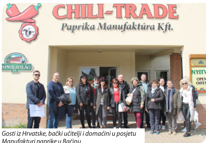
Gosti iz Hrvatske, bački učitelji i domaćini u posjetu Manufakturi paprike u Bačinu