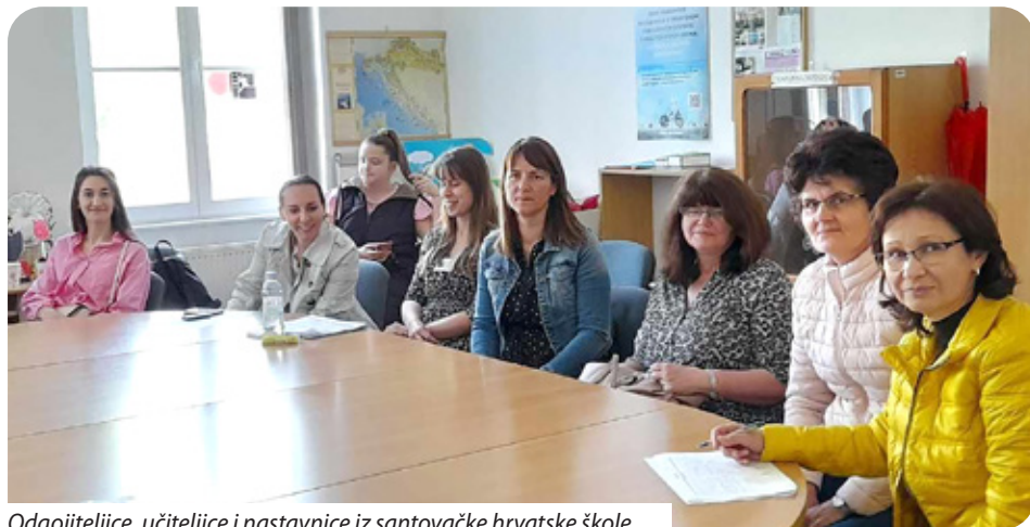
Odgovornice, učiteljice i nastavnice iz santovačke hrvatske škole

U organizaciji Visoke škole Józsefa Eötvösa u Baji od 10. do 11. travnja održan je dvodnevni XI. Međunarodni znanstveni skup predmetne pedagogije. Stručni skup i ove godine okupio je ponajprije učitelje i nastavnike, teoretičare i praktičare te istraživače u obrazovanju učitelja primarnog obrazovanja.