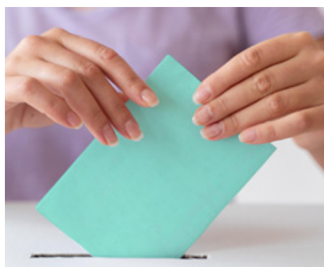
Izbor zastupnika za HDS