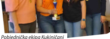
Pobjednička ekipa Kukinjčani

s pitanjima u ovim tematskim krugovima: 1. Walt Disney, 2. Prozori Pečuha, 3. Sport i 4. Ples/film.