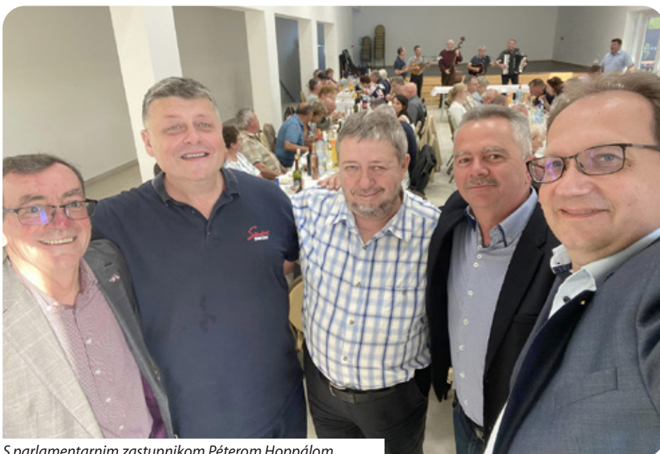
S parlamentarnim zastupnikom Péterom Hoppálom

Natjecali su se stalni natjecatelji ovoga već tradicionalnog natjecanja koji imaju svoje vinograde ili podrume u Semelju, Pečuhu,