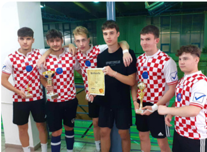
Nogometaši učeničkog doma „Miroslav Krleža“