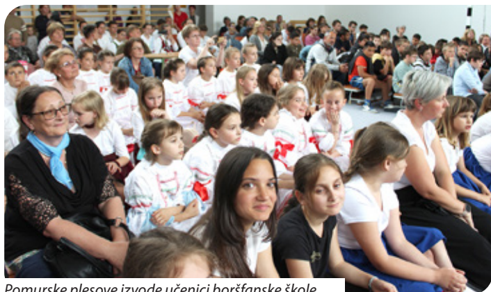
Pomurske plesove izvode učenici boršfanske škole

Više od 120 malih folklorša, pjevača, plesača i recitatora pripremalo se za Smotru i znatiželjno čekalo što će izvesti učenici iz drugih škola. Smotru su otvorili učenici boršfanske škole s modernim plesom, odjeveni u boje hrvatske trobojnice. Učenice serdahelske škole očarale su publiku prekrasnim glasom pjevajući pomurske popevke odnosno modernim plesom na međimurske melodije. Partnerska škola pripremila se sa stihovima Dragutina Domjanića na kajkavskom narječ-