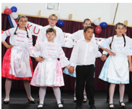
Hrvatska kulturna smotra u Boršni