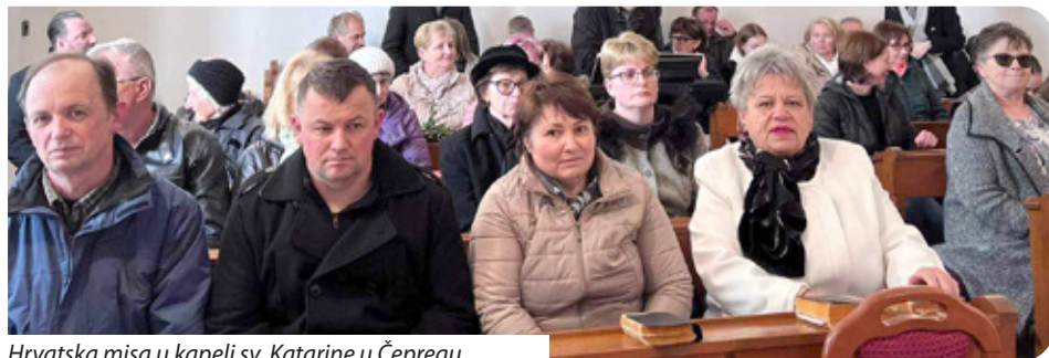
Hrvatska misa u kapeli sv. Katarine u Čepregu