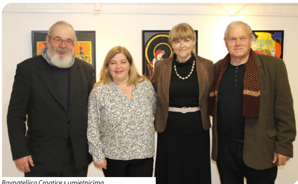
Ravnateljica Croatice s umjetnicima