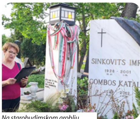
Na starobudimskom groblju

U organizaciji Hrvatske samouprave Starog Budima – Bekašmeđera 6. travnja upriličena je druga memorijalna šetnja u Starom Budimu.