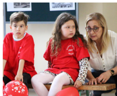
Zimska škola hrvatskoga jezika i kulture