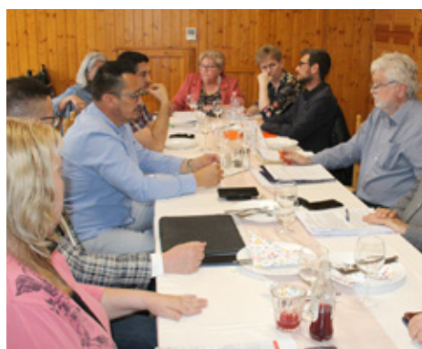
Sastavljanje državne liste SHM-a