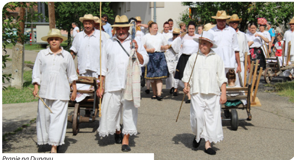
Pranje na Dunavu

su ih malim paketima. Među ostvarenjima ističe kako su uspjeli obnoviti stražnji dio zgrade, napraviti centralno grijanje, kupiti klima-uređaje, napraviti izolaciju i obojiti dio obnovljene zgrade. Prema njegovim riječima, mnogo su radili na zgradi koju su potpuno obnovili izvana i iznutra.