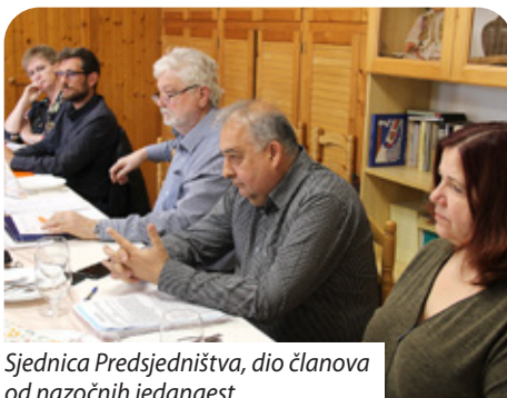
Sjednica Predsjedništva, dio članova od nazočnih jedanaest