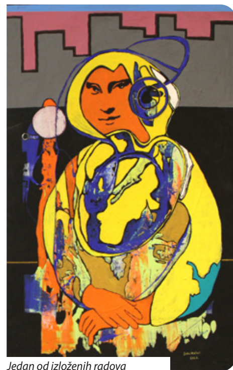
Jedan od izloženih radova