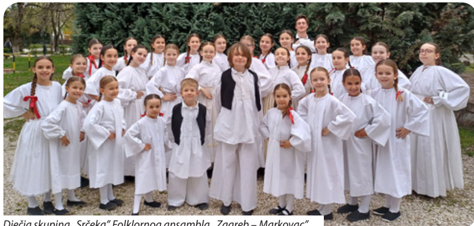
Dječja skupina „Srčeka“ Folklornog ansambla „Zagreb – Markovac“

Tri hrvatska plesna ansambla boravila su od 22. do 24. ožujka u Budimpešti i sudjelovala na IX. Međunarodnom festivalu folklora i narodnog plesa. Festival je održan 23. ožujka u Domu kulture i kazališta Ferencvárosi. Na tom međunarodnom festivalu sudjelovale su tri plesne skupine iz Hrvatske, po jedna iz Turske, Mađarske (Srpsko kulturno-umjetničko društvo „Taban“) i Litve. Iz Hrvatske su se petnaestominutnim programom predstavili HKUD „Koškani 1978“ iz slavonskog naselja Koška s plesovima i pjesama iz Slavonije, a starija dječja skupina KUD-a „Sesvete“ iz Zagreba