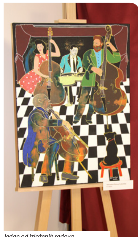
Jedan od izloženih radova