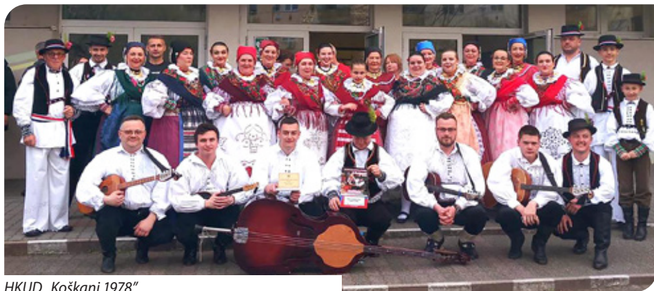
HKUD „Koškani 1978“

predstavila se s pjesmama i plesovima iz Zagorja i Murtera: s pjesmom iz Draganića „Curica je lepa“ te koreografijom pjesama i