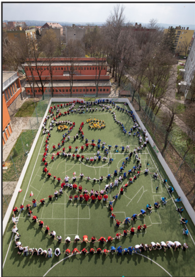
Dr. Ante Starčević u Osnovnoj školi i gimnaziji „Miroslav Krleža“ u Pečuhu 872. Milenijska Strikoman

Strikoman je već snimao milenijske fotografije u Mađarskoj. Tako je 22. studenoga 2017. godine snimio dvije u budimpeštan-