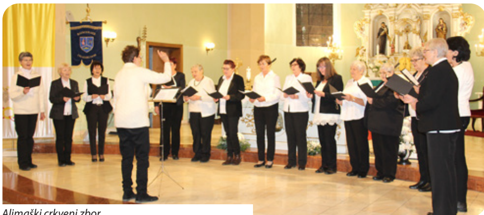
Aljmaški crkveni zbor