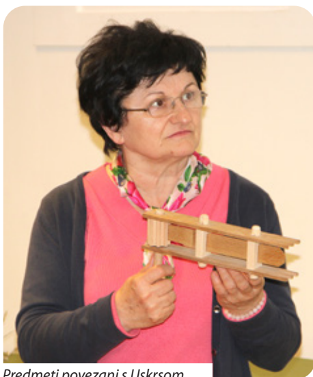
Predmeti povezani s Uskrsom

se družili i čistili jedni druge. Šibanje Pilata ili Baraban spominje Jasna Čapo Žmegač u svojoj monografiji „Hrvatski uskrsni običaji: korizmeno-uskrsni običaji hrvatskog puka u prvoj polovici XX. stoljeća: svakidašnjica, pučka pobožnost, zajednica“. Baraban je običaj poznat diljem Dalmacije kad se udaralo po klupama u crkvi, a kod nas se taj običaj simbolizira jednom šibom, „batinom“ koja je ukrašena. Djeca su nekad nosila u crkvu te šibe i, kad bi u propovijedi bio čitan dio o Pilatu koji je osudio Isusa na smrt, tad bi udarajući o klupe proizvodili buku, simbolizirajući posljednje trenutke Isusa na ras-pelu. Iz Podravine dolazi običaj „matkanje“, koji je poziv za doživotno prijateljstvo. Kad bi netko dobio „matka“ – zdjelu punu voća, kolača, uskrsnih jaja i uzvratio dar osobi koja joj je poslala zdjelu, to bi značilo da prihvaća prijateljstvo.