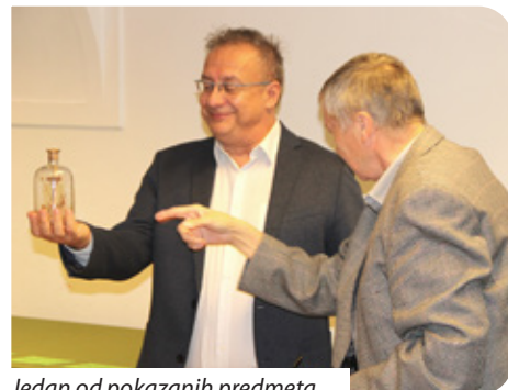
Jedan od pokazanih predmeta

jabuke , poslije i cifrane naranče , koje su se poklanjale na Uskrs. Taj se običaj gotovo izgubio, a u današnje doba ponovno se vratio u modu te se kao posebna tehnika narodne umjetnine izrađuje ne samo za Uskrs. Još jedan običaj koji je jedno vrijeme nestao pa se sad vraća je i tzv. „iči u Emaus“. Dio iz Evanđelja kad su apostoli na Uskrsni pone-djeljak turobno kročili putom i sreli uskrslog Isusa (ne znajući da je to on) i pozvali ga da ostane s njima jer se već mračilo priča je koja je ostala u narodu kao neki profani običaj – u smislu da je dobro biti zajedno. Ljudi su zato išli u posjete jedni drugima u vinske podrume, kuće, „u Emaus“, gdje su