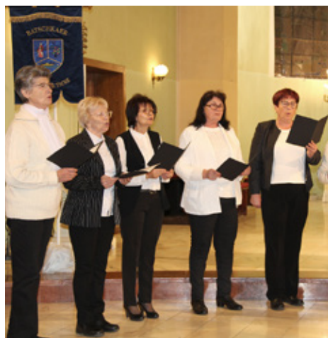
Novosti iz Aljmaša