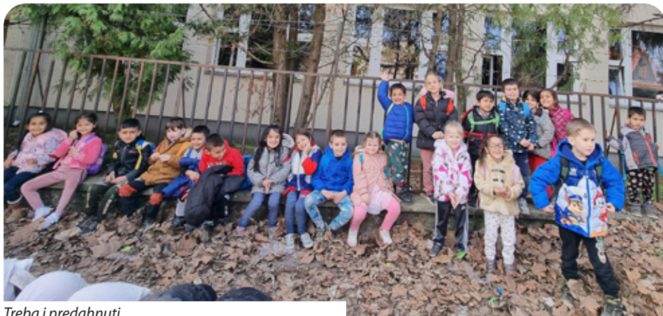
Treba i predahnuti

Lukoviški hrvatski narodnosni vrtić, koji djeluje u sklopu udruženja Drávamenti Óvodák (Podravski vrtići), ostvaruje plodnu suradnju s mjesnom samoupravom Lukovišća, ali i s narodnosnim samoupravama u Lukovišću – s Hrvatskom samoupravom Lukovišća i s Romskom samoupravom Lukovišća te s Malteškom službom i lukoviškom podružnicom Mađarske ekumenske službe „Jelenléti Pont“.