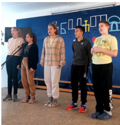
Tjedan hrvatskog jezika u školi Mate Meršića Miloradića