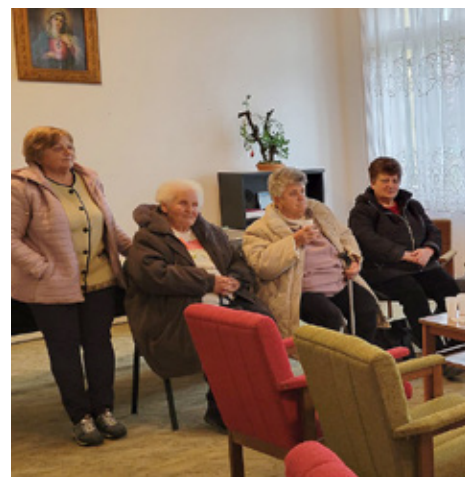
Dan žena u Kačmaru