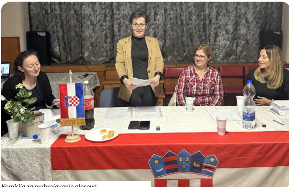
Komisija za prebrojavanje glasova

Kandidati su prije glasanja trebali prihvatiti kandidaturu za zastupnika. Svi nazočni imali su mogućnost predlaganja i prihvaćanja predložene kandidature. Na sjednicu se od 102 člana odazvalo njih 56, izjavio je za Hrvatski glasnik predsjednik