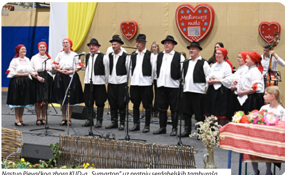
Nastup Pjevačkog zbora KUD-a „Sumarton“ uz pratnju serdahelskih tamburaša