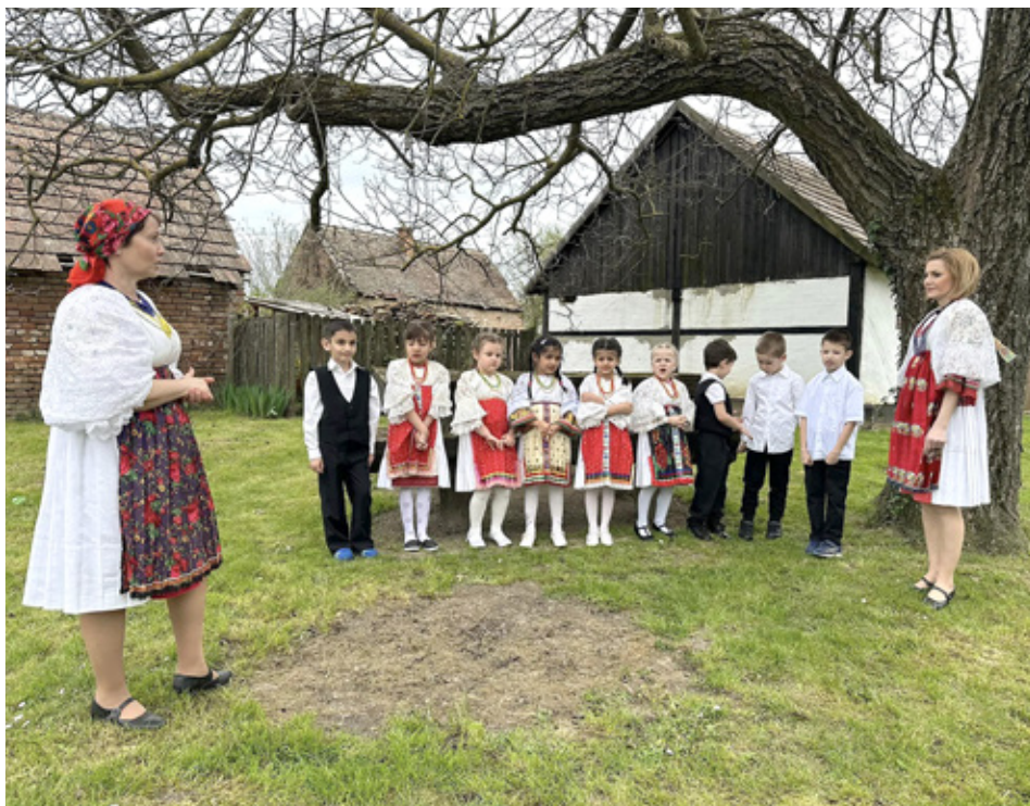
Djeca lukoviškog vrtića sa svojim odgajateljicama u dvorištu lukoviške Zavičajne kuće.

knutih elemenata vrtićkog života upravo je tema prijevoza. Smatraju vrlo važnim to da polaznici vrtića već u predškolskoj dobi nauče najvažnija prometna pravila i upoznaju se s najčešćim prijevoznim sredstvima. Cilj izleta bilo je uvježbavanje korištenja javnog prijevoza i s njim povezana pristojnog ponašanja, upoznavanje s na-