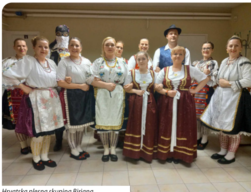
Hrvatska plesna skupina Birjana