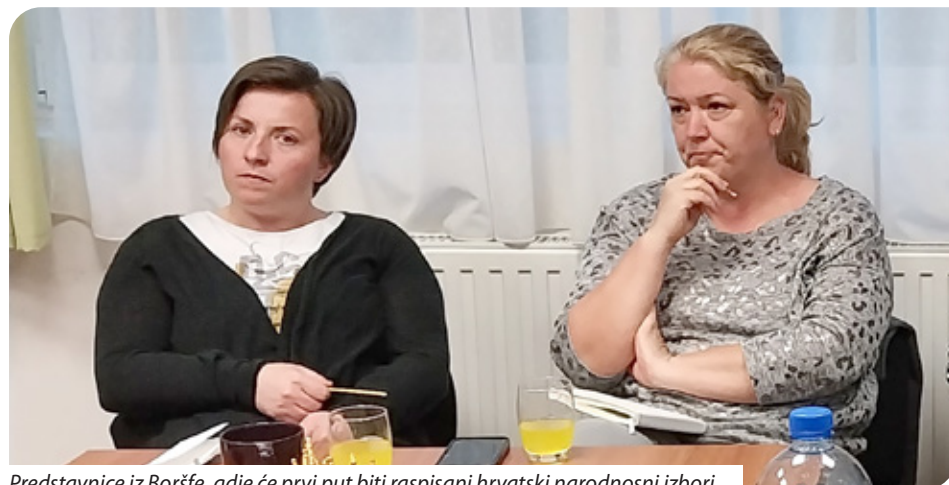
Predstavnice iz Boršfe, gdje će prvi put biti raspisani hrvatski narodnosni izbori