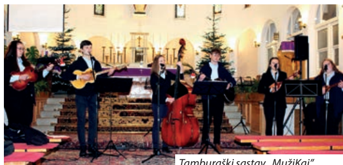
Tamburaški sastav „MužiKaj”