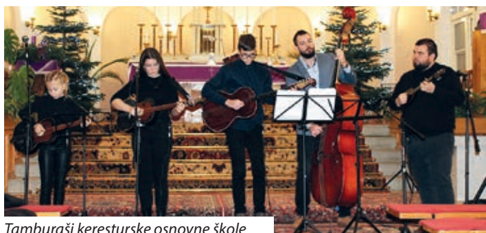
Tamburaši keresturske osnovne škole