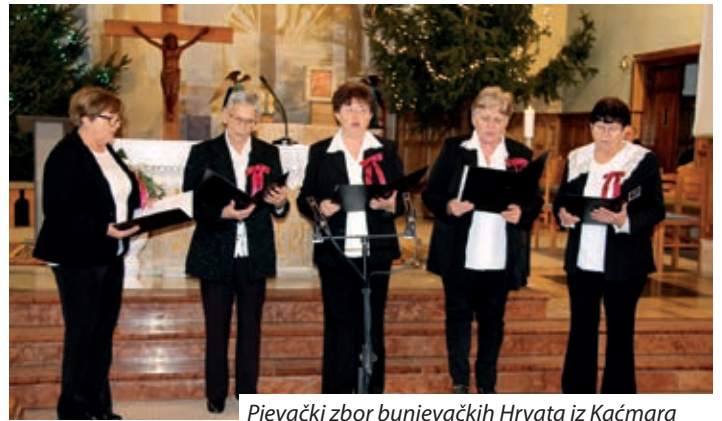
Pjevački zbor bunjevačkih Hrvata iz Kačmara