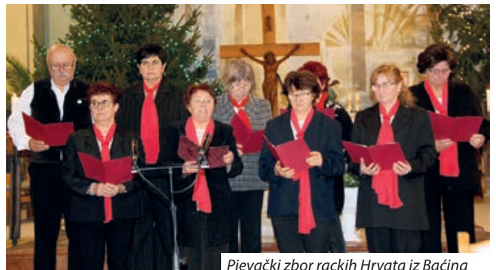
Pjevački zbor rackih Hrvata iz Bačina