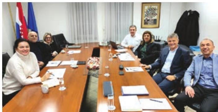
Sastanak je održan u Središnjem državnom uredu za Hrvate izvan Republike Hrvatske