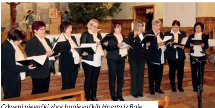
Crkveni pjevački zbor bunjevačkih Hrvata iz Baje