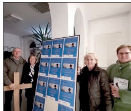
Dani Domovinskoga boja u Gradišću