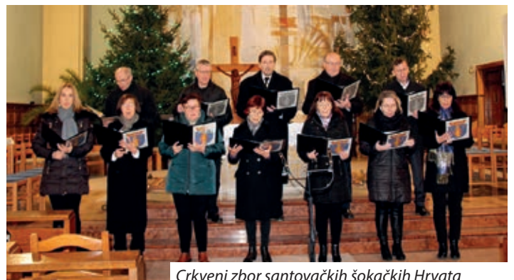
Crkveni zbor santovačkih šokačkih Hrvata