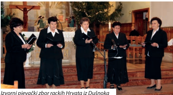
Izvorni pjevački zbor rackih Hrvata iz Dušnoka