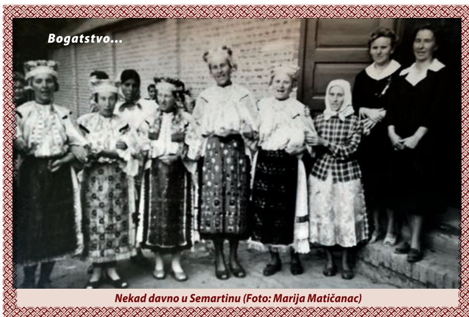
Nekad davno u Semartinu