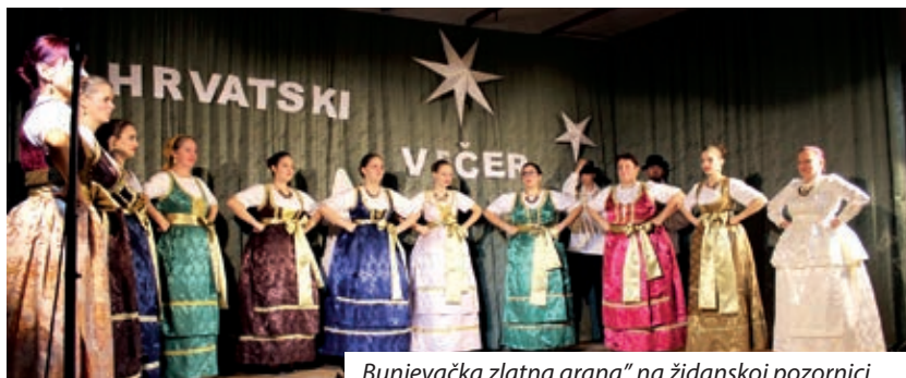
„Bunjevačka zlatna grana“ na židanskoj pozornici

U subotu 26. novembra održali smo si već tradicionalni Hrvatski večer u organizaciji mjesne i Hrvatske samouprave Hrvatskoga Židana. Svako se ljeto skupa pripremimo na ovu večer i mi organizatori kot i sve naše grupe. Ova prilika blizu koncu ljeta daje mogućnost za našu hrvatsku zajednicu – za sve naše grupe od dičjih folklorišev prik odraslih tančošev, muzičarov i pjevačev sve do najstarijih jačkaricov – da skupadujemo i da sve grupe posebno predstavljaju svoju djelatnost na polju očuvanja naše hrvatske kulture i naših navada. I pravoda da se malo razveselimo med sobom. I ovom smo prilikom imali čast pozdraviti med nami veleposlanika Republike Hrvatske u Budimpešti dr. Mladena Andrića, ki je pozdravio sve nazočne sa svojimi misli. Svako ljeto polag naših izvodjačev pozovemo jednu gost-folklornu grupu. Pokidob su ovoga ljeta u sklopu 16. Državne folklorne turneje bila povezana dva naselja, Baja i Hrvatski Židan, od sebe se razumi da su nam bili naši posebni gosti kotriigi „Bunjevačke zlatne grane“ iz Baje. Zahvaljujući ovoj dobroj inicijativi imali smo mogućnost družiti se već po drugi put s folkloriši iz Baje, kad unutar te turneje naši tančoši i tamburaši bili su jur pozvani u Baju kod naših prijateljev još u juniju na Duhe. A kad skupadujemo pravi folkloriši, onda ljuto nastane dobra atmosfera pri zajedničkom tancanju i mulatovanju na večernjem balu s Pinka-bandom.