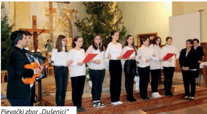
Pjevački zbor „Dušenici“