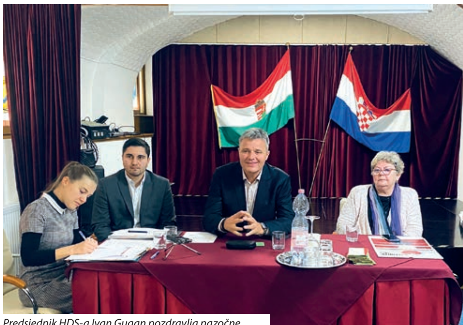
Predsjednik HDS-a Ivan Gugan pozdravlja nazočne

Sjednica Skupštine Hrvatske državne samouprave održana je 3. prosinca 2022. godine u prostorijama Nefitnog poduzeća za kulturnu, informativnu i izdavačku djelatnost „Croatica“. Na sjednicu se odazvalo 19 od 31 zastupnika te je bio osiguran kvorum za održavanje sjednice. Dnevni red prihvaćen je jednoglasno: Izvješće predsjednika o radu između dvaju zasjedanja Skupštine, Izvješće o izvršenju odluka kojima je rok istekao, Izvješće o odlukama za koje je bio ovlašten predsjednik, Rebalans proračuna Hrvatske državne samouprave, ureda i institucija za 2022. godinu, Prijedlog Plana rada Hrvatske državne samouprave za 2023. godinu, Usvajanje odluke o Planu unutarnje kontrole za 2023. godinu, Usvajanje Izvješća o radu Nefitnog poduzeća „Hrvatsko kazalište Pečuh“, Usvajanje umjetničkog programa Nefitnog poduzeća „Hrvatsko kazalište Pečuh“, Raspisivanje natječaja za glavnog urednika Hrvatskoga glasnika, Raspisivanje natječaja za ravnatelja Hrvatskoga kluba Augusta Šenoae, Ukidanje radnog odnosa ravnatelja Hrvatskog kulturnog i sportskog centra „Josip Gujaš Džuretin“, Usvajanje odluke o stjecanju vlasništva nekretnine na adresi Ul. Nagy Lajos 4, 7622, Pečuh, Rasprava o članstvu Odbora za gospodarstvo, financije i nadzor i Razno. U svim predloženim točkama dnevnoga reda (osim točke Razno) referent je bio predsjednik HDS-a Ivan Gugan.