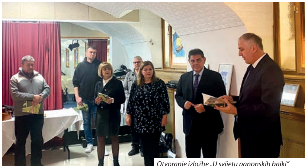
Otvoravanje izložbe „U svijetu panonskih bajki“

Krešimir Tabak detektirao je stanje književnosti na području Herceg-bosanske županije, posebice na području Tomislavgrada i Livna, ustvrdivši kako je riječ o solidno razvijenoj sceni s nizom zapaženih izdanja i autora te čitateljskom publikom koja u velikoj mjeri čita i posuđuje knjige u lokalnim knjižnicama. Kao najčitanije autore s tog područja izdvojio je Stipu Čuića, Dževa-