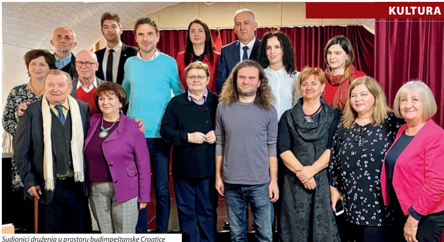
Sudionici druženja u prostoru budimpeštanske Croatice

tog rubnog dijela panonskog prostora u kojem postoji zamijećen književni život, časopisi kao što su „Riječ“, „Alternator“ i „Kupa“ te pedesetak relevantnih autora koji sudjeluju u književnom životu na tom prostoru.