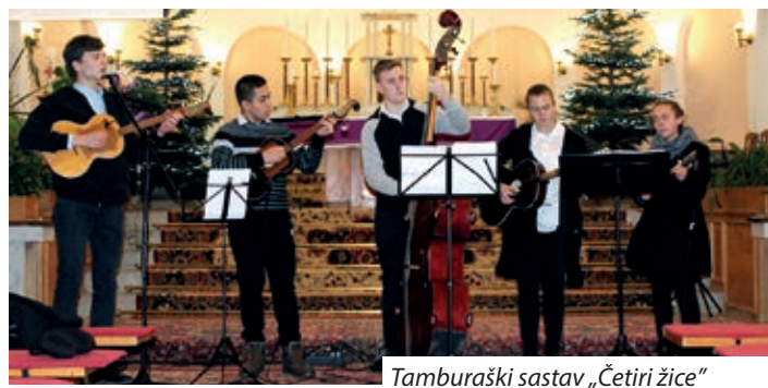
Tamburaški sastav „Četiri žice”

Cilj koncerta mladih tamburaša bila je promocija tamburaške glazbe, odnosno hrvatskih tradicijskih crkvenih pjesama u krugu pomurske hrvatske zajednice. Tamburaška glazba u pomurskoj regiji udomačila se tek prije dvadeset i nešto godina, kad su mladi u Sumartonu započeli svirati na žičanim instrumentima. Naime, sviranje tambure u toj regiji nije imalo tradiciju. Na zabavama i svadbama svirali su tzv. bandisti, tj. svirači puhačkih glazbala, odnosno bila je popularna još i harmonika. Promoviranje tamburaške glazbe sumartonskih svirača „zarazilo” je mlade u regiji i Hrvatska samouprava u Velikoj Kaniži započela je organizirati tečaj sviranja tambure u keresturskoj i serdahel-