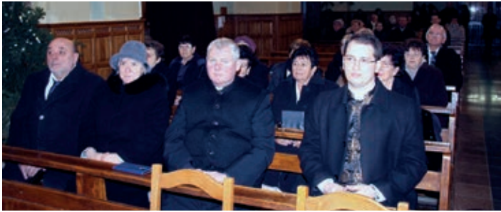
Dušnočki načelnik István Mindszenti sa suprugom i gostujući svećenici

Hrvatska samouprava Dušnoka i Hrvatska vjerska zajednica rimokatoličke Župe 29. prosinca priredile su već tradicionalni Božićni koncert i susret hrvatskih crkvenih pjevačkih zborova, koji je pokrenut 2001. godine u suorganizaciji mjesne hrvatske samouprave i Izvornog pjevačkog zbora. Manifestacija je ove godine ponovno održana nakon prekida koji je uslijedio zbog pandemije koronavirusne bolesti. Misno slavlje na hrvatskom jeziku predvodio je santovački župnik vlč. Imre Polyák, biskupski vikar za narodnosti, a s njime suslužio vlč. Szabolcs Tomaskovity, po-