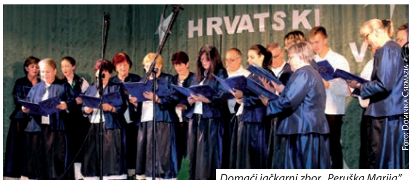
Domaći jačkarni zbor „Peruška Marija“