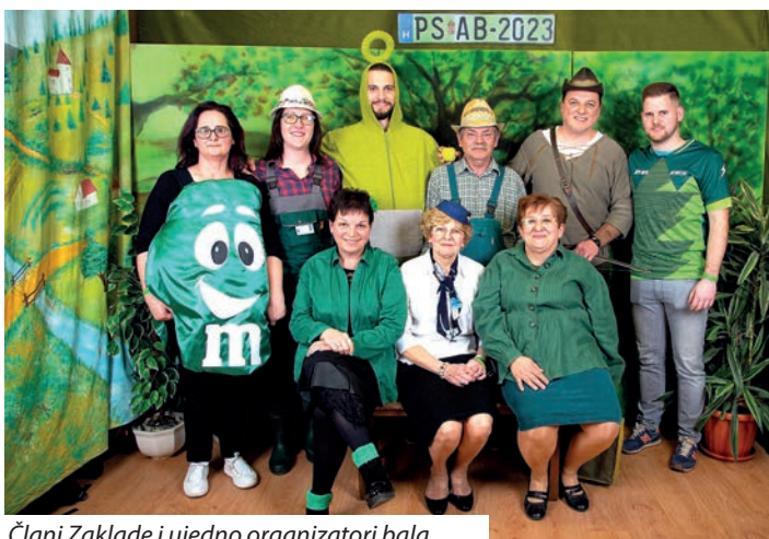
Člani Zaklade i ujedno organizatori bala