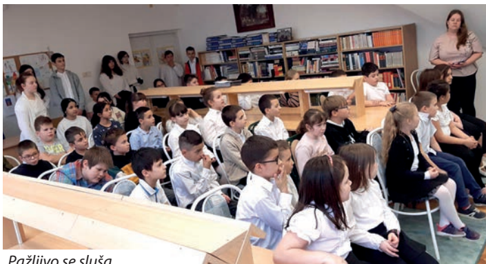
Pažljivo se sluša