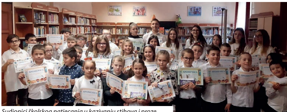
Sudionici školskog natjecanja u kazivanju stihova i proze

U Hrvatskom vrtiću, osnovnoj školi u učeničkom domu u Santovu od 20. do 21. ožujka održani su Dani hrvatskoga jezika. Prvog su dana učenici, učitelji i nastavnici u skupinama posjetili bogatu Zavičajnu zbirku u sjedištu Državne udruge šokačkih Hrvata. Nakon toga priređen je kviz na zavičajnu temu za učenike po razredima. Učenici nižih razreda igrali su se brojkama i slovima, crtali prepoznatljive hrvatske simbole (zastavu, kravatu i drugo), a zatim se zabava nastavila i na plesačnici. Uslijedio je prigodni kulturni program gostiju (pjevačkog zbora „Biser“ iz Dušnoka) i domaćina (pjevačkog zbora santovačke hrvatske škole). Poslije kulturnog programa održana su predavanja o narodnoj nošnji dušnočkih rackih Hrvata i santovačkih šokačkih Hrvata. Zatim su se učenici viših razreda natjecali na velikom kvizu po skupinama na temu „Hrvatska i Hrvati u Mađarskoj“ te u poznavanju hrvatskog jezika na sljedeće teme: na tržnici, kod liječnika i u gostionici. Uslijedila je plesačnica te zajednički ručak svih sudionika, domaćina i gostiju.