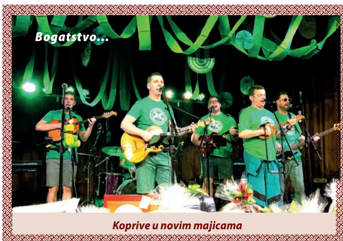
Koprive u novim majicama