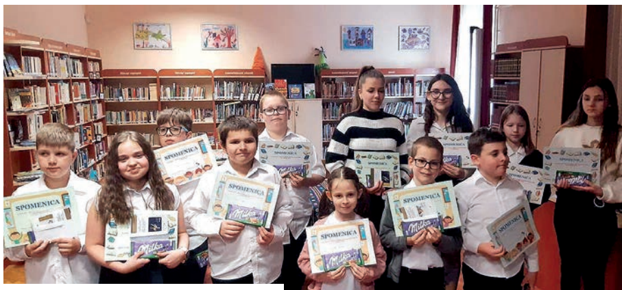
Najbolji kazivači po kategorijama