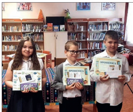
Dani hrvatskoga jezika u Santovu