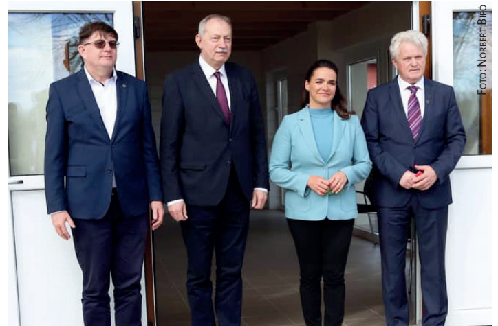
Predsjednica Mađarske Katalin Novák, Norbert Biró, Csaba Koós i László Szászfalvi

Rekonstrukcijom bivše zgrade skladišta soli na obali rijeke Drave u Barči dobiven je višenamjenski društveni prostor s dvjema prostorijama. Jedna od njih funkcionira kao mjesto za individualno informiranje i stjecanje znanja, a zbog svoje odvojenosti i oblika u nju su postavljeni i „glasni“ uređaji. U drugoj je interaktivna izložba. Glavna je svrha interaktivne izložbe, koja je smještena na 98 m 2 u centru mobilnosti, informirati i poučavati posjetitelje o povijesti prijevoza u Barči, industrijskom naslijeđu i tradiciji, njegovu prirodnom okruženju te o kulturnim i etnografskim vrijednostima. Između ostalog, virtualna vodena tura omogućit će i krstarenje Dravom u kojem će se moći obići najzanimljiviji dijelovi Drave. Sjedeći u trupu, moći ćete odabrati riječni dio na ploči na maloj konzoli. Glavna je atrakcija centra društvena igra koja ispunjava najveći dio prostora, a koja svojim