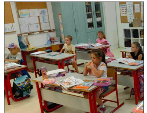
Početak školske godine u HOŠIG-u