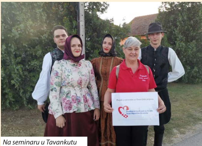
Na seminaru u Tavankutu

U nizu ovih programa ističe se sudjelovanje na seminaru u Tavankutu i učenje, usavršavanje bunjevačkohrvatskih pjesama, što smo uspjeli ostvariti uz financijsku potporu Središnjeg državnog ureda za Hrvate izvan Republike Hrvatske.