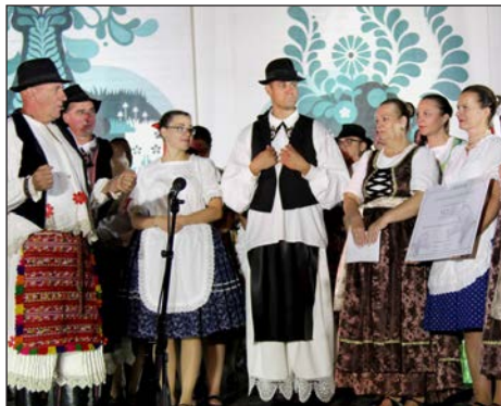
50 godina KUD-a „Mohač”