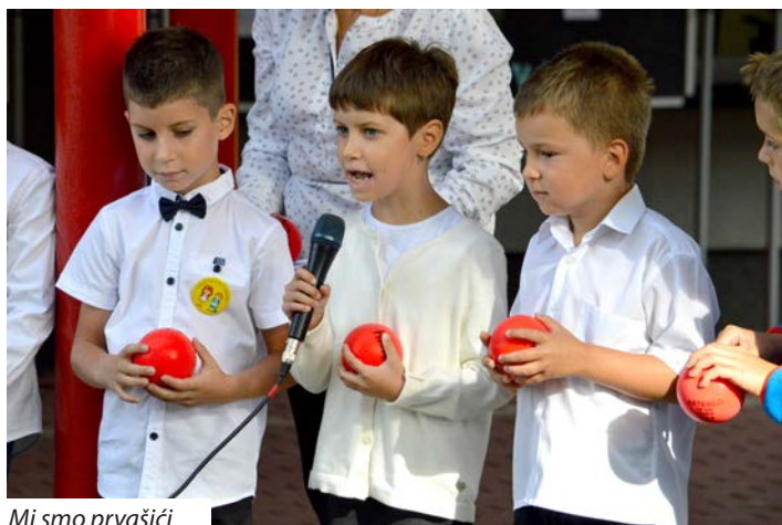
Mi smo prvšači