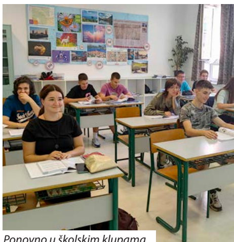
Ponovno u školskim klupama

Škola će proslaviti 30. obljetnicu samostalnosti tradicionalnom manifestacijom „Tjedan hrvatske kulture“, koja će se održati između 27. studenog i 1. prosinca.