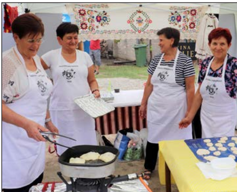
Od Pudarine do Pudarice