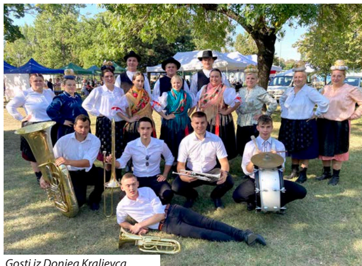
Gosti iz Donjeg Kraljevca