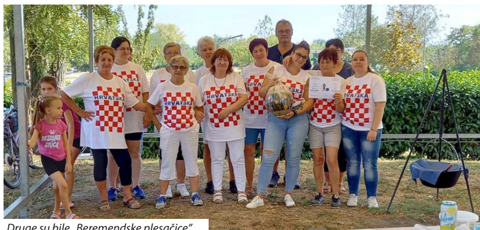
Druge su bile „Beremendske plesačice“