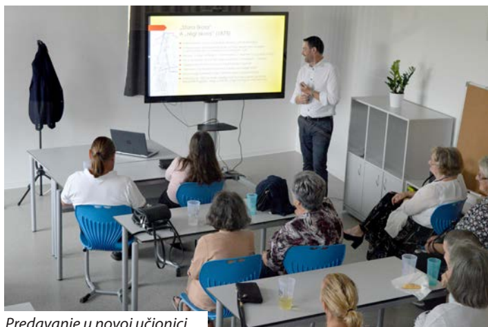
Predavanje u novoj učionici

ima 77, a ravnateljica vjeruje da će taj broj nadalje rasti jer dječji vrtić radi s punim kapacitetom, a događa se i to da radi učenja hrvatskog jezika djecu upisuju i roditelji iz okolnih mjesta. U ustanovi radi 15 učiteljica i učitelja, među kojima ima dosta mladih. Od njih čak 11 dobro govori hrvatski jezik, to su oni koji stanuju u Petrovu Selu, a njima je važan i društveni i kulturni život mjesta te su aktivni članovi kulturnih udruga. „Otprilike trećina učenika dobro govori hrvatski jezik, tj. gradišćanski dijalekt“, rekla nam je ravnateljica. Drugi se s hrvatskim jezikom susreću u dječjem vrtiću pa zatim u osnovnoj školi u kojoj se odvija dvojezična nastava hrvatskoga jezika. Ustanova mnogo ulaže u njegovanje hrvatske kulture, u njoj se uči tambura i hrvatski folklor, te surađuje s mnogim hrvatskim udrugama. Učenici sudjeluju na hrvatskim državnim natjeca-