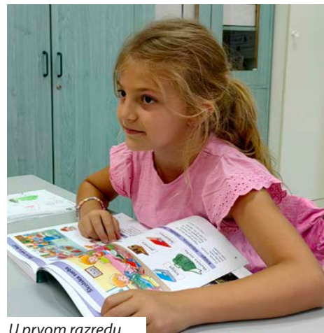
U prvom razredu

HOŠIG ove godine priprema 5. memorijalni košarkaški turnir pod nazivom „Dra-