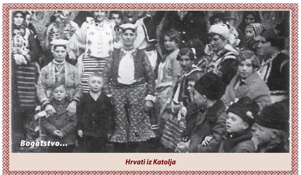
Hrvati iz Katolja