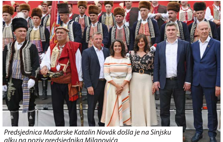
Predsjednica Mađarske Katalin Novák došla je na Sinjsku alku na poziv predsjednika Milanovića

Uoči 308. Sinjske alke predsjednici Milanović i Novák sa suradnicima su obišli izložbu „Stipe Sikirica – blizina čovjeka i zavičaja“ u Galeriji Sikirica uz stručno vodstvo kustosice Ane Žanko. Također su obišli i Muzej Sinjske alke te sudjelovali na Vojvodinu prijemu tijekom kojeg im je predsjednik Viteškog alkarskog društva Stipe Jukić uručio prigodne darove.