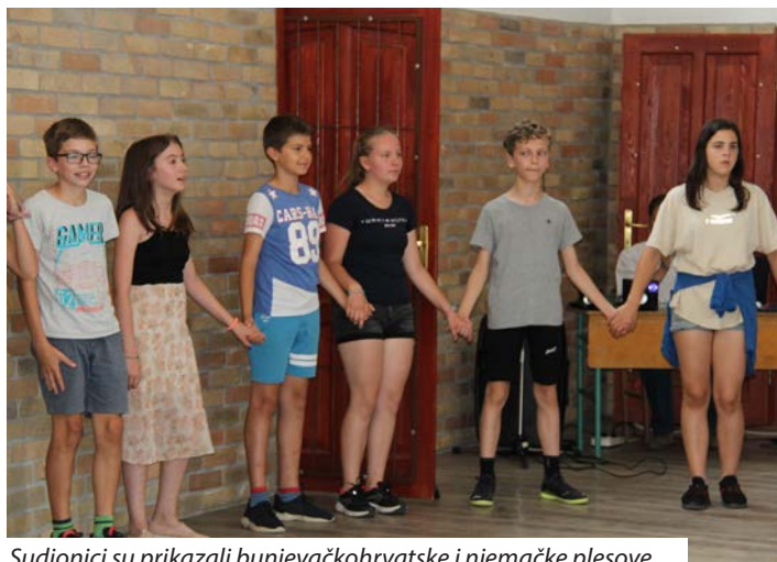
Sudionici su prikazali bunjevačkohrvatske i njemačke plesove