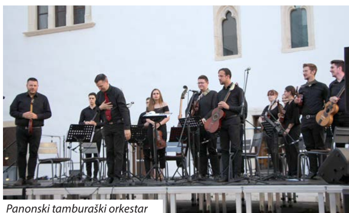
Panonski tamburaški orkestar