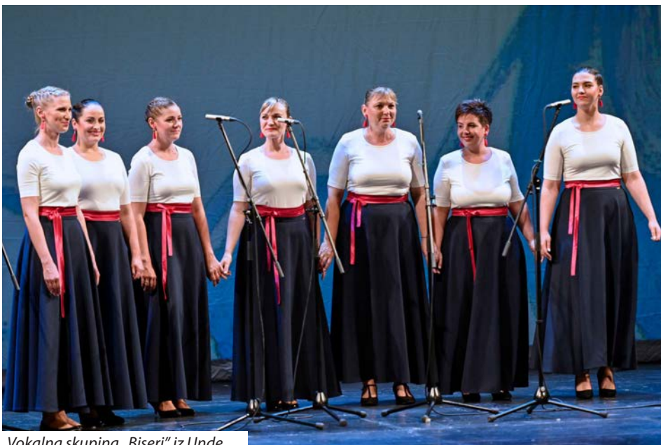
Vokalna skupina „Biseri” iz Unde