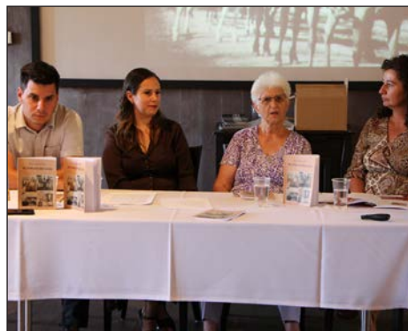
Hrvatski dan u Šiklošu