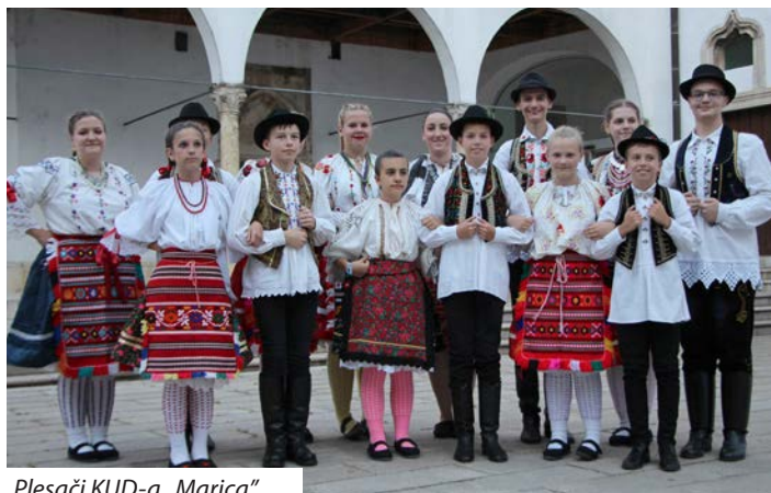
Plesači KUD-a „Marica“