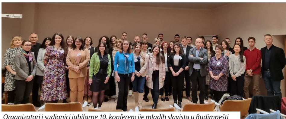
Organizatori i sudionici jubilarne 10. konferencije mladih slavista u Budimpešti