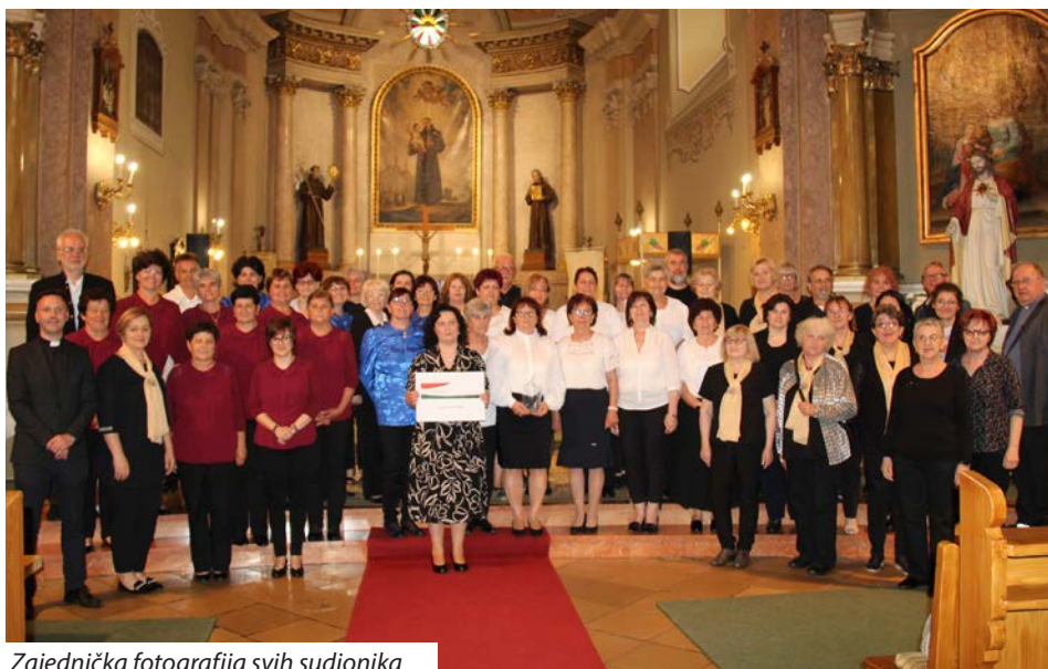
Zajednička fotografija svih sudionika