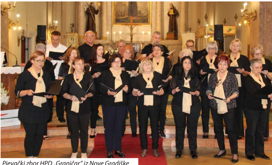
Pjevački zbor HPD „Graničar“ iz Nove Gradiške

Baje. Zborovi su Antunovo uljepšali tradicionalnim bunjevačkohrvatskim i novijim hrvatskim crkvenim pjesama, a gosti iz Nove Gradiške i omiljenim domoljubnim pjesmama. Poslije susreta druženje je nastavljeno u Kulturnom centru bačkih Hrvata, gdje je goste srdačno po-