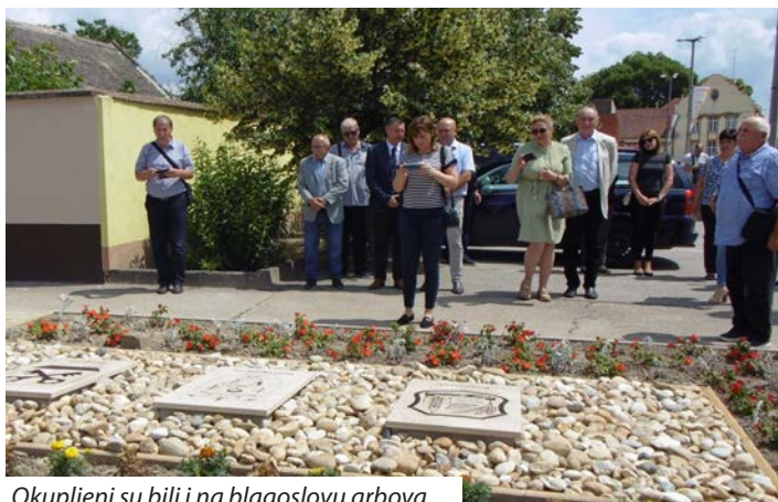
Okupljeni su bili i na blagoslovu grbova