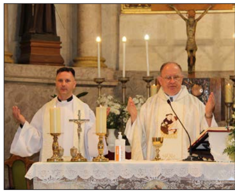
Antunovo u Baji