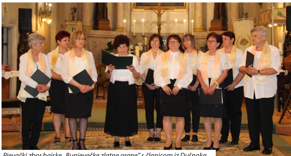
Pjevački zbor bajske „Bunjevačke zlatne grane“ s članicom iz Dušnoka