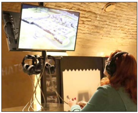
Obnovljena sigetska tvrđava