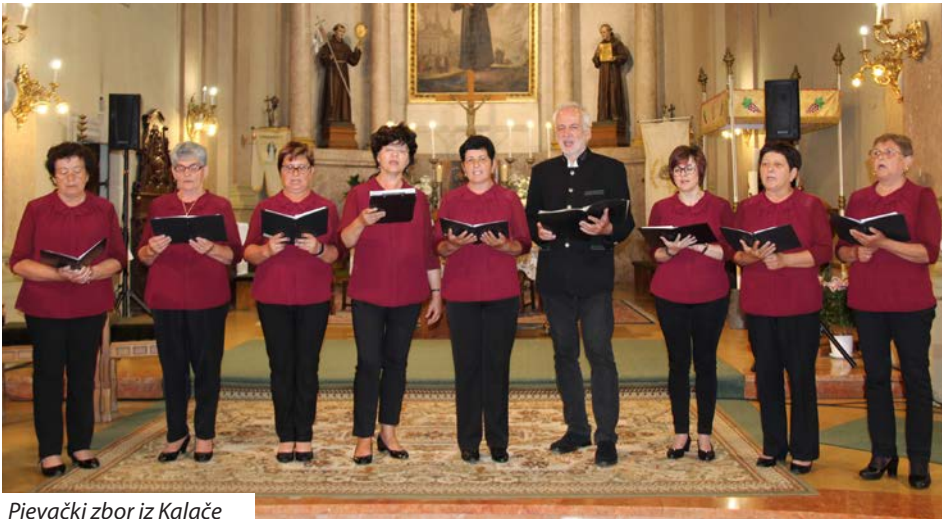
Pjevački zbor iz Kalače