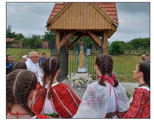
Jedan dan u Podravini