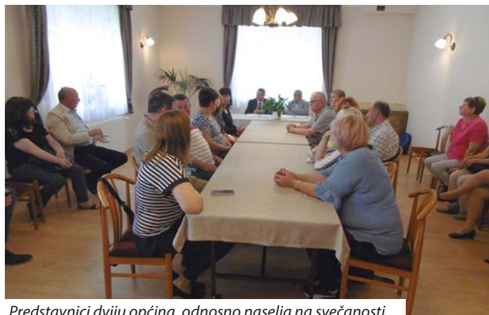
Predstavnici dviju općina, odnosno naselja na svečanosti