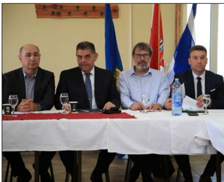
Susret podunavskih Hrvata