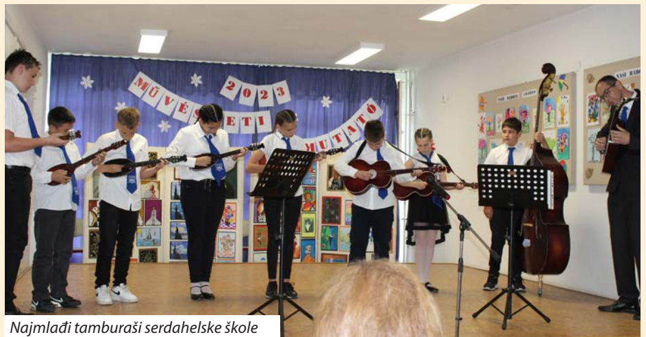
Najmlađi tamburaši serdahelske škole