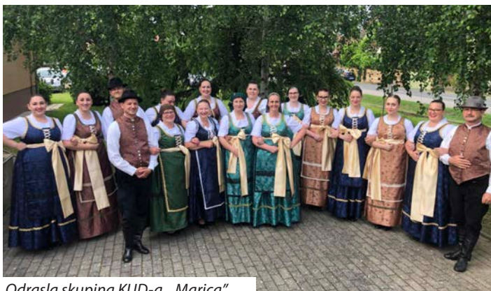
Odrasla skupina KUD-a „Marica”