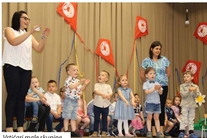
Vrtićari male skupine