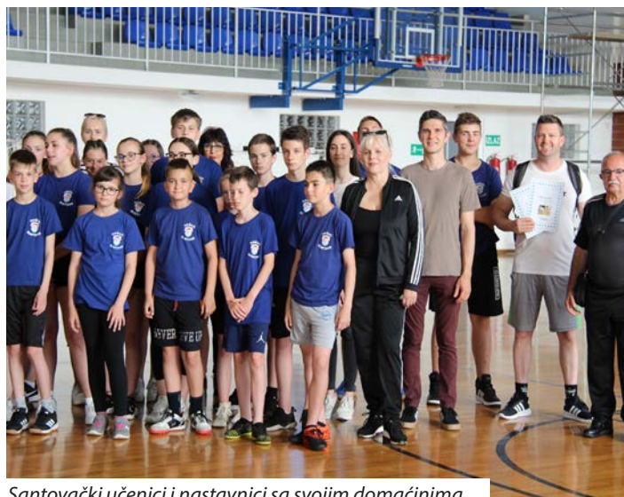
Santovački učenici i nastavnici sa svojim domaćinima