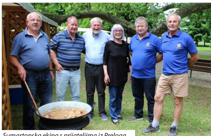
Sumartonska ekipa s prijateljima iz Preloga