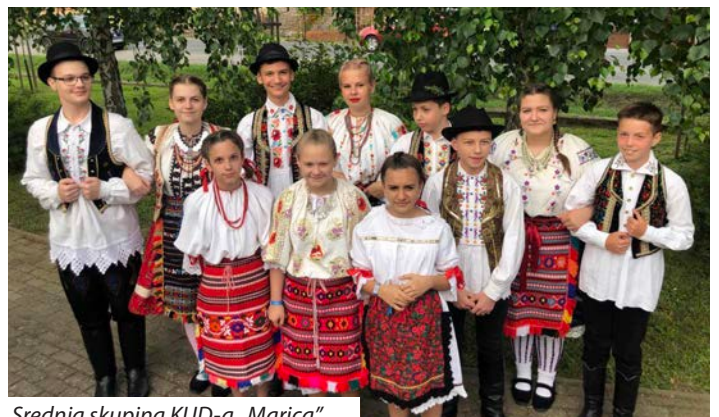
Srednja skupina KUD-a „Marica”