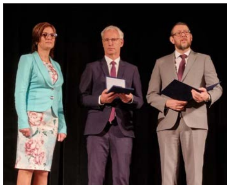
Pro Cultura Minoritatum Hungariae