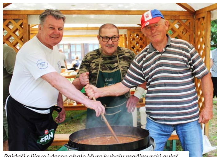
Pajdaši s lijeve i desne obale Mure kuhaju međimurski gulaš