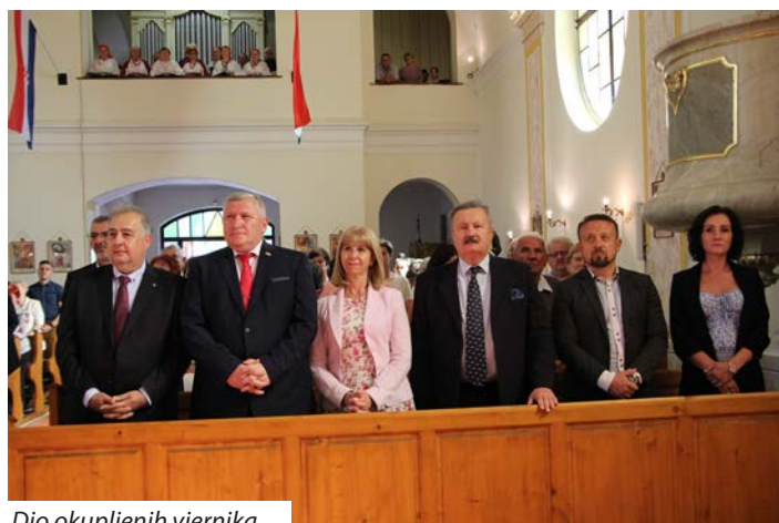
Dio okupljenih vjernika