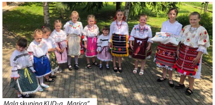
Mala skupina KUD-a „Marica”