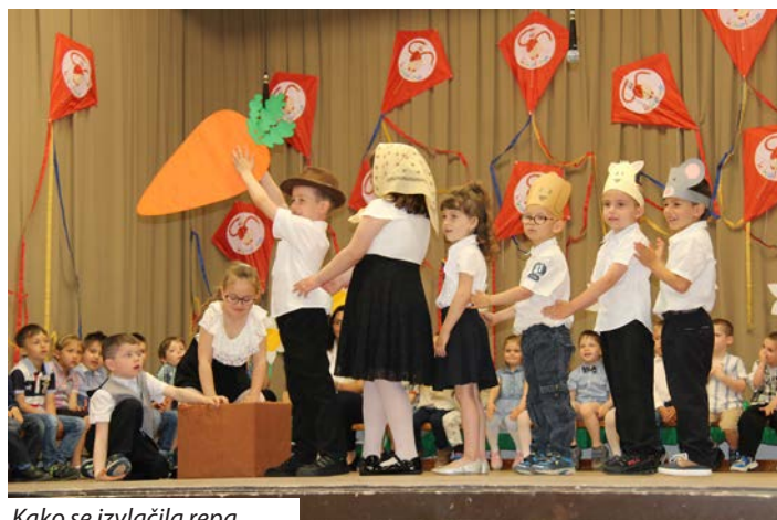
Kako se izvlačila repa...