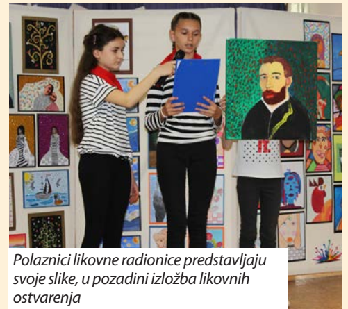
Polaznici likovne radionice predstavljaju svoje slike, u pozadini izložba likovnih ostvarenja