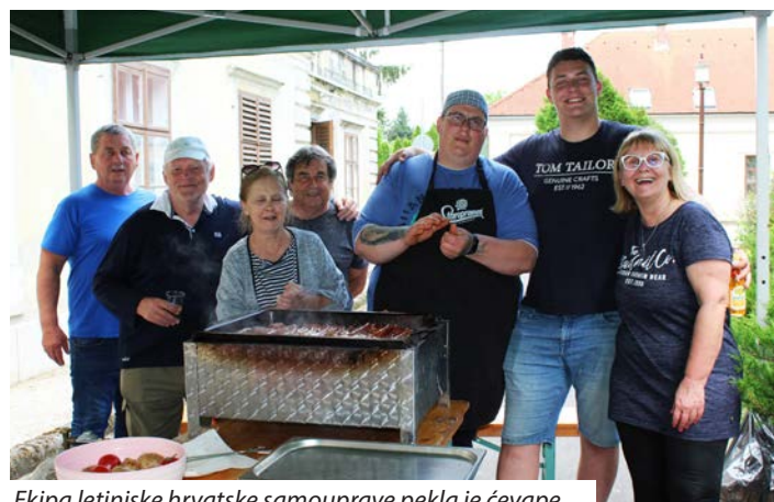
Ekipa letinjske hrvatske samouprave pekla je ćevape