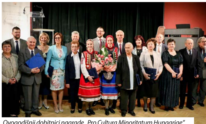
Ovogodišnji dobitnici nagrade „Pro Cultura Minoritatum Hungariae”

Broj je nagrada ograničen na najviše 13, što odgovara broju priznatih narodnosnih zajednica u Mađarskoj. Ovogodišnji dobitnici, izabrani među brojnim kandidiranim, ističu se angažiranošću pri očuvanju i razvoju kulturnog nasljeđa narodnosnih zajednica u Mađarskoj. Njihova je djelatnost široka: od kultur-