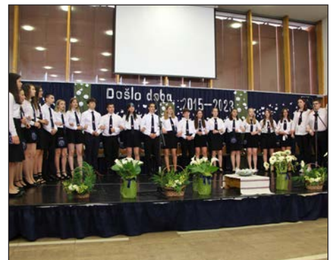
Opraštanje u školi „Miroslav Krleža”