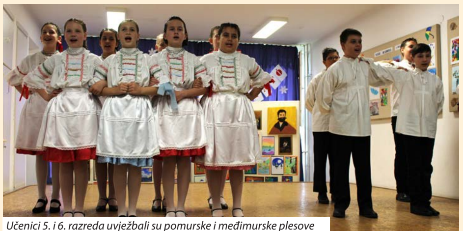
Učenici 5. i 6. razreda uvježbali su pomurske i međimurske plesove