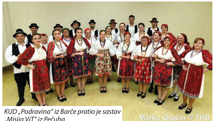
KUD „Podravina“ iz Barče pratio je sastav „Misija ViT“ iz Pečuha