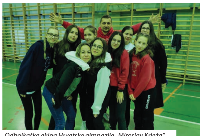
Odbojkaška ekipa Hrvatske gimnazije „Miroslav Krleža”

Na ceremoniji svečanog otvorenja bilo je nazočno više narodnosnih dužnosnika, tako i predsjednik HDS-a Ivan Gugan, glasnogovornik Hrvata u Mađarskom parlamentu Jozo Solga te zastupnik Nijemaca u Mađarskom parlamentu i predsjednik Odbora za narodnosti Mađarskog parlamenta Imre Ritter. Kako je naglasio državni tajnik Soltész, cilj je državnog tajništva i dužnosnika narodnosnih zajednica u Mađarskoj stvoriti priliku i mjesto okupljanja narodnosne mladeži u Mađarskoj. Ovakvi susreti prilika su da se vidi kako na istoku ili jugu ili u središnjoj Mađarskoj ili bilo gdje imamo prijatelje pripadnike narodnosti s kojima se možemo družiti, zabavljati se i okupljati oko sporta i plesa.