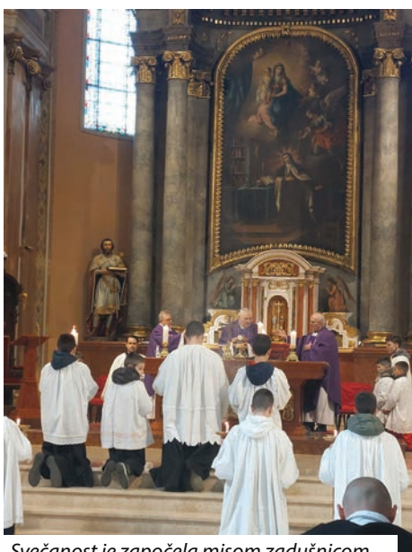
Svečanost je započela misom zadušnicom