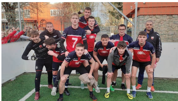
Nogometna ekipa Hrvatske gimnazije „Miroslav Krleža”

Na inicijativu Državnog tajništva za vjerske i narodnosne odnose Ureda predsjednika mađarske Vlade u Pečuhu je od 24. do 26. ožujka održan II. sportski susret narodnosnih gimnazija. Susret je u njemačkom pečuškom školskom centru „Valéria Koch” otvorio državni tajnik za vjerske i narodnosne odnose pri Uredu predsjednika mađarske Vlade Miklós Soltész. Na ovogodišnjem susretu (prošlogodišnji, prvi, održan je u Szarvasu) sudjelovali su mladi Hrvati, Nijemci, Rumunji, Srbi i Slovaci te se natjecali u nogometu i odbojci. Momci su se natjecali u nogometu, a djevojke u odbojci.