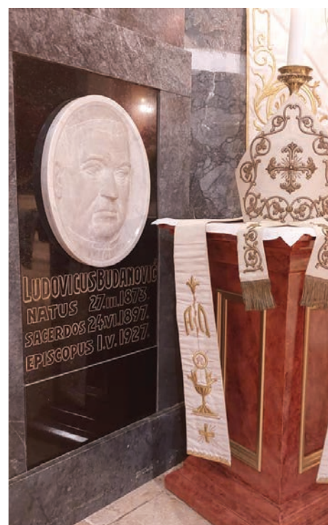
Spomen-ploča Lajči Budanoviću u katedrali