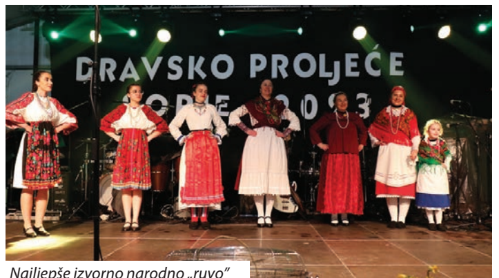
Najljepše izvorno narodno „ruvo“