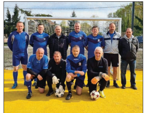
Dravsko proljeće 17. stranica