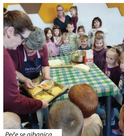
Peče se gibanica