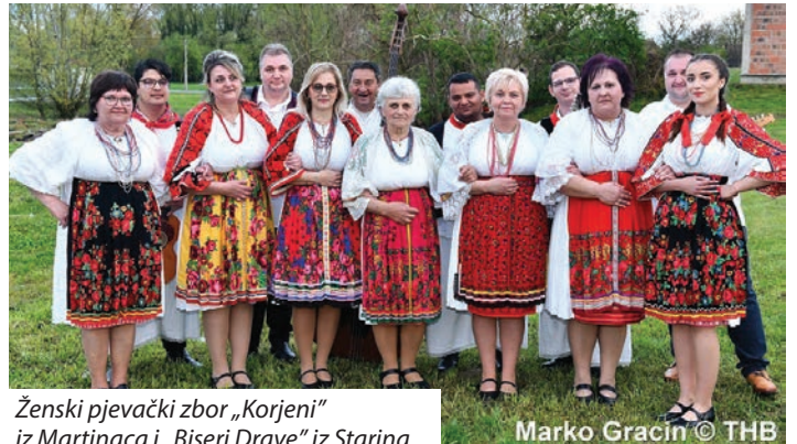
Ženski pjevački zbor „Korjeni“ iz Martinaca i „Biseri Drave“ iz Starina