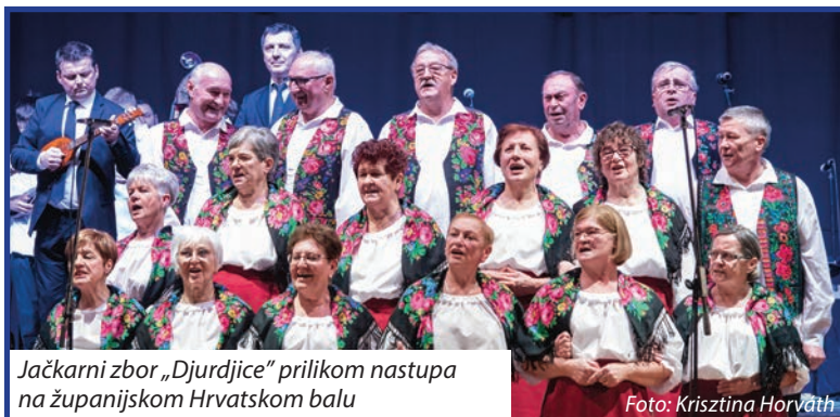
Jačkarni zbor „Djurdjice“ prilikom nastupa na županijskom Hrvatskom balu