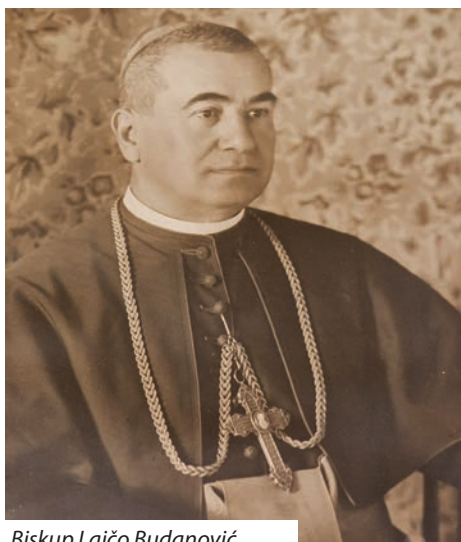
Biskup Lajčo Budanović

U prvom razdoblju istaknuo se svojim svećeničkim, duhovno-pastoralnim radom. Sastavio je molitvenike Slava Božja u molitvama i pismama (1902.), Mala Slava Božja u molitvama i pismama (1907.) i Velika Slava Božja u molitvama i pismama (1908.). Molitvenici su u kratko vrijeme doživjeli nekoliko izdanja, a u nas su u uporabi do danas. Zatim je uslijedilo izdavanje većeg broja drugih molitvenika i nabožnih knjižica.