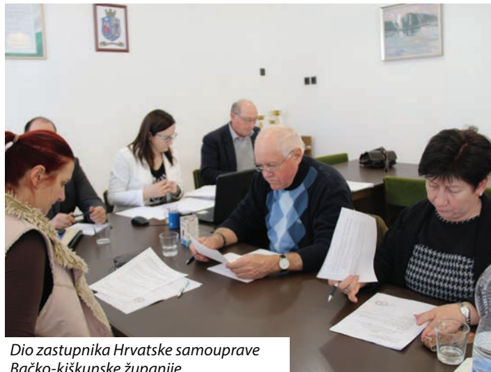
Dio zastupnika Hrvatske samouprave Bačko-kiškunske županije

ribiča 10. lipnja, a hrvatskoj školi u Santovu za podupiranje državnog kampa hrvatskoga jezika u Vlašićima potpora od 50 tisuća forinti. Bilo je riječi i o aktualnim pitanjima, posebno o predstojećim priredbama bačkih Hrvata i državnim programima. Na sjednici je upriličeno i potpisivanje Ugovora o suradnji hrvatskih samouprava u Bačko-kiškunskoj županiji.