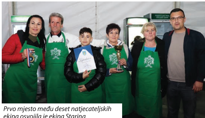
Prvo mjesto među deset natjecateljskih ekipa osvojila je ekipa Starina

Među inima nastupili su i folklorasi iz mađarskog dijela Podravine: Ženski pjevački zbor „Korjeni“ iz Martinaca, „Biseri Drave“ iz Starina i KUD „Podravina“ iz Barče koji je pratio sastav „Misija ViT“ iz Pečuha.