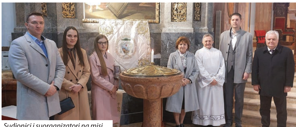
Sudionici i suorganizatori na misi