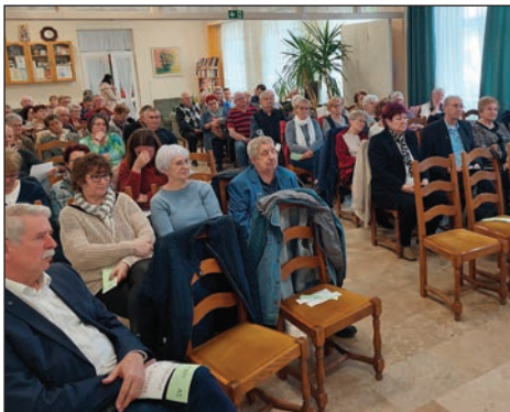
Sjednice Društva Gradišćanskih Hrvatov 3. stranica