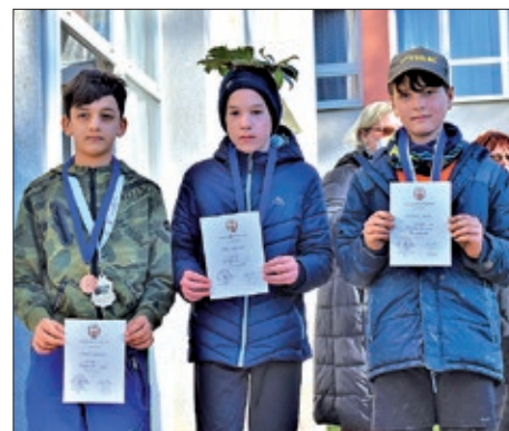
Međunarodna utrka „Mura“