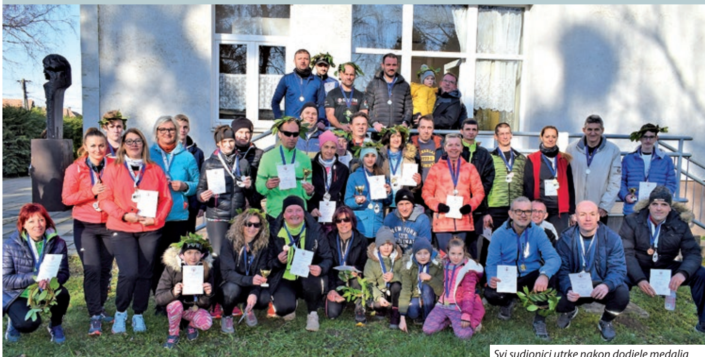
Svi sudionici utrke nakon dodjele medalja

Na međunarodnoj utrci „Mura“ koja je 15. siječnja u Keresturu održana u organizaciji Osnovne škole „Nikola Zrinski“ i Udruge Zrinskih kadeta sudjelovalo je ukupno 96 natjecatelja. Trkači su pristigli iz pomurskih naselja (Bečehela, Letinje, Serdahela, Mlinarca, Fičehaza, Boršfe, Velike Kaniže) i Hrvatske (Preloga, Kotoribe i Hodošana). Trčao se polumaraton, četvrtmaraton i šesnaestina maratona. Cilj utrke bio je okupljanje sportaša i rekreativaca s obje strane Mure u svrhu promoviranja sporta i ljepote prirodnog okoliša, pri čemu je ovaj put izražena i želja da se za nekoliko godina rutom obuhvati i most Kerestur-Kotoriba. Na spomen-medaljama koje su dodijeljene svim sudionicima prikazan je idejni plan budućeg mosta.