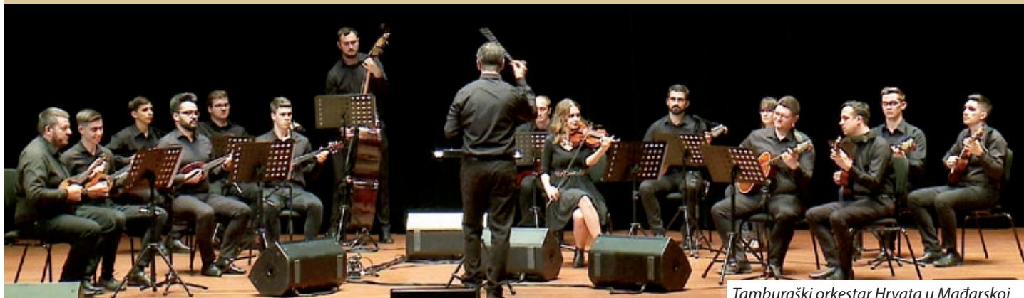
Tamburaški orkestar Hrvata u Mađarskoj