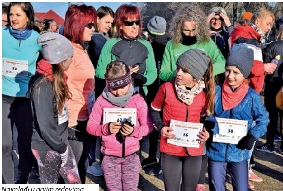
Najmlađi u prvim redovima