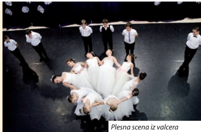
Plesna scena iz valcera