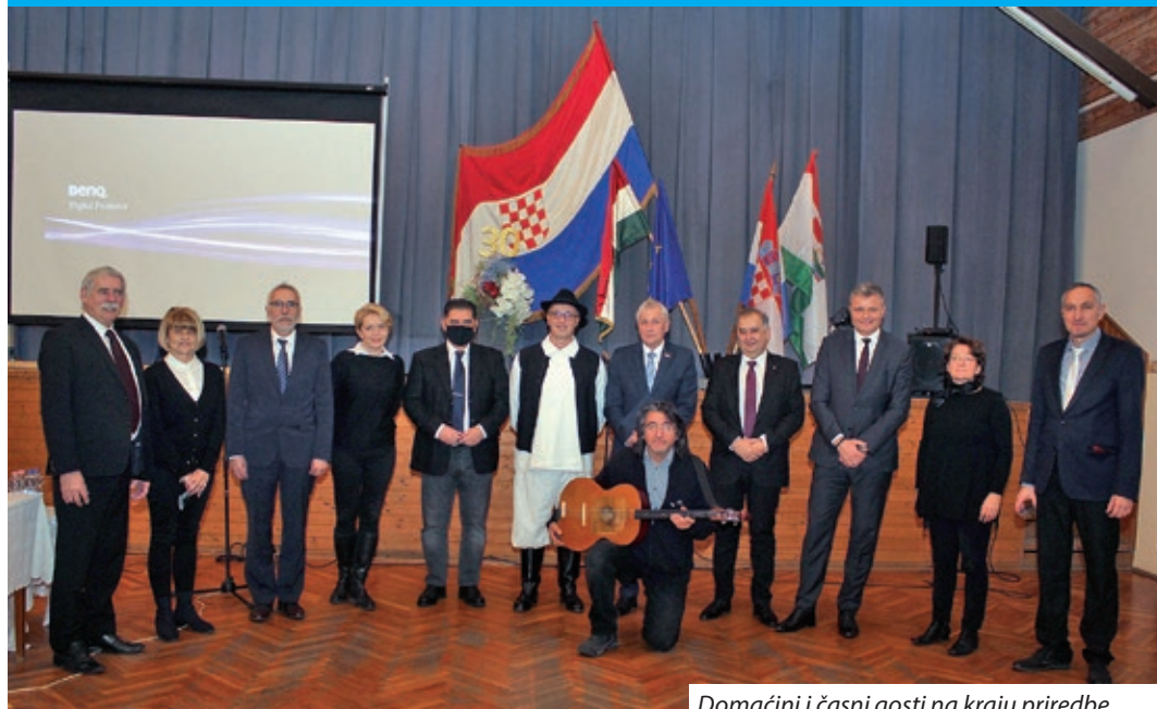
Domaćini i časní gosti na kraju priredbe