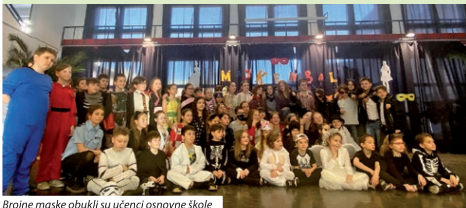
Brojne maske obukli su učenici osnovne škole

Veljača je vrijeme fašnika, odnosno maškara, što je prilika da svatko od nas na barem jedan dan postane netko drugi. Najpoznatiji svjetski karnevali su oni u Brazilu i Veneciji, no i Hrvatska ima dugu tradiciju kada su maškare u pitanju. Maškare su poznate među ljudima i kao poklade te pod to spadaju sve one proslave, karnevali i razni festivali koje tradicijski obilježavaju kostimirani i maskirani ljudi. Maškare i karnevali dio su tradicije, no neki gradovi, pa čak i zemlje, svoj turizam djelomično baziraju na tim događajima te za njih pripremaju razne priredbe i sadržaje, ples pod maskama i slično. Kažu da su maškare peto godišnje doba godine. Za vrijeme maškara, neovisno o dobi, maskiraju se svi i šalju poruku društvu. Prve asocijacije kad spomenemo maškare/fašnike/karnevale su maske, kostimi, ulične povorke, krafne (ili fritule u Dalmaciji), smijeh, ples i zabava. U svakom slučaju, to je doba kada svi uživamo, posebice djeca. Pitamo se zašto volimo vrijeme maškara i karnevala? Zato jer u to doba možemo biti druga osoba, naš omiljeni lik, naš superjunak.