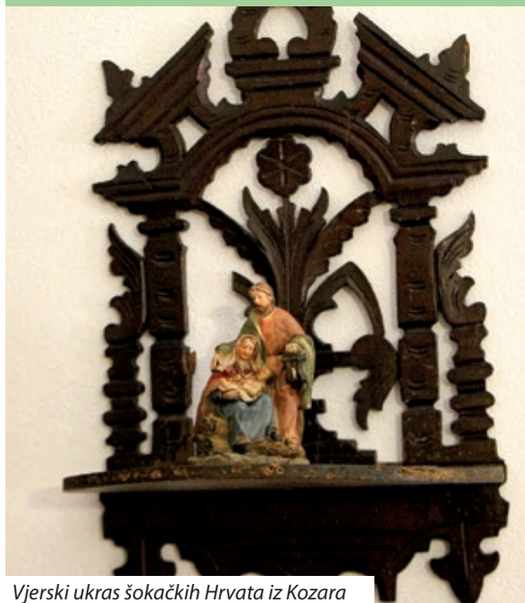
Vjerski ukras šokačkih Hrvata iz Kozara