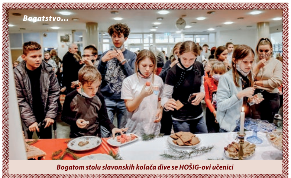
Bogatom stolu slavonskih kolača dive se HOŠIG-ovi učenici