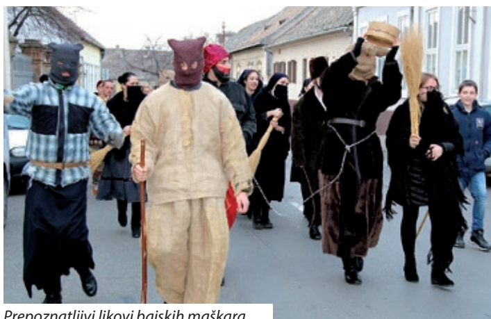
Prepoznatljivi likovi bajskih maškara