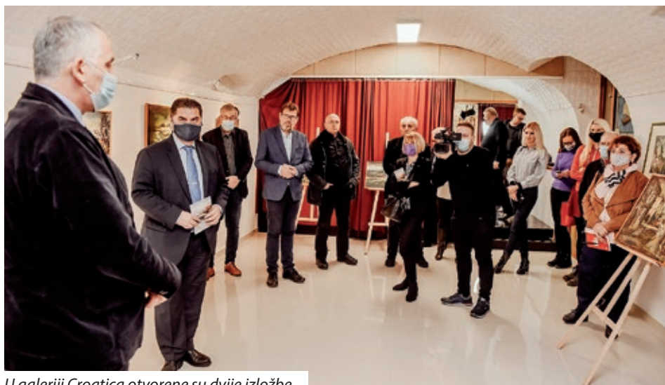
U galeriji Croatica otvorene su dvije izložbe