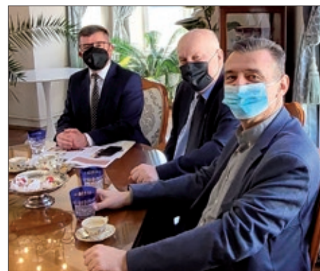
Jačanje prekograničnih veza