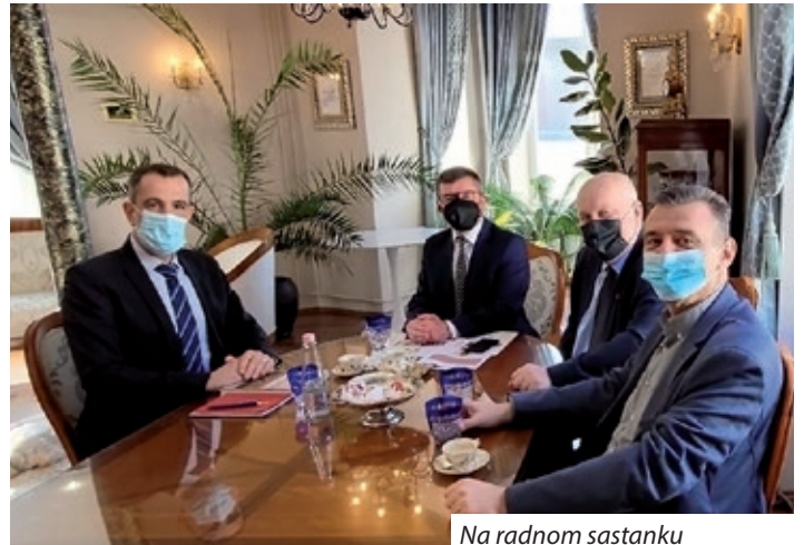
Na radnom sastanku

važnost suradnje onih naselja s obje strane Mure i Drave u kojima žive pripadnici hrvatske i mađarske narodnosti. Međimurska županija pomurske je Hrvate oduvijek smatrala svojim partnerima, a hrvatska naselja imaju živu suradnju s međimurskim općinama (Serdahel-Goričan i Donji Vidovec, Kerestur-Kotoriba, Donja Dubrava, Mlinarci-Donja Dubrava, Petriba-Ivanovec, Sumarton-Sveta Marija itd.) pa nije ni slučajno što je Međimurska županija utemeljila Mješoviti odbor za suradnju s pomurskim Hrvatima. Osim toga općine s dvije strane granice objedinjuje i