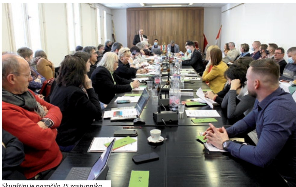
Skupštini je nazočilo 25 zastupnika

Skupština je na sjednici usvojila odluku o raspisivanju natječaja za popunu radnog mjesta ravnatelja Hrvatskog vrtića, osnovne škole i učeničkog doma Santovo. Raspisat će se natječaj na rok od pet godina, s početkom radnog odnosa od 12. kolovoza. Rok za prijave je 10. ožujka 2022. godine, a