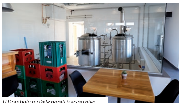
U Dombolu možete popiti izvrsno pivo

2011. godine u Dombolu živi 208 Mađara, 28 Roma i 47 Hrvata. Zanimljivo je kako je prema podacima iz 1910. godine u Dombolu živio 601 stanovnik, od toga 599 Mađara i dva Nijemca. Dombol je bio posjed grofova Erdődy čiji je dvorac danas sjedište Ekumenske humanitarne organizacije i privremeni dom za nezbrinute obitelji. Nekada je davno bilo i škole, a stanovništvo se bavilo uzgojem goveda. Neki to čine i danas.