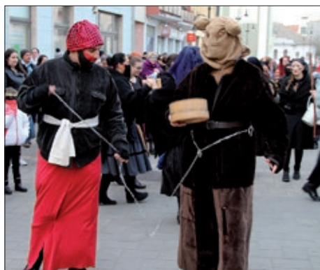
I u Baji otjerana zima