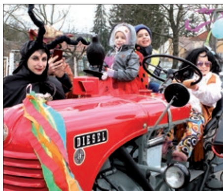
Židanski fašenjак – „Ča ste vi, toga nij!”