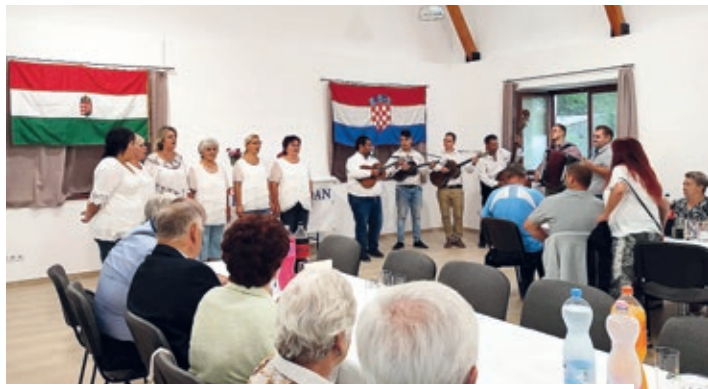
Ženski pjevački zbor „Korjeni“ i Tamburaški sastav „Biseri Drave“