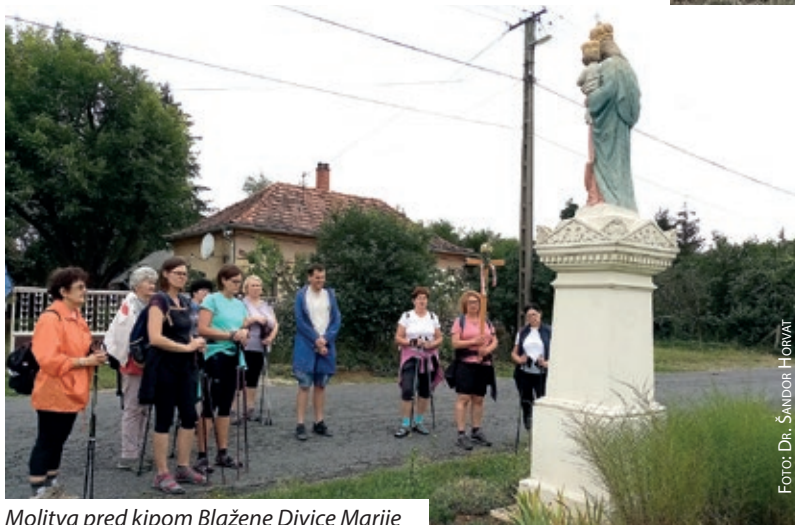
Molitva pred kipom Blažene Divoce Marije