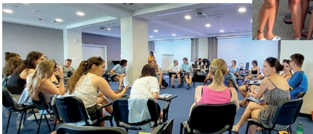
Na zanimanju

I zopet najzad k ljetu jer doživljaji se ne zabu, poznanstva cvatu, a spominki dalje živu u pominkanju, na druženju. Krajem julija Petroviščani i Židanci otputovali su u Crikvenicu na seminar hrvatskoga jezika u organizaciji Hrvatskoga akademskoga kluba iz Austrije. Na jednotajednom usavršavanju iz četirih zemalj (Austrije, Ugarske, Slovačke i Hrvatske) mladi Gradišćanci nisu samo vježbali jezik dopodne (mogli su izbirati med gradišćansko-hrvatskim i hrvatskim standardnim jezikom), otpodne su se skupa zabavljali, išli na izlete i pravoda su najbolje ishasnovali mogućnosti sunca i morja. Sve skupa četrdeset i četirmi odazvali su se pozivu i izrazili želju da kanu biti diozimatelji ovoga drugoga projekta „Jezik prez granic“, uz potpiranje EU programa „Erasmus plus“ ki je lani bio održan u Za-