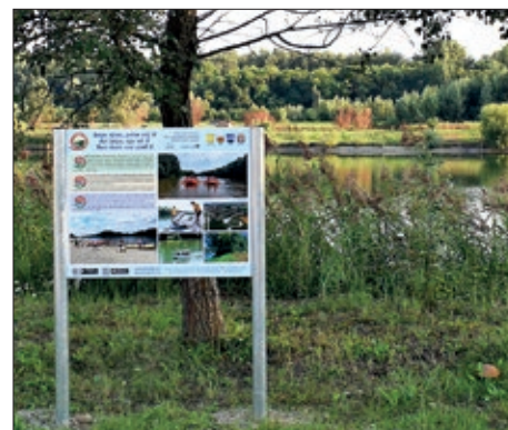
Dvije rijeke, jedan cilj