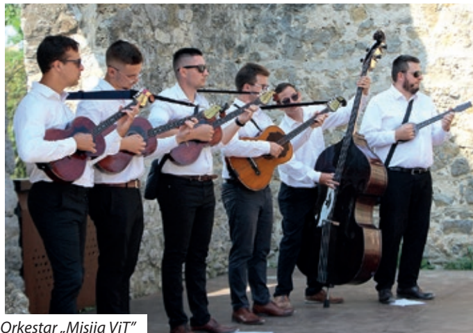
Orkestar „Misija ViT“