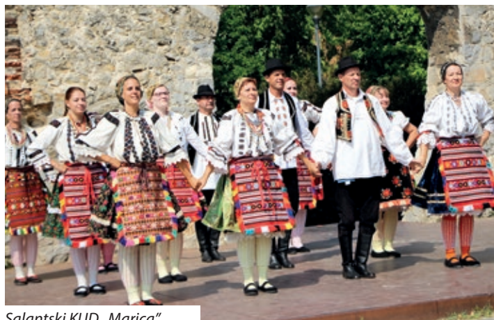
Salantski KUD „Marica“

misa na hrvatskom jeziku te prepuna crkva. Dokazuju to i redovita mjesečna okupljanja na molitvenom satu svakog 13. dana u mjesecu. Zaželio je da još godinama nastanjujemo crkvu i molimo se na materinskom hrvatskom jeziku, pozivajući sve i na milodare kojima se popravlja i uređuje crkva i njezin okoliš.