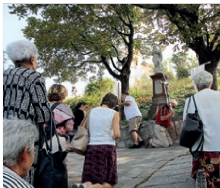
Kermez kod Snježne Gospe