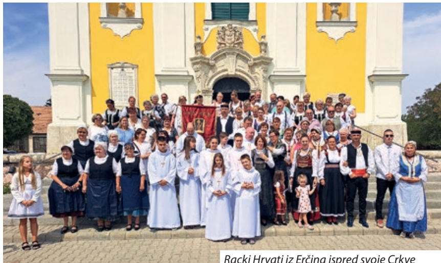
Racki Hrvati iz Erčina ispred svoje Crkve

I ovogodišnje misno slavlje okupilo je brojne vjernike od kojih su mnogi došli u tradicionalnoj narodnoj nošnji. Ovom hodočastičkom mjestu utječu se i Hrvati iz Tukulje, Andzabega i drugih mjesta na misnim slavljima i zajedničkoj molitvi. Poslije misnih slavlja često slijedi mimohod sa starodrevnom erčinskom zasta-