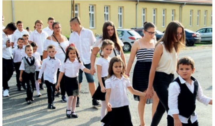
Prvaši, učenici osmog razreda i roditelji polaze na školsku svečanost