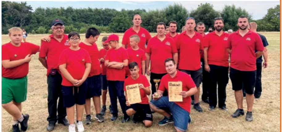
Dobrovoljno ognjobrantsko društvo Unda

KERESTUR – Kerestursko Dobrovoljno vatrogasno društvo utemeljeno je davne 1888. godine, još u doba Austro-Ugarske, kad su se mjesta s jedne i druge strane Mure složila i tako utemeljila društvo za zaštitu od požara. U tome su sudjelovali i Kotoripčani, Donjodubravčani i Svetomarijanci. Nakon društvenih promjena vatrogasno se društvo obnovilo i od 1995. godine djeluje kao udruga. Kerestursko Dobrovoljno vatrogasno društvo i danas ima vrlo dobru suradnju s međimurskim vatrogasnim društvima. U sklopu te suradnje keresturski su vatrogasci u kolovozu sudjelovali na Međunarodnom natjecanju sa zaprežnim špicama u Svetoj Mariji i družili se s kolegama iz tog međimorskog mjesta.