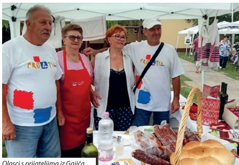
Olasci s prijateljima iz Gajića