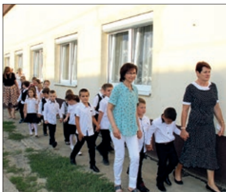
Otvorenje školske godine u Santovu