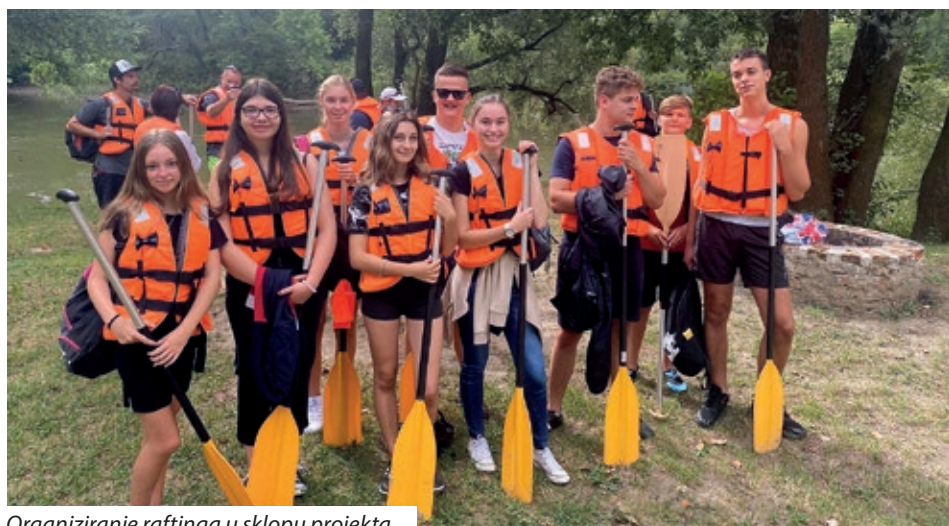
Organiziranje raftinga u sklopu projekta