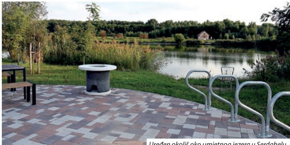
Uređen okoliš oko umjetnog jezera u Serdahelu

U sklopu projekta „Dvije rijeke, jedan cilj II.“ u dvjema općinama ostvarene su veće investicije: u Goričanu su izgrađeni i uređeni turistički objekti na ribnjaku Šuderića (uređena je infotočka za turiste, izložbeni i interpretacijski centar, odmorište za bicikle te tzv. smart-bike point koji sadržava osnovne informacije o biciklističkim rutama), a u Serdahelu je nadograđeno postojeće umjetno jezero. Oko jezera postavljena su mjesta za odmaranje za turiste i bicikliste, izgrađena je asfaltirana biciklistička staza oko jezera te postavljena pametna solarna biciklistička točka. Mađarski je partner osim navedenog organi-