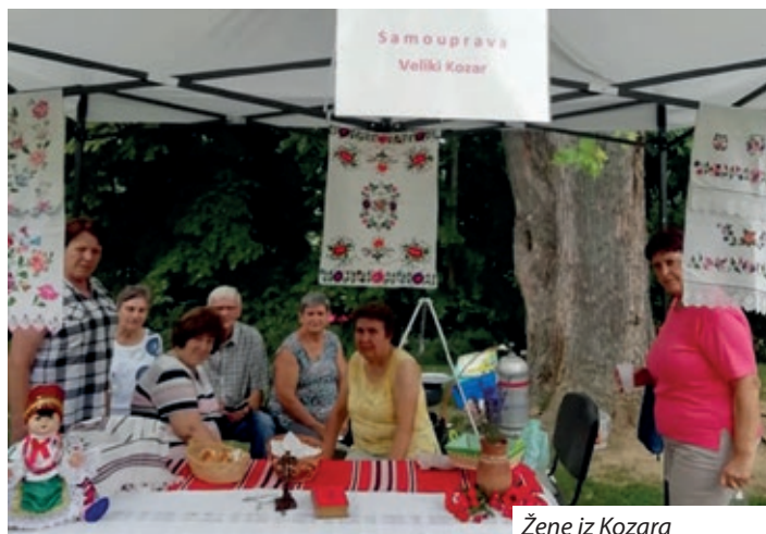
Žene iz Kozara