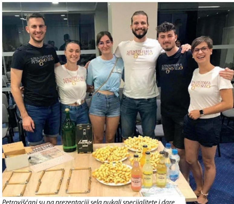
Petroviščani su na prezentaciji sela nukali specijalitete i dare