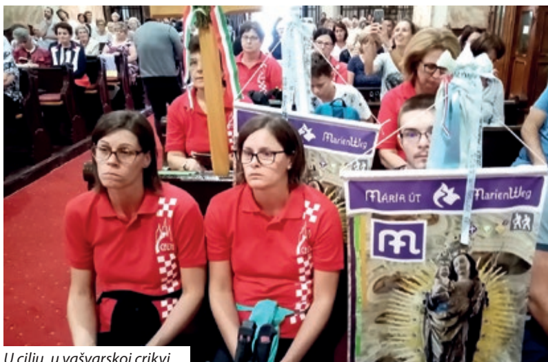
U cilju, u vašvarskoj crikvi