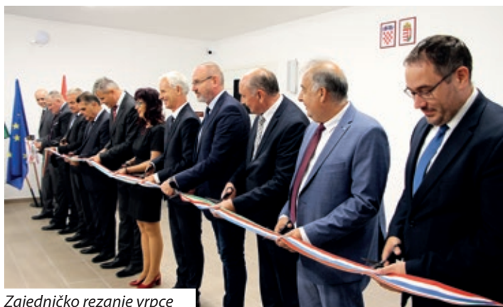
Zajedničko rezanje vrpce

već 75 godina važno središte odgoja i obrazovanja za Hrvate u ovom dijelu Mađarske. Pri tome je naglasio da postoji mišljenje kako je za razvoj i status manjinske zajednice najvažniji odnos većinskog naroda prema manjinskom: „Hvala Bogu, kako ovdje u Mađarskoj, tako i u Hrvatskoj taj je odnos skladan, dinamičan i pozitivan, a to hrvatskoj zajednici u Mađarskoj i mađarskoj zajednici u Hrvatskoj daje priliku da neguju sve ono po čemu se prepoznaju – kulturu, tradiciju i jezik – sve ono što čini njihov identitet.” Uz već postojeću podršku najavio je i nastavak skrbi matične zemlje o Hrvatima izvan Hrvatske te govorio o daljnjim zajedničkim projektima s Hrvatskom državnom samoupravom koji će biti usmjereni na mlade, na budućnost hrvatskih zajednica izvan Hrvatske.