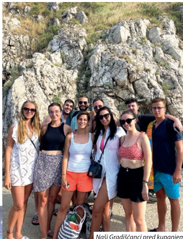
Naši Gradišćanci pred kupanjem