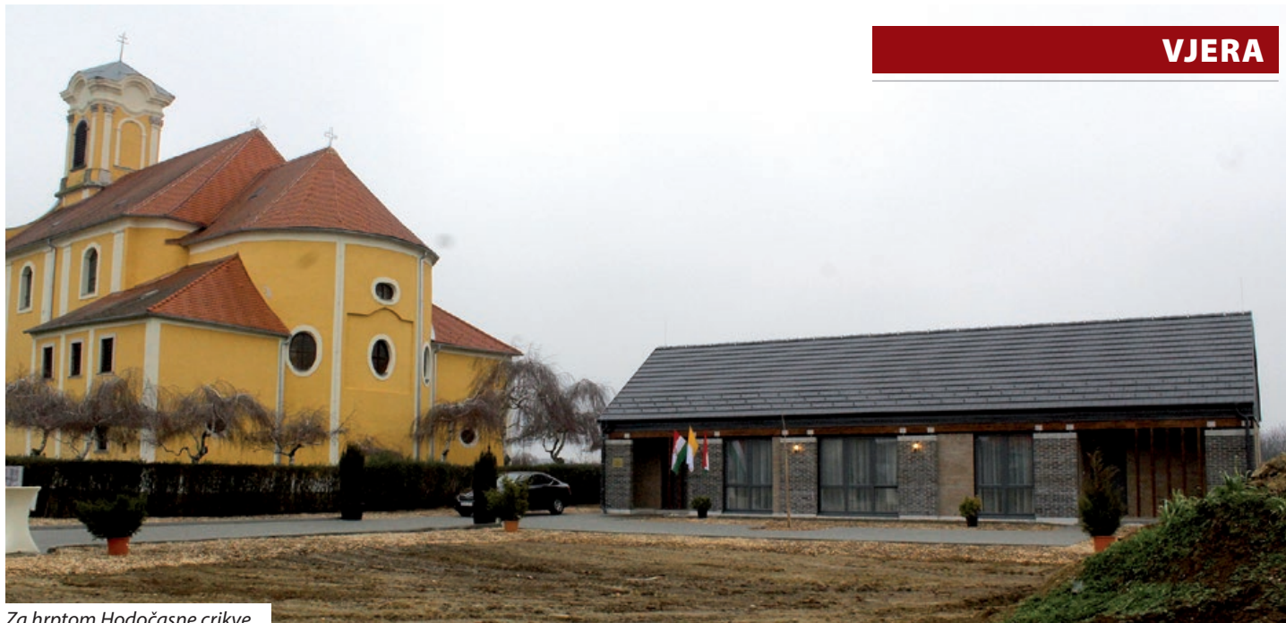
Za hrptom Hodočasne crikve