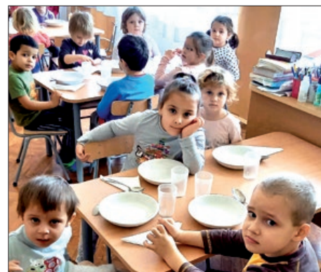
Martinci se razvijaju 12. stranica