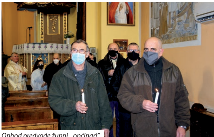
Ophod predvode župni „općinari“

Tako je i u Santovu gdje je uz pridržavanje epidemioloških mjera, u nazočnosti šezdesetak vjernika u maskama, u župnoj crkvi Uznesenja Blažene Djevice Marije 2. veljače proslavljen blagdan Svijećnice ili Prikazanje Gospodinovo u Hramu. Svijećnica se u Santovu naziva i Marindan (od Marijin dan), a u povodu tog blagdana od kraja 19. stoljeća održava se i tradicionalni Marin-danski bal.