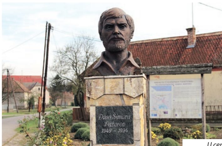
U centru sela

Volimo Program „Mađarsko selo“, jer je natječajna procedura jednostavna, isplate su brze, rekao nam je načelnik Martinaca, dodajući kako radovi na seoskom groblju još nisu počeli, ali će dolaskom boljeg vremena krenuti i oni.