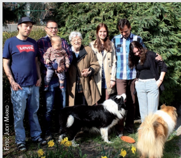
Na proslavi 89. rođendana u krugu unučadi i prauučadi, 28. ožujka 2019.