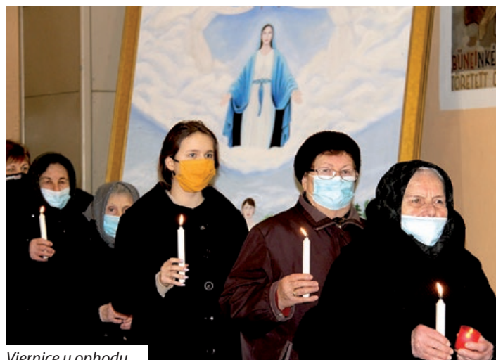
Vjernice u ophodu