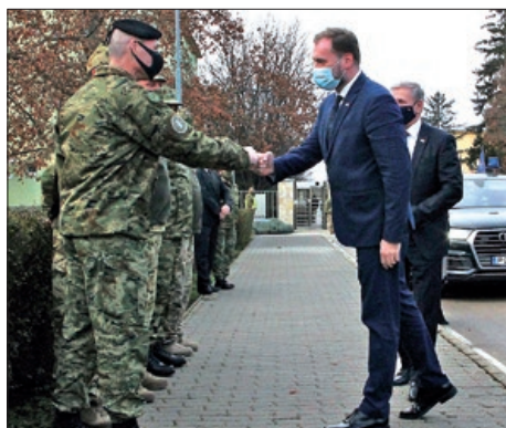
Ministar Banožić u posjetu Mađarskoj 3. stranica