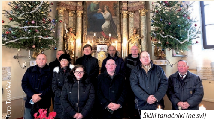
Šički tanačniki (ne svi)

ju, gledeć crikvene, a i interese farske općine. Prva sjednica Farskoga tanača slijedi u ovom misecu.