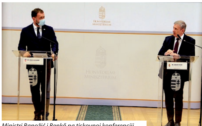
Ministri Banožić i Benkő na tiskovnoj konferenciji

U prijedodnevnom satima u budimpeštanskoj palači Stefánia ministar obrane Republike Hrvatske Mario Banožić u pratnji načelnika Glavnog stožera Oružanih snaga Republike Hrvatske admiral Roberta Hranja sudjelovao je u prvom bilateralnom sastanku s mađarskim ministrom obrane Tiborom Benkőom. Na sastanku je potvrđena izvrsna suradnja dviju susjednih zemalja u području obrane: višegodišnja dobra suradnja redovito se odvija u okviru Europske unije i NATO saveza, a multilateralno kroz regionalnu inicijativu Srednjoeuropske obrambene suradnje, Centar za sigurnosnu suradnju i Multinacionalno divizijsko zapovjedništvo – Centar, Multinacionalno središte za obuku specijalnih zračnih snaga te Regionalno zapovjedništvo komponente specijalnih snaga. Na bilateralnoj razini suradnja se odvija kroz zajedničke