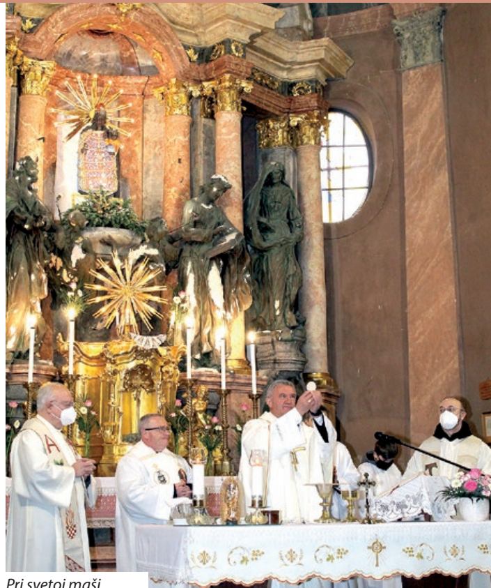
Pri svetoj maši