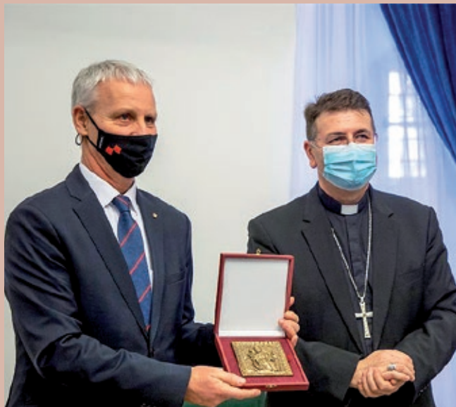
Biskup Šaško uručio prigodni poklon državnom tajniku Soltészu

Pomoćni biskup zagrebački mons. Ivan Šaško susreo se 14. siječnja 2021. u prostorijama Nadbiskupskog duhovnog stola s državnim tajnikom za vjerske i narodnosne odnose Ureda predsjednika Mađarske Vlade Miklósom Soltészom. Susretu je nazočio i predsjednik HDS-a Ivan Gugan, koji je bio u delegaciji državnog tajnika Soltésza za njegovog službenog posjeta 13.-14. siječnja u Republici Hrvatskoj.