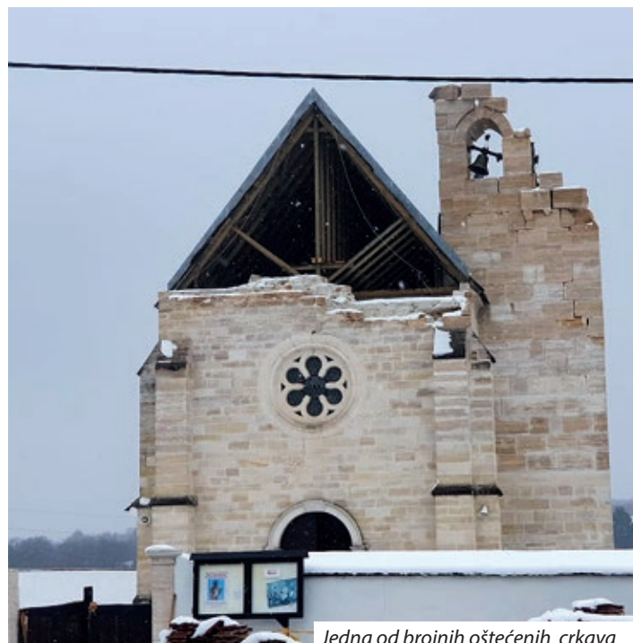
Jedna od brojnih oštećenih crkava