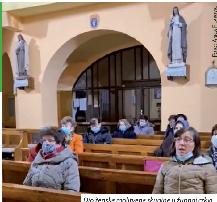
Dio ženske molitvene skupine u župnoj crkvi