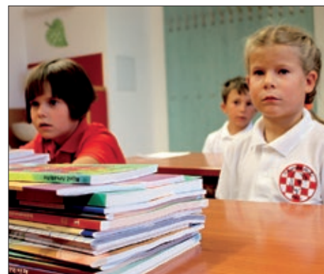
U školi Miroslava Krležje završeno prvo polugodište