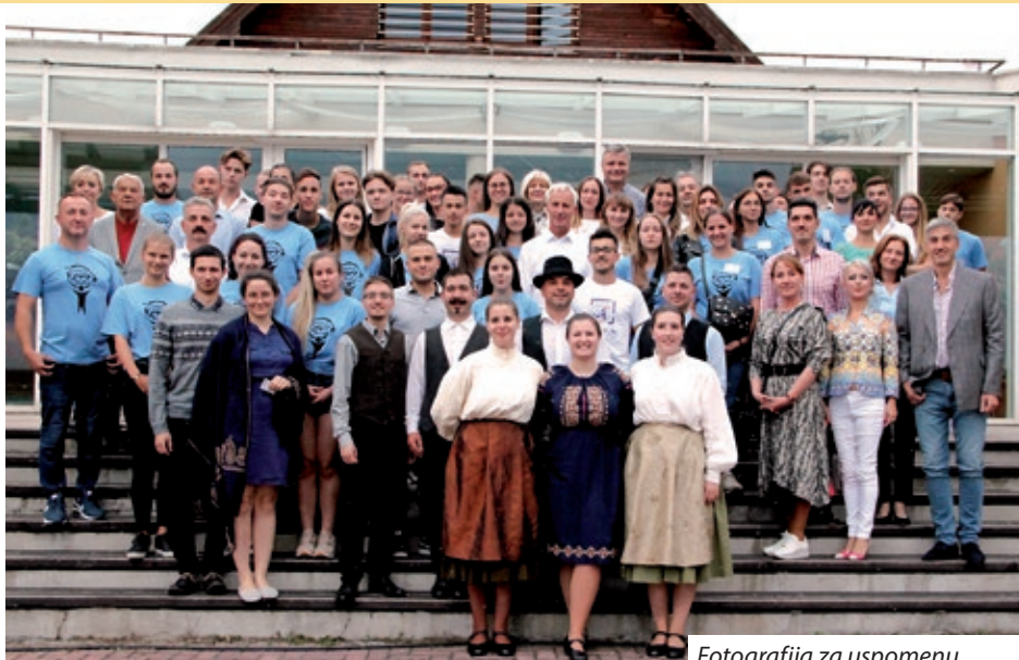
Fotografija za uspomenu