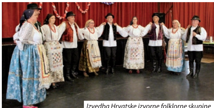
Izvedba Hrvatske izvorne folklorne skupine

skom samoupravom Starog Budima-Békásmegyera započela je seriju predavanja o povijesti i kulturi hrvatskih subetničkih skupina u Mađarskoj, koje se nastavljaju i ove godine, a sljedeća se održava 16. rujna. Na njegov poticaj u Baji su oživjele maškare, stari običaj bunjevačkih Hrvata, koje su lani organizirali Hrvatska samouprava i Grad Baja. Hrvatska samouprava Novoga Budima na tu je priredbu omogućila poseban autobusni prijevoz. Ljeti je Hrvatska samouprava Budimpešte organizirala stručno putovanje u Hrvatsku u kojem je sudjelovala i zastupnica Ildikó Vidák. Predsjednik dr. Dinko Šokčević u nastavku je najavio programe i priredbe koje samouprava ostvaruje u suorganizaciji s pojedinim budimpeštanskim hrvatskim samoupravama, primjerice Hrvatski nogometni turnir „In memoriam Stipan Pančić“ i Hrvatski piknik na kojem sudjeluje i nogometna momčad prijateljskog grada Trogira, te književnu večer povodom 100. obljetnice rođenja najvećeg mađarskog pjesnika 20. stoljeća Jánosa Pilinszkyja koja će se održati 4. listopada u klubu Fészek s početkom u 19 sati. Stihove na hrvatskom i mađarskom jeziku kazuju hrvatski glumci Čarna Kršul, Marica Facskó i Stipan Đurić. Stihovi na hrvatskom jeziku čitat će se iz zbirke izabranih pjesama Jánosa Pilinszkyja „Čovjek je ovdje nedostatan za ljubav“ (Az ember itt kevés a szeretetre) u prijevodu dr. Dinka Šokčevića, koju je 2016.