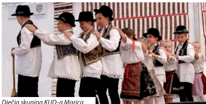
Dječja skupina KUD-a Marica

Kulturni program se odvijalo u šatoru na dvorištu mjesnog doma kulture, uz nazočnost načelnice Gabriele Hitre i brojnih mještana. Bio je veoma intiman i hrvatskog sadržaja. Glazbeni uvod dao je pečuški Orkestar „Vizin“ koji je stalni i prateći orkestar društva na njegovim nastupima. Slijedili su mali plesači, polaznici hrvatskoga kulturno – jezičnog kampa koji godišnje organizira