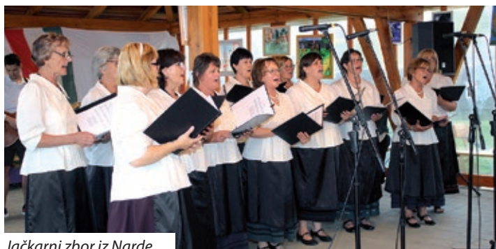
Jačkarni zbor iz Narde