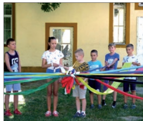
II. Hrvatski državni vjerski kamp 8. – 9. stranica