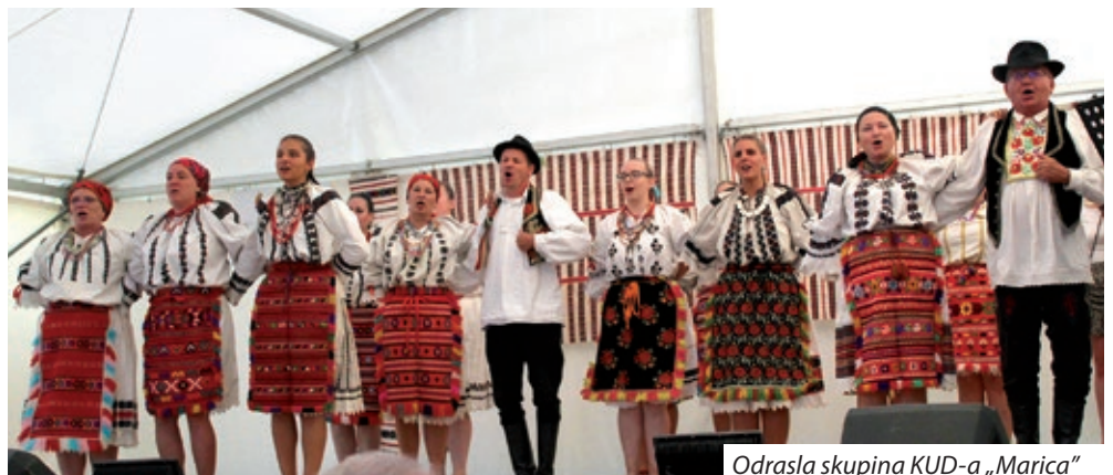
Odrasla skupina KUD-a „Marica“