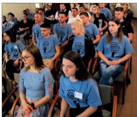
Susret narodnosne mladeži 4. stranica