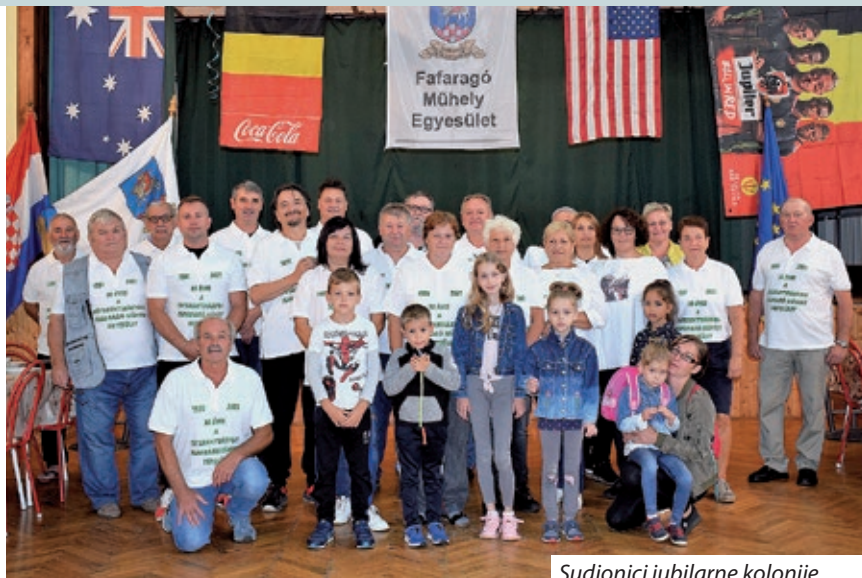
Sudionici jubilarne kolonije

„U početku smo se bavili isključivo drvorezbarstvom. To sam počeo raditi slučajno: naime, kako sam otac troje djece, uvijek sam bio aktivan oko crkve, bilo što je trebalo raditi, ja sam bio tamo. Kod crkve sam našao jedno malo zvono koje je služilo još u ono vrijeme dok nisu obnovili originalno zvono oštećeno u Drugom svjetskom ratu. Onda sam pitao mjesnog župnika bismo li mogli malo zvono postaviti u vinogradu. Za ovo zvono smo počeli izrađivati drveni okvir i kip svetog Urbana, bilo nas je više koji smo tada zavoljeli drvorezbarski posao. Inače, prije toga sam već