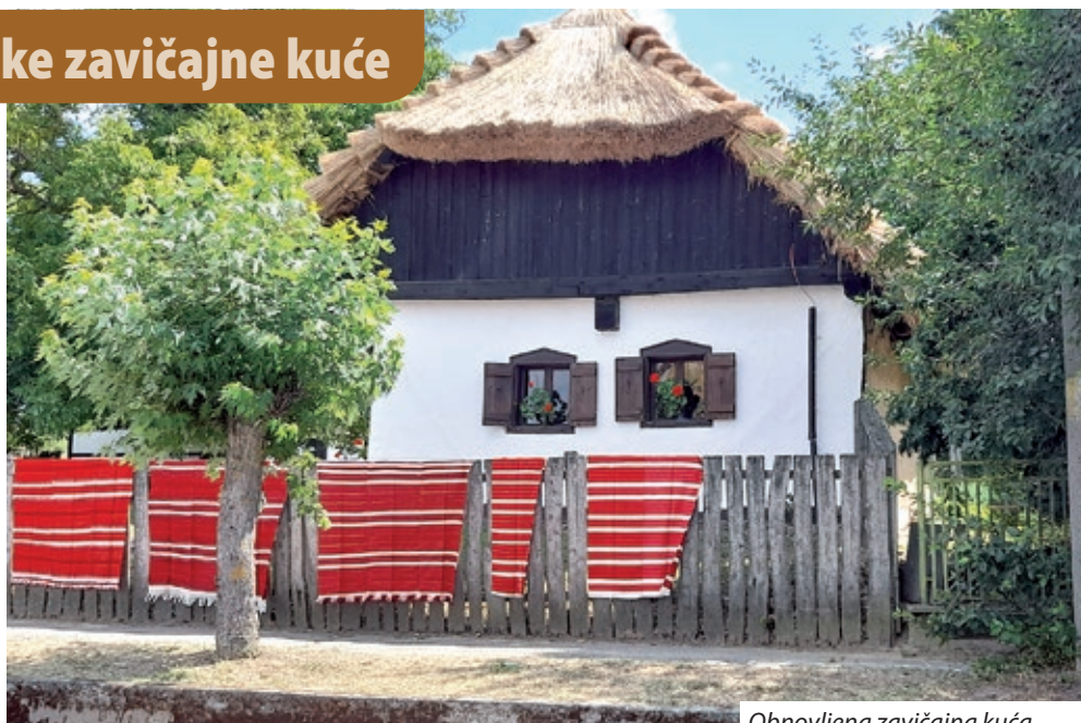
Obnovljena zavičajna kuća