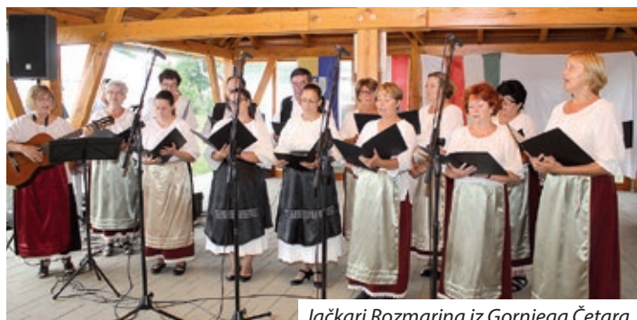
Jačkari Rozmarina iz Gornjega Četara