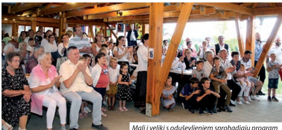
Mali i veliki s oduševljenjem sprohadjaju program