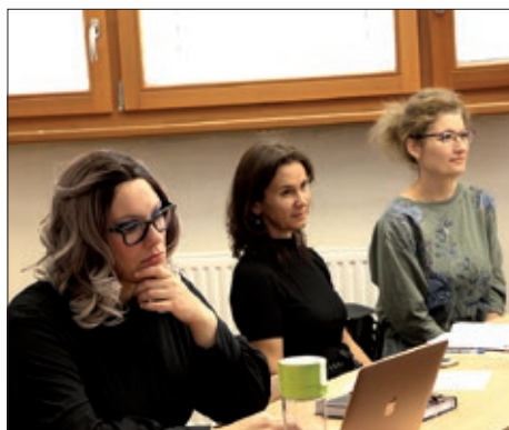
Usavršavanje za srednjoškolske profesore 3. stranica