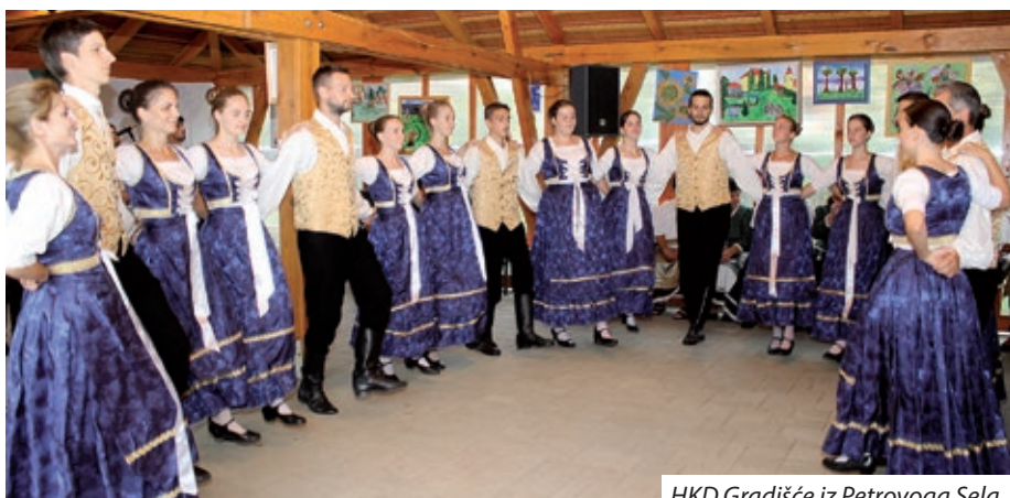
HKD Gradišće iz Petrovoga Sela