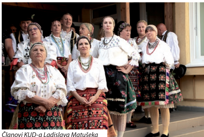
Članovi KUD-a Ladislava Matušeke

Koncert je održao Miklós Szilasi, a mogla se pogledati i izložba romske, hrvatske i mađarske narodne nošnje, uz izložbu „bebki“ u istima, u organizaciji Udruge „Napforduló“ iz Semartina. Napo-