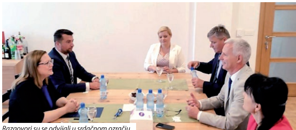
Razgovori su se odvijali u srdačnom ozračju