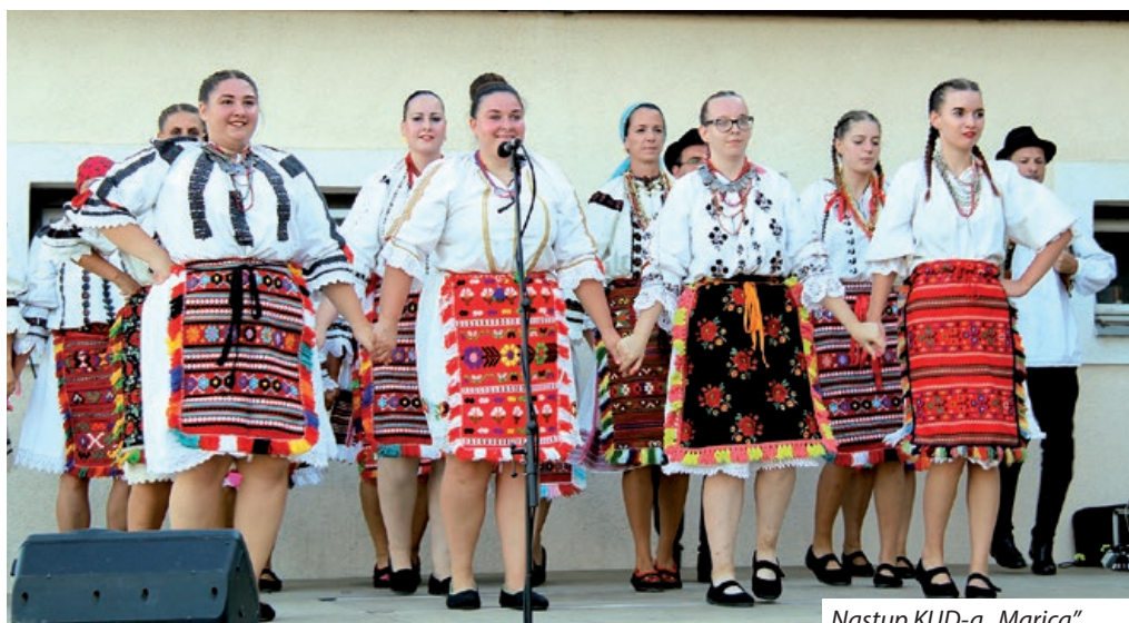
Nastup KUD-a „Marica”