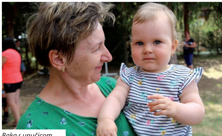
Baka s unučicom