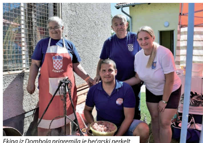
Ekipa iz Dombola pripremila je bečarski perkelt