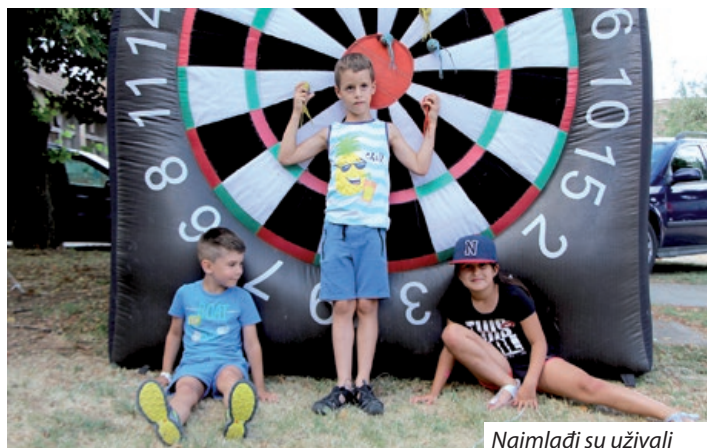
Najmlađi su uživali