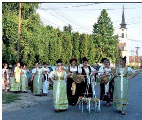
Dužijanica u Čavolju