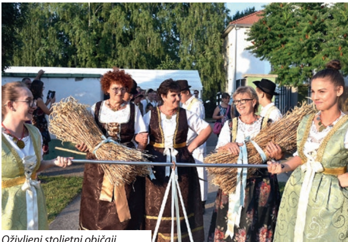
Oživljeni stoljetni običaji

Oživjeli smo staru tradiciju, žetvu pšenice, našu „Dužijancu“.