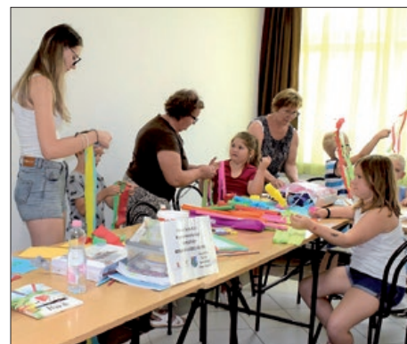
Hrvatski kamp tradicija u Pustari