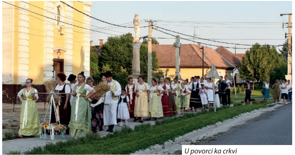
U povorci ka crkvi