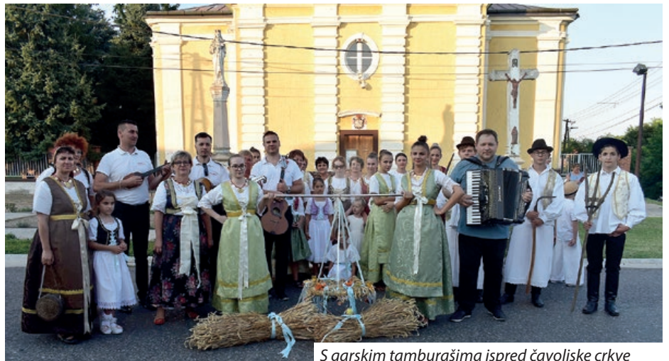
S garskim tamburašima ispred čavoljske crkve

Svi su se „lipo“ zabavili, jer je sve bilo dobro, bilo je tu i masnog kruha s crvenim lukom, a piće je osigurala mjesna gostiona.