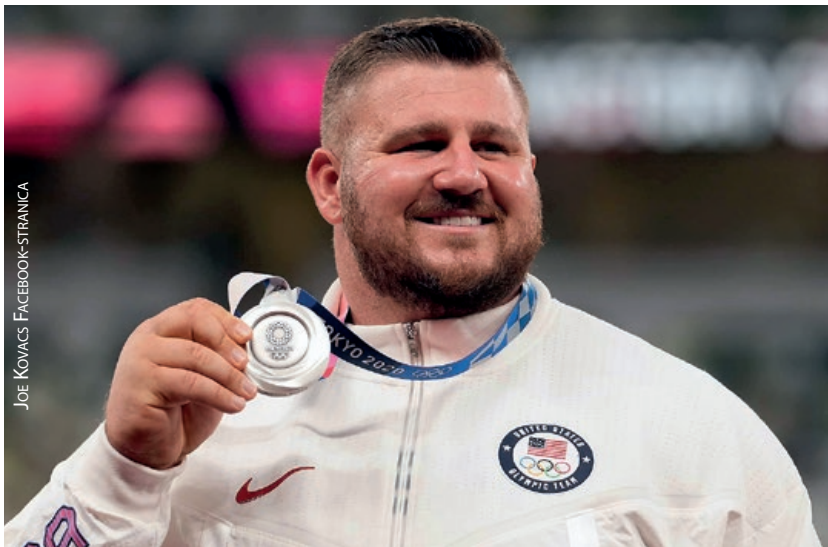
JOE KOVACS FACEBOOK-STRANICA

Njev nukić Joe ima brojne zvanaredne športske rezultate, svitski prvak je bio (2015, 2019.) srebrnu medaliju je dobio na svitskom prvenstvu (2017), a vlasnik je olimpijskoga srebra ovput, kot i pred petimi ljeti. Iako Joe se jur ne pomina na jeziku dide, sa svojim bratići u Petrovom Selu drži kontakte i iz