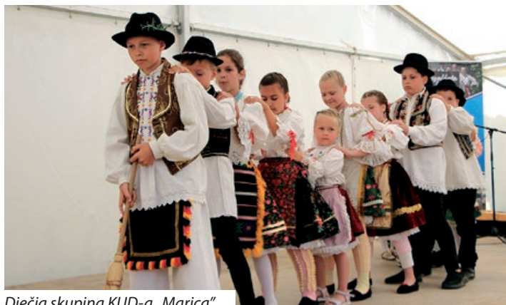
Dječja skupina KUD-a „Marica“