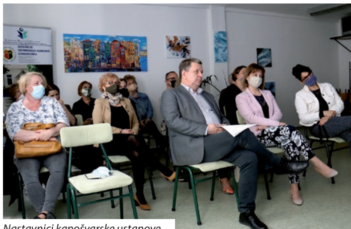
Nastavnici kapošvarske ustanove