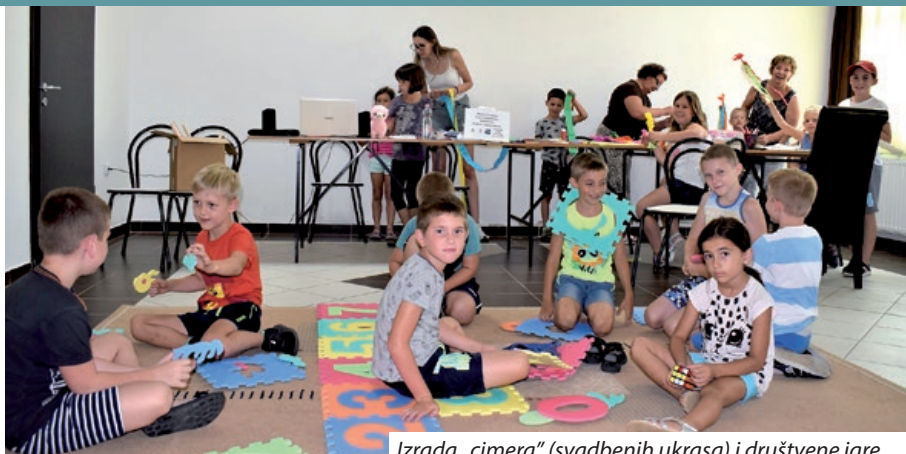
Izrada „cimera“ (svadbenih ukrasa) i društvene igre

Pustara je pravo mjesto za održavanje kampa, raspolaže raznim sportskim terenima (za odbojku na pijesku, nogomet, mali nogomet, stolni tenis), na javnoj površini smješteni su roštilj i krušna peć, a u slučaju loših vremenskih prilika programi se mogu održavati u modernom, dovoljno prostranom kulturnom domu. Naselje nema nijednu odgojno-obrazovnu ustanovu pa stoga pokušava stvoriti uvjete za razne sportske i kulturne aktivnosti, koje mještanima omogućuju druženje. Dječji kampovi također uvelike doprinose zajedništvu mjesta, pa organizatori uvijek nude bogat program. Veći dio sudionika uopće ne govori hr-