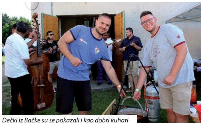
Dečki iz Bačke su se pokazali i kao dobri kuhari

Blažetin održali su predavanja povodom 20. godišnjice neprofitnog d.o.o. Croatia i 30. godišnjice Hrvatskoga glasnika. Osvrnuli su se na okolnosti utemeljenja, odnosno pokretanja lista, te njegov razvoj sve do pojavljivanja na novim platformama, od tiskanog izdanja do mrežne stranice, društvenih mreža te internetskih radijskih i televizijskih emisija. Na kraju predavanja generalni konzul Republike Hrvatske u Pečuhu Drago Horvat čestitao je ravnatelju i glavnoj urednici na obljetnicama, a isto tako i čelnicima Hrvata u Mađarskoj, koji stoje iza svojih institucija i brinu se o njihovom nesmetanom radu, pridodavši da trebaju