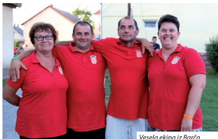
Vesela ekipa iz Barča

„Mi, Martinački Hrvati radujemo se kada održavamo priredbe i možemo ugostiti sudionike, za što se ozbiljno pripremamo. Imamo puno toga za pokazati, naše običaje i tradiciju na koju smo ponosni. Veseli nas kad se gosti kod nas osjećaju dobro, stoga smo već rano ustale i pripremile kolače, slane i slatke, a sada kuhamo gulaš s našom ekipom, među kojima su i članice zbora te predstavnice hrvatske samouprave”, rekla nam je vodi-