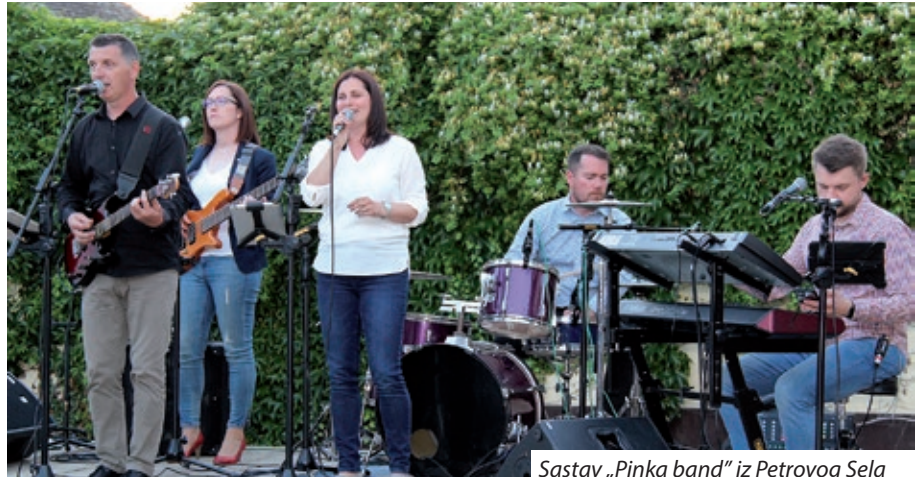
Sastav „Pinka band“ iz Petrovog Sela