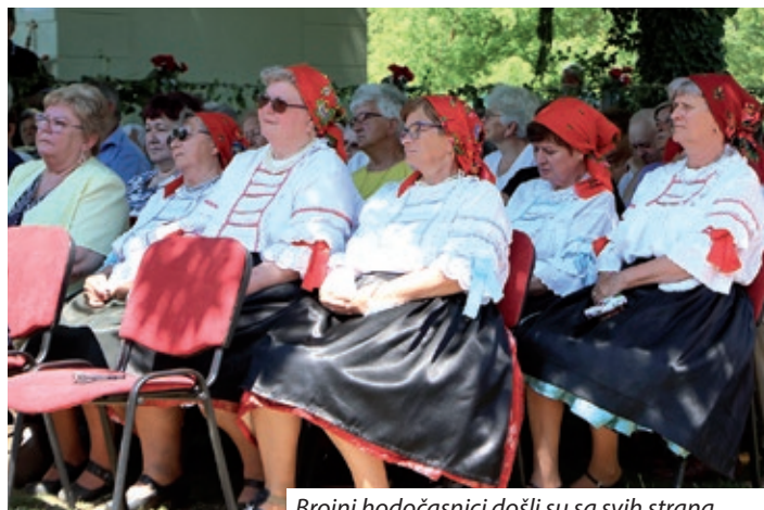
Brojni hodočasnici došli su sa svih strana

Da se u pustinji ljudskoj, ljudskog života spasimo od ugriza paklene zmije i mi moramo promatrati križ probodenog Srca. Uprimo svoj pogled braćo i sestre. Vjerujemo u ljubav, to je poruka današnje svetkovine Presvetog Srca Isusova. Ljubav. Pitamo se. Koliko vrijedi naše srce, je li ono dobro ili zlo. Kako pred Bogom izgleda. Je li s njim zadovoljan ili mu je odvratno. Pred Bogom vrijedi samo ono i onaj koji nasljeđuje Srce bez premca. Srce Isusovo. Isus je odgovor. Na kraju svih blagdana sve smo saželi u jedan dan, dan Presvetog Srca Isusova. Jednim danom i jednom riječju da kažemo Bogu: hvala ti za svoju Ljubav, za svoje Srce, hvala ti za svoga Sina“, rekao je mons. Srakić, dodavši „Bog je Ljubav koja nema granica. Granica je naše srce, koje prima neograničenog Boga u znak zahvalnosti za ono što je on učinio koji je stvorio čovjeka i posvetio ga duhom svetim. Amen.“