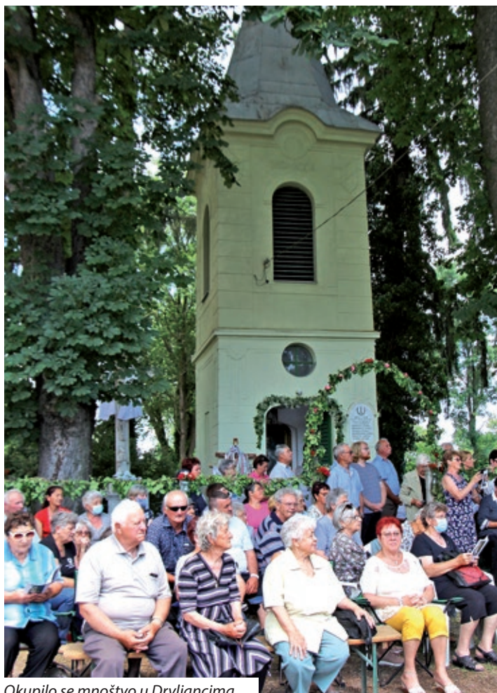
Okupilo se mnoštvo u Drvljancima

ne djece u crkvi i obično su galamila, pa su uveli da pjevaju gore narečenu pjesmu, i odjekivala je crkva dječjom pjesmom. U svojim propovijedima svećenik bi nerijetko zagrmio: ostavite se grijeha, obratite se. Takvih je duhovnih vođa koji grme sve rjeđe. Tko se ne sjeća pučkih misionara, tribuna. Takvi su propovjednici danas rijetki. Oni su postali skeptični ići tim putem. Morali su mijenjati način i pristup. Danas, na današnji blagdan je u sredini našega razmatranja jedno srce. Srce. Tako jednostavna i tako obična riječ, a teška za doreći, jer je bogata znakovitošću i značenjem. Srce. Pa to nije tek neki mišić, već je to znak. Kao što fizički srce vlada našim životom, krvotokom, a prestanak njegova rada navještava smrt, tako je u moralnom smislu srce središte čovjekova duhovnog života i odraz nutrine razumnog i slobodnog bića. O, blago čovjeku koji ima srce, koji je dobrog srca.