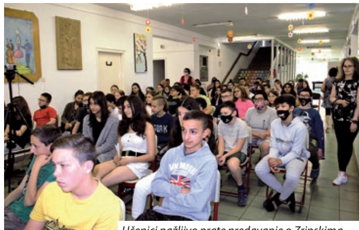
Učenici pažljivo prate predavanje o Zrinskim