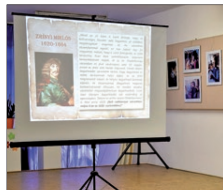
Zrinski među pomurskim Hrvatima