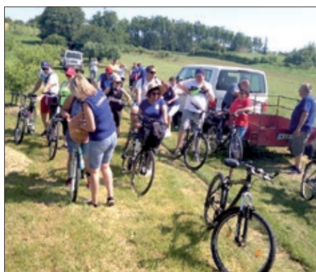
Biciklijada Bojevo – Dombol