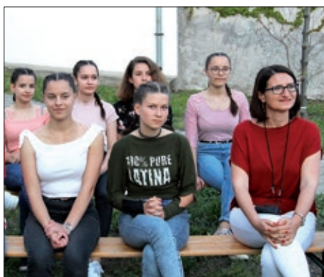
Noć hrvatske pop glazbe