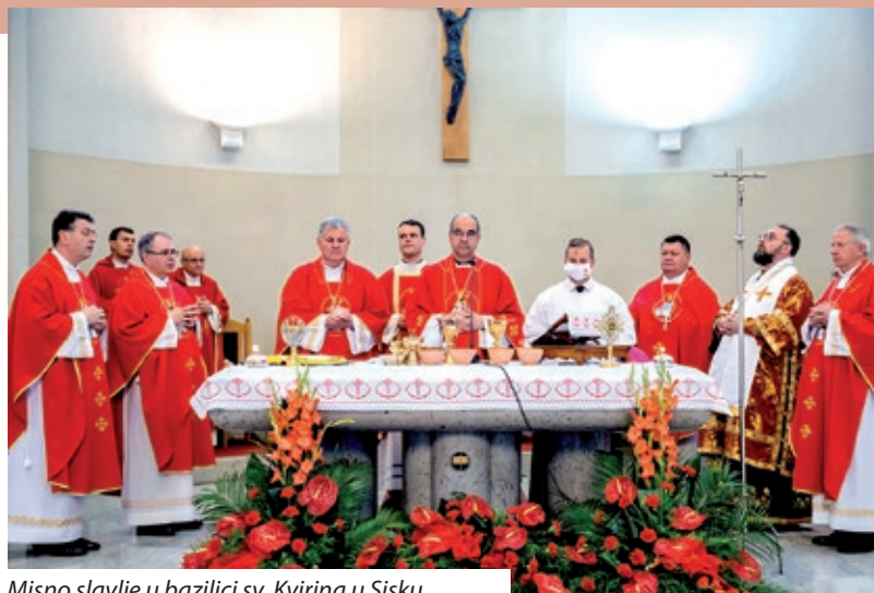
Misno slavlje u bazilici sv. Kvirina u Sisku