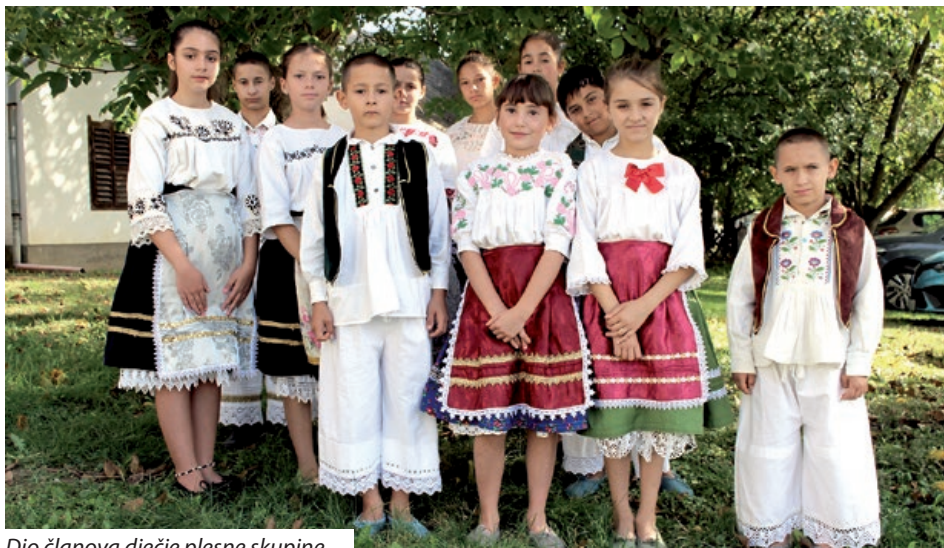
Dio članova dječje plesne skupine