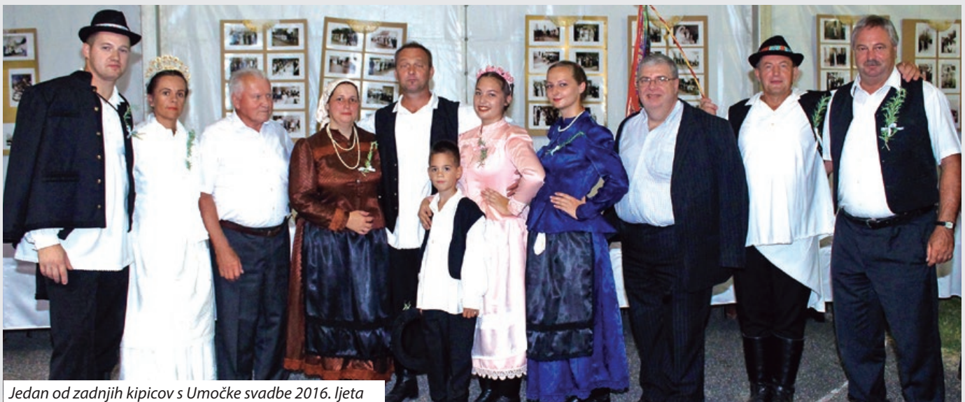
Jedan od zadnjih kipicov s Umočke svadbe 2016. ljeta