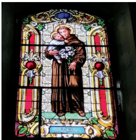
Na jednom od obnovljenih vitraja vraćena su imena nekadašnjih darovatelja: „Dali su praviti Benco, Dico, Pavka Zomborcsevits“

Kako dodaje Edmond Bende, u posljednjih stotinjak godina (od 1909.), osim obnove krova i vanjskih zidova nije bilo značajnijih radova na obnovi župne crkve.