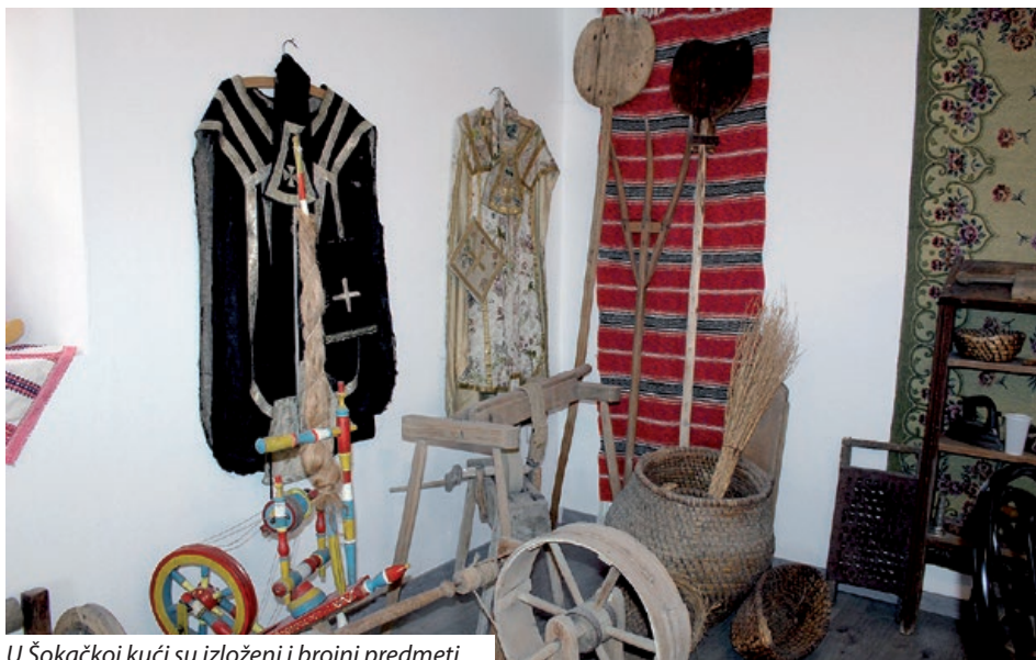
U Šokačkoj kući su izloženi i brojni predmeti

što će se ostvariti uveliko ovisi o epidemiološkim mjerama i pandemiji koronavirusa. Radi se i na drugom dijelu knjige „Lipa naša Vršenda“, skupljaju se priče, anegdote, dječje brojalice iz starih vremena. I Hr-