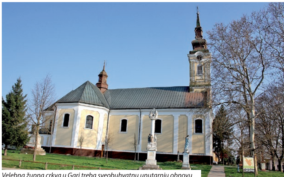
Velebna župna crkva u Gari treba sveobuhvatnu unutarnju obnovu

Dodajmo kako se donacije primaju u gotovini ili se mogu doznati na bankovni račun Župnog ureda, Takarékbank, broj računa: 51000132-14007419-00000000, s naznakom „Za obnovu garske crkve“. Obnova se može podržati i dodjelom jednog postotka poreza na dohodak „Zakladi za očuvanje garske graditeljske baštine“, najkasnije do 20. svibnja 2021. godine, porezni broj Zaklade: 18035526-1-03. S.B.