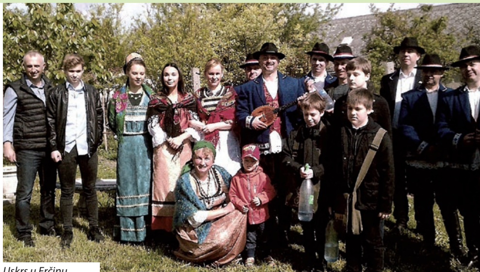
Uskrs u Erĉinu

U vrijeme korizme velik dio erĉinskih stanovnika je postio, pri čemu je petak bio dan strogog posta i nemrsa. Uoĉi Velikog tjedna djeca su u okolici grada skupljala granĉice ukrasne vrbe, cicamace, koje bi se na Cvjetnicu nosile u crkvu na blagoslov. Nakon toga nosile su se kućama, a nekoliko granĉica stavljalo se na tavan kako bi se kuća zaštitila od groma i požara, ali nosile su se i pokojnicima na groblje. Taj obiĉaj u Erĉinu je prisutan i danas. U ponedjeljak i utorak čistila se kuća, dvorište i štale, osobito one ispred kojih je prolazila procesija križnog puta. U srijedu se čistila crkva i izrađivao Isusov grob. Na Veliki četvrtak ujutro