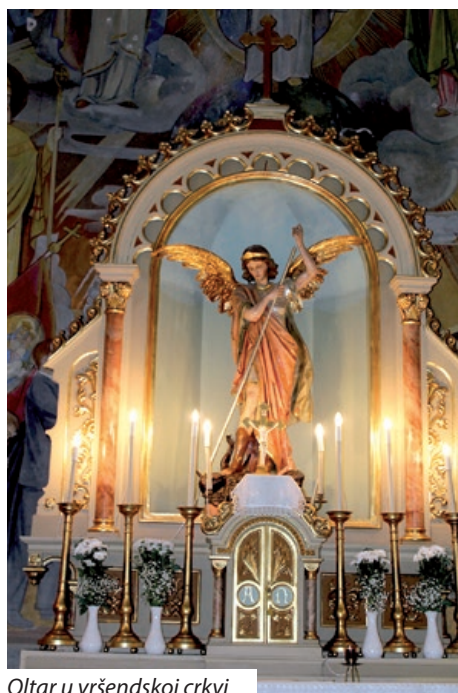
Oltar u vršendskoj crkvi

godinu dana zapošljavali su pet osoba preko vladinog programa kojeg trenutno nema, ali se nadaju kako će se otvoriti nove mogućnosti koje – ako ih bude – namjeravaju iskoristiti. Godišnji proračun je 2020. godine bio oko 3,2 milijuna forinti. Usko surađuju s Kulturnom i vjerskom udrugom šokačkih Hrvata koja je za djelovanje u 2021. godini dobila državnu potporu od 2 000 000 ft. Planova ima, ali