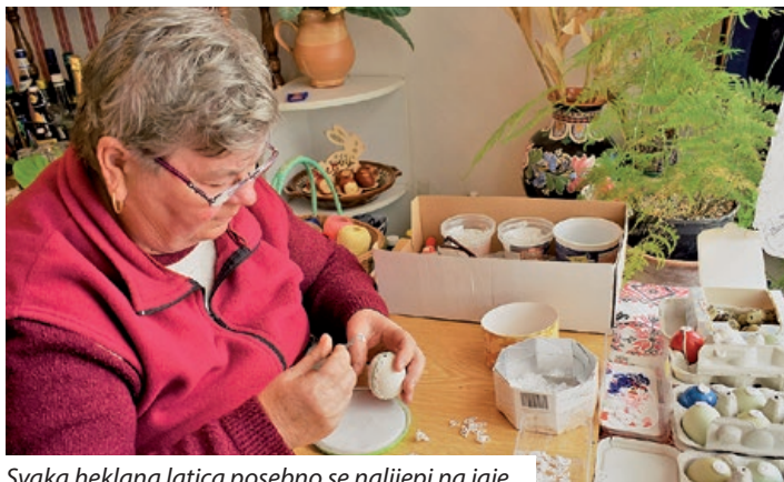
Svaka heklana latica posebno se nalijepi na jaje

„Da sam bila deklička pisanice smo pisale kičicom pak vojskom. Narajzali smo se kaj je došlo na pretuletje, muceke, ružice, tulipane, a farbu je mama skuhalo od černoga luka. Lepo mi je bilo i to delate sam kaj te pisanice nesu tak dogo mogle stati. Jemput je meni sosedo donesla pisanicu takvu kakvu ve delam, gledala sam kak se to dela, al onda nesem se hapila to delati. Da mi je muž fmrl onda nekak me je smirivalo takvo delo – ručni rad. Našla sam iglu za klekanje, pak sam se hapila to probate. Jajceke