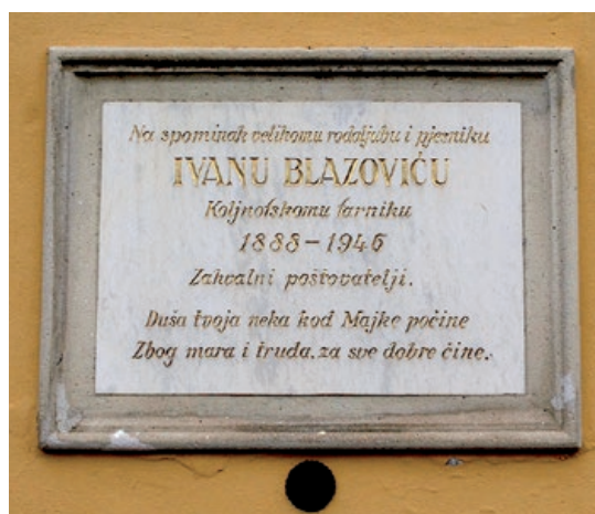
Spomen-ploča na stijeni koljnofske Hodočasne crikve

osobito odlikuje kao duhovnika i narodnjaka, to je njegovo pisateljsko stvaranje” mislio je za njega Ignac Horvat, 1971. ljeta. Mnogobrojna književna djela su objavljena u Naši Novina, u Kalendaru sv. Familije, Hrvatski novina, u Katoličanskom Ljudskom Savezu, u Mali Crikveni i Školski novina, u Kalendaru sv. Mihovila itd. U njegovu vrime najčitanija je pjesma-legenda „Koljnovska Maria. Čudno pripetenje hodočasne kapele”. Nabožnu epsku pjesmu na 12 stranic, u jurskom izdanju Naših novin iz 1920. ljeta, nisam prlje ni znala, ali sam našla i u vlašćoj knjižnici doma. Hvala Bogu Hrvatsko štamparsko društvo u Austriji je u seriji Gradišćanskohrvatska biblioteka 1996. ljeta najprlje objavila njegovu Prozu, potom pak i Tugomirove (pjesnički pseudonim) Izabrane pjesme, po izboru dr. Nikole