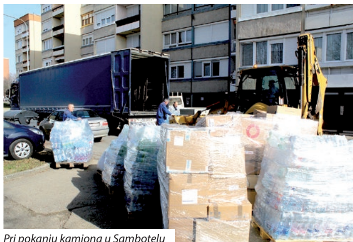
Pri pokanju kamiona u Sambotelu