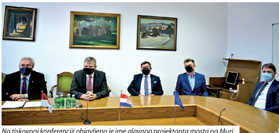
Na tiskovnoj konferenciji objavljeno je ime glavnog projektanta mosta na Muri

Na konferenciji je bilo riječi i o unapređenju prekograničnih veza te boljem povezivanju pomorskoga grada sa susjednim gradovima s druge strane granice. Predsjednik Hrvatske državne samouprave zahvalio se na potpori i podršci koju Grad Velika Kaniža