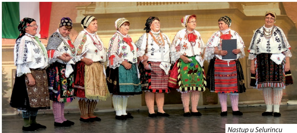
Nastup u Selurincu