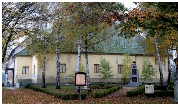
Stara seoska kuća na Trgu Alkotmány – buduća zavičajna kuća i sjedište udruge