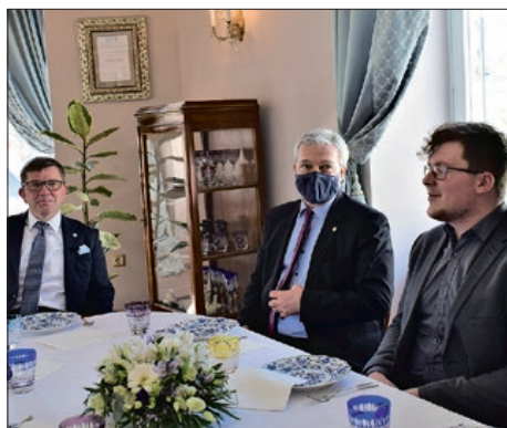
Hrvatski razgovori u Velikoj Kaniži