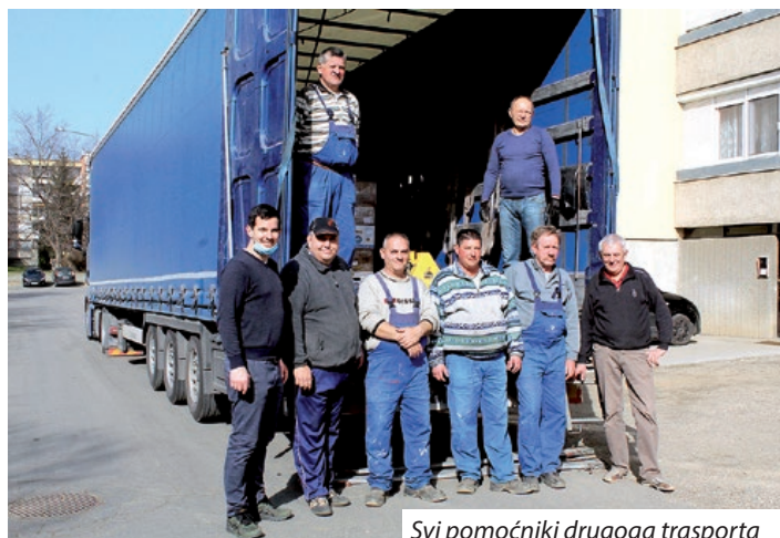
Svi pomoćnici drugoga transporta

mogli i organizirali dobrovoljne akcije. Pomogli smo transportom i s našeg mjesta prema Petrinji i svakom koji nam se obratio. Rekli smo, to će biti naša pomoć, to će biti naše odricanje u tom vidu, za ljude koji su nastradali. A što se tiče daljnje suradnje, s obzirom na ovakve ljude dobre volje koje smo susreli i veliko srce koje smo našli kod vas, preko granice, mi ćemo i dalje svaku donaciju, koju ćete vi organizirati drage volje, u našem trošku prebaciti do ljudi koji su unesrećeni. Ja velim, uvijek je bolje ako možeš pomoći, nego da trebaš pomoć, i to nam je jedna, ajmo reći povelja, i uvijek, kolikogod ćemo moći popratiti ovakve transporte, ovakve situacije, bit će nam drago. Ujedno se želim zahvaliti vama svima, koji ste odvojili bilo što, na bilo koji način i pomogli našim ljudima. Velika vam hvala, ispred svih onih koji ne znaju, tko im šalje pomoć, jer znam otkud je došla i s kojim srcem je otpremljena ta velikodušna donacija“, naglasila