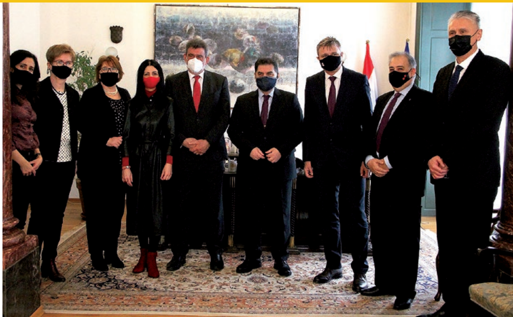
Sudionici sastanka u društvu ministra znanosti i obrazovanja Republike Hrvatske Radovana Fuchsa