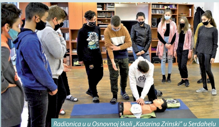
Radionica u u Osnovnoj školi „Katarina Zrinski“ u Serdahelu