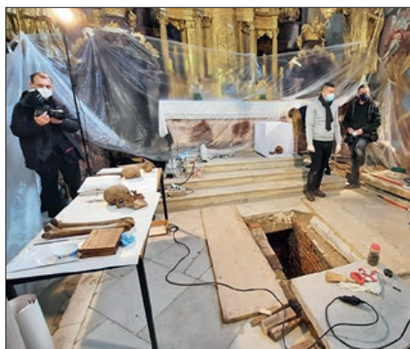
Mauzolej ugarskih vladara