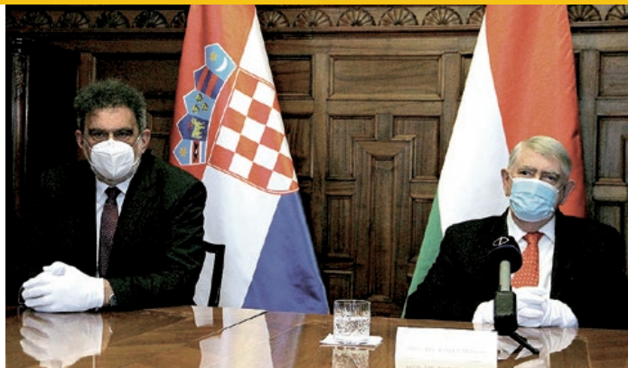
Ministri Radovan Fuchs i dr. Miklós Kásler na tiskovnoj konferenciji