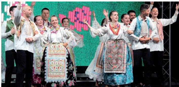
Članovi KUD-a „Veseli Santovci“ u predstavi „Poruka jedne santovačke tragedije – Rodoljub i Anica“

Prema njegovim riječima za 2020. godinu od Fonda „Gábor Bethlen“ dobili su operativnu potporu u iznosu 2,5 milijuna forinta. Uspješna su bila i tri predana natječaja za kulturne sadržaje, s jedne strane za izdanje o istaknutim, glasovitim Santovcima, s druge za zvučnu knjigu Marka Dekića, istaknutog pjesnika Hrvata u Mađarskoj, nadalje za organiziranje „Pjesmarice fest II“. Zbog pandemije ti su natječaji poništeni, ali su umjesto toga dobili 2 milijuna forinti na posebnom natječaju za obnovu stare klupske zgrade. Tako su nakon popravka krova izmijenili stare prozore i vrata na zgradi, koju će u buduću koristiti kao skladište. Putem natječaja u sklopu Programa „Mađarsko selo“ osvojili su potporu u iznosu od 6 milijuna forinti za kupnju zgrade stare seoske kuće. Na taj način ostvarit će davnu želju za novim klupskim prostorijama te za jednom zavičajnom kućom, s bogatom zbirkom koju je sakupio prethodni vlasnik zgrade, priznati slikar János Szurcsik, sa zavidno bogatom zbirkom tradicionalnih predmeta, namještaja i rukotvorina, ali i vlastitih slika s temom šokačkih Hrvata. Od tri prostorije jedna jedna će poslužiti kao klupska prostorija, a druge dvije kao izložbeni prostor. Na natječaju Fonda „Gábor Bethlen“ za 2021. godinu dobili su 1 400 000 forinti za funkcioniranje. Osim toga natjecali su se i za financiranje kulturnih projekata, za programe koji prošle godine nisu mogli biti ostvareni.