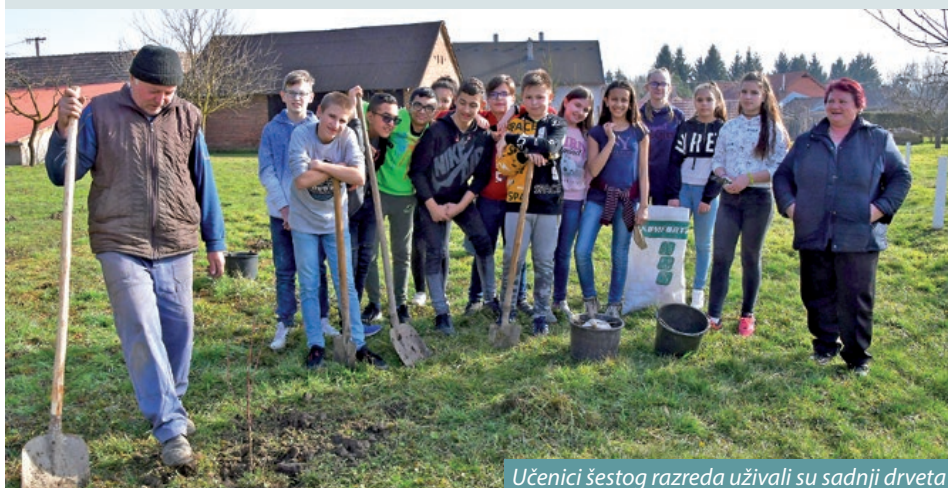
Učenici šestog razreda uživali su sadnji drveta

U keresturskoj zavičajnoj kući preostalo je još puno posla, staru kuću okružuje dvorište i velik vrt u kojem članovi udruge žele zasaditi autohtone sorte voćaka, cvijeća i začinskih biljaka, ukoliko netko od mještana ima takve rado će ih zasaditi. Zavičajnu kuću su nedavno posjetili i učenici šestog razreda mjesne Osnovne škole „Nikola Zrinski“, kojima je predsjednica udruge govorila o važnosti zavičajne kuće i njejoj budućoj funkciji. Prema planovima u kući će se urediti interaktivna izložba, a među zamislima je i održavanje raznih zanatskih radionica. Prva radionica održana je odmah. Učenici šestog razreda uzeli su štihalice, iskopali rupe za sadnice, zahvatili vode na starom bunaru te zasadili i zalili sedam sadnica. Sljedeći dječji program održat će se pred Uskrs kada će mališani ukrasiti uskrsno drvo šarenim pisanicama.