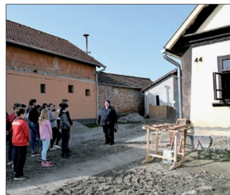
Obnova keresturske Hrvatske zavičajne kuće