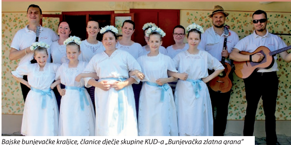
Bajske bunjevačke kraljice, članice dječje skupine KUD-a „Bunjevačka zlatna grana“

KUD „Bunjevačka zlatna grana“, koji pod ovim novim imenom djeluje od 2005. godine, ove godine obilježava 15. obljetnicu rada. Naime, društvo se smatra nasljednikom Plesnog društva „Čitaonica“, utemeljenog davne 1972. godine. Promjena imena uistinu je znakovita, jer – kako kaže predsjednica Ildika Filaković – upućuje na to da su Bunjevci jedna grana, i to zlatna grana hrvatskoga stabla.