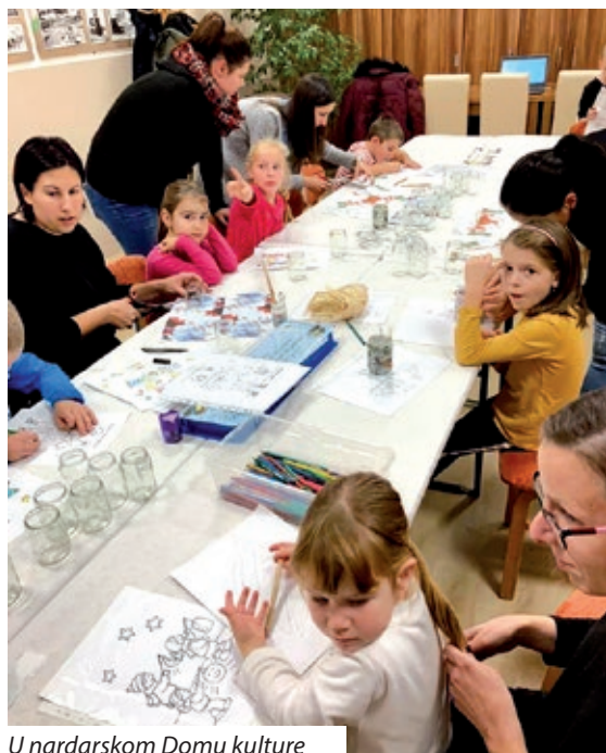
U nardarskom Domu kulture