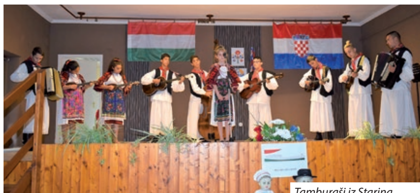
Tamburaši iz Starina