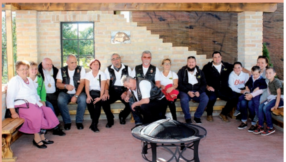
Kotroni Društva motoristov „Zapadni vjetar“ na novom mjestu