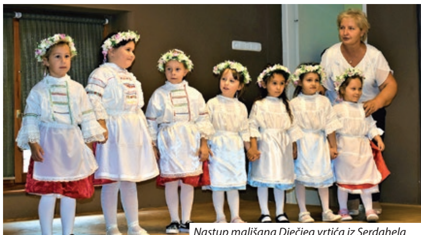
Nastup mališana Dječjeg vrtića iz Serdahela

Nakon pozdravnih riječi predsjednika Hrvatske državne samouprave Ivana Gugana riječ je preuzela voditeljica programa, ravnateljica Hrvatskog kulturno-prosvjetnog zavoda „Stipan Blažetin” Zorica Prosenjak Matola koja je najavila izvođače iz Koljnofa, Santova, Pečuha, Starina, Budimpešte, Kerestura i Serdahela. Na pozornici kulturnog doma izmjenjivale su se skupine mladih plesača i tamburaša u šarenim narodnim nošnjama i osmijehom na licu. Izvođači koji su odisali ponosom na svoje folklorno bogatstvo zaplesali su zapjevali i zaszvirali. Prvi su nastupili domaćini, mališani Dječjeg vrtića iz Serdahela, koji su predstavili pomurske dječje igre i broja-