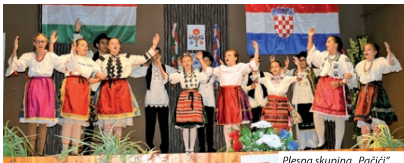
Plesna skupina „Pačići”