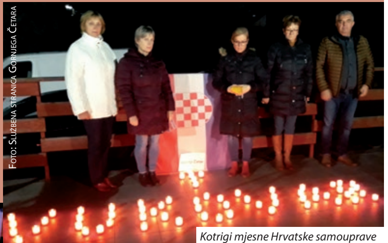
Kotrigri mjesne Hrvatske samouprave