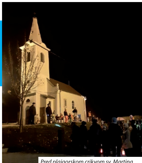
Pred plajgorskom crikvom sv. Martina