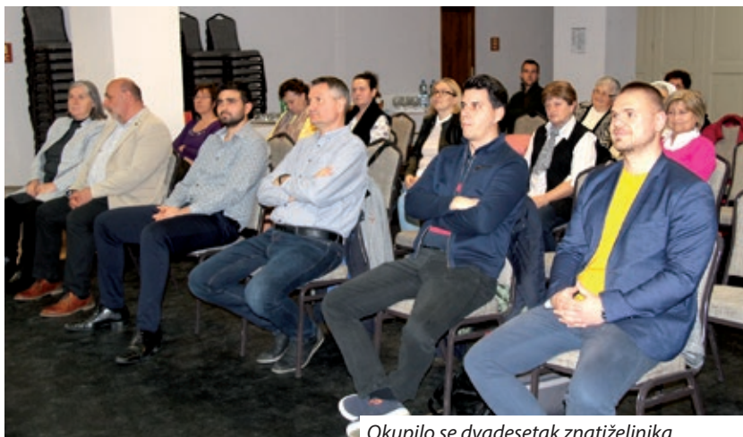
Okupilo se dvadesetak znatiželjnika

od slavenske riječi „dušenik“, koja znači otkupljivanje duše. Budući da u pisanim izvorima nema točnih podataka, u svom istraživanju oslanjala se na prezimena i racki govor koji je star preko tristo godina te razne utjecaje. Navela je kako pojedina karakteristična dušnočka prezimena pronalazimo i danas u Hrvatskoj, primjerice Tamasko (Đakovo), Hodovan (Osijek), Koprivanac (Donji Moholjac), Jagica (Stari Jankovci u okolici Vinkovaca), Fačko, Bolvari i Rogáč (Osijek). Prema njezinim riječima dušnočki je govor, naravno uz utjecaj mađarskog jezika, ali bez utjecaja standardnog hrvatskoga jezika, uspio očuvati svoju arhaičnost sve do danas. Govor dušnočkih Raca pripada slavonskom dijalektu podravskog tipa, staroštokavskom ekavskom govoru (mleko, čovek), s ma-