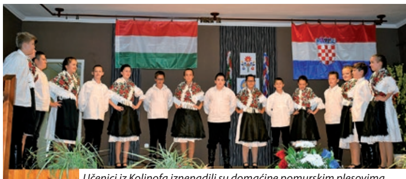
Učenici iz Koljnofa iznenadili su domaćine pomurskim plesovima