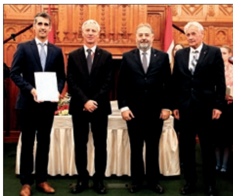
Dodijeljena dodatna potpora