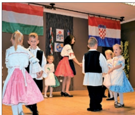
II. Dječji i folklorni festival