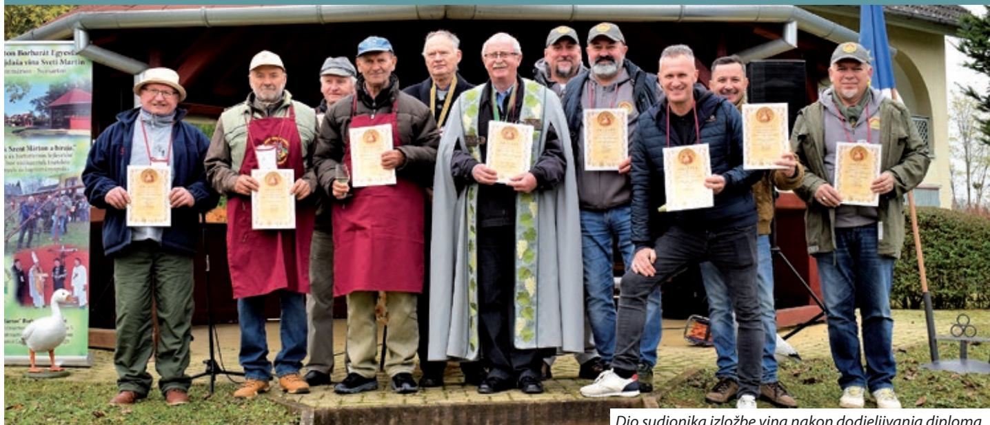
Dio sudionika izložbe vina nakon dodjeljivanja diploma