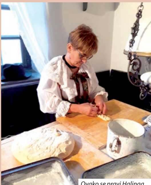
Ovako se pravi Halinga