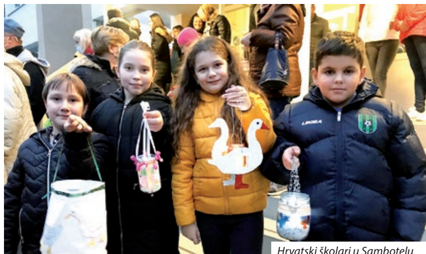
Hrvatski školari u Sambotelu

sv. Martina, komu je posvećena i mjesna crikva. U subotu, 13. novembra, po drugi put je organizirana prošecija u čast sveca, od Kulturnoga doma do kapele sv. Martina, izvan sela. Vjernici su se pomolili i jačili, pod peljanjem duhovnika Štefana Dumovića, a laterne su svitile na spomen biškupa. Mališanom nardarske Hrvatsko-katoličanske čuvarnice duhovnik Richárd Inzsöl je približio povidajku biškupa s guskami, a u sambotelskoj Hrvatskoj školi i čuvarnici Mate Meršića Miloradića u bližnjem parku su se intenzivno iskale i guske, a vlasnikom najlipših lampašev dodiljeni su i dari. Na svi dvi mjesti pravoda je bila i prošecija. Spomin-dan sv. Martina s večernjom povorkom najdulje se čuva med Židanci i Plajgorci, ki toga dana piše dojdu k susjedom, jer Plajgor takaj ima crikvu posvećenu sv. Martinu i neophodna štacija je po medjunarodnoj stazi ovoga sveca. Plajgorci svaki put s obilnima stoli jila i pila čekaju svoje susjede i prijatelje, što i ljetos nije bilo drugačije pod vedrim nebom.