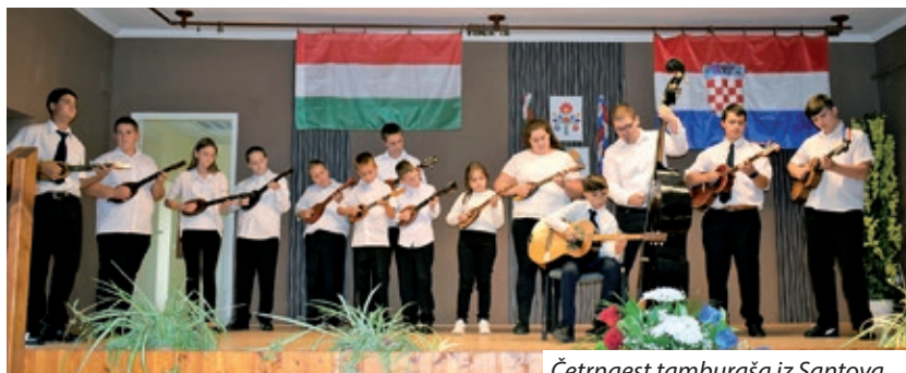
Četrnaest tamburaša iz Santova