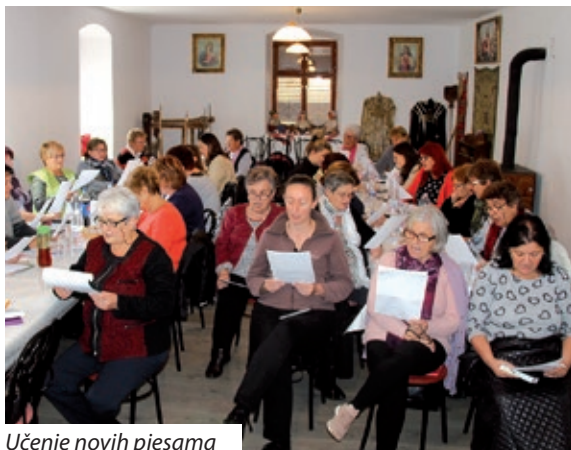
Učenje novih pjesama