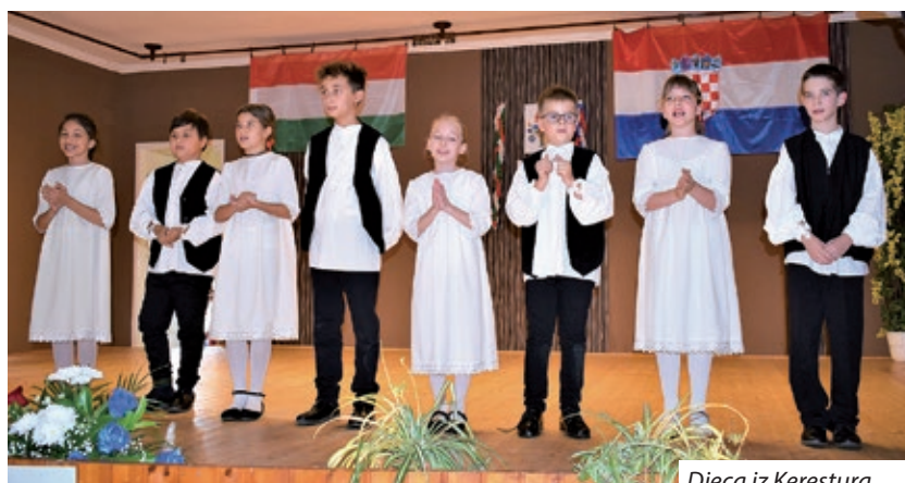
Djeca iz Kerestura