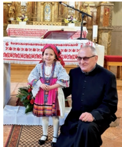
Velečani Čuzdi s malom Iluškom koja je obukla nošnju