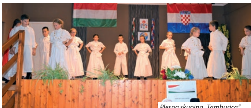
Plesna skupina „Tamburica”