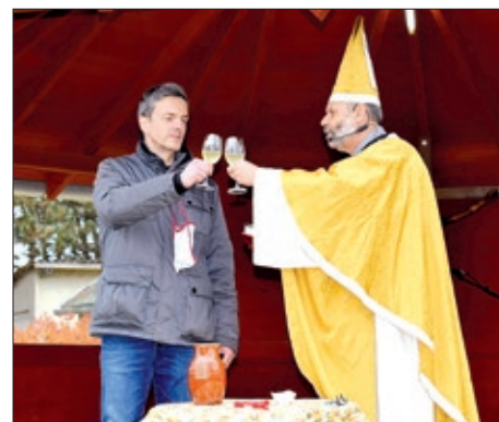
Mošt pokršten u vino