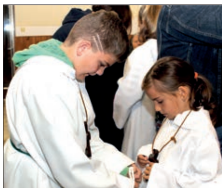
Novi petrovski miništranti