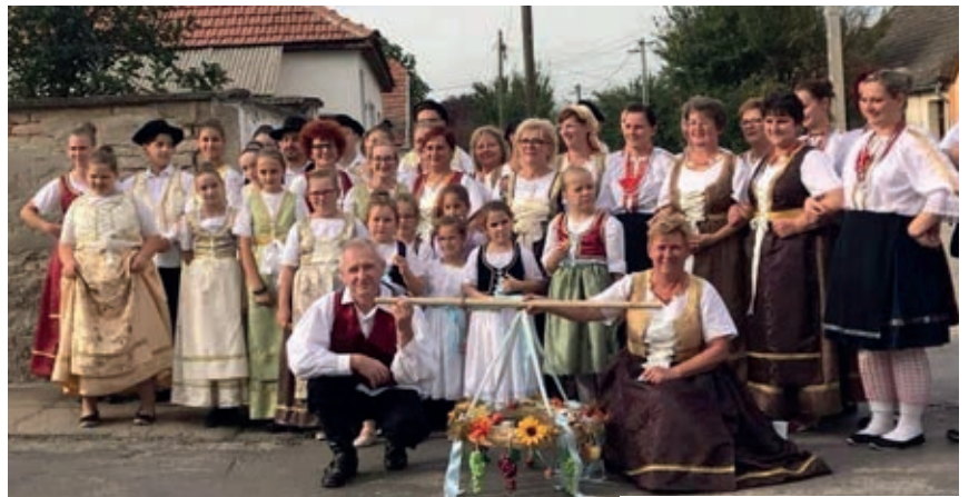
Mlado i staro čuva tradiciju

Povorka je sve donedavno u Čavolju bila važan običaj, mlade „divojke“ i momci išli su kočijama, uvijek u narodnoj nošnji: Mađari, Bunjevci, Nijemci i Mađari iz Sjeverne Ugarske, a pratili su ih čavoljski