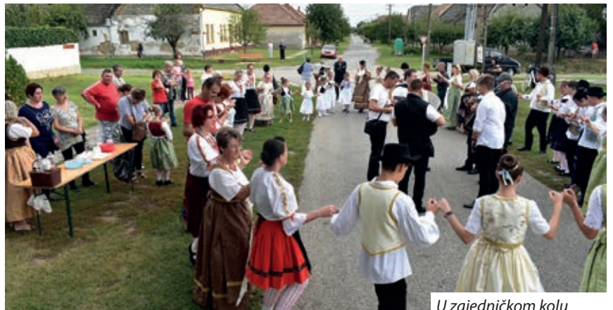
U zajedničkom kolu

tamburaši. Cijelo je selo bilo na „sokacima“, a navečer je bio veliki bal, na kojem se nastavilo veselje. Bilo je romantično i nezaboravno.