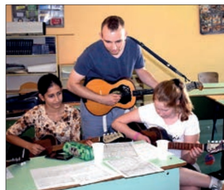
Stipendije, tamburice za mlade