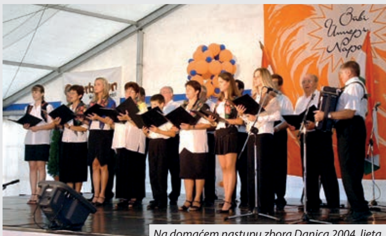
Na domaćem nastupu zbora Danica 2004. ljeta