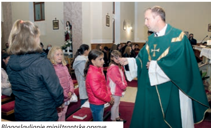
Blagoslavljanje ministriantske oprave

„Ave Maria, gratia plena Dominus Tecum benedicta Tu“ glušala je jačka s gitarom na prekrasnom glasu jačkaric ke su tako uvodile vjernike u čislo. Molitve toga dana su posvećene za, s odgovornošću i radošću ispunjenu, službu novih ministriantov. „Vaši roditelji nisu samo onda gizdavi na vas kad dobre ocjene odnesete domom iz škole, nego i drugda. I onda su gizdavi, kad vi simo dojdete u crkvu i molite, a tako svim ljudem pokažete i peldu. Danas u 16 uri u Talijanskom, u jednom gorskom naselju Assisiju, blaženim su proglasili malo starijega dičaka od vas, ki je 2006. ljeta, čez tri dane, u leukemiji umro. U kratkom svojem žitku iz Londona su se doselili u Milano, jako rado je hodio u crkvu pominati se s Bogom, volio je biti u prirodi. Samo sedam ljet je