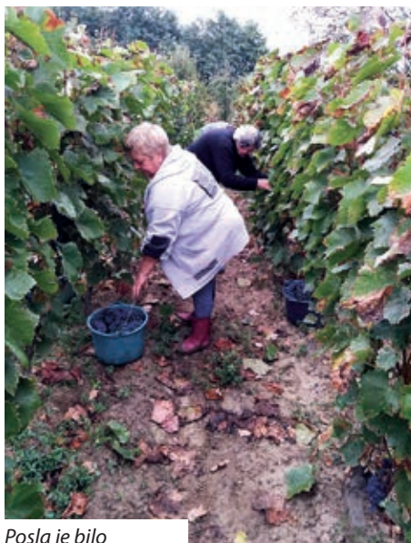
Posla je bilo