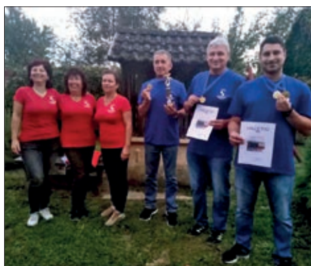
Kuglanje u Barču