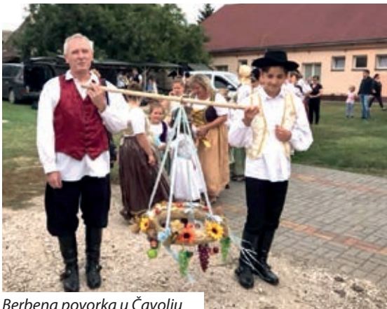
Berbena povorka u Čavolju