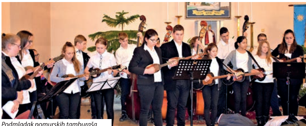
Podmladak pomurskih tamburaša