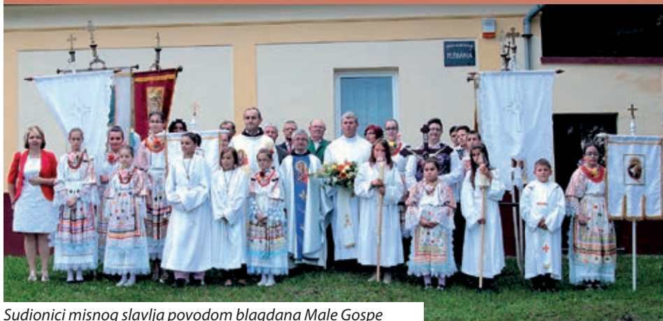
Sudionici misnog slavlja povodom blagdana Male Gospe

Osobno ime u pravnom smislu predstavlja ime koje se koristi za označavanje i razlikovanje osoba, a sastoji se od imena (prvog ili vlastitog) i prezimena. Za pripadnike narodnosti ime je posebnost koja ih razlikuje po nacionalnoj pripadnosti i čuva njihovu samobitnost. Iako pripadnici narodnosti već desetljećima imaju pravo na slobodan izbor svojih imena i imena svoje djece, te više od dva desetljeća i na njihov upis u matične knjige prema pravilima materinskoga jezika, pa i upis u osobnu iskaznicu i druge službene dokumente, njime se samo rijetko ili uopće ne koriste.