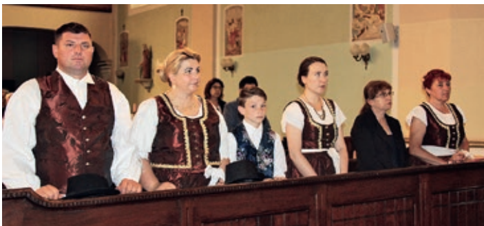
Članovi Kulturne udruge bunjevačkih Hrvata i Hrvatske samouprave