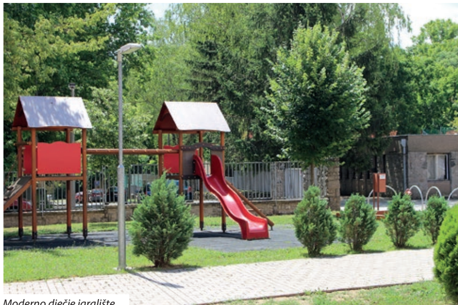
Moderno dječje igralište