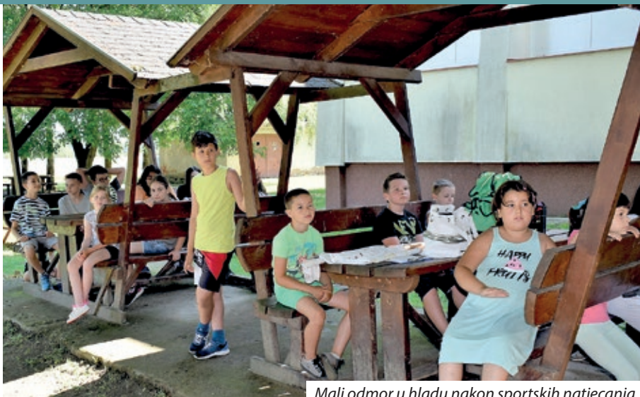
Mali odmor u hladu nakon sportskih natjecanja