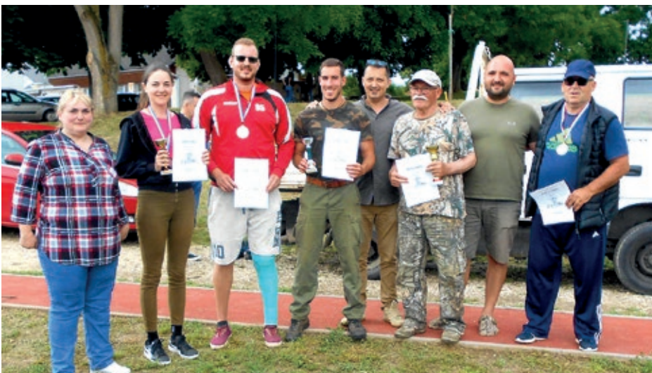
Najbolje ekipe ovogodišnjeg ribičkog nadmetanja