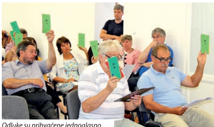
Odluke su prihvaćene jednoglasno