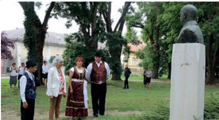
Predstavnici Hrvatske samouprave grada Aljmaša prilikom polaganja vijenaca

„Trebamo čuvati uspomenu na čovjeka koji nije gajio u srcu mržnju ni prema jednom narodu, ali mu je duša bila puna ljubavi prema svom bunjevačkom rodu. Možemo reći da nas još ima, ali manje nego što nas je nekad bilo. Ako samo malo učvrstimo svoju samobitnost, ukoliko se ne budemo stidjeli podrijetla, ima