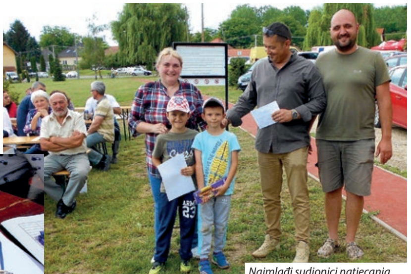
Najmlađi sudionici natjecanja

Od predsjednice Udruge baranjskih Hrvata Marijane Balatinac doznajemo kako je 20. lipnja, u suradnji s mjesnom Udrugom „Naši ljudi“, koja upravlja mišljenjskim ribnjakom održano tradicionalno okupljanje ribiča, s druženjem i ručkom za sudionike natjecanja. Na natjecanje se prijavilo petnaestak dvočlanih ekipa, kojima nije smetalo ni kišovito i vjetrovito vrijeme. Ulov je zaostao za prošlogodišnjim, ali je ipak ulovljeno 74 kilograma ribe, a sudionici su se lijepo družili uz