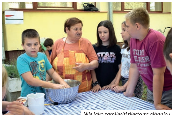
Nije lako zamijesiti tijesto za gibanicu