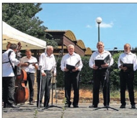
III. Hrvatski dan u Bókayjevom vrtu