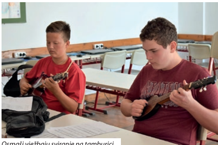
Osmaši vježbaju sviranje na tamburici

a zatim ga razvući, što baš i nije lagan posao, no kuharice su dovršile taj omiljeni desert, a za ručak je već bilo lako, u čemu su im pomogle i učiteljice. Za gibanicu treba i sira, čiju su proizvodnju sudionici mogli upoznati od poduzetnika Stjepana Horvata, a pošto se on bavi i jahanjem, hrabriji su se mogli iskušati u jahanju lipicanca. Petak je bio posvećen izletu u Pečuh i posjetu Hrvatskom kazalištu, gdje je asistent Gyula Béri pokazao prostorije u kojima se šminkaju glumci, mjesto šaptača i otkrio druge kazališne tajne. Neki su na pozornici isprobali svoje glumačko i plesnačko umijeće, pa se možemo nadati će netko od njih izabrati glumačko zvanje. Najveselije je bilo sunčano pečusko poslijepodne u kojem su sudionike kampa očekivali pavijani, medvjedi, nilski konji, tuljani, kornjače i druge životinje Zoološkog vrta. Naravno, ni ovdje se nije moglo bez učenja: dok su djeca promatrala životinje učila su njihove nazive na hrvatskom jeziku.