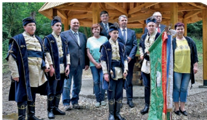
„Zrinski kadeti“ u društvu zamjenika ministra obrane Szilárda Németha i drugih dužnosnika ispred rekonstruiranog zdenca

Zdenac je rekonstruiran u povodu 400. obljetnice rođenja Nikole VII. Zrinskog, koji je 1661. godine radi obrane od turskih napada dao podignuti utvrdu na tromeđi Belezne, Tiloša i Kerestura. László Vándor, umirovljeni ravnatelj Muzeja Zalske županije u svom prigodnom govoru osvrnuo se na povijest utvrde i rezultate arheoloških istraživanja prilikom otkrivanja zdenca. Visoki dužnosnici, parlamentarni državni tajnik i zamjenik ministra obrane Szilárd Németh, državni tajnik Ministarstva inovacije i tehnologije Péter Cseresnyés, parlamentarni zastupnik Šomođske županije László Szászfalvi, brigadni general Mađarske vojske dr. Gábor Böröndi, general bojnik Nacionalnog sveučilišta javne službe prof. dr. József