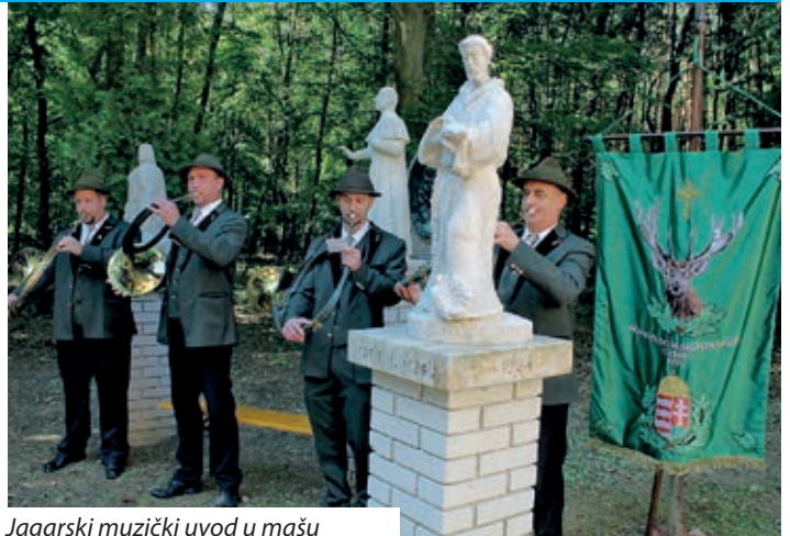
Jagarski muzički uvod u mašu