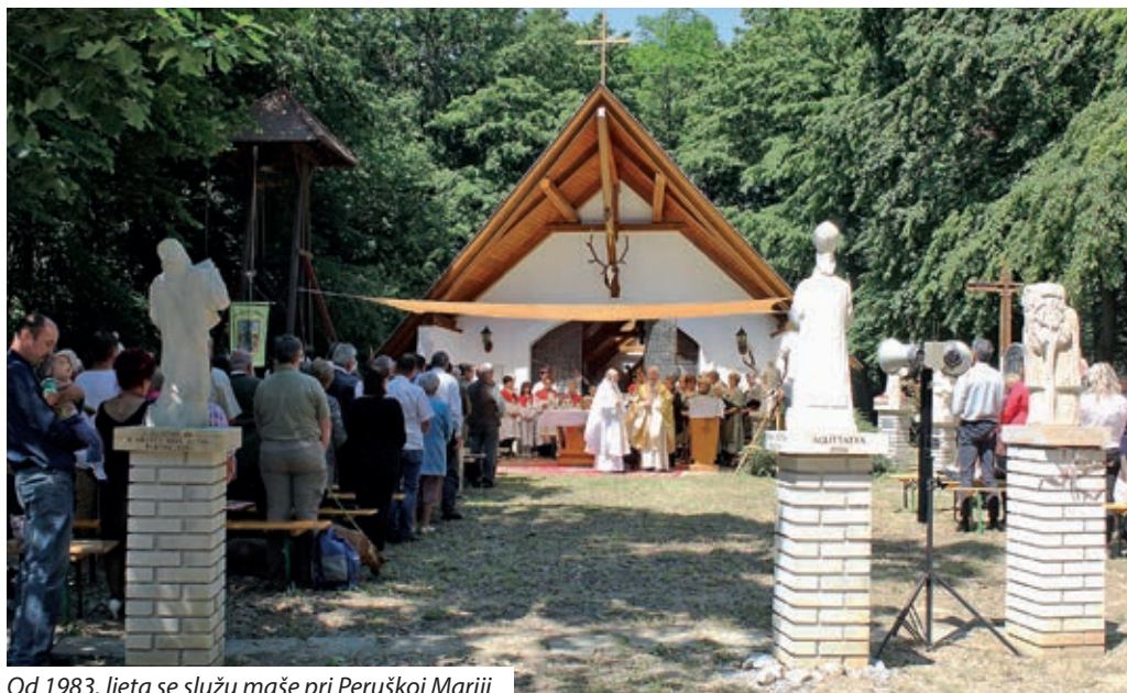
Od 1983. ljeta se služu maše pri Peruškoj Mariji