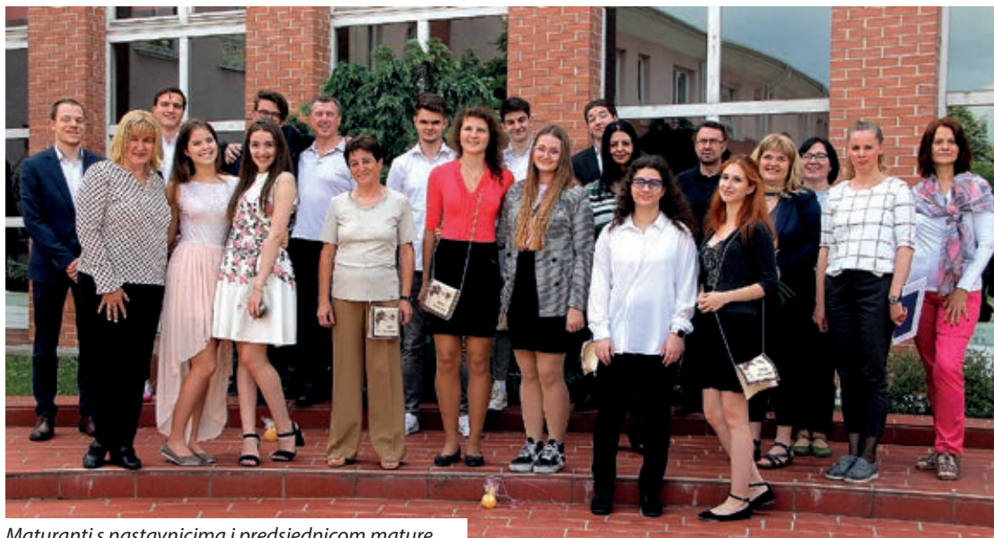
Maturanti s nastavnicima i predsjednicom mature

joj je jako žao što se ovogodišnja državna matura razlikuje od prijašnjih te nije imala prilike bolje upoznati maturante i slušati njihova usmena izlaganja. Ipak, neki su iskoristili mogućnost i lanjske godine položili prijevremenu državnu maturu iz pojedinih predmeta, pa je stekla vrlo pozitivan dojam o maturantima. Uputivši čestitke naglasila je kako je na ovogodišnjoj državnoj maturi bilo puno lijepih rezultata, a na kraju je svima zaželjela puno sreće u životu.