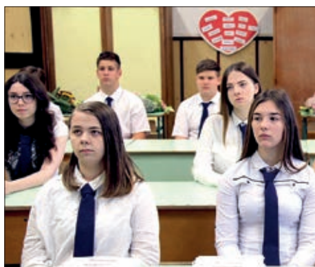
Oproštajna svečanost u Santovu