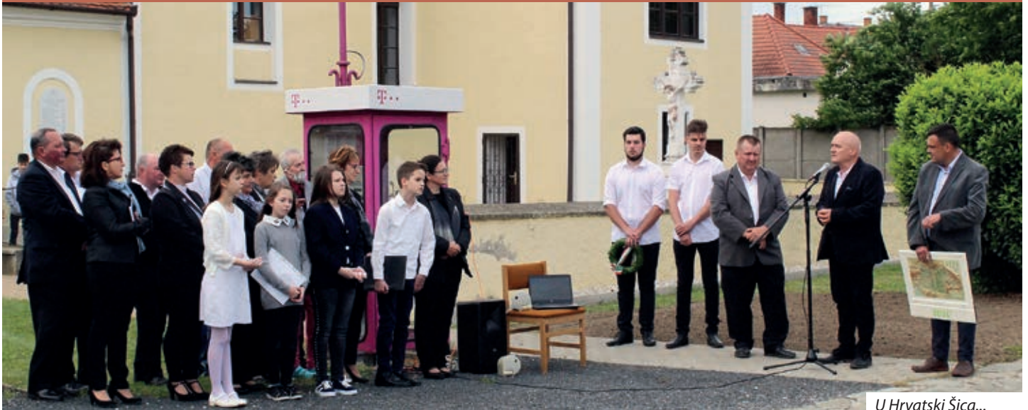
U Hrvatski Šica...

Mnogim u našem orsagu morebit i stranjsko zvuči, znamda bi moglo biti i vječno odsudjeno na mučanje, kako i na koji način su se Gradišćanski Hrvati spomenuli na svoj dio turobne povijesti, 4. junija, na danu stote obljetnice potpisanja Trianonskoga mirovnoga ugovora i na Danu nacionalnoga zajedništva. Jer mnogim je i za stovimi ljeti manje poznato da je ta dekret ov narod rascipao u tri države, a u Pinčenoj dolini je Nardu, Dolnji i Gornji Četar, Ugarski i Nimški Keresteš, Hrvatske Šice, Pornovu i Petrovo Selo, kot polag Kisega dodatno još i Plajgor, s potezom pera odredio k Austriji. Šopron, Civitas Fidelissima s okolnimi seli glasovao je na referendumu za ostanak u Ugarskoj, a vjerna naselja/Communitas Fidelissima većmisečnom borbom su izvojevala da 1923. ljeta, ponovo se vraćaju u krilo Ugarske.