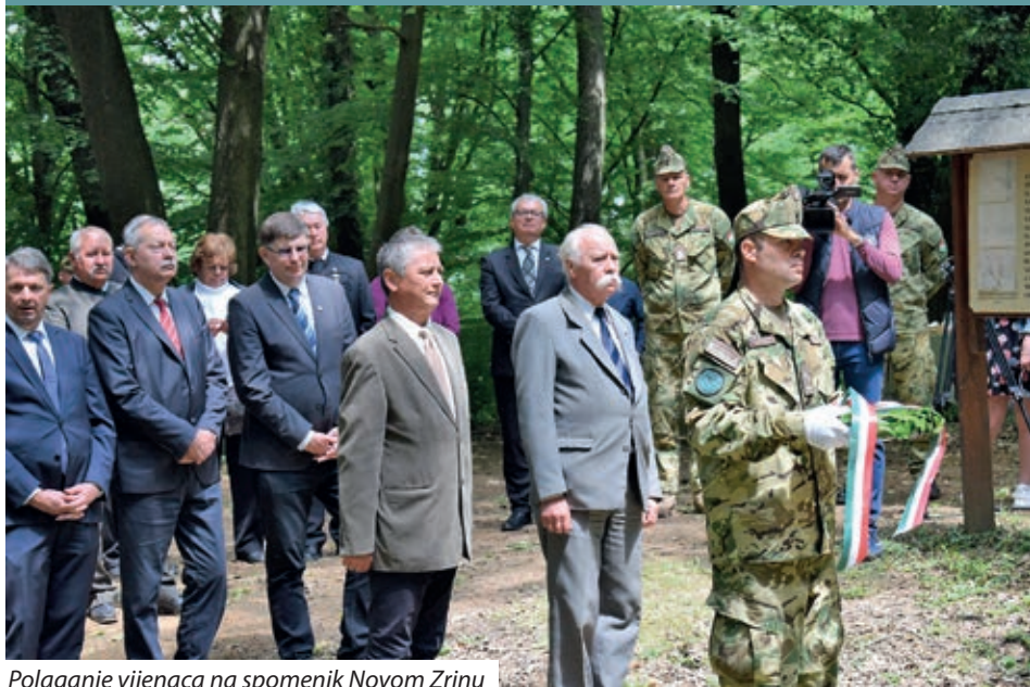
Polaganje vijenaca na spomenik Novom Zrinu

Nakon popuštanja mjera i suzbijanja zaraze 10. lipnja održana je prethodno otkazana svečana primopredaja i posveta rekonstruiranog zdenca na području nekadašnje utvrde Novi Zrin.