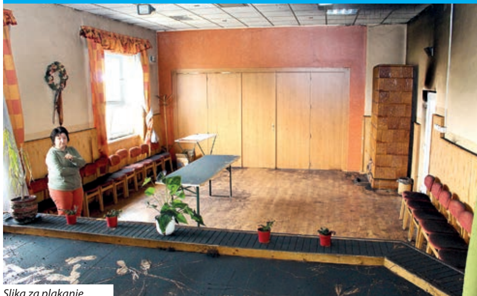
Slika za plakanje

Kulturni dom na pragu Narde, kad se iz Sambotela putuje, izvan ti drži isto lice kot i prlje, ali kad se približava čovik samoj zgradi iz odzad, pod jednim oblokom se vidi črnilo, označavajući tako da na svetak prošloga tajedna, Nardarci su se zbudili na nesriću. Zgrada je u noći pretrpila teške muke, po krivom spoju začelo se je sve žariti i goriti, a ženski sanitarni blok u cjelini je zničen. Aparat za sušenje ruk u spoju s bojlerom vjerojatno je najveći krivac za nastalu pretešku situaciju.