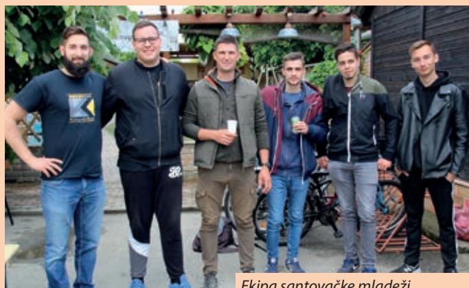
Ekipe santovačke mladeži