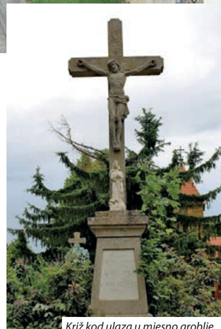
Križ kod ulaza u mjesno groblje

Vozimo se kroz naselje, na udaljenosti od svega tri i pol kilometra smiješi se Lotar. Do tamo se može jedino pješke, put traje četrdesetak minuta. Povijest nam priča o putovima koji su razdvajali, a ne spajali Hrvate ovih sela. Da bi se iz Semelja u Lotar došlo cestom valja prevaliti sedamnaest kilometara. Zastajem pored polja lavande: ovdje je Mjesna samouprava zasadila 14 000 sadnica lavande s obje strane prilazne ceste, koja povezuje selo s magistralnom prometnicom. Ulaže se puno truda. Kako su mi rekli domaćini, radi se mnogo toga, kako bi ovo malo selo postalo još ljepše. A budućim mini-jaslicama za koje su dobili 169,17 milijuna forinti, tečaju hrvatskoga jezika i pomoći mladim obiteljima posvetit ću poseban napis. Na kraju moji su mi sugovornici rekli: „Moramo otvoriti vrata, kako bi ušli svi koje zanima hrvatska kultura te stvoriti uvjete da privučemo sve Hrvate iz okolice, kojima se sviđa Semelj i naša zajednica. To je budućnost Semelja“.