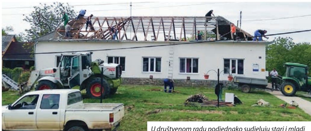
U društvenom radu podjednako sudjeluju stari i mladi