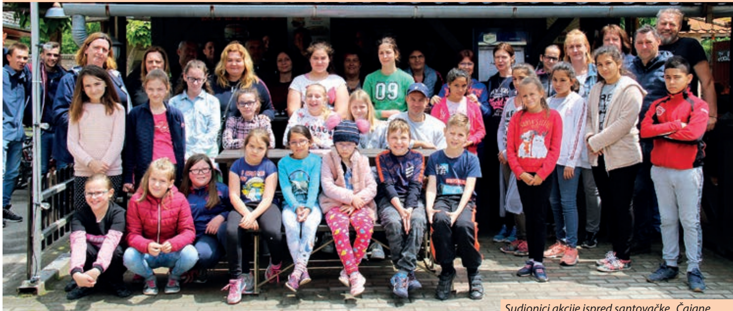
Sudionici akcije ispred santovačke „Čajane

Umjesto priredbe u povodu međunarodnog Dana djeteta, Mjesna samouprava Santova pozvala je djecu, mladež, nastavnike i roditelje na sudjelovanje u akciji „Očistimo svoje naselje“. Dobrovoljna akcija s ciljem očuvanja prirode i okoliša organizirana je 30. svibnja, a odazvalo se pedesetak sudionika iz svih nararaštaja. Organizatori su omogućili korištenje zaštitne opreme i plastične vreće za prikupljanje otpada, a djeca, mladi i odrasli okupljeni u manjim grupama tijekom prijepodneva obilazili su rubne dijelove naselja, prikupivši na desetke velikih vreća otpada. Jedna grupa zadržala se u središtu naselja i dotjerala stabla na središnjem Trgu Floriána Alberta, nazvanom po legendarnom nogometašu Ferencvárosa i mađarske reprezentacije. Nakon završetka sudionici su pozvani na ručak, sokove i sladoled.