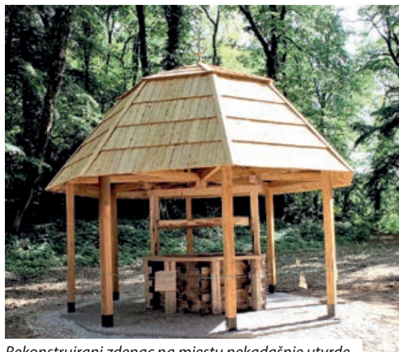
Rekonstruirani zdenac na mjestu nekadašnje utvrde

Kako je utvrda bila spravnjena sa zemljom stručnjaci dugo nisu mogli odrediti točnu lokaciju Novog Zrina. Lokalitet je identificirao dr. László Vándor u svom diplomskom radu 1972. godine, oslanjajući se na kartografski prikaz Pála Esterházyja. Na temelju vojno-inženjerskog nacrtu iz rukopisne ostavštine Esterházyja lokalitet je odredio i povjesničar i kartograf Pál Hrenkó. Vojni povjesničar Géza Perjés bio je prvi koji prema Montecuccolijevom nacrtu opsade Novog Zrina utvrdi smjestio na lijevu obalu Mure. U suradnji sa studentima nekadašnjeg Sveučilišta za nacionalnu obranu „Nikola Zrinski“ i s podrškom lokalnih samouprava 2003.