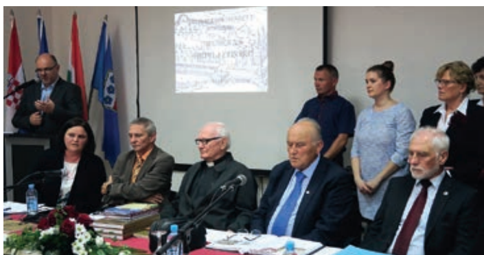
Prošlogodišnja konferencija o Zrinskim na kulturološkim susretima u Goričanu