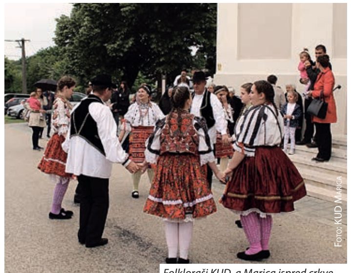
Folkloriši KUD-a Marica ispred crkve