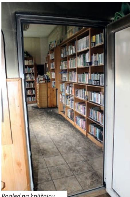
Pogled na knjižnicu

tere, skenera, printera jur smo imali od prlje. To je sve pod ovim črninom, zato se i bojim! Projektor nam je uzidan u stinu, ki zna u kojoj mjeri se je i tamo zavlikao dim, kot i u novi televizor na zidu“, strašuju nas riči likterice, ka još dodaje da su sad htli konačno za koronakrizom početi s