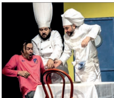
„Kuhari“ u Hrvatskom kazalištu