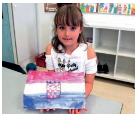
Ponovno u školi i vrtiću