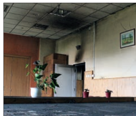
Veliki kvar u Nardi