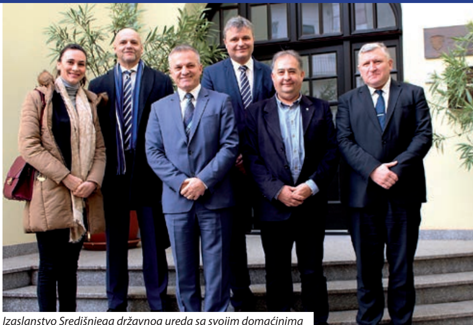
Izaslanstvo Središnjega državnog ureda sa svojim domaćinima