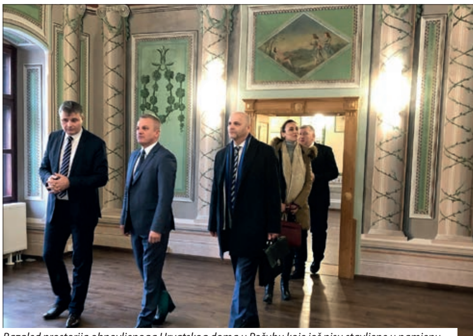
Razgled prostorija obnovljenoga Hrvatskog doma u Pečuhu koje još nisu stavljene u namjenu

viđaju, na očuvanje hrvatskoga jezika i pitanje obrazovanja, što je svakodnevna briga i pokušaja sagledavanja onoga što će biti sutra jer globalni trendovi pomalo gaze nacionalne vrijednosti. Posebno su istaknuli poduzete aktivnosti vezano uz dovršetak školskog centra u Sambo-