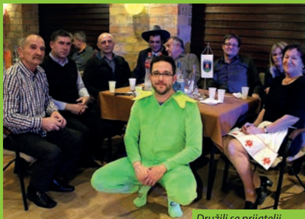
Družili se prijatelji.