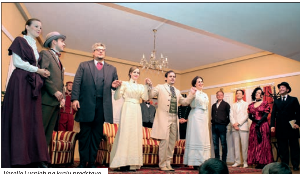
Veselje i uspjeh na kraju predstave

vu „Taksi, taksi“ da gor nam nije bilo moguće nutrazajti na zadnju predstavu. Ljetos je, od Božića do Trih kraljev, šest put odigrana komedija „Jedan mora biti bedak“, u tri čini, iz pera francuskoga pisca Georgesa Feydeaua, u prevodu Mate Palatina i pod reži-