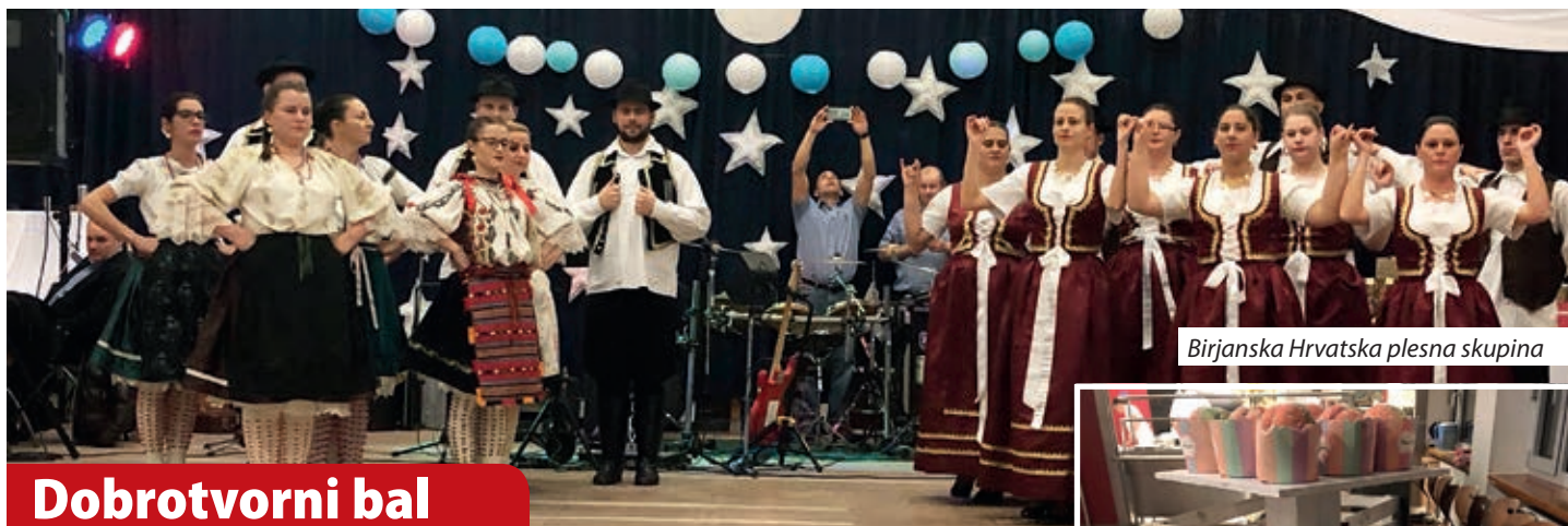
Birjanska Hrvatska plesna skupina