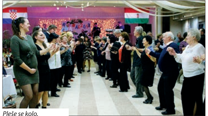
Pleše se kolo.

Podravka, na njihovu bogatom repertoaru jednako su našle mjesto uspješnice i kola. Svirali su hitove Plavoga orkestra, Parnoga valjka, Priljavoga kazališta, sastava Vigor, Mejaša, Zvonka Bogdana, dalmatinskih klapa i drugih. Kružilo se kolo na hrvatsku, srpsku i makedonsku glazbu. Blizu pola noći izvlačila se tombola, među vrijednim darovima bili su: usisivač, putovanje u Mohač na Bušarski ophod, kuhinjski uređaji, po dva puta deset