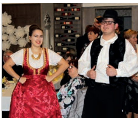
Bajsko Veliko prelo