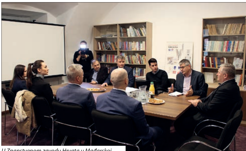
U Znanstvenom zavodu Hrvata u Mađarskoj

Državni tajnik Milas reče da Hrvatska državna samouprava ima svoju priču i vodi jednu dobru politiku svega onoga što je potrebno nacionalnoj manjini da bi se prepoznala u svim onim vrijednostima