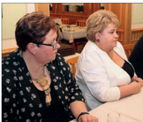
Okrugli stol na temu školstva u Koljnofu 3. stranica