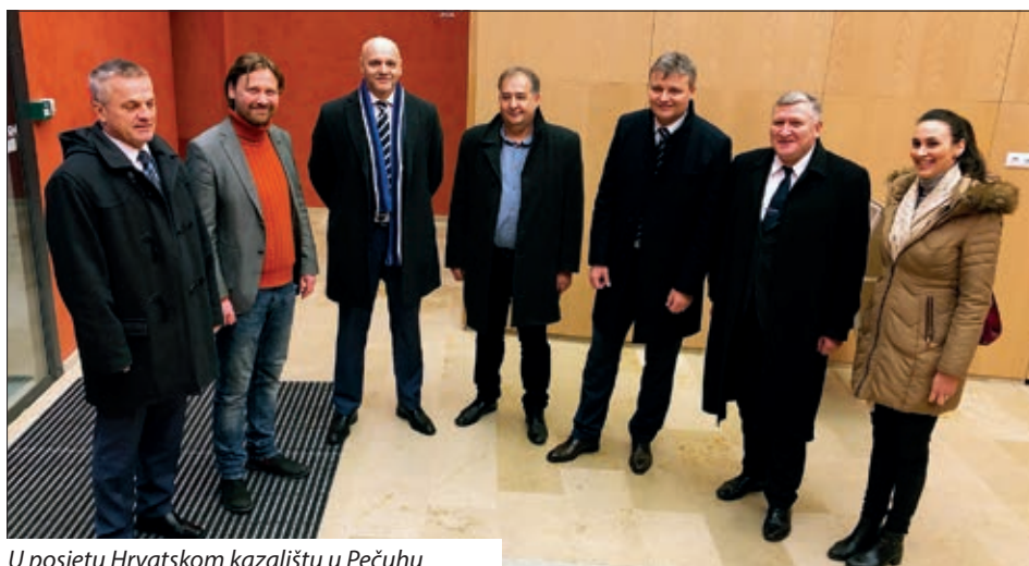
U posjetu Hrvatskom kazalištu u Pečuhu

kako bi opstala u svojoj kulturi, običajima, samobitnosti, svemu onome što je održava, i vjeruje da će Središnji državni ured biti jedan od malih kotačića koji će dati moralnu, materijalnu i političku potporu tome.