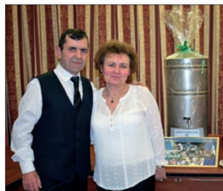
„Fala” serdahelskom harmonikašu