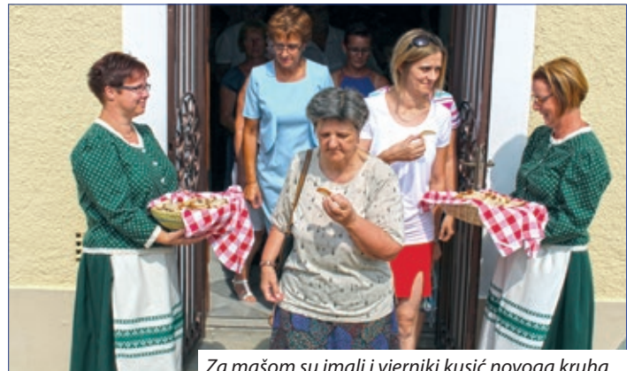
Za mašom su imali i vjerniki kusić novoga kruha

vidimo na pozornici. Njegova ekipa je zadužena za organizaciju i svaki človik se dobro čuti, tečno ide posluživanje u punom šatoru, a u Kulturnom domu se među poharaji što su žene pekle, i svaka hiža je poslala svoj paket u „centar“. Toči se pivo, vino ali uprav kola, po narudžbi. Toga dana Šičani jednako se veselu Ugrom, Nimcem i Hrvatom, hrvatskim jačkam, tancem i ugarskim melodijam. Domaći Slavuj začme program, četarski Rozmarin nastavlja jačkarno otpodne, zatim narajski zbor oduševljava, kojega sprohadjaju još sambotelske Djurdjice, sambotelski zbor za čuvanje tradicij, a i seniorski tančoši Hrvatske samouprave Sambotela. Njeva koreografija Petroviski svatovac s pravom