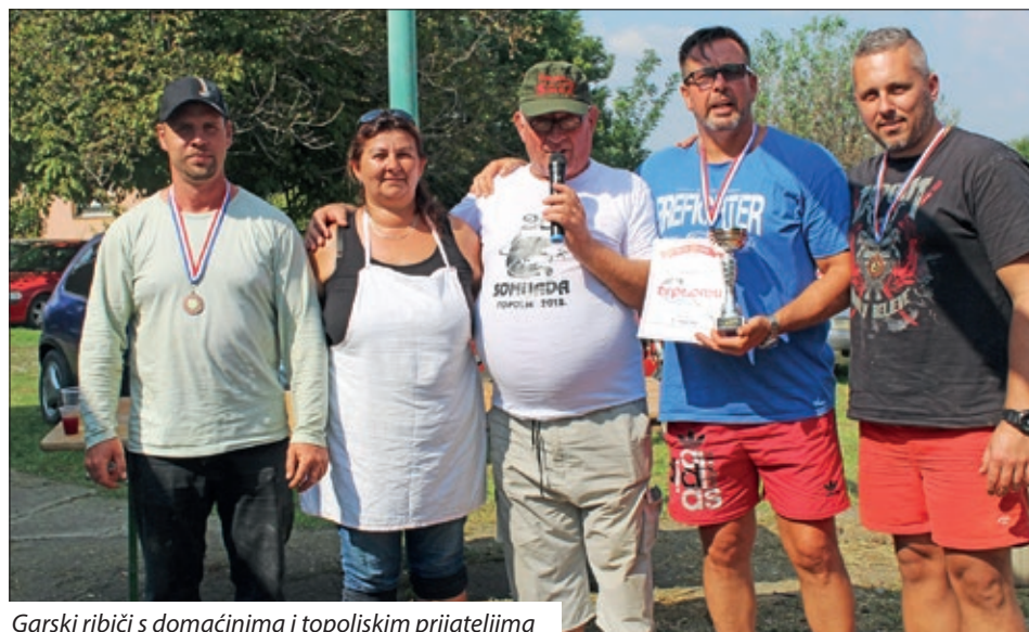
Garski ribiči s domaćinima i topoljskim prijateljima