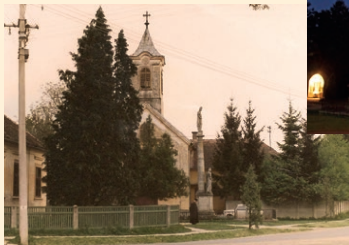
Stara fara i crikva u 1970-imi ljeti