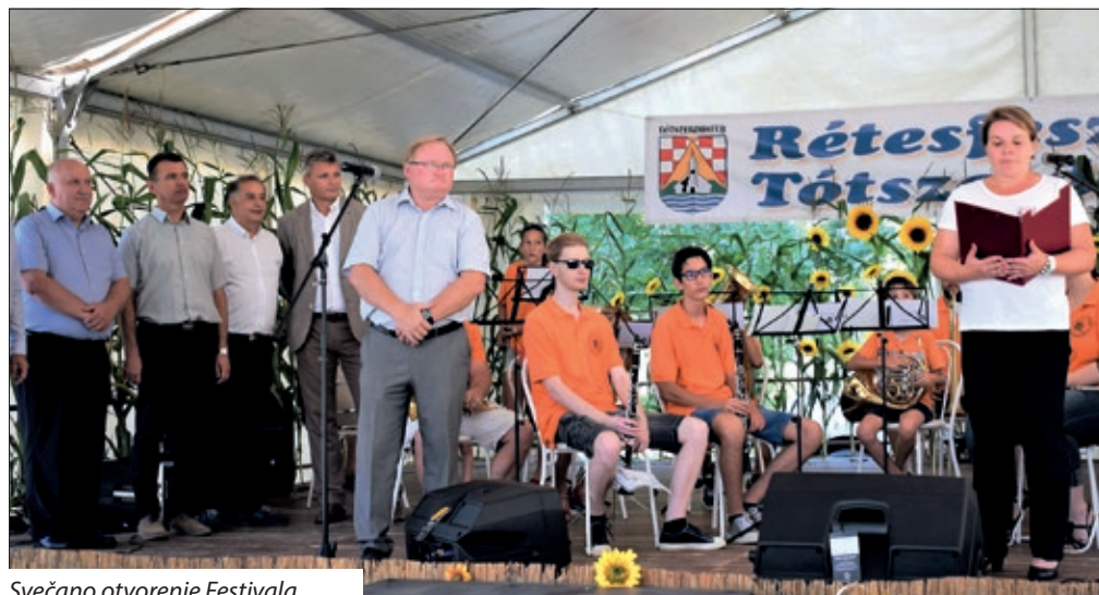
Svečano otvorenje Festivala