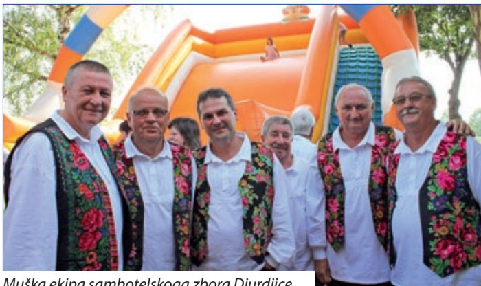
Muška ekipa sambotelskoga zbora Djurdjice