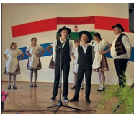
Hrvatski dan u Bojevu