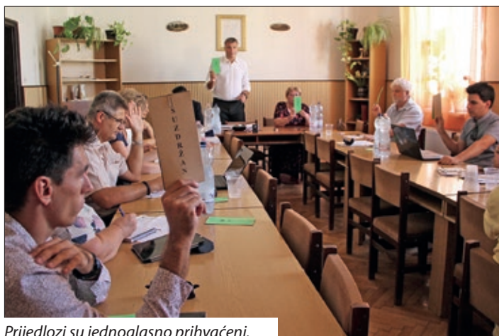
Prijedlozi su jednoglasno prihvaćeni.