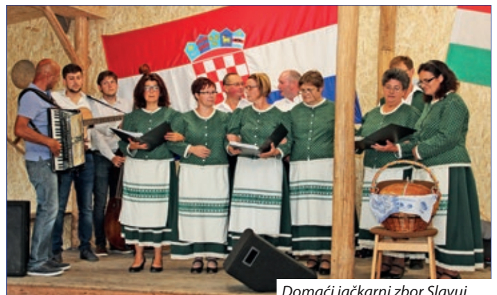
Domaći jačkarni zbor Slavuj

vidimo na pozornici. Njegova ekipa je zadužena za organizaciju i svaki človik se dobro čuti, tečno ide posluživanje u punom šatoru, a u Kulturnom domu se među poharaji što su žene pekle, i svaka hiža je poslala svoj paket u „centar“. Toči se pivo, vino ali uprav kola, po narudžbi. Toga dana Šičani jednako se veselu Ugrom, Nimcem i Hrvatom, hrvatskim jačkam, tancem i ugarskim melodijam. Domaći Slavuj začme program, četarski Rozmarin nastavlja jačkarno otpodne, zatim narajski zbor oduševljava, kojega sprohadjaju još sambotelske Djurdjice, sambotelski zbor za čuvanje tradicij, a i seniorski tančoši Hrvatske samouprave Sambotela. Njeva koreografija Petroviski svatovac s pravom