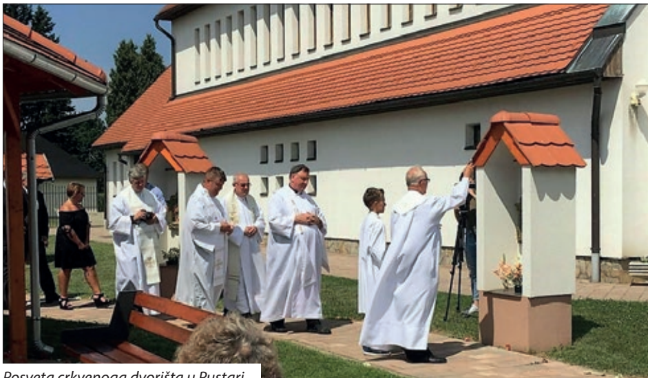
Posveta crkvenoga dvorišta u Pustari

Marton, serdahelski župnik, govorio misu ma mađarskom jeziku u Ludbregu. Blagdan Presvete Krvi Kristove jedan je od najvećih vjerskih manifestacija u Hrvatskoj. Ludbreška tradicija hodočašća utemeljena je ukazom pape Leona X. još 1513. godine. Njegovom bulom priznata je i potvrđena čudesna pojava Krvi Kristove koja se zbila 1411. godine u kapelici Batthyányjeva dvorca te od tada započinju i hodočašća u ludbreško svetištu, a moći se i danas čuvaju i mogu se pogledati. Pomurski su vjernici sudjelovali na svečanoj misi i ophodnji na koje je pristiglo mnoštvo vjernika iz raznih krajeva Hrvatske, Slovačke i Mađarske.