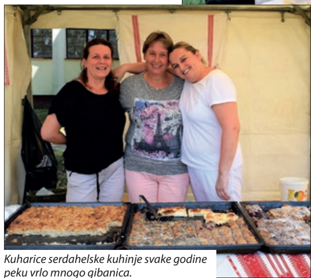
Kuharice serdahelske kuhinje svake godine peku vrlo mnogo gibanica.

bila uzorna i upravo je ona pridonijela razvoju tog područja. Suradnja bi bila još bolja kada bi na Muri otvorili još neke prijelaze. U buduću će na tome raditi vodstvo županije. Dožupan Međimurske županije također se suglasio s predstavnikom Zalske županije i izrazio je nadu da će dvije vlade koraknuti glede toga, naime to je u njihovoj nadležnosti. Ivan Gugan čestitao je na „punoljetnosti“ Festivala, koji se organizira radi očuvanja hrvatskih tradicija, običaja i jezika, te da je nova HDS-ova kulturna ustanova utemeljena upravo zbog toga. Dok se svečano otvorenje Festivala odvijalo uz program letinjskoga Puhačkog orkestra, pod šatorima su družine već pripremale razne gibanice, razvlačile tijesto, punile s raznim nadjevima. Natjecati se moglo u trima kategorijama, u pečenju gibanice sa sirom, makom i tikvicama, te po svom odabiru. Neki su od natjecatelja