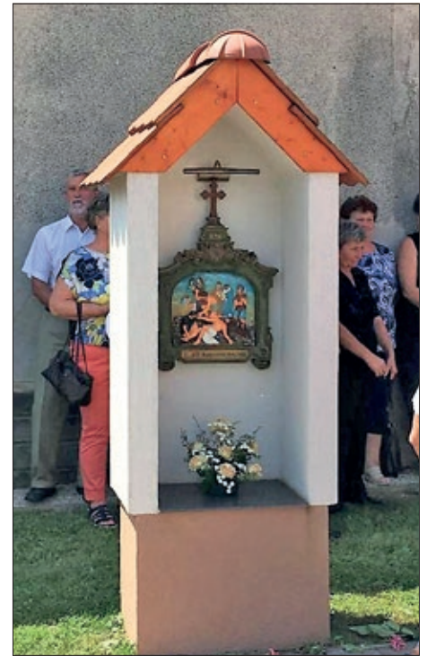
Jedna od postaja novoga križnog puta u Pustari

Pomurski su vjernici uvijek velikodušno žrtvovali za svoju vjeru, nije slučajno da su u devedesetim godinama prošlog stoljeća u Mlinarcima, Pustari, Serdahelu iz-