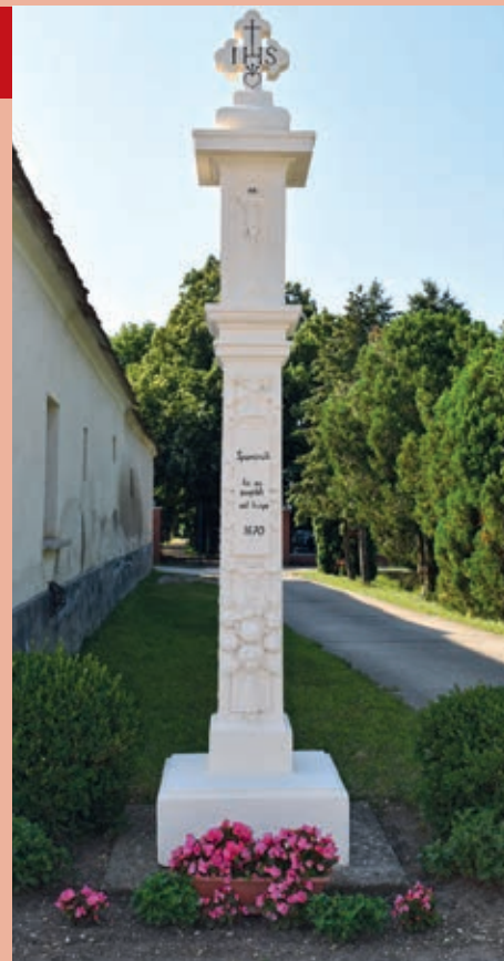
Najstariji undanski pilj iz 1670. ljeta