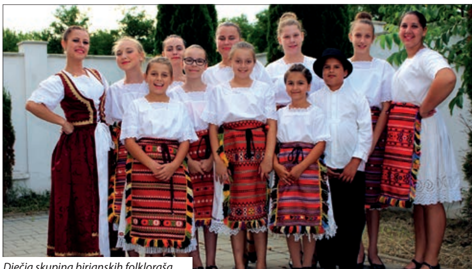
Dječja skupina birjanskih folklorša

Napomenimo da nas je prostor oko crkve, ograda, vanjski zidovi crkve... dočekali u radovima, obnavlja se crkva i dvorište, saznali smo od Birjanaca.