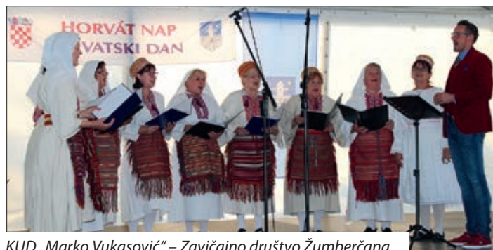
KUD „Marko Vukasović“ – Zavičajno društvo Žumberčana