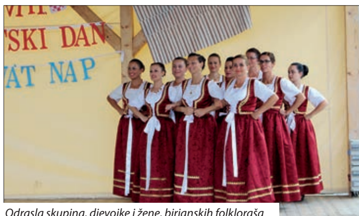
Odrasla skupina, djevojke i žene, birjanskih folklorša