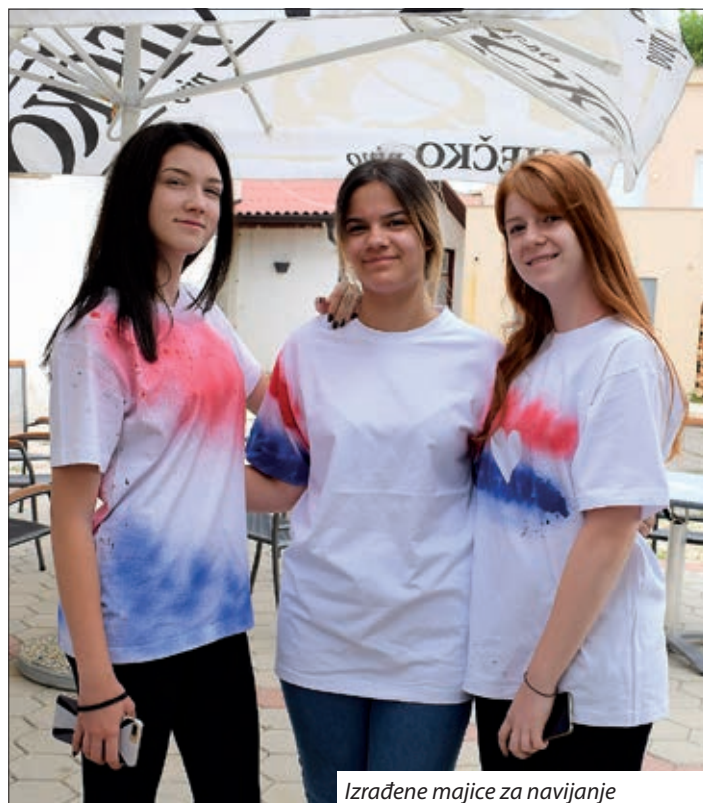
Izrađene majice za navijanje