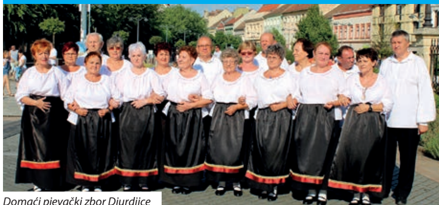
Domaći pjevački zbor Djurdjice

Jedno desetljeće mine da su Društvo sambotelskih Hrvatov i Hrvatska samouprava grada na noge postavili Hrvatski dan, uprav u srcu Sambotela. Gastronomska fešta, maša na materinskom jeziku, folklorno otpodne i na kraju zabava do polnoći svako ljeto pozove sve već Hrvatov kako iz okolice, tako i iz stare domovine. 7. julija, u subotu, već je jubilarni dan Hrvatov mamio s beskrajnim veseljem, utakmicom Hrvatske suprot Rusije, a potom pravoda i zavolj pobjede još većim mulatovanjem do polnoći, u kom su znatni dio imali i petroviski Pinka-band, kot i tamburaši Koprive.