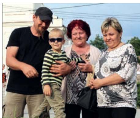
Hrvatski dan u Birjanu