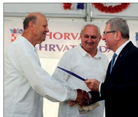
X. Hrvatski dan u Sambotelu