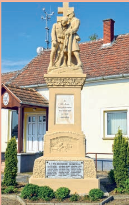
Spomenik palih borcev iz I. i II. svitskoga boja