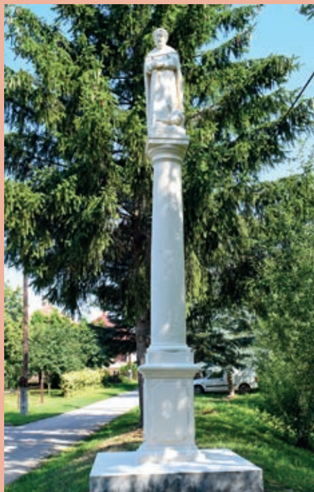
Stup sv. Vida u Fileškoj ulici

ispravku. Lišće, kitice, svako sadje... dospilo je na svoje mjesto iz kamenskoga pijeska i na drugi pilji. Spomenik na kugu iz 1670. ljeta, Kip Kraljice neba i zemlje i Križ raspetoga Jezusa Kristuša kod Gaja iz 1856., isto su dostali svoj skoro originalni oblik kao i spomenik palih borcev iz I. i II. svitskoga boja na Glavnom trgu. Na obnovu spomenika palih junakova Seoska samouprava Unde dobila je na naticanju 700 000 Ft od Central-