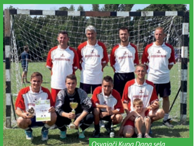
Osvajači Kupa Dana sela