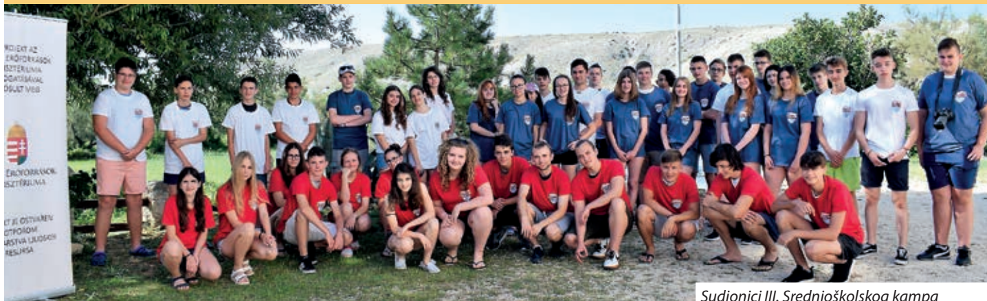
Sudionici III. Srednjoškolskog kampa

U nizu hrvatskih kampova Hrvatske državne samouprave organiziranih u vlašićkom odmaralištu Zavičaju zadnji je srednjoškolski, održan od 8. do 15. srpnja pod nazivom Hrvatski filmski kamp, tradicija i javnog života SETA 2018, u suorganizaciji serdahelske Hrvatske samouprave „Stipan Blažetin“. Ovogodišnji srednjoškolski kamp uz uobičajene jezične radionice sudionicima je nudio i mogućnost da se iskušaju u novinarstvu, odnosno u snimanju filma-spota, da bi do kraja kampa nastao promidžbeni film o samome kampu i odmaralištu. U svemu tome pomogli su članovi Serdahelske filmske radionice i Foto-kino kluba Ivanovec, odnosno novinar Medijskog centra Croatica.