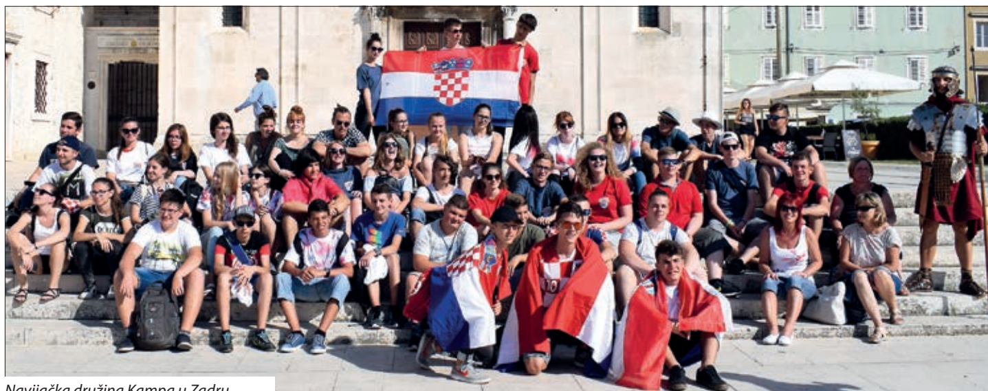
Navijačka družina Kampa u Zadru