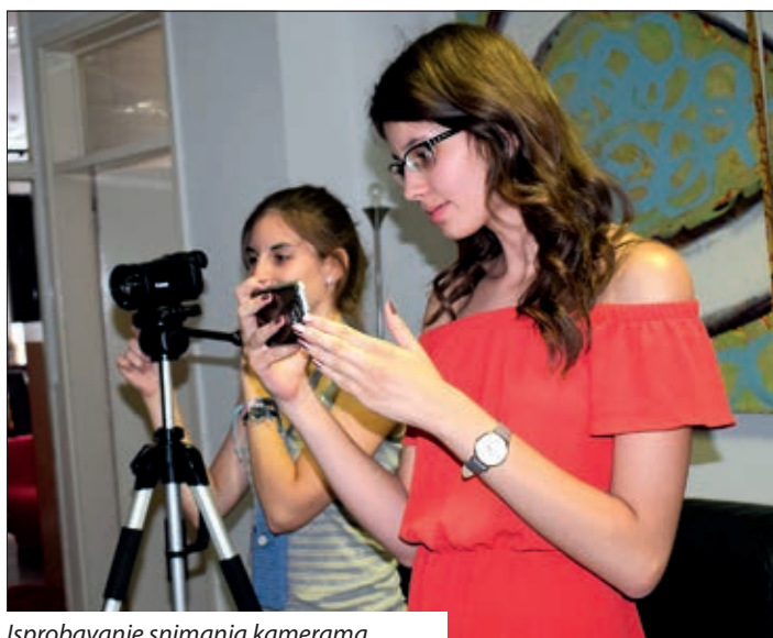
Isprobavanje snimanja kamerama