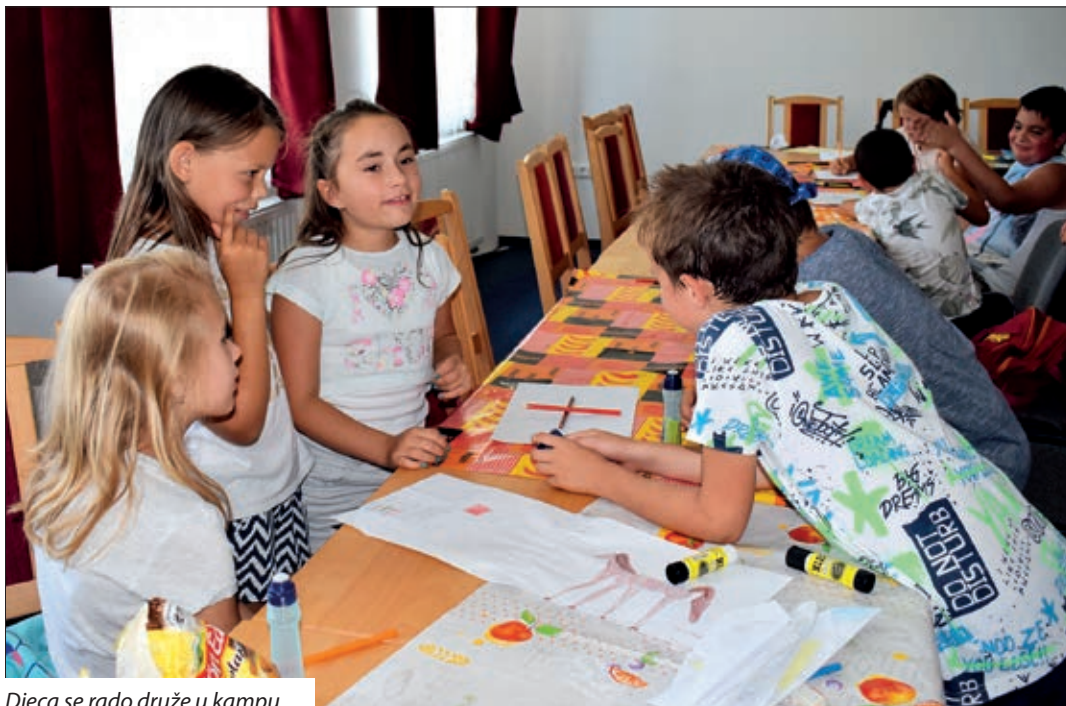
Djeca se rado druže u kampu.

U organizaciji Hrvatskoga kulturno-prosvjetnog zavoda „Stipan Blažetin“, od 16. do 20. srpnja priređen je III. Hrvatski dječji kamp za djecu predškolske dobi i za učenike nižih razreda. Četrdesetero djece iz pomurskih naselja tijekom tjedna sudjelovalo je u raznim radionicama, vježbalo osnovne izraze na hrvatskome jeziku, bilo na izletu u Keszthelyu.