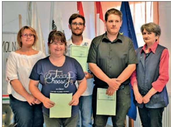
Novi sastav mlinaračke Hrvatske samouprave u društvu bilježnika i predsjednice Izbornog povjerenstva

Na osnivačkoj su sjednici zastupnici prihvatili proračun za tekuću godinu, te programe u tekućoj godini, prema planu Samouprava će u suradnji sa Seoskom samoupravom i civilnim udrugama organizirati Dan naselja. Možda će ta zajednička priredba izgladiti prije nastalu napetost između dviju samouprava u Mlinarcima. beta