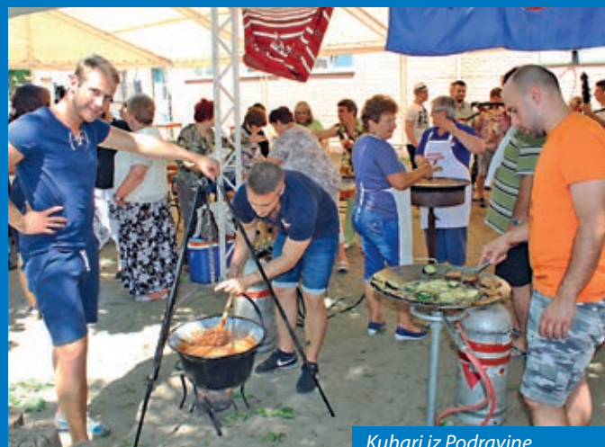
Kuhari iz Podravine

Na dvorištu fancaške škole u ranim popodnevnim satima održano je i kulinarsko natjecanje. Sudionici skupštine i Kulturno-gastronomskog dana Hrvata u Mađarskoj, popodne su sudjelovali na misi na hrvatskom jeziku i prigodnome kulturnom programu u povodu tradicionalnog Markova na Fancagi.