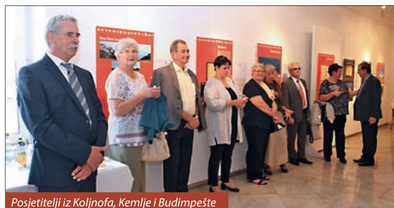
Posjetitelji iz Koljnofa, Kemlje i Budimpešte