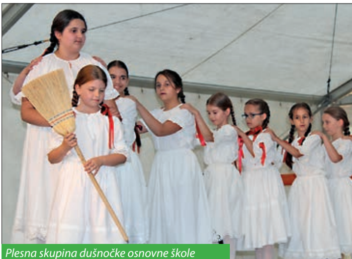
Plesna skupina dušnočke osnovne škole