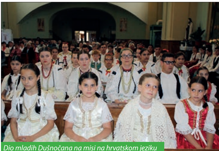
Dio mladih Dušnočana na misi na hrvatskom jeziku

U suorganizaciji Seoske i Hrvatske samouprave, u bačkome hrvatskom naselju Dušnoku 19. – 20. svibnja organizirani su dva deset i šesti Racki Duhovi ili, kako Dušnočani vele, Racke Pinkužde. Dan uoči Duhova, u subotu, 19. svibnja, Hrvatska samouprava uz misu i prigodni kulturni program organizirala je Dan Hrvata koji je uz domaće skupine okupio i gostujuća društva iz Gare, Bačina, Vršende, Martinaca i Santova.