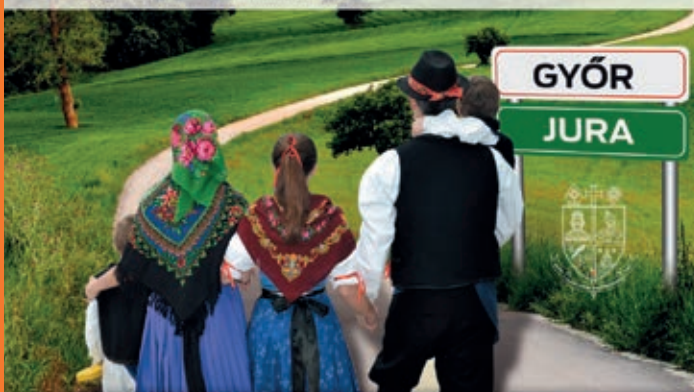
JURSKA BIŠKUPIJA SRDAČNO OČEKUJE HRVATSKE OBITELJI! A Győri Egyházmegye szeretettel várja a horvát családokat!