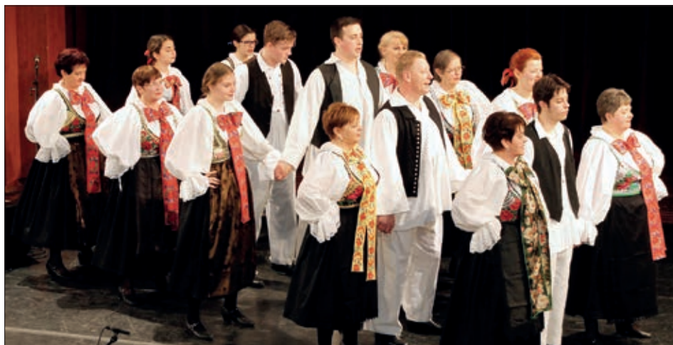
KUD Konoplje pri nastupu na šopronskoj Gradišćanskoj gali

klorne aktivnosti, osnovano novo društvo. „Kad sam stare člane te grupe pozvao na prvu probu, pobrao sam stare slike, napravio izložbu i pitao sam je da li bi kanili opet začeti folklorno djelovanje. Od osnivačev 15-16 još i dandanas tanca, hvala Bogu imamo sad i nekoliko mladih, moramo pomladiti društvo“, izjavio je odlučno Franci ki nije tajio ni probleme: „Va jednom društvu je čuda jako dobrog, a i čuda čemernoga. Morate se boriti za svoj jezik u takovom selu, kade se je do tridesetih ljet samo po hrvatski podučavalo u školi, a danas u toj istoj školi nimamo hr-