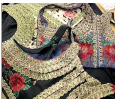
Novo ruho KUD- u Konoplje