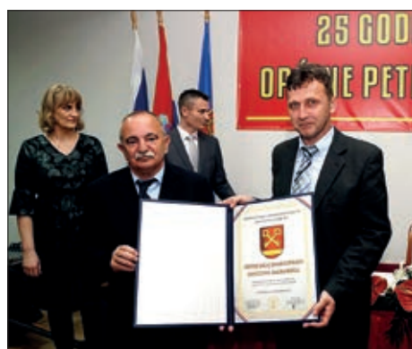
Priznanje santovačkoj Hrvatskoj samoupravi