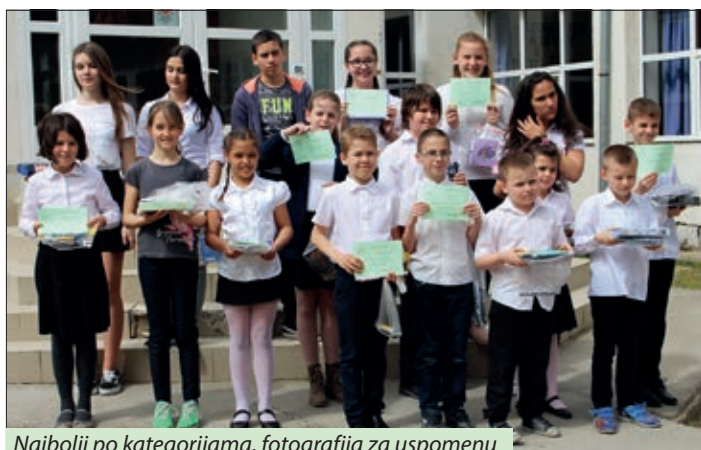
Najbolji po kategorijama, fotografija za uspomenu