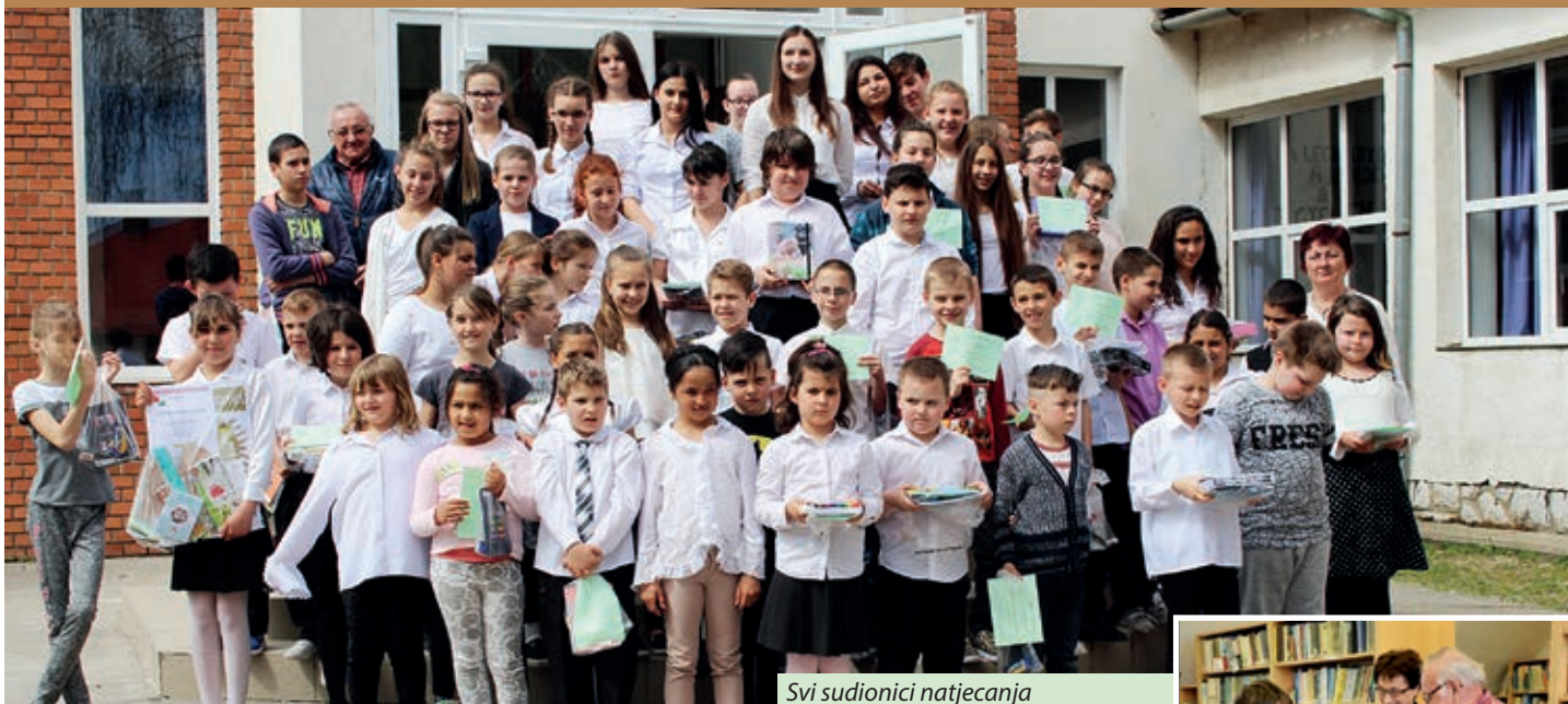
Svi sudionici natjecanja

U organizaciji salantske osnovne škole, 5. travnja priređeno je redovito godišnje školsko natjecanje u kazivanju stihova i proze na hrvatskom jeziku. Po običaju, na natjecanju sudjeluju brojni učenici koji u školi pohađaju nastavu hrvatskoga materinskog jezika, a natjecanje se održava u školskoj knjižnici. Tako je bilo i ove godine, kaže za Hrvatski glasnik organizatorica natjecanja, nastavnica hrvatskoga jezika i književnosti i povijesti te zamjenica ravnateljice salantske osnovne škole Eva Adam Bedić. U toj se školi hrvatski jezik i književnost predaje u satnici materinskoga narodnog jezika, od prvog do osmog razreda. Djeca i roditelji pri upisu u školu mogu birati nastavu hrvatskoga materinskog jezika. U školskoj godini 2017./2018. sedamdesetak učenika sudjeluje u nastavi, a nastavnice su Eva Adam Bedić i Timea Horvat Takač.