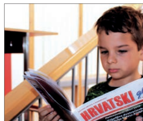
Čitajte i širite Hrvatski glasnik!