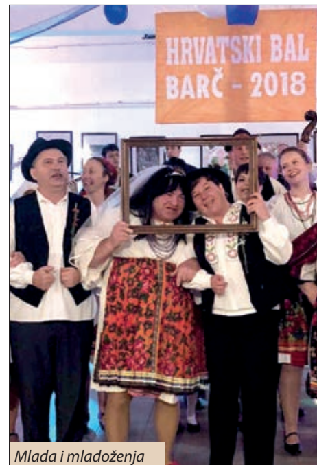
Mlada i mladoženja