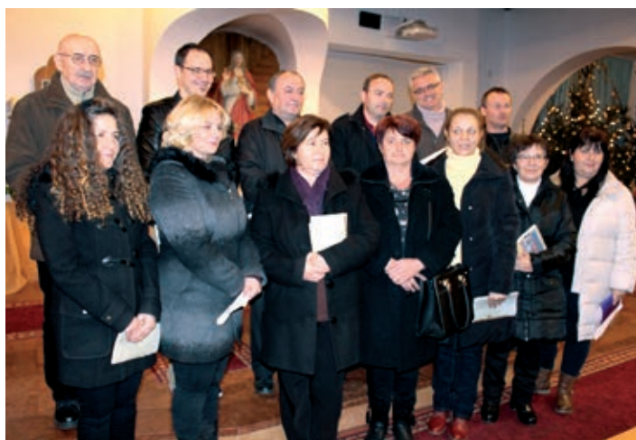
Crkveni pjevački zbor Župe Uznesenja Blažene Djevice Marije

Evandeoski tekst nam pripovijeda o mudracima koji dođoše s istoka pokloniti se novorođenome Kralju, premda nisu znali točno mjesto gdje se rodio. Tako u čitanje svetoga evanđelja po Mateju Mt 2, 1-12 stoji: Kad se Isus rodio u Betlehemu judejskome u dane Heroda kralja, gle, mudraci se s istoka pojavise u Je-