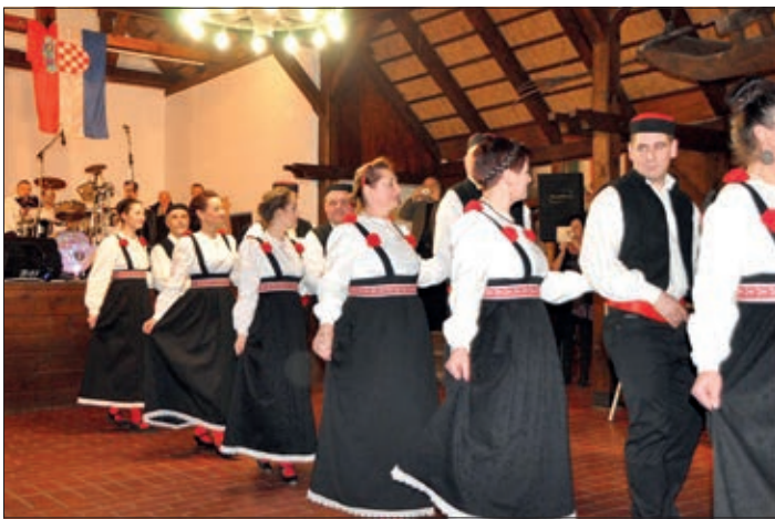
Erčinski KUD „Zorica“