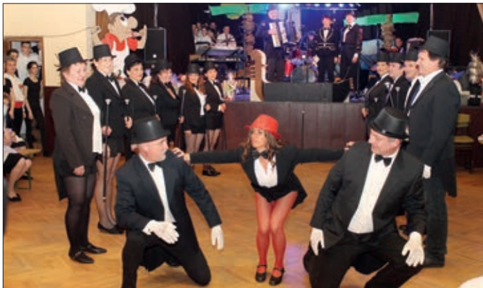
Step tancoši-seniorski folklorši