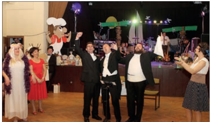
„Susjedi“ su nas otpeljali u domovinu trih tenorov