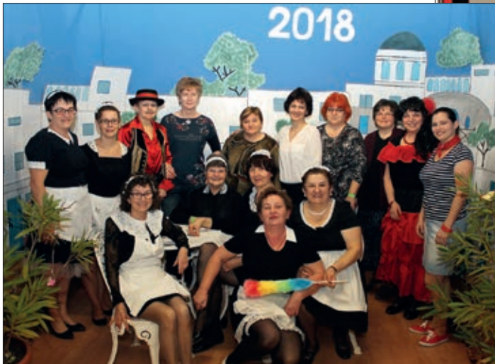
Jačkarice zbora Ljubičica