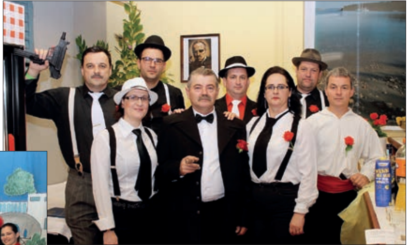
Petroviska mafija – dio organizatorov bala „Za Petrovo Selo“