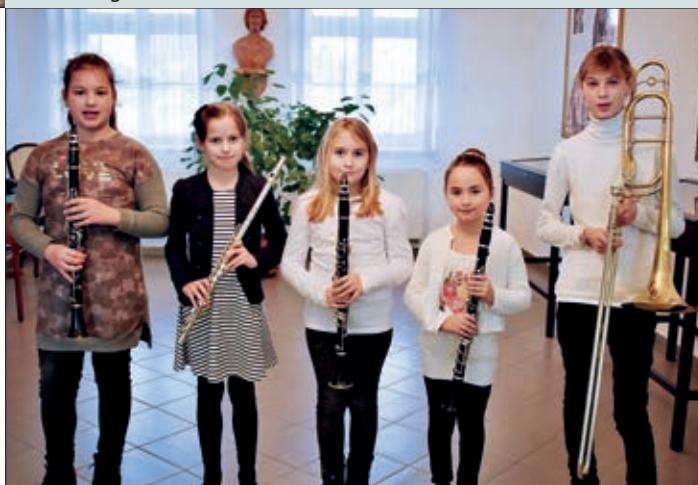
Nakon uspješnog ispita

će vjerojatno i roditelji razmisliti o kupnji glazbala, jer najbolje je kada ga djeca dnevno mogu uzeti u ruke i kad imaju vremena, da malo vježbaju. S obzirom da su djeca iz hrvatskih naselja i da se u njihovo podučavanje uključio i Hrvatski zavod, nastavnici posvećuju posebnu pozornost hrvatskoj glazbi. Prema planu, na kraju školske godine polaznici će prirediti mali koncert.