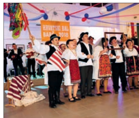
Hrvatski bal u Barči