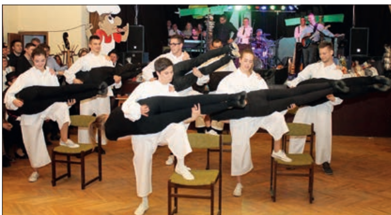
Svirka na živi instrumenti u izvedbi mlade kompanije HKD-a Gradišće

svisno pomažu da znova provedu još i već generacijov jednu odličnu noć. Od 2016. ljeta glavni organizatori imaju i suorganizatore, ljetos su to bile jačkarice zbora Ljubičica, kljetu pak ti budu folklorši HKD Gradišće. U programu smo vidili tancoše sto ruk, izabranu brigadu čistačić (Ljubičica) popularnoga ugarskoga jačkara Gyurija Kordu (Erik Škrapić), tri pajtaše u sjajnoj suradnji u hajzlinu, tri talijanske tenore u pratnji Lollobrigide, Sofije Loren i Ciccoline (Grupa Susjedi), step-tancoše (seniorski tancoši) i mlade muzičare sa živimi instrumenti (mlada garnitura HKD-a Gradišće). Potom je zavladao u dvorani preskrajno veselje, pri valceru, kolu, tangovu su se obrnuli maškaranti, a pravoda je mafijaška fešta durala s Pinka-bandom i Pinkicom do rane zore. Prez pardona do perfektnosti... Tiho