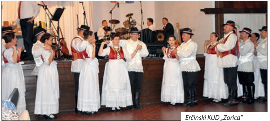
Erčinski KUD „Zorica“