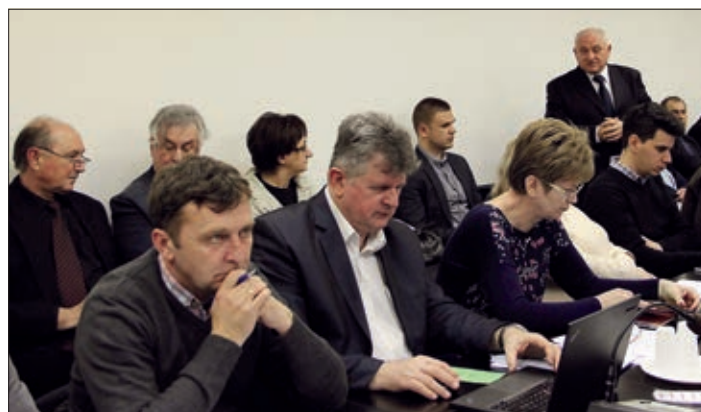
Dio HDS-ovih zastupnika

Donesene su i odluke Skupštine o datumu i mjestu upisa djece u vrtiće u HDS-ovu održavanju, tako u Pečuhu, Santovu i područnom vrtiću Hrvatskog vrtića, osnovne škole, gimnazije i učeničkog doma Miroslava Krleže u Sambotelu, odnosno o području primanja djece u njemu. Upisi u vrtiće će biti 26. i 27. travnja, oba dana od 7 do 17 sati.