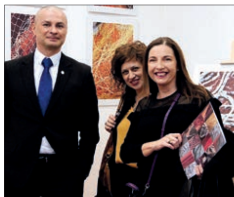
Izložba u Croatici