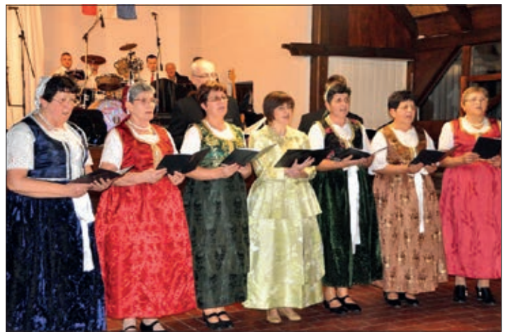
Kalački Ženski pjevački zbor „Ružice“