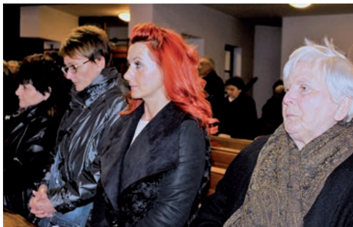
Okupio se lijepi broj vjernika.

Evandeoski tekst nam pripovijeda o mudracima koji dođoše s istoka pokloniti se novorođenome Kralju, premda nisu znali točno mjesto gdje se rodio. Tako u čitanje svetoga evanđelja po Mateju Mt 2, 1-12 stoji: Kad se Isus rodio u Betlehemu judejskome u dane Heroda kralja, gle, mudraci se s istoka pojavise u Je-