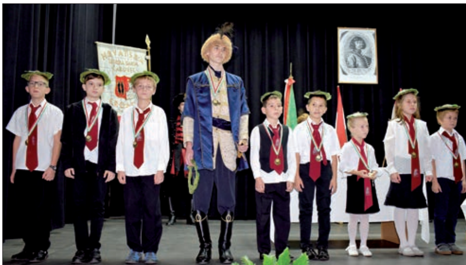
Najbolji sudionici Spomen-utrke Zrinski

Dan Nikole Zrinskog u keresturskoj osnovnoj školi obilježava se od 1991. g. otkada je ustanova nazvana po imenu toga velikana. Iz godine u godinu programi su bogatiji, na obilježavanju sudjeluju predstavnici raznih ustanova, organizacija s jedne i druge strane granice. Ovogodišnje obilježavanje od 29. rujna ostvareno je u punom sjaju, prethodnog je dana održana đačka konferencija o Zrinskim, četvorica novih kadeta prisegnula je, dodijeljene su stipendije „Prof. dr. Karlo Gadanji“, održana su razna natjecanja, prethodni zadatci, biciklistička i spomen-utrka Zrinski, natjecanje u kazivanju stihova. Na svečanosti bili su brojni gosti, među njima generalna konzulica Republike Hrvatske u Pečuhu Vesna Haluga i prof. dr. Karlo Gadanji, načelnici i ravnatelji hrvatskih pomurskih i međimurskih naselja.