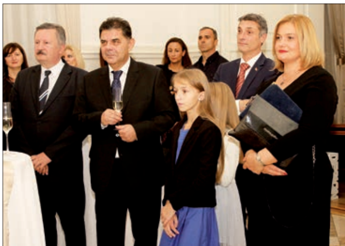
Generalna konzulica Vesna Haluga i veleposlanik Mladen Andrić

Generalna konzulica Republike Hrvatske u Pečuhu Vesna Haluga sa suprugom priredila je 13. listopada obilježavanje Dana neovisnosti Republike Hrvatske i susret s novoimenovanim veleposlanikom Republike Hrvatske u Mađarskoj Nj. Eksc. Mladenom Andrićem za predstavnike Hrvata s područja koje pokriva generalni konzulat Republike Hrvatske u Pečuhu.