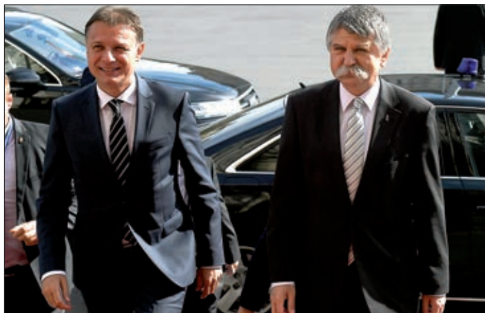
Gordan Jandroković sa svojim domaćinom Lászlóom Kövérom