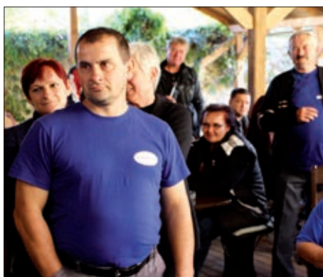
Kuglanje u Barči