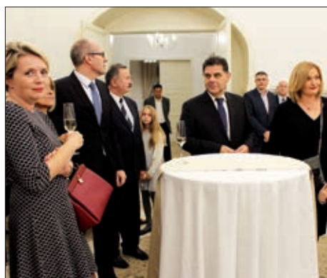
Dan neovisnosti obilježen u Pečuhu