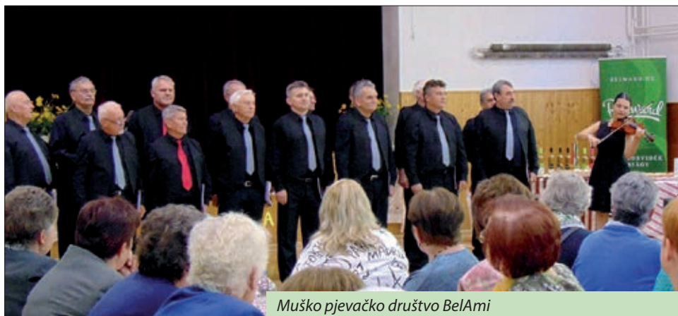
Muško pjevačko društvo BelAmi

Program druženja u školskoj sportskoj dvorani okupio je domalo 150 nazočnih, a započeo je nakon pozdravnih riječi