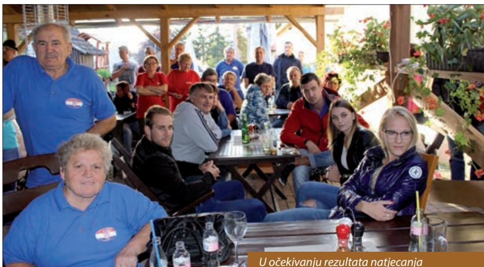
U očekivanju rezultata natjecanja