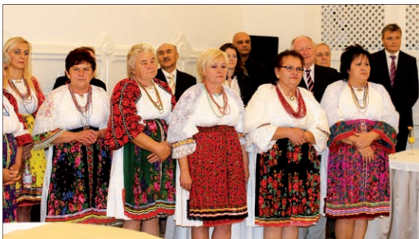
Dio uzvanika i ženski pjevački zbor „Korjeni“