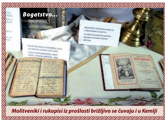
Molitveniki i rukopisi iz prošlosti brižljivo se čuvaju i u Kemlji