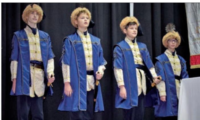
Novi Zrinski kadeti prisežu.

gasnog društva u Keresturu, poručio je djeci neka se upoznaju sa svijetom, neka svugdje nauče ono što je dobro, ali neka se vrate u svoje rodno mjesto, da ga obožavaju i razvijaju sa svojim znanjem. Najbolji sudionici Utrke Zrinski nagrađeni su lovorovim vijencem i medaljama, njihovu je nagradu predala generalna konzulica gđa Haluga. Treba napomenuti da su djeca od početka školske godine svaki petak trčala, neki čak do mjesta Novoga Zrina. U okviru svečanosti, samouprave, mjesne ustanove, roditeljsko vijeće i pojedini razredi kod spomenika položili su vijence. Učenici su dobili i prethodni zadatak, izradbu makete nekadašnje hrvatske, tradicionalne kuhinje pod nazivom „Kuhinja moje bake“. U natječaju su sudjelovale