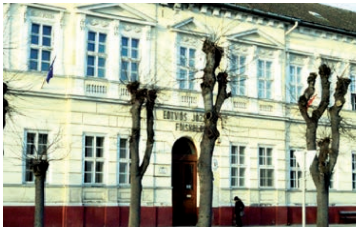
Stara zgrada bajske visoke škole