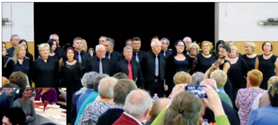
Svi zajedno u pjesmi