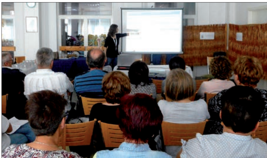
Predavanje naslova Metodičke mogućnosti u tekstovima za djecu

Zašto je usavršavanje nastavnika hrvatske manjine toliko bitno? Vrlo jednostavno – oni su ti koji, u velikoj mjeri, u Mađarskoj kroje budućnost hrvatskoga jezika, a k tome i samobitnosti. Oni ponajprije trebaju biti odlični motivatori koji će djeci približiti Hrvatsku kao domovinu njihovih predaka. Od motivacije kreće sve. Stvara se interes, želja za novim saznanjima i unutarnja motiviranost sva-