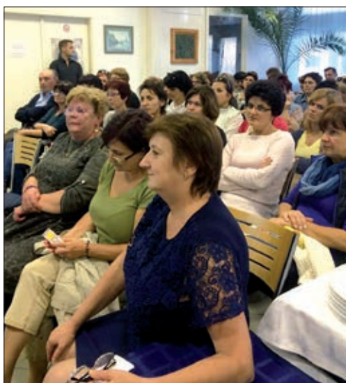
Dio sudionika usavršavanja