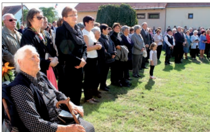
Na otvaranje muzeja čuda Petrovišćanov je došlo i iz drugih naselj