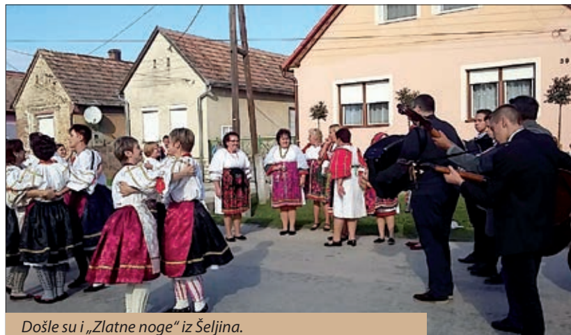
Došle su i „Zlatne noge“ iz Šeljina.