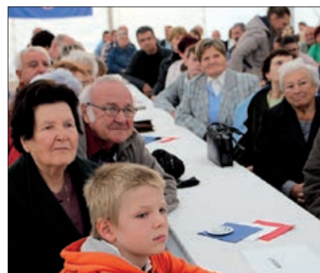
Hrvatski dan u Poganu