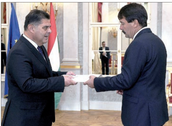
Veleposlanik Mladen Andrić predaje vjerodajnice predsjedniku Jánosu Áderu.

U Zrcalnoj dvorani Ureda mađarskoga predsjednika novoimenovani veleposlanik Republike Hrvatske Mladen Andrić 2. listopada 2017. predao je vjerodajnice mađarskomu predsjedniku Jánosu Áderu, a zatim u Plavome salonu Ureda upriličen je i susret vlp. Andrića i predsjednika Ádera. Potom je hrvatski veleposlanik Mladen Andrić položio vijenac kod groba bivšega mađarskoga premijera Imrea Nagya, na Trgu junaka. Istoga je dana u večernjim satima, u veleposlanikovo rezidenciji u povodu predaje vjerodajnice bio i susret s novoimenovanim veleposlanikom.