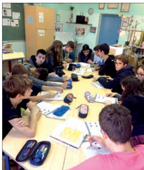
Učenici Osnovne škole Jurja Dalmatinca