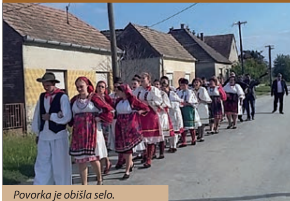
Povorka je obišla selo.