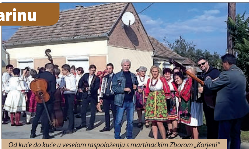
Od kuće do kuće u veselom raspoloženju s martinačkim Zborom „Korjeni“

U organizaciji Hrvatske samouprave sela Starina, 30. rujna priređen je III. Berbeni festival. Nakon svete mise na hrvatskom jeziku koju je u mjesnoj crkvi služio šeljinski župnik Jozo Egri, komu pripada i Starin, vesela povorka folklorša uputila se u berbenoj povorci uz pjesmu i svirku Starinom i njegovom dugom ulicom kako bi došla do novoga zdanja starinskih Hrvata, ta mošnjega Hrvatskog doma, zgrade koju su prije nekoliko mjeseci zajedničkim snagama i ulaganjem kupile Zaklada „Biseri Drave“ i Hrvatska samouprava sela Starina. Među folkloršima svojim veseljem prednjačili su domaćini: Tamburaški orkestar i zbor Biseri Drave, mladi svirci potpomognuti divnim glasovima svojih pjevačica. Uz njih su došli i martinački prijatelji, na čelu sa ženskim Pjevačkim zborom „Korjeni“ te šeljinska Folklorna skupina „Zlatne noge“. Nakon gotovo trosatnog veselja, družilo se uz večeru, a potom je počela zabava i druženje uz glazbu. Priredbu su pomogli: Zajednica podravske Hrvata, Savez Hrvata u Mađarskoj, Kulturni i sportski centar „Josip Gujaš Džuretin“, Ministarstvo ljudskih resursa – Fond za razvoj ljudskih potencijala. Priredbu je svojim odazivom počastio i konzul savjetnik generalnog konzulata Republike Hrvatske u Pečuhu Neven Marčić. Zastupnici Hrvatske samouprave, na čelu s Jozom Perjašem, trude se unijeti sadržaje u svoje programe koji će privući stanovnike sela Starina. Zahvaljujemo okružnoj bilježnici Emi Solga Cserdi na poslanim fotografijama.