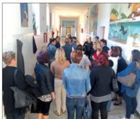
HDS-ovo usavršavanje za pedagoge 4. – 5. stranica