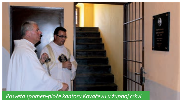
Posveta spomen-ploče kantoru Kovačevu u župnoj crkvi

Ovogodišnji Dan Santovaca, koji se od samih početaka priređuje prigodom župnoga proštenja odnosno blagdana Velike Gospe, posvećen je obilježavanju 50. obljetnice „Zlatne lopte“ za najboljeg nogometaša „Starog Kontinenta“ 1967. godine, legendarnog nogometaša Ferencvaroša i mađarske reprezentacije Alberta Flóriána, rodom Santovca, hrvatsko-njemačkoga podrijetla.