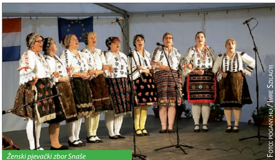
Ženski pjevački zbor Snaše