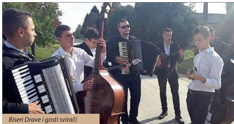
Biseri Drave i gosti svirači