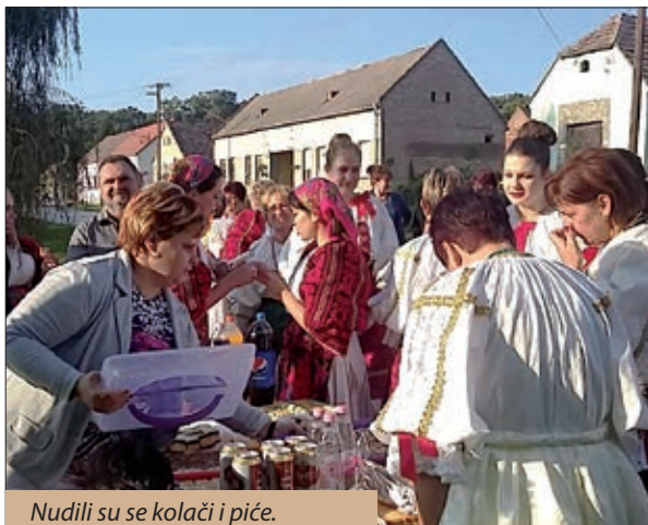
Nudili su se kolači i piće.