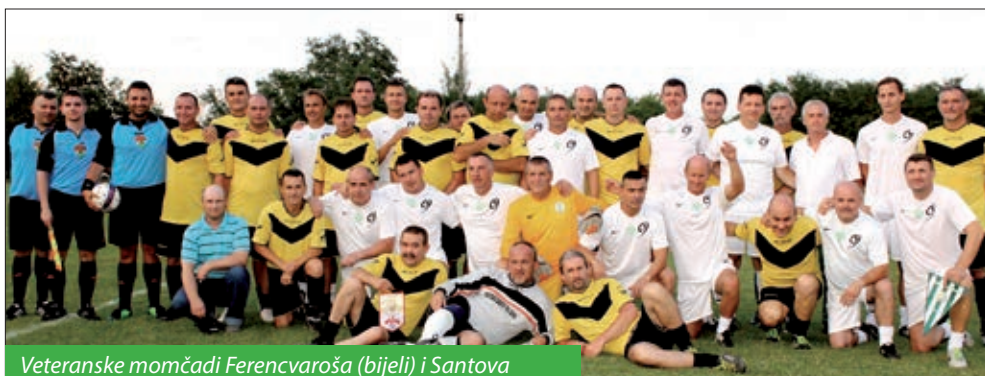
Veteranske momčadi Ferencvaroša (bijeli) i Santova