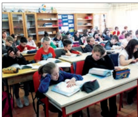
Koljnof – Buševac – Vukovina