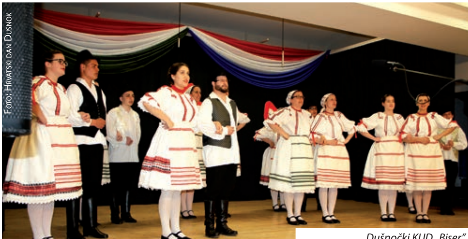
Dušnočki KUD „Biser“