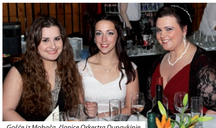
Gošće iz Mohača, članice Orkestra Dunavkinje