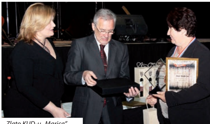
Zlato KUD-u „Marica“