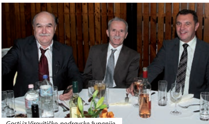
Gosti iz Virovitičko-podravske županije