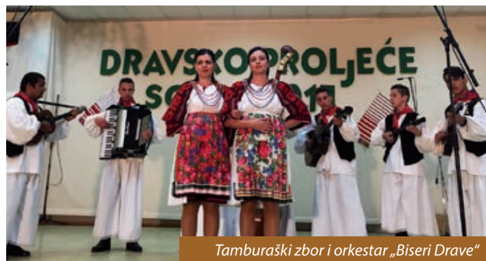
Tamburaški zbor i orkestar „Biseri Drave“

Prošlogodišnje jubilarno, deseto Dravsko proljeće održano je u Starinu, a ovo, jedanaesto, u Sopju 22. travnja. Jer svake se godine okupljaju Hrvati na dvjema obalama rijeke Drave, jedne godine u Starinu, druge u Sopju. I tako iz godine u godinu, jedne