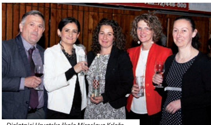
Djelatnici Hrvatske škole Miroslava Krleža