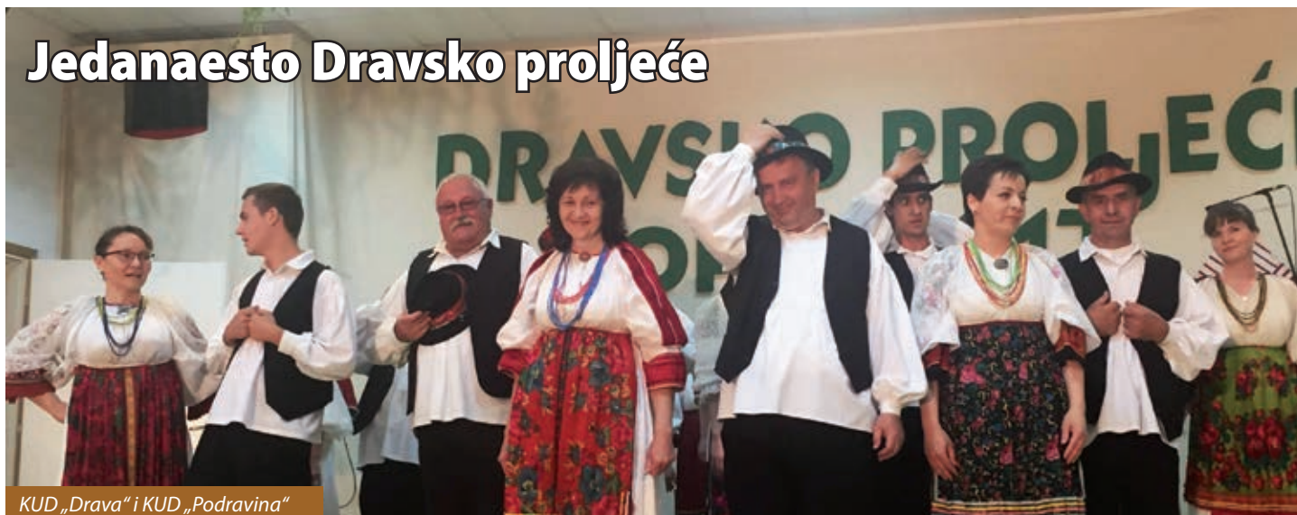
KUD „Drava“ i KUD „Podravina“