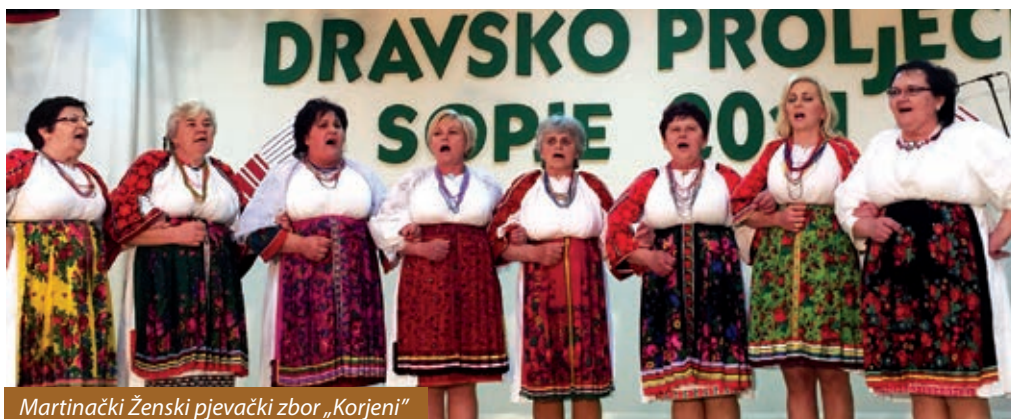
Martinački ženski pjevački zbor „Korjeni“

vac“, starinski Tamburaški sastav „Biseri Drave“, barčanski KUD „Podravina“, lukoviški KUD „Drava“ i martinački ženski pjevački zbor „Korjeni“, KUD „Suopolje“ iz Suhopolja, KUD „Lipa“ iz Nove Bukovice, KUD „Usora“ iz Usore, KUD „Virovitica“ iz Virovitice, Udruga žena „Josipovo“ iz Josipova, KUD „Seljačka sloga“ iz Šljivoševaca, Klapa „Eufemija“ s otoka Raba, KUD „Mikleuš“ iz Mikleuša, KUD „Podravina“ iz Čađavice, KUD „Laz“ iz Laza i Klapa „Mela“ s Murtera.