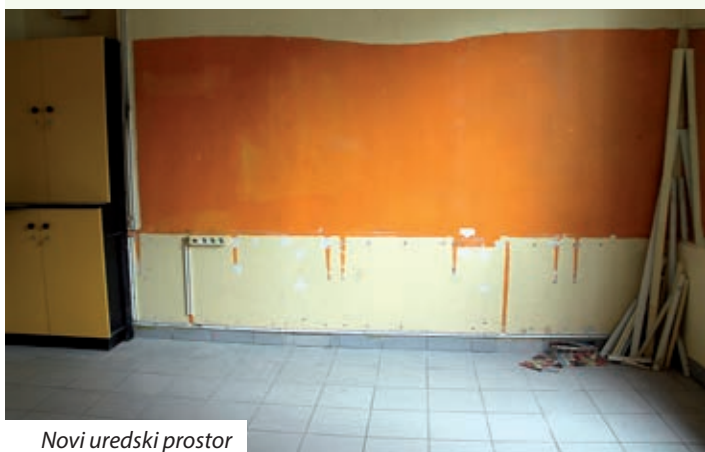
Novi uredski prostor