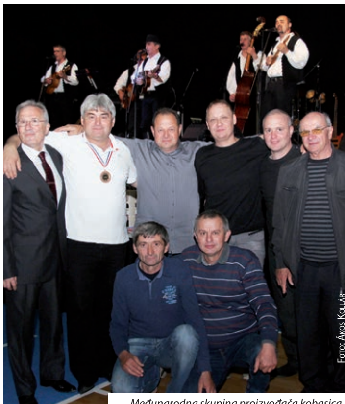
Međunarodna skupina proizvođača kobasica