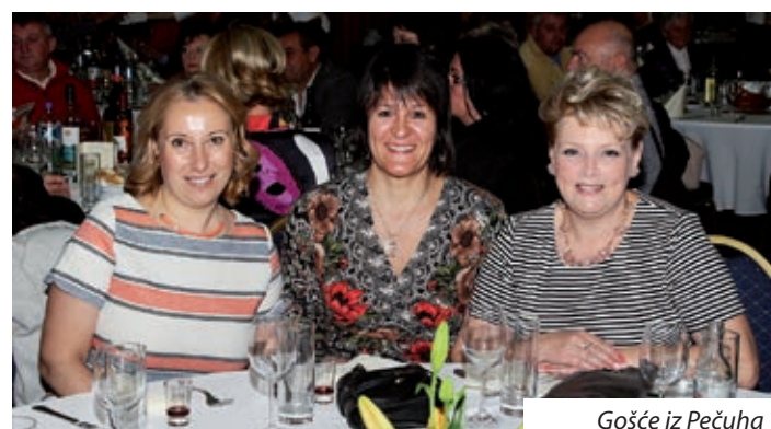
Gošće iz Pečuha

Priredba je ostvarena s potporom: Hrvatske državne samouprave, Zajednice podravskih Hrvata, Saveza Hrvata u Mađarskoj, Hrvatske samouprave Baranjske županije, Hrvatske samouprave Šomođske županije, pečuške Hrvatske samouprave, Hrvatskoga kluba Augusta Šenoa, Joze Harija, zastupnika u Skupštini grada Pečuha te Ministarstva ljudskih resursa.