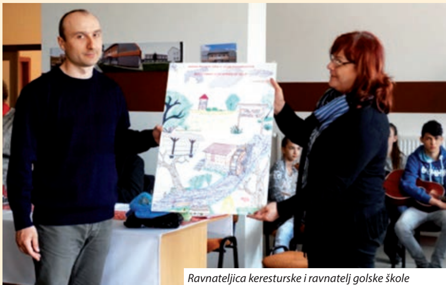
Ravnateljica keresturske i ravnatelj golske škole