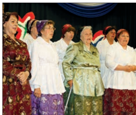
Hrvatski dan u Dušniku