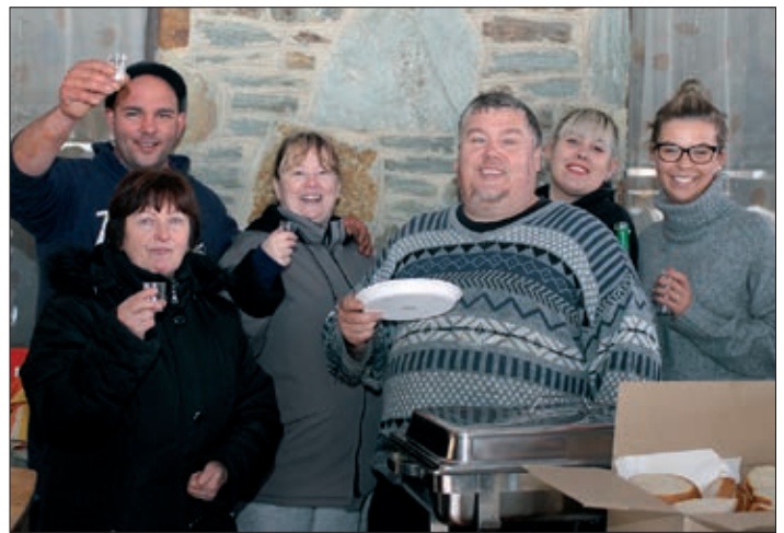
Koljnofke i Petroviščani u veselju