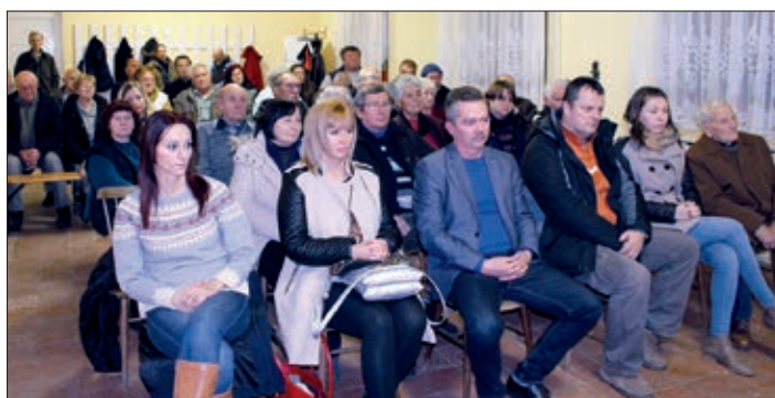
Znatiželjni Semeljci i njihovi prijatelji

nek kezdetei (1986.); Baranyai horvát népviselet (1986.); Bosanski Hrvati u okolici Pečuha (1991.); A Pécs környéki bosnyákok (horvátok) állattartása (1995.); Magyarországi horvát népművészet (2001.); Magyarországi horvát, szerb és szlovén temetők temetkezési szokások és sírjelek (1996. – 2003.); Pécsi boszniai-bosnyák horvátok (2006.); Honfoglalás előtti és Árpád-kori szlávok Baranyában (2008.); Honfoglalás előtti és Árpád-kori szlávok a Dunántúlon (2009.) te najnovija knjiga „Szemely évszázadai“.