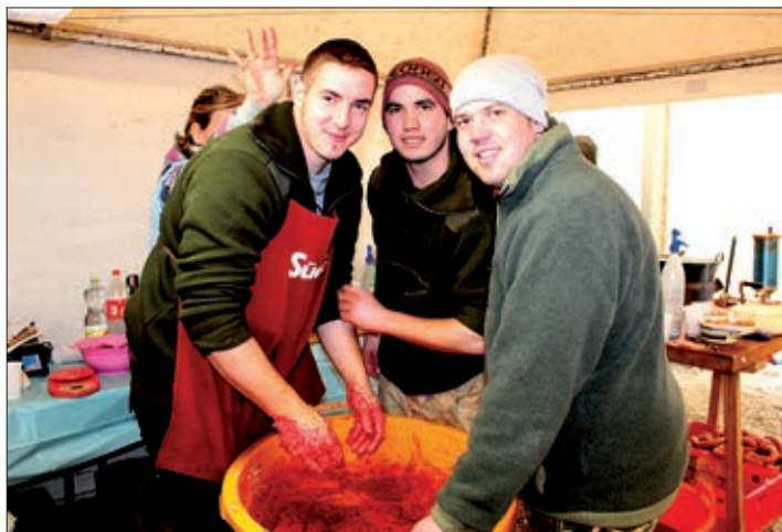
Sumartonski su dobitnici nagrade „Najbolja ekipa Festivala“.