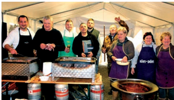
Serdahelci peku ukusne tanke kobasice.

Nekoć su se za svinjokolje pripremali već prije nekoliko dana, nije bilo drukčije ni u Keresturu, organizatori su se pobrinuli da sve družine imaju dovoljno prostora za svinjokoljske poslove, osigurali im po dvije svinje od kojih su do podneva trebali pripremiti juhu, glavno jelo, pečene krvavice, kobasice i čvarke. To su članovi ocjenjivačkog suda i vrednovali. Jutarnje okupljanje začinila je rakija nakon čega je devet družina krenulo na posao, ubrzo je ispržena, očišćena svinja i vrsni majstori su krenuli u mljevenje mesa, kuhanje iznutrica, rezanje slanina, punjenje krvavica i kobasica, kuhanje kisele juhe, pečenje mesa, jetara i drugih svinjokoljskih specijaliteta. Na pozornici su se okupljali predstavnici raznih organizacija koji su bili zaslužni da se ostvari vrlo uspješna manifestacija. Među njima su bili: Peter Cseresznyes, državni tajnik, načelnici Lajoš Pavlic i Stjepan Tatai, Karlo Gadanji