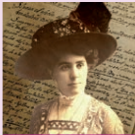
Ivana Brlić Mažuranić