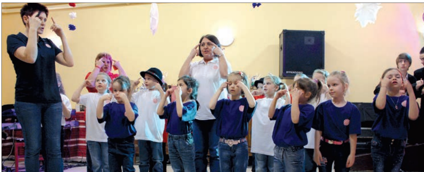
Polaznici hrvatske skupine šeljinskog vrtića sa svojim odgojiteljicama