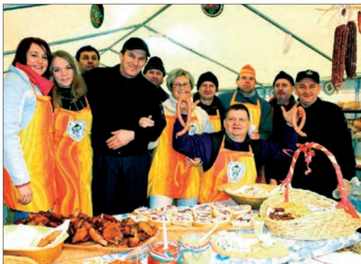
Keresturski vatrogasci ovaj put su palili vatru za pečenje mesa i kobasice.