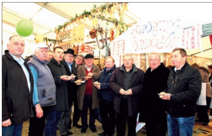
Gosti iz Međimurja