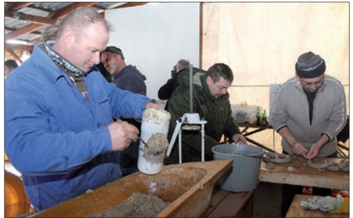
Svi su djelali marljivo