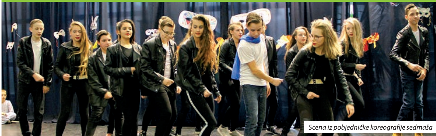
Scena iz pobjedničke koreografije sedmaša

Po prihvaćenome HOŠIG-ovu Planu aktivnosti, 16. veljače 2017. u predvorju te ustanove održan je maskenbal osnovnoškolaca. Na toj školskoj priredbi rado sudjeluju svi naraštaji, o tome je svjedočio i ovogodišnji događaj. Od 5. do 8. razreda maskare su bile natjecateljskoga značaja, no svim sudionicima najvažnija je bila dobra zabava.