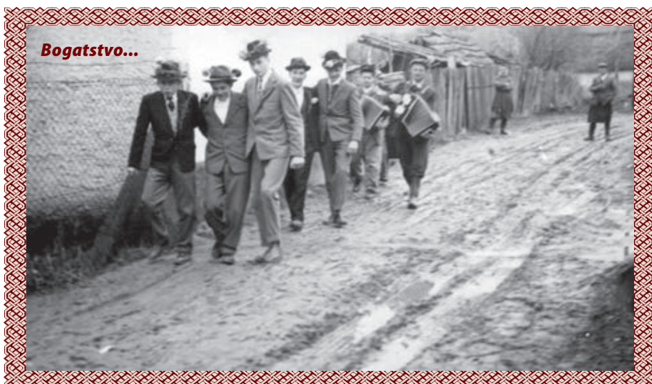
„Branje rozmarina“ u Gornjem Četaru 1957. ljeta u Ulici Attila Józsefa