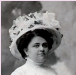
Marija Jurić Zagorka

Prigodom Međunarodnog dana žena pripremili smo vam zadatak o poznatim hrvatskim književnicama. Povežite ime književnice s odgovarajućim brojem rečenice koja se po sadržaju veže za određenu autoricu.