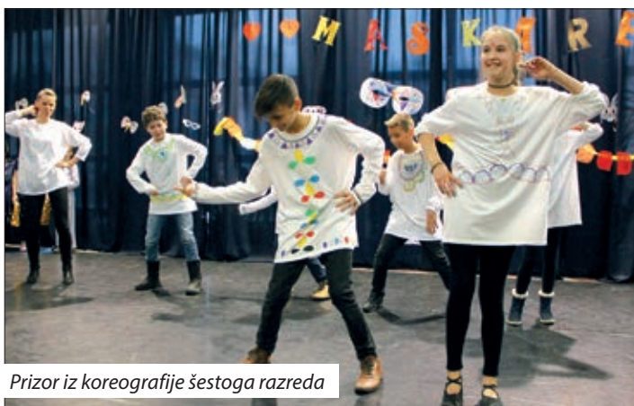
Prizor iz koreografije šestoga razreda