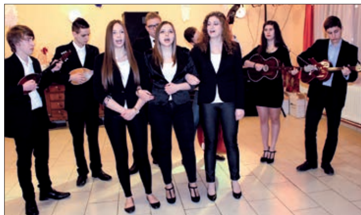
Orkestar mjesne Hrvatske samouprave s pjevačicama