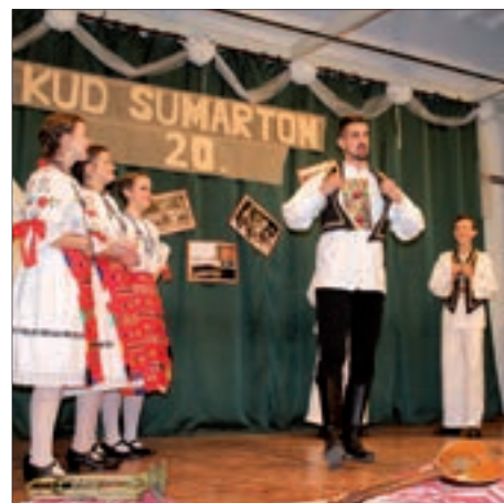
Dvadeset godina djelovanja KUD-a Sumarton 14. stranica