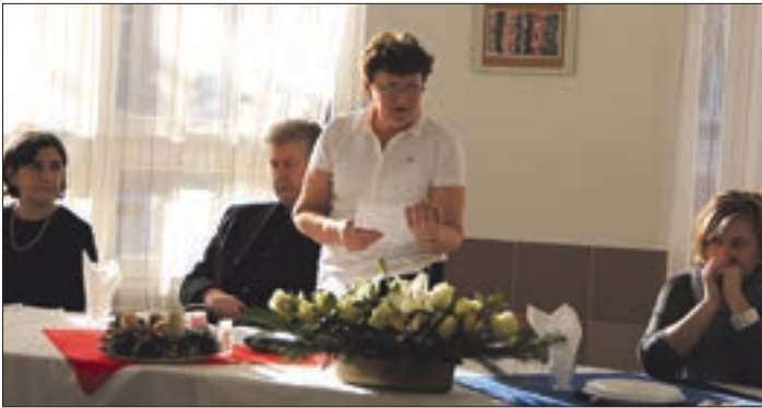
Izvišće o radu

Dana 6. prosinca 2016. upriličena je godišnjaobvezatna javna tribina Hrvatske samouprave grada Budimpešte. Hrvatska samouprava grada Budimpešte 2016. godine gospodarila je proračunom, zajedno s pričuvom od lanjske kalendarske godine, od 12 milijuna forinta.