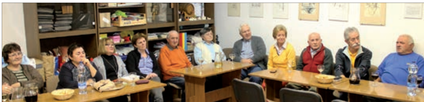
Publika u Kisegu