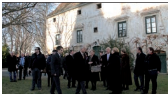
Na dvoru Erdődyjevoga kaštela

u Austrijskom parlamentu Niki Berlaković, kot i članica Zemaljske vlade Gradišća u Austriji, Verena Dunst. Predsjednik čakovečke Zrinske garde, Alojzije Sobočanec, zahvalio je predstavnikom Hrvatskoga kulturnoga društva, Gradišćansko-ugarskoga kulturnoga društva i veleposlanikom ki su „držali čitavo vrime inicijativu da se postavlja ova krasna ploča ka nas podsjeća na junaka dvih narodov, hrvatskoga i ugarskoga. Nikola Šubić Zrinski od Turkov je branio Europu, ka danas živi u zajedničtvu.“ Spomen-ploča, na hrvatskom, nimškom i ugarskom jeziku daje svim na znanje da se je u tom kaštelu Nikola Zrinski Sigetski 21. rujna 1564. vjenčao sa svojom drugom ženom Evom