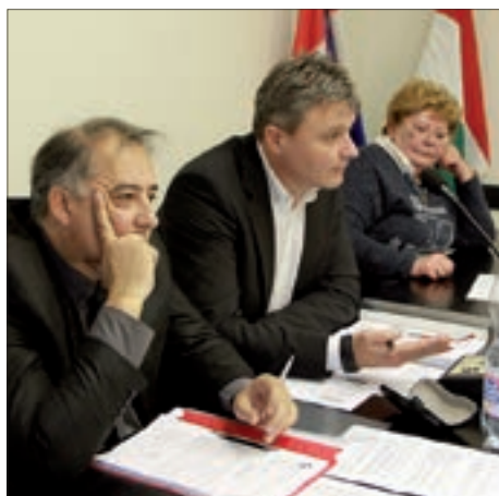
Skupština Hrvatske državne samouprave 3. stranica