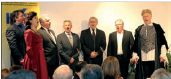
„U boj, u boj, u boj“ – odlična je bila izvedba iz opere Nikole Šubića Zrinskog