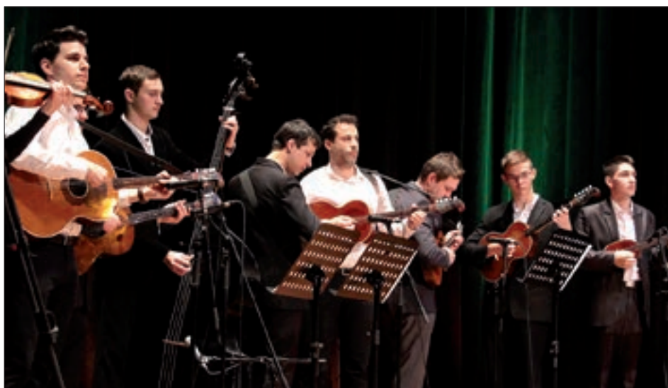
Dio svirača na pozornici Centra „Kodály“

Oni su izveli vijenac hrvatskih božićnih skladba pod dirigentskom palicom Aleksandre Čeliković koja je uvježbala zbor i Orkestar u sklopu projekta njihove pripreme za božićni nastup na hrvatskome Božićnom koncertu u Koncertnoj dvorani „Kodály“. U drugom dijelu večeri gledateljstvo je zabavljao jedan od poznatijih hrvatskih izvođača zabavnih nota Zlatko Pejaković i prateći Orkestar Romantika.