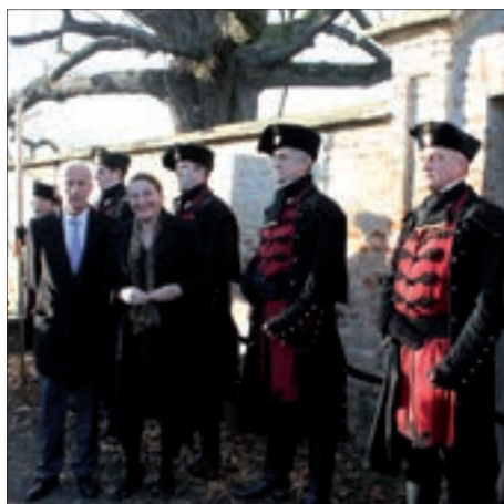
Spomen-ploča Nikoli Zrinskom 11. stranica