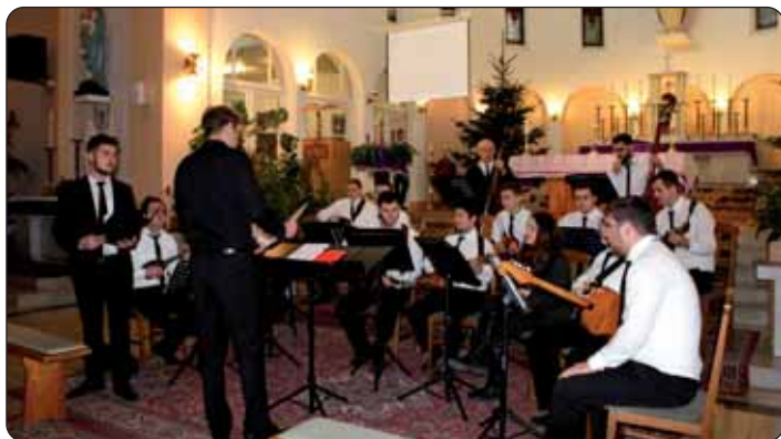
Županijski tamburaški orkestar „Stjepan Bujan-Stipić“