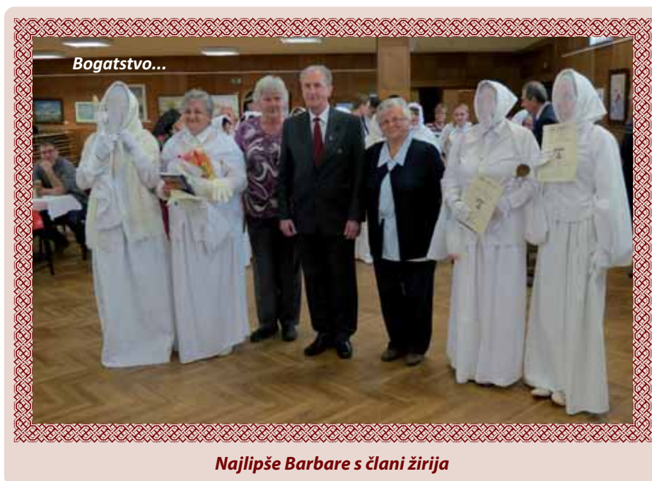
Najlipše Barbare s člani žirija