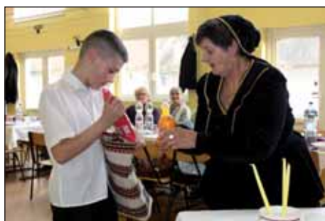
Materice i Oci