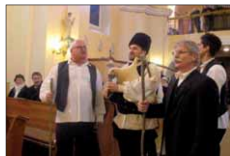
„Veselje ti navješćujem...“