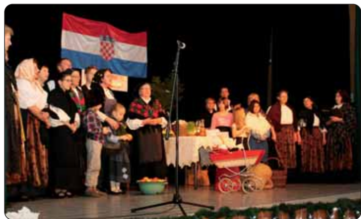
KUD „Konoplje“ u božićnom igrokazu