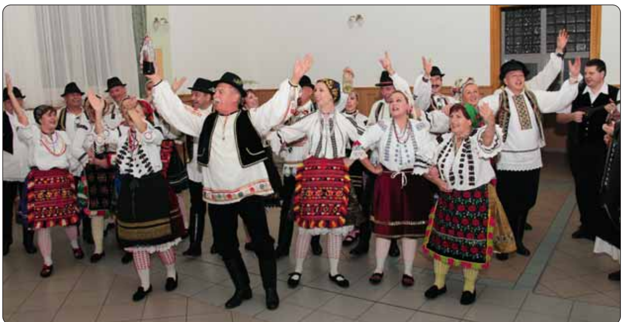
Nastup kukinjskoga KUD-a „Ladislav Matušek“