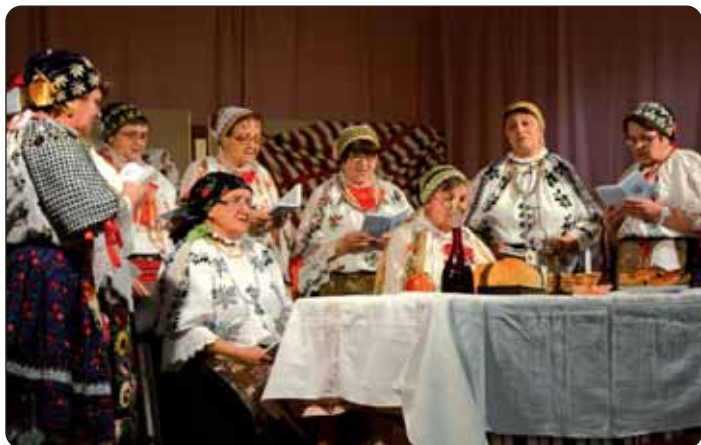
Članice kozarskoga Ženskog pjevačkog zbora „Biser“ prostrle su božićni stol.