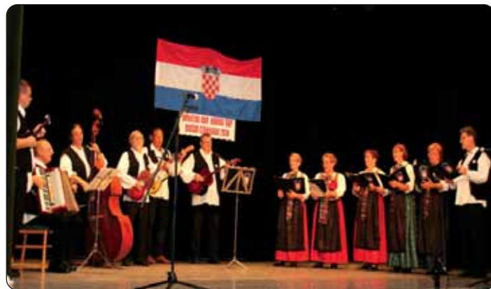
Starogradska „Trzalica“ najnovije djela s jačkari.