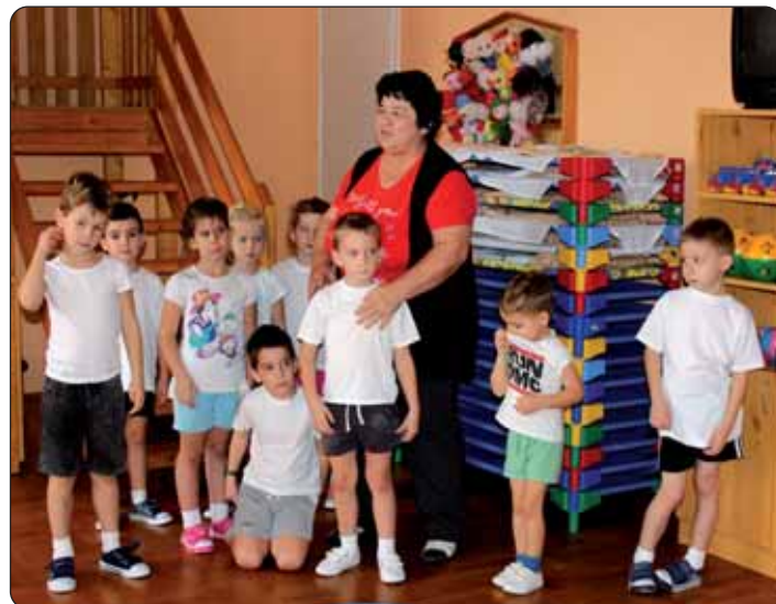
U serdahelskome dječjem vrtiću