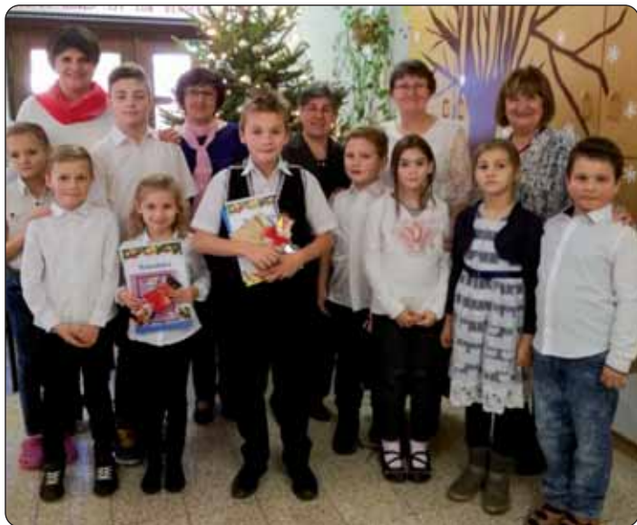
Dio naticateljev s organizatori i kotrigi žirija

Osnovna škola Hrvatskoga Židana je po prvi put pozvala gradišćanske školare iz nižih razredov na božićno naticanje u povidanju pjesam i proze. Cilj priredbe je bio da u lipoj božićnoj atmosferi uz prigodne pjesme i povidajke se naticaju i družu najavljeniki. Ideja priredbe je došla od toga da otkidob nij' velike škole u Hrvatskom Židanu, odonda još nigdar nisu došla dica iz drugih hrvatskih sel u židansku školu, ali 9. decembra, u petak, aula židanske škole se je napunila s gosti iz raznih krajev.