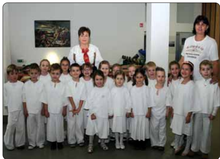
Dica i odgojiteljice bizonjske Čuvarnice „Sunašće“