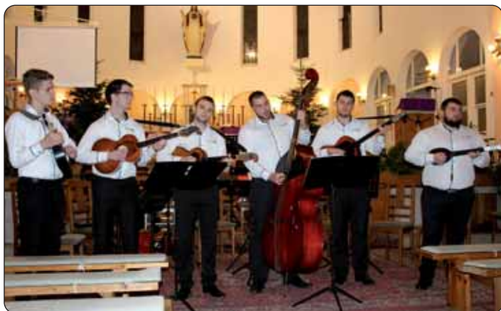
Tamburaški sastav Stoboš na Adventskom koncertu

U organizaciji kaniške Hrvatske samouprave i Hrvatskoga kulturno-prosvjetnog zavoda „Stipan Blažetin“, 10. prosinca u crkvi Srca Isusova priređen je Adventski koncert na kojem je nastupio mjesni Tamburaški sastav Stoboš i Županijski tamburaški orkestar „Stjepan Bujan-Stipić“ iz Međimurja.