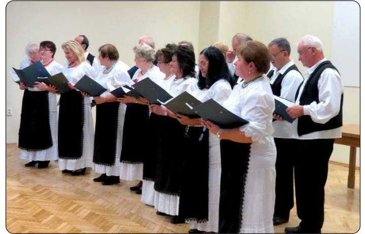
Mješoviti pjevački zbor Most - Duga

iz raznih krajeva, tako i iz Podravine, Međimurja. Zatim je slijedio nastup profesora i učenika gradske Glazbene škole „Ferenc Liszt“, koji su na flauti i glasoviru predstavili božićne pjesme te poznate dijelove klasične glazbe. Na kraju večeri organizatori su pripremili bogat švedski stol i svakoga pozvali na večeru, a za veselje i glazbu pobrinuo se orkestar Zbora. Ove godine kapošvarska Hrvatska samouprava planira još jedan izlet u Ludbreg, Varaždin i Čakovec. Potporu su dobili iz natječaja koji je raspisao Središnji državni ured za Hrvate izvan Republike Hrvatske putem Generalnog konzulata u Pečuhu, pa će 16. prosinca poći na izlet, a tim će programom završiti ovu godinu.