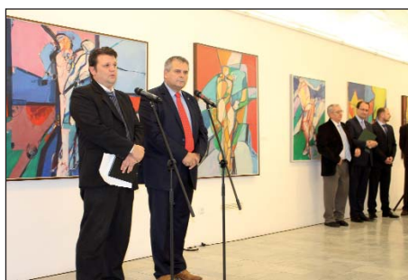
Sto godina Price