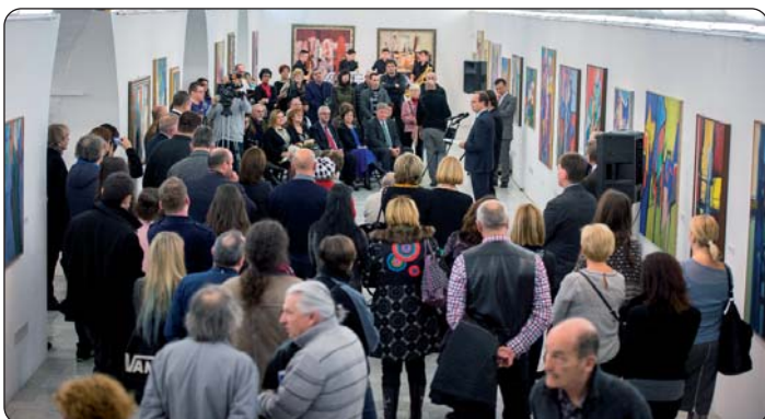
Mnoštvo znatizeljnih posjetitelja u Pečuškoj galeriji