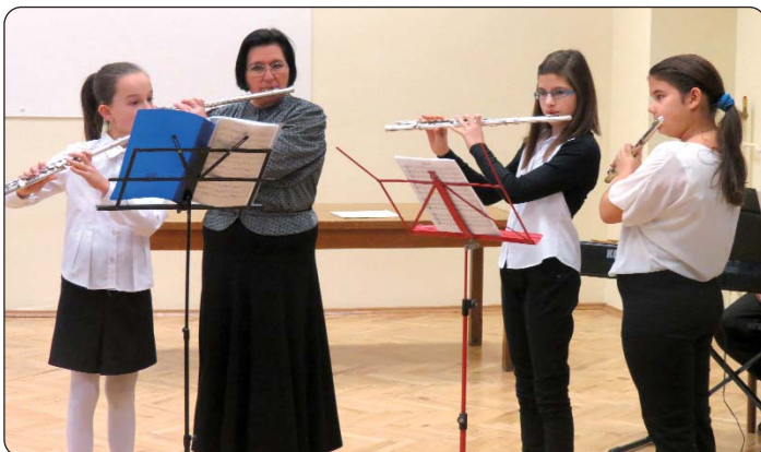
Nastup profesorice i učenika gradske Glazbene škole „Ferenc Liszt“