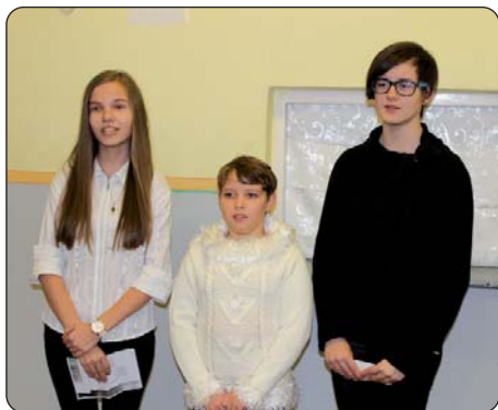
Učenice mjesne osnovne škole

U organizaciji Hrvatske samouprave, uoči treće nedjelje došašća, 10. prosinca, u okviru Spomendana Ivana Petreša, u Kačmaru su proslavljene Materice i Oci, jedinstveni blagdan majka i očeva bunjevačkih Hrvata koji se slave treće, odnosno četvrte nedjelje došašća.