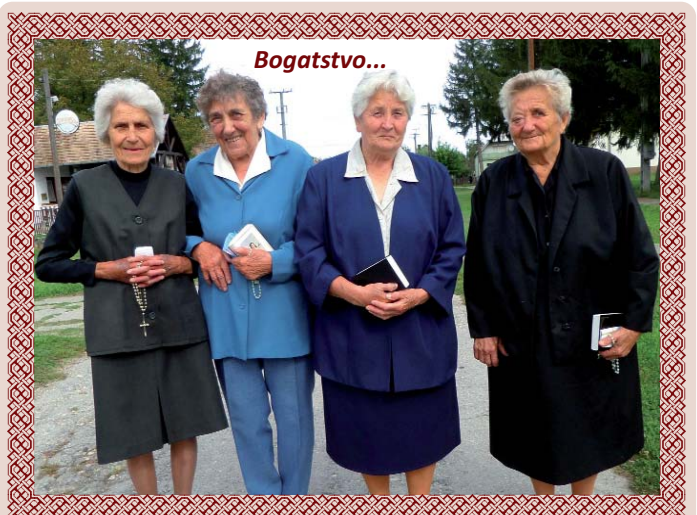
Lukovišćanke u rujnu 2016. godine.

ZAGREB – Odjel za povijest Matice hrvatske organizirao je Međunarodni znanstveni skup „Franjo Josip i Hrvati u Prvome svjetskom ratu“ 21. studenoga 2016., u Velikoj dvorani Matice hrvatske. Među sudionicima je bio i niz predavača iz Mađarske. Tako je predavanje imao Ladislav Heka s Pravnog fakulteta Sveučilišta u Segedinu. Predavanje naslova Franjo Josip I. i hrvatsko-ugarska državna zajednica u Prvome svjetskom ratu. Imre Ress s budimpeštanskog Instituta za povijest Mađarske akademije znanosti, predavanje naslova Utjecaj mađarskih političara na vanjsku politiku Franje Josipa (1914. – 1916.), Krisztián Csaplár Degovics sa spomenutog Instituta, predavanje naslova Franjo Josip i Albanci (1912. – 1916.). András Gerő s ELTE & CEU, budimpeštanskog Instituta za habsburšku povijest, izlagao je na temu Promjene u sjećanju na Franju Josipa u Mađarskoj. Uz njih bilo je još niz predavača i izlaganja, a predstavljeno je i izdanje Manfred Rauchensteiner: Der Erste Weltkrieg und das Ende der Habsburgermonarchie 1914-1918 (predstavljajući: Dinko Šokčević i Manfred Rauchensteiner).