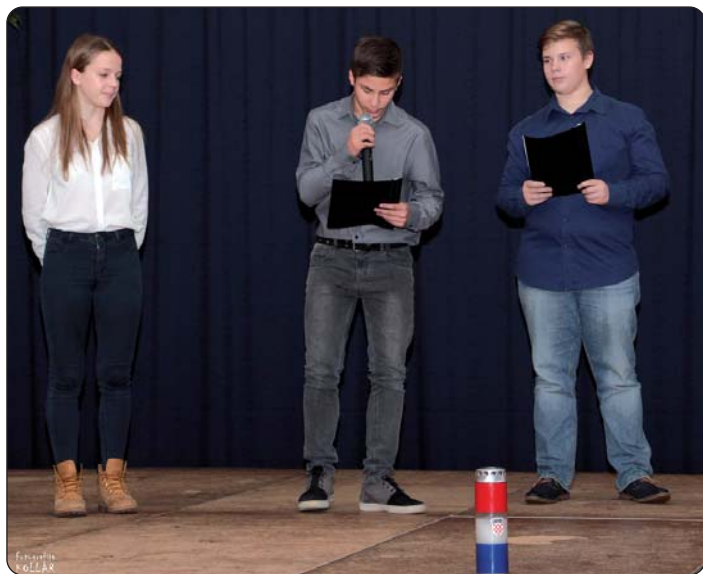
Dio programa učenika osmog razreda