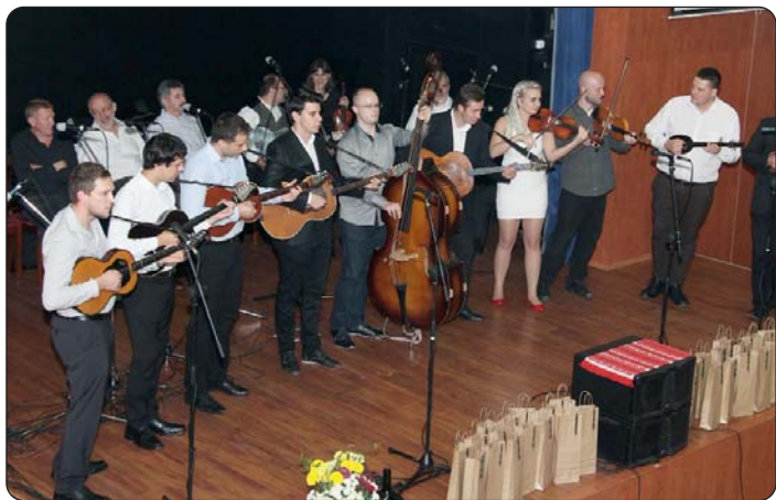
Naraštaji vizinaša na pozornici

U svečanoj dvorani Fakulteta za obrazovanje odraslih i razvoj ljudskih resursa Sveučilišta u Pečuhu, 22. listopada 2016. godine održan je svečani bal povodom 35. rođendana pečuskog Orkestra Vizin. Organizator je bila Kulturna udruga Vizin, a u pripremama aktivni su bili mnogi članovi Udruge i prijatelji Orkestra. Priredba je ostvarena uz financijsku potporu Hrvatske samouprave grada Pečuha.