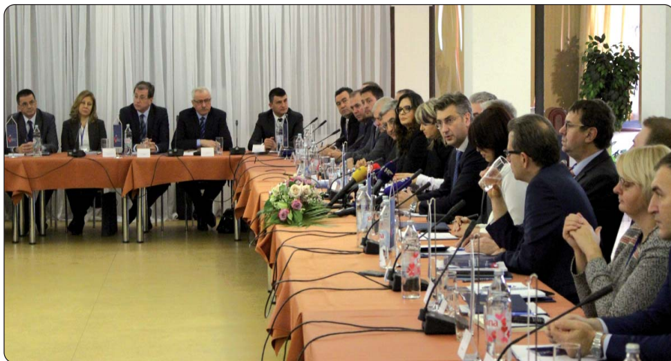
Sjednici Savjeta Vlade Republike Hrvatske za Hrvate izvan Republike Hrvatske pribivao je i hrvatski premijer Andrej Plenković.

Radi unapređenja i jačanja suradnje Republike Hrvatske s Hrvatima izvan Hrvatske, 9. – 10. prosinca u Vukovaru je održana 3. sjednica Savjeta Vlade Republike Hrvatske za Hrvate izvan Republike Hrvatske na kojoj je istaknuto da su briga za Hrvate u BiH kao konstitutivnom i ravnopravnom narodu, skrb o hrvatskoj manjini u ostalim zemljama, afirmacija hrvatskog iseljeničtva te povratak iseljenika strateške zadaće rada aktualne vlade.