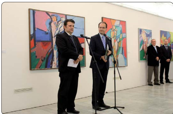
U Pečuškoj galeriji prilikom otvaranja retrospektivne izložbe Zlatka Price nazočne je pozdravio državni tajnik Péter Hoppál.