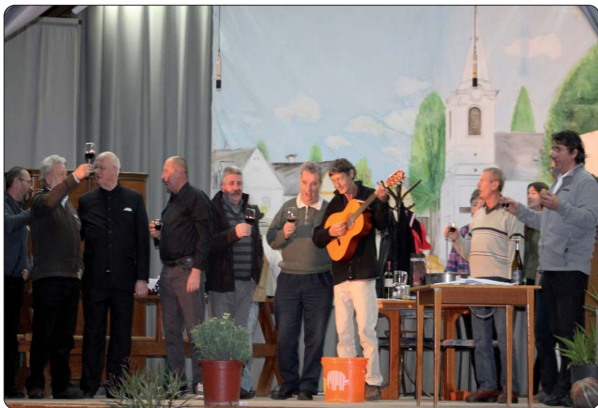
Završna slika radosti