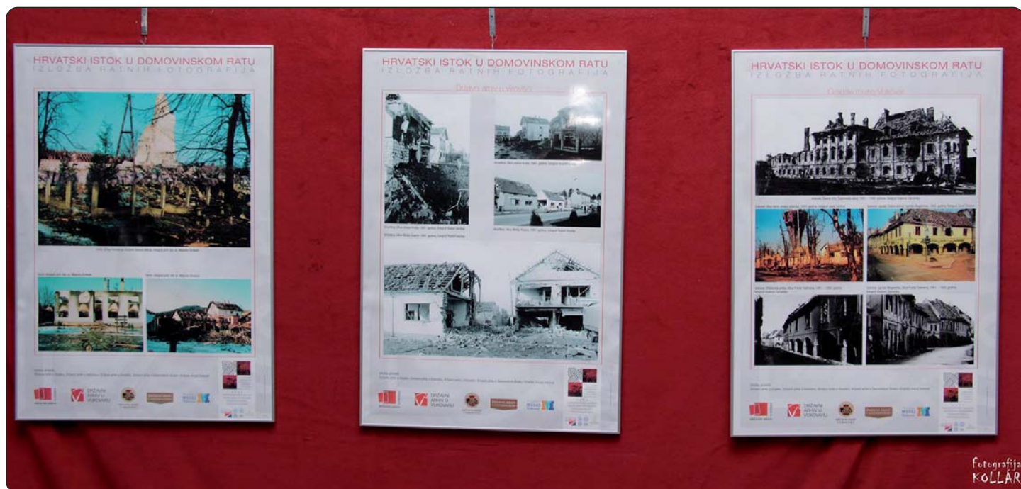
Dio izložbe „Hrvatski istok u Domovinskom ratu“ Državnog arhiva Vukovar