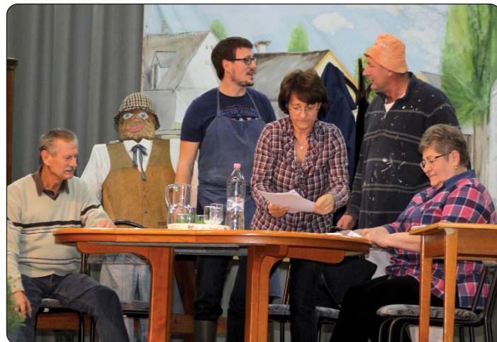
Koljnofski rutinirani igrokazači