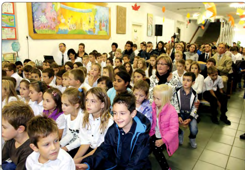
Na svečanom programu

Ijaši, koji opisuje doživljaje iz djetinjstva. Nit Bodoljaša nastavlja se do ulomka iz romana, odnosno do proglašenja rezultata Natječaja „Bodoljaši“, koji je raspisala serdahelska Hrvatska samouprava (rezultati na Maloj stranici) za učenike hrvatskih osnovnih i srednjih škola. Na svečanom programu Pomurskih jesenskih književnih dana Hrvatska samouprava „Stipan Blažetin“ dodjeljuje priznanja učenicima i odraslima. Priznanje za marljiv i ustrajan rad u učenju hrvatskoga jezika i njegovanju kulture dodjeljuje učenicima osmog razreda serdahelske škole, dobivaju ga učenici koji tijekom osam godina ostvaruju najbolje rezultate u učenju hrvatskoga jezika, sudjeluju na raznim hrvatskim programima i natjecanjima, te pomažu rad Samouprave. Odlukom Hrvatske samouprave „Stipan Blažetin“, u