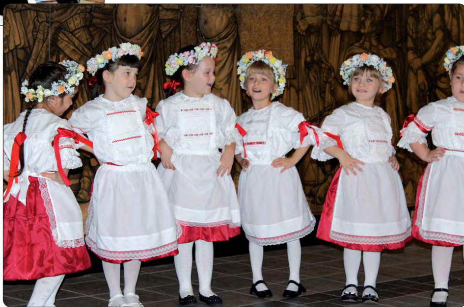
Djeca kaniškoga Dječjeg vrtića Rozgonyijeve ulice predstavljaju hrvatske igre.