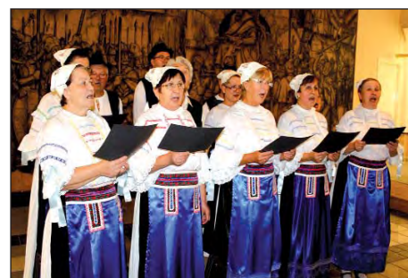
Hrvatski tjedan u Kaniži