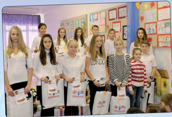
Nagrađeni učenici za stripove

Serdahelska Hrvatska samouprava „Stipan Blažetin“ u okviru Pomurskih jesenskih književnih dana svake godine raspisuje natječaj za učenike hrvatskih osnovnih i srednjih škola, da bi se bolje upoznali s književnom baštinom Hrvata u Mađarskoj. Ovogodišnja je tema bila dječji roman „Bodoljaši“ Stipana Blažetina, prigodom 30. obljetnice objavljivanja. Za niže razrede zadatak je bio oslikati kakav odlomak iz romana, a za više razrede i srednjoškolce napraviti strip iz raznih poglavlja. Uručba nagrada upriličena je na svečanom programu Pomurskih književnih dana. Nagrade je uručio Stjepan Turul, predsjednik serdahelske Hrvatske samouprave. U natječaju je sudjelovalo više od sedamdeset djece i predano je vrlo vrijednih radova, najbolje su ocijenili zastupnici Hrvatske samouprave uz stručnu pomoć učiteljica.