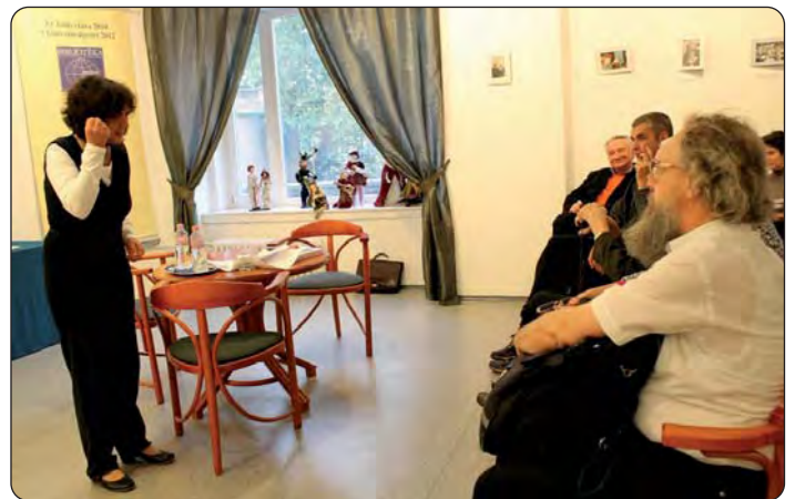
Nastup u Državnoj knjižnici za strane jezike

navanje običaja, narodne kulture svakomu su čovjeku neizostavni. Tako je za djecu jedna od najvažnije duhovne hrane: narodna priča. Narodna pripovijetka tada može biti izvorom zadovoljstva ako ju na tradicijski način predstavljamo djetetu. A za to trebamo poznavati pravila kazivanja i specifičnost njegova jezika. Kako bi naše dijete imalo sluh ili „uši za razumijevanje“, za slušanje i uživanje priče, prvo mi trebamo primiti do dandanas živuća svojstva te književne vrste.“ Također već u ranome djetinjstvu otkriva privlačnost kazivanja pripovijetke. Doduše, u to vrijeme i po Starinu pripovijedaju se poneke zgode, ali tada zapravo prisvaja umijeće pripovijedanja. Jednako tako voli kazivati pripovijetke za odrasle i za djecu, no dječji svijet i mašta sve više i više je privlačne. Svjesna je izazova da dječjoj duši treba ponuditi nešto posebno, i nije samo riječ o izboru, što će se čitati ili kazivati, nego naglasak je više na kakvoći interpretacije. Drži da ne postoji dobra ili loša