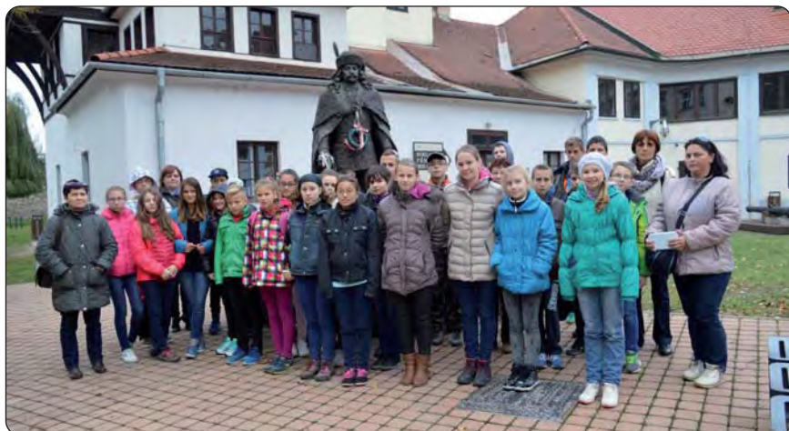
Pred kipom Ferenc Rákóczi II.