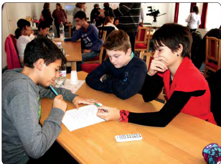
Na kvizu „Tko je bio Stipan Blažetin“