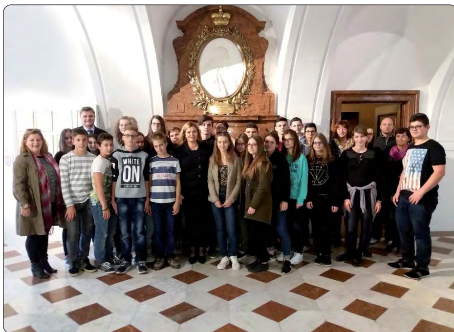
Učenici osmoga razreda sa svojim pratiteljima

PEČUH, VUKOVAR – Prilikom nedavnog boravak u Vukovaru učenika osmog razreda pečuške Hrvatske škole, s nadležnima u Memorijalnom centru Domovinskog rata, generalna konzulica Vesna Haluga, koja je organizirala posjet pečuških učenika Vukovaru, dogovorila je da će se Dan sjećanja na žrtvu Vukovara ove godine organizirati u Pečuhu, a s obzirom na važne obljetnice, 25. godišnjicu neovisnosti Republike Hrvatske i 25. obljetnicu vukovarske tragedije, biti obilježen 22. studenoga 2016. u organizaciji Memorijalnog centra Domovinskog rata, Hrvatske državne samouprave i Generalnog konzulata Republike Hrvatske u Pečuhu.