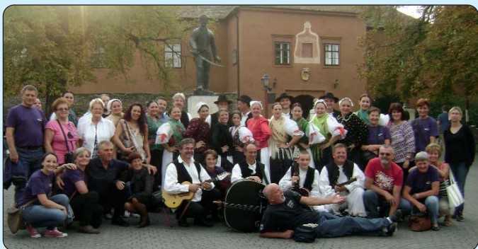
Spomen-foto pred kipom Nikole Jurišića

Na poziv kiseške Hrvatske samouprave, Kulturno-umjetničko društvo „Fijolica” iz međimurske Orehovice sudjelovalo je na Festivalu trgadbe u Kisegu. Suradnja med kiseškim pjevačkim zborom „Zora” i KUD-om „Fijolica” dura već duga ljeta. Dobre kontakte kaže da ljetos već po drugi put organiziraju svoje susrete. U protuliću Kisežani su posjetili „Orehijadu – Festival oraha i sega ka kcoj ide”, a sunčani jesenski dan pratio je KUD „Fijolicu” na putu u Kisegu da sa svojim nastupom obogatu kisešku manifestaciju.