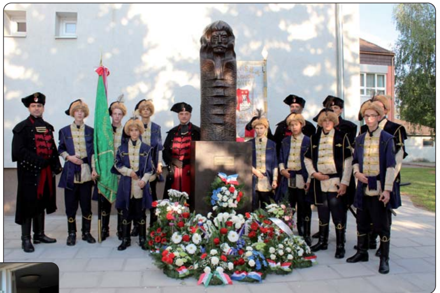
Novi članovi Zrinskih kadeta sa Zrinskom gardom