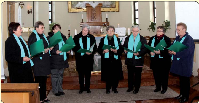
Ženski pjevački zbor iz Vršende