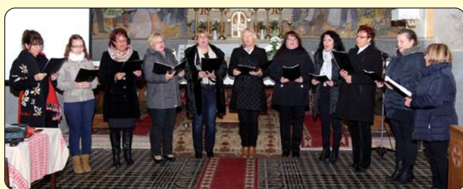
Ženski pjevački zbor iz Pogana

BUDIMPEŠTA – Na ovogodišnje Državno natjecanje srednjoškolaca iz hrvatskoga jezika i književnosti (OKTV) moglo se prijaviti do 23. rujna 2016. Na nadmetanje se prijavilo tri gimnazijalca budimpeštanskoga HOŠIG-a.