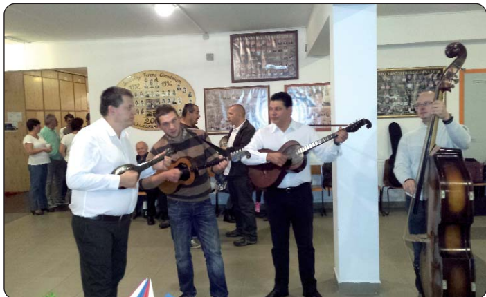
Tamburaši su i ovoga puta imali posla.

Domaćini ni ove godine nisu htjeli organizirati samo kuglanje, to je zagrijavanje, a nakon natjecanja i zabava svi su posjetitelji programa pozvani u barčansku gimnaziju da tamo nastave druženje i zabavu uz ukusnu večeru i odličnu glazbu.