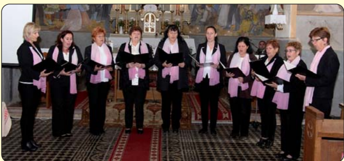
Ženski pjevački zbor iz Pečuha