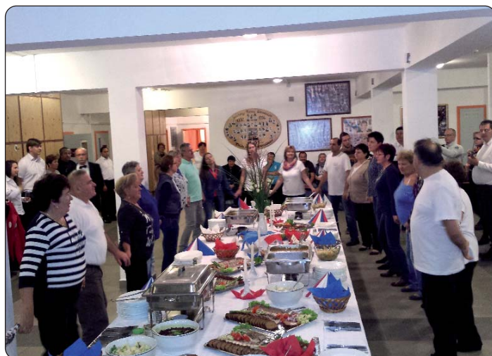
Oko bogatoga stola okupilo se veselo društvo.