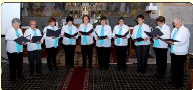
Ženski pjevački zbor iz Kozara