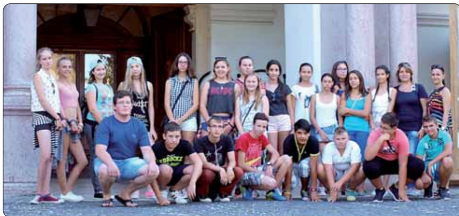
Kod Kraljevskoga dvorca u Godlovu