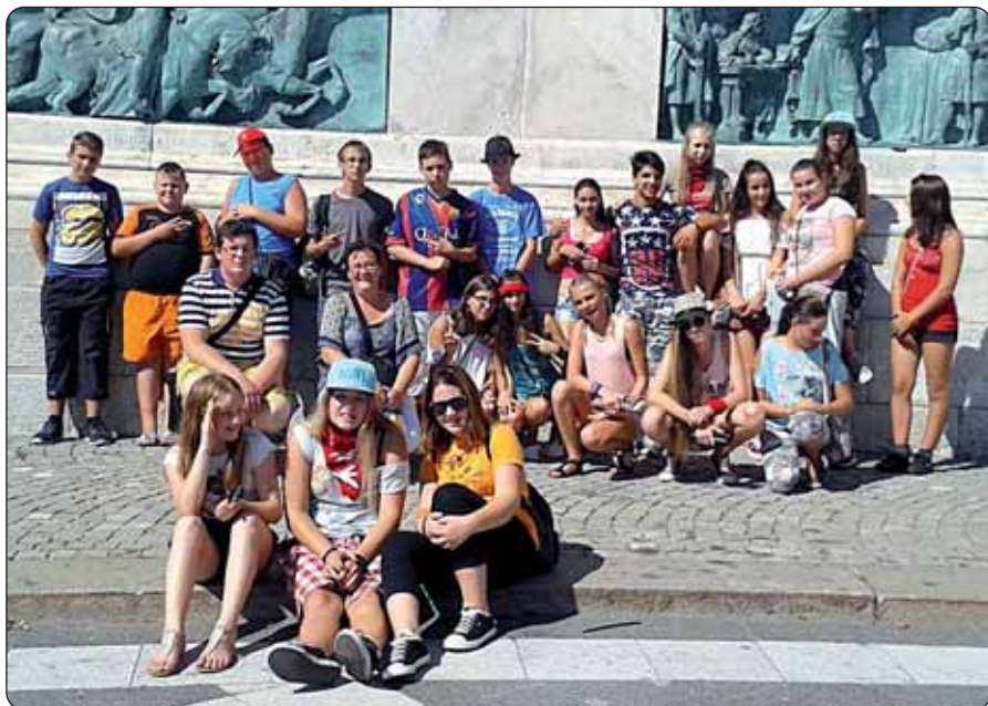
Na Trgu junaka