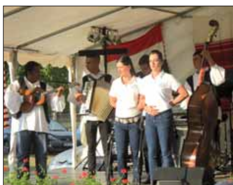
Hrvatski ljetni festival u Potonji