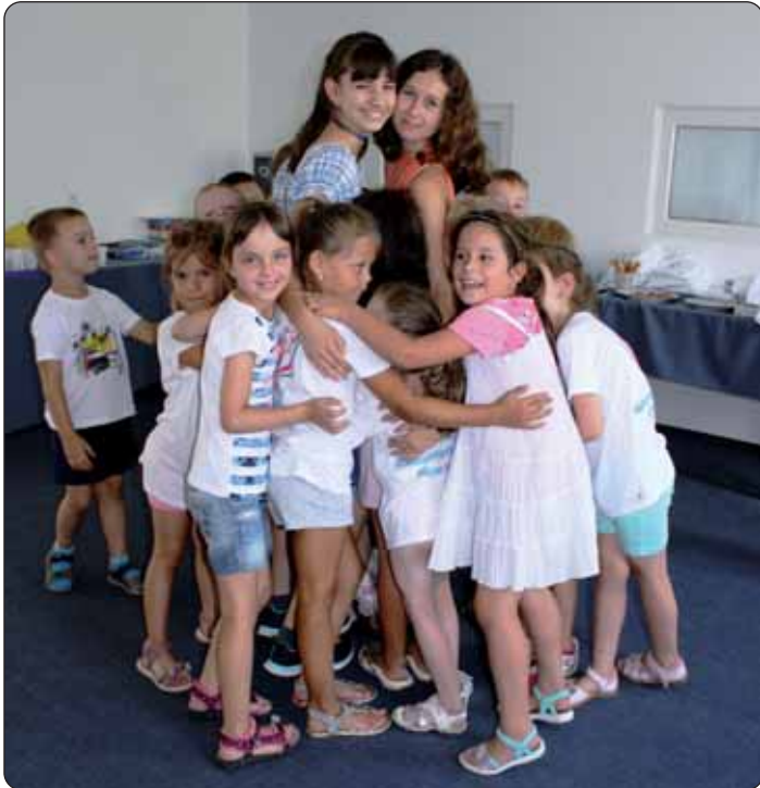
Igra s dobrovoljcima

U hrvatski dječji kamp prijavilo se tridesetero djece iz Serdahela, Pustare, Letinje, Kaniže i Budimpešte, čiji su roditelji rodom iz pomurskih mjesta.