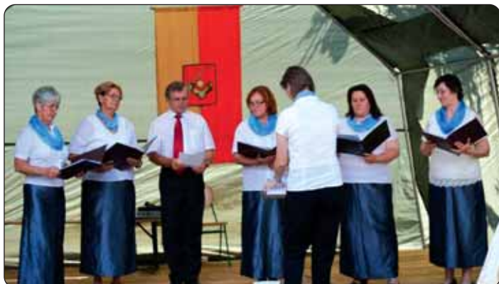
Jačkarni zbor „Sv. Cecilija“ na kulturnom programu