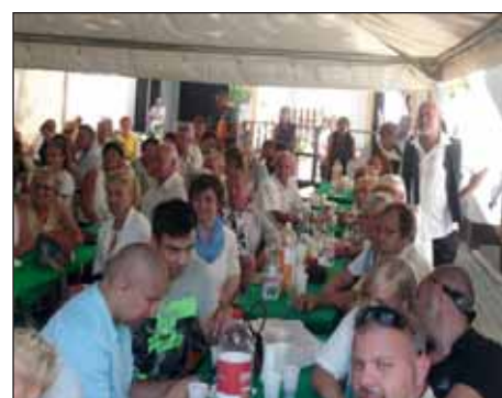
Svečanost u Plajgoru