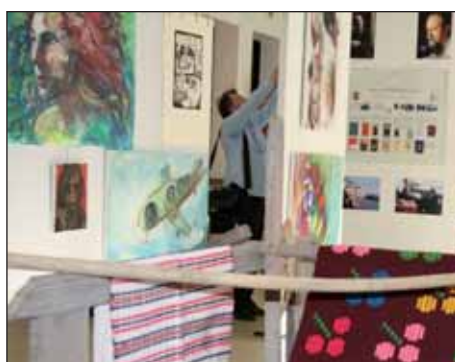
Treći Dan Santovaca