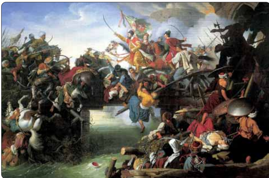
Johann Peter Kraff: Proboj Zrinskog iz Sigeta

Matica hrvatska i Društvo hrvatskih književnika pripremaju nekoliko izdavačkih projekata – knjigu hrvatskih epskih i lirskih knji-