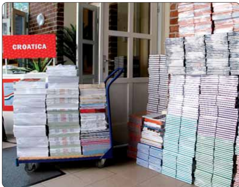
Redaju se udžbenici.

dotatno osamdeset naslova na Croaticinu popisu udžbenika. Proširit će se i broj narodnosnih novina koje se tiskaju u našoj izdavačkoj kući, naime u tijeku su pregovori s ukrajinskom, poljskom i rusinskom manjinom. U lijepom se broju naručuje Hrvatsko-mađarski rječnik, što se za druge naslove i ne može reći, naime ona slabo se kupuju.