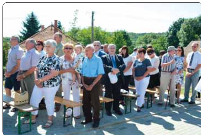
Dio vjernikov na crikvenom obredu

hrvatskom kulturnom programu nastupili su jačkarni zbor „Sv. Cecilija“ iz Sambotela, mišoviti pjevački zbor „Zviranjak“ iz Prisike, jačkarice „Peruške Marije“ iz Hrvatskoga Židana i HKD „Čakavci“ s tamburaši iz Hrvatskoga Židana.