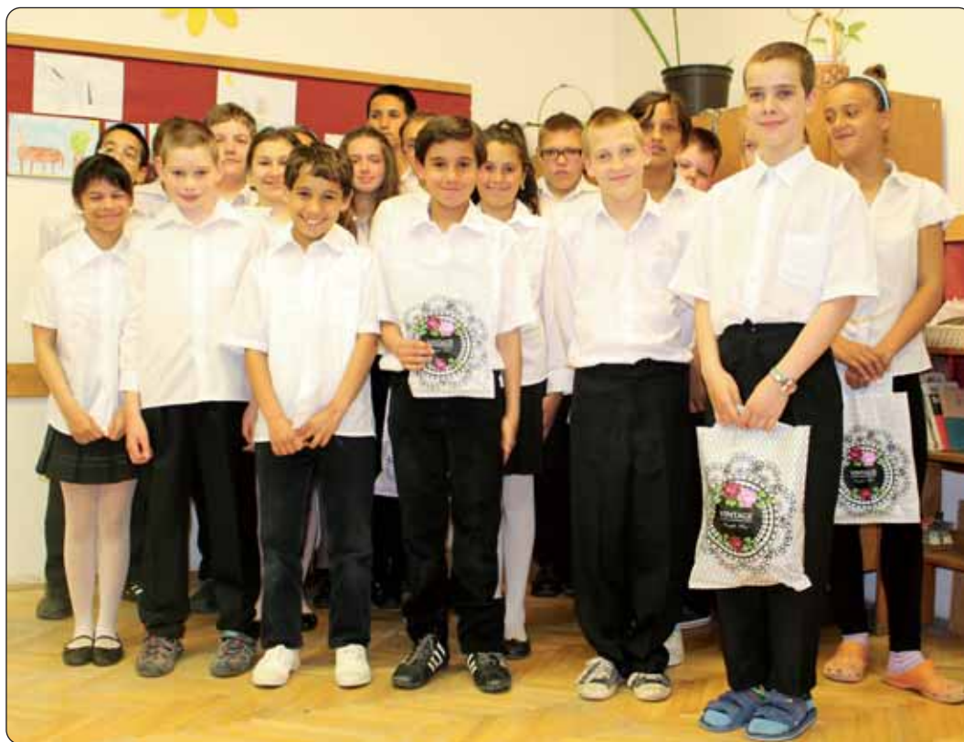
Prva kategorija – učenici specijalnog odgoja

Redovito školsko natjecanje u kazivanju stihova na hrvatskom jeziku održano je i ove godine u harkanjskoj Osnovnoj i glazbenoj školi „Pál Kitaibel”, 2. svibnja. U spomenutoj obrazovnoj ustanovi nastavu hrvatskoga jezika, uglavnom u satnici stranog jezika (tri sata tjedno), osim u jednom razredu, od 5. do 8. razreda pohađa četrdesetak učenika. Osjetan je to pad u odnosu na nekoliko godina prije. Naime, po slovu zakona od prvoga razreda tek se jedan jezik može učiti u satnici stranog jezika, a nema dovoljno interesa za pokretanje narodnosne skupine za učenje hrvatskoga jezika i književnosti, kaže ravnatelj škole József Kiss Levente.