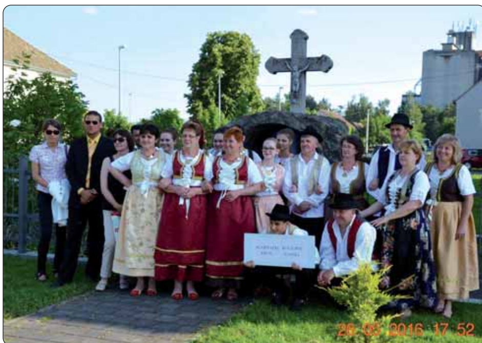
KUD «Bunjevački kulturni krug»