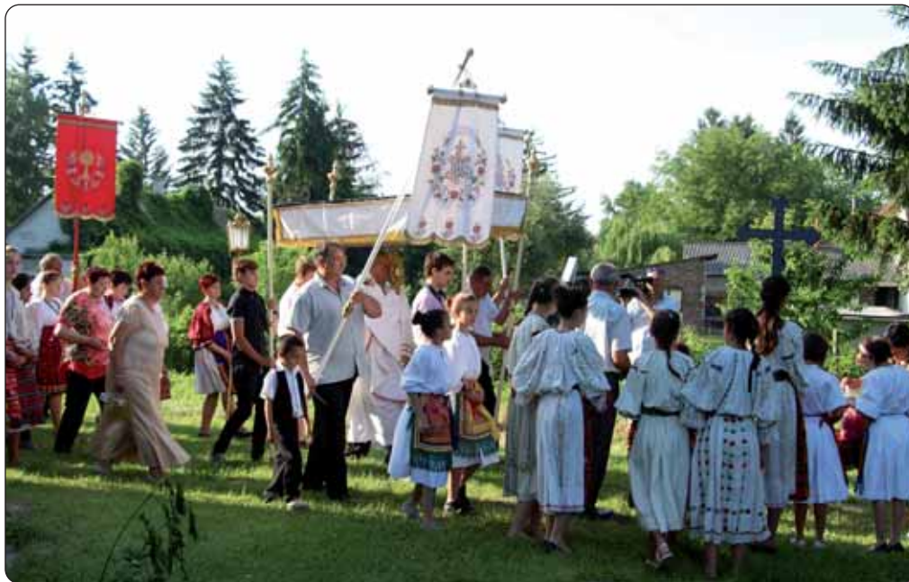
Tijelovska ophodnja u Lukovišću