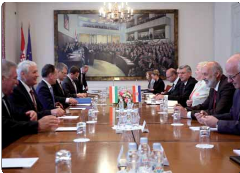
Dvostrani razgovori u Hrvatskom saboru