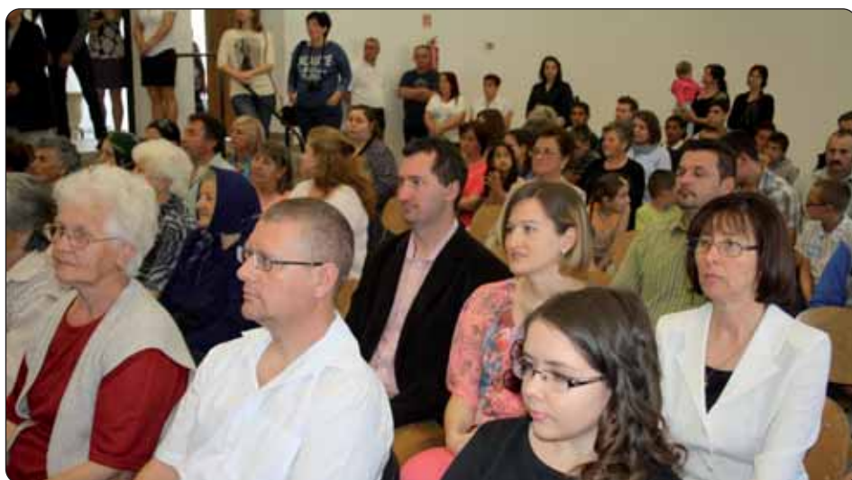
Brojna publika, djelatnici škole, roditelji...

utemeljenje santovačke Hrvatske škole. Prema njegovim riječima, školstvo kao odgojno-obrazovni sustav uključuje sve one ustanove koje su još potrebne da bi škole uopće funkcionirale, upravu, različite agencije i drugo. Posebno se posvetio odnosu vlasti i školstva jer, kako reče, školstvo je jedno od glavnih pitanja svake vlasti. Tako je bilo nekad, tako je i danas. Osvrnuo se na početke organiziranoga školstva 1945./1946. i na utemeljenje prvih hrvatskih škola u Mađarskoj, napose na utemeljenje učiteljske škole i gimnazije u Pečuhu, odnosno Budimpešti, te na prve tečajeve za pomoćne učitelje koji su počeli raditi u našim naseljima. Glede sadašnjice i budućnosti hrvatskoga školstva istaknuo je koliko je važno da održavanje škola bude u našim rukama. Kao primjer može nam poslužiti preuzimanje santovačke Hrvatske škole 2000. godine, a pečuške hrvatske škole 2012. godine, jer one su u našem vlasništvu. Premda su dio mađarskoga školskog sustava, one su u našem vlasništvu i pod našim upravljanjem.