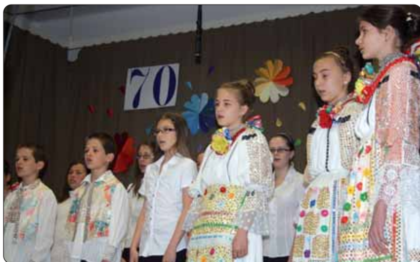
Proslava u znaku broja 70

Pjevački zbor, folklorna skupina i tamburaški orkestar škole u prigodnome kulturnom programu izveli su splet hrvatskih plesova, pjesama, dječjih igara i prigodne stihove. Svečanost je uljepšana i postavljanjem prigodne izložbe iz prošlosti santovačke škole, od utemeljenja do danas. Svečanost je završena domjenkom za uzvanike i goste.