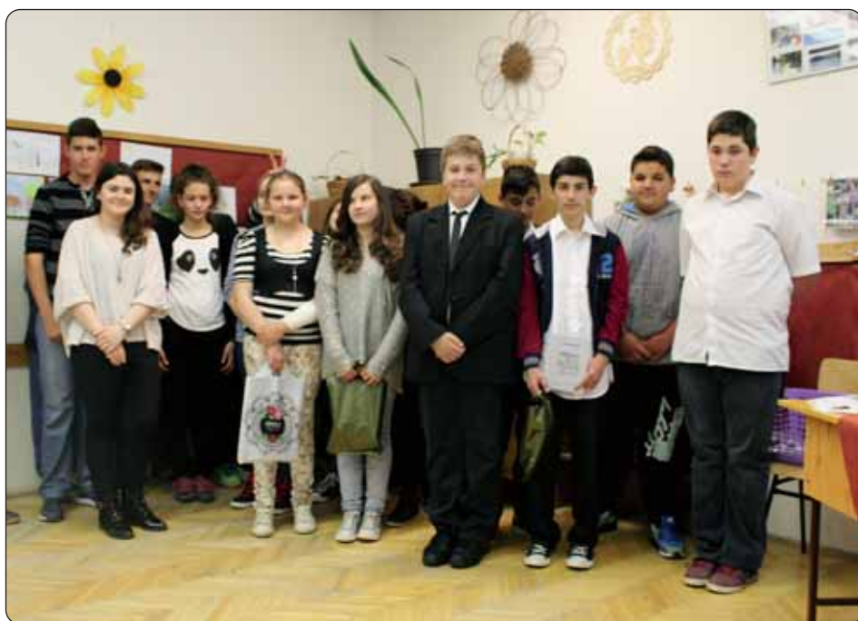
Sudionici i pobjednici 2. i 3. kategorije natjecanja