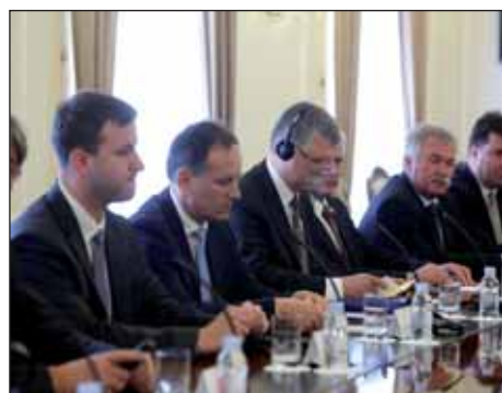
László Kövér u Hrvatskoj