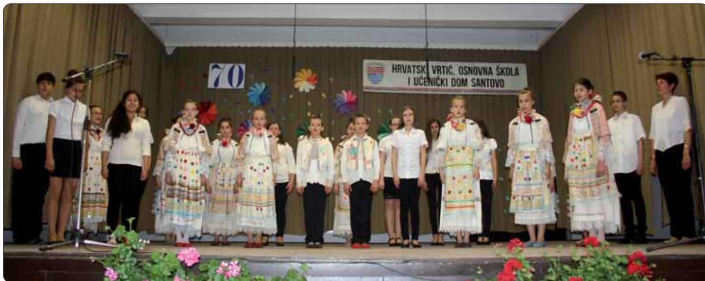
Dio programa učenika santovačke škole

utemeljenje santovačke Hrvatske škole. Prema njegovim riječima, školstvo kao odgojno-obrazovni sustav uključuje sve one ustanove koje su još potrebne da bi škole uopće funkcionirale, upravu, različite agencije i drugo. Posebno se posvetio odnosu vlasti i školstva jer, kako reče, školstvo je jedno od glavnih pitanja svake vlasti. Tako je bilo nekad, tako je i danas. Osvrnuo se na početke organiziranoga školstva 1945./1946. i na utemeljenje prvih hrvatskih škola u Mađarskoj, napose na utemeljenje učiteljske škole i gimnazije u Pečuhu, odnosno Budimpešti, te na prve tečajeve za pomoćne učitelje koji su počeli raditi u našim naseljima. Glede sadašnjice i budućnosti hrvatskoga školstva istaknuo je koliko je važno da održavanje škola bude u našim rukama. Kao primjer može nam poslužiti preuzimanje santovačke Hrvatske škole 2000. godine, a pečuške hrvatske škole 2012. godine, jer one su u našem vlasništvu. Premda su dio mađarskoga školskog sustava, one su u našem vlasništvu i pod našim upravljanjem.