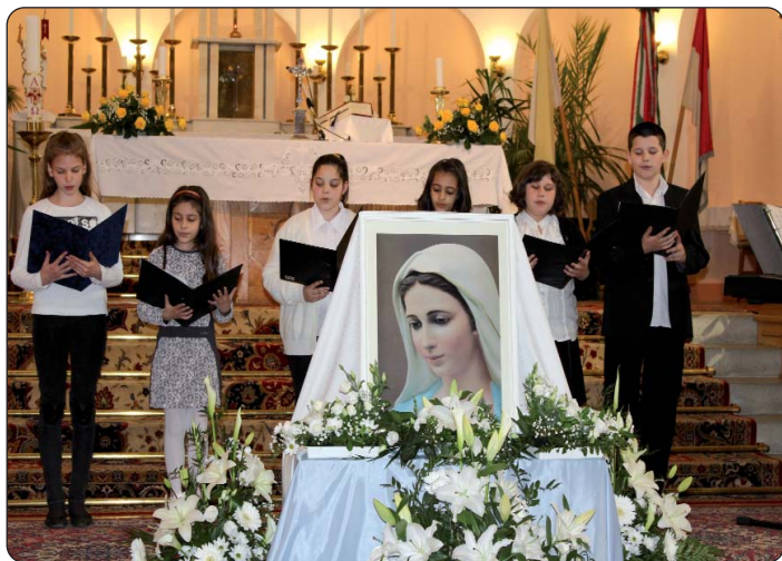
Keresturska djeca pjevaju „Zdravo, Marijo”

Hrvati su veliki štovatelji Blažene Djevice Marije, nije slučajno da je u pjesmi zovu „kraljicom Hrvata”. Brojne crkvene pjesme koje se i danas rado pjevaju vežu se uz nju. Još na poticaj pokojnog rektora varaždinske katedrale mons. Blaža Horvata ustrojen je prvi Susret „Pozdravljamo Mariju”, naime pomurski Hrvati imaju svoje marijansko svetište blizu Kaniže, u Komaru. Iz godine u godinu pomurski hrvatski zborovi pripremaju se na Susret, uče nove marijanske pjesme, a u zadnje vrijeme u slavlje se uključuju i mladi vjernici. Susret je započeo s hrvatskim misnim slavljem, prečasn Antun Hobljaj pozdravio je pomurske vjernike i prisjetio se mons. Blaža Horvata, koji je godinama pomagao pomurskoj hrvatskoj vjerskoj zajednici. Četvrte uskrсне nedjelje preč. Hobljaj u svojoj propovijedi usmjeravao je vjernike na to da je Isus položio svoj život za sve nas, i njegova ljubav znači isto za svakoga, na svim jezicima, i podjednako je jaka svugdje ma gdje bili. Neka njegovu ljubav vjernici uzvrate svojom ljubavlju u molitvi