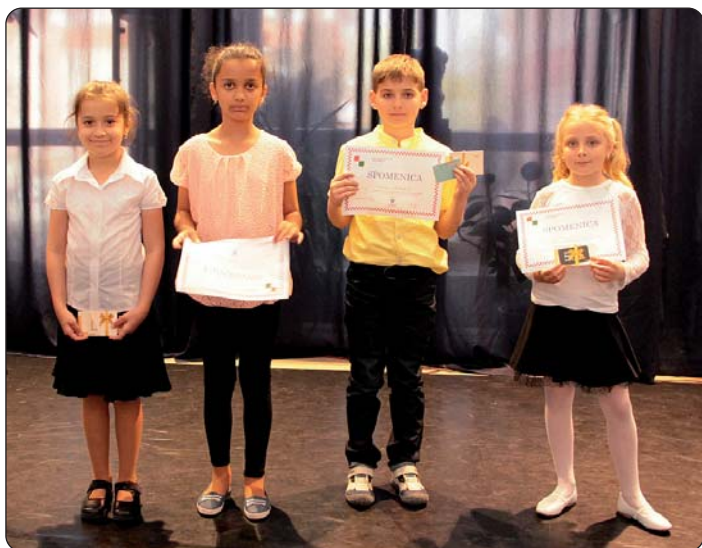
Dio najboljih u kategoriji niži razredi škola s predmetnom nastavom