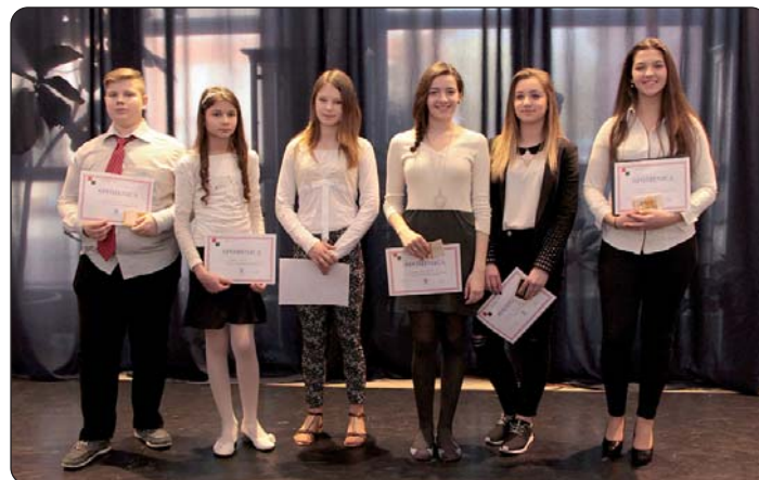
Najbolji u kategoriji viši razredi dvojezičnih škola