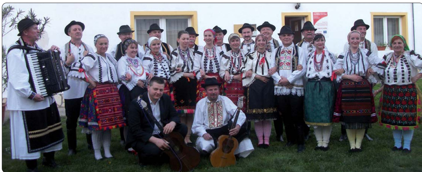
KUD Ladislava Matuška nastupio je na ovogodišnjem Narodnosnom danu.